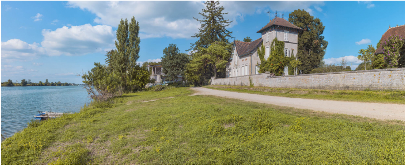
La villa "Beau Rivage" au port d'Ormes.