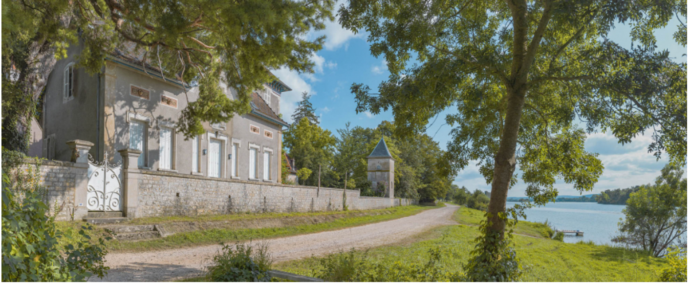
La villa "Beau Rivage" et le port d'Ormes, rive gauche.

71, Ormes rue du Port, lieu-dit : PK 120