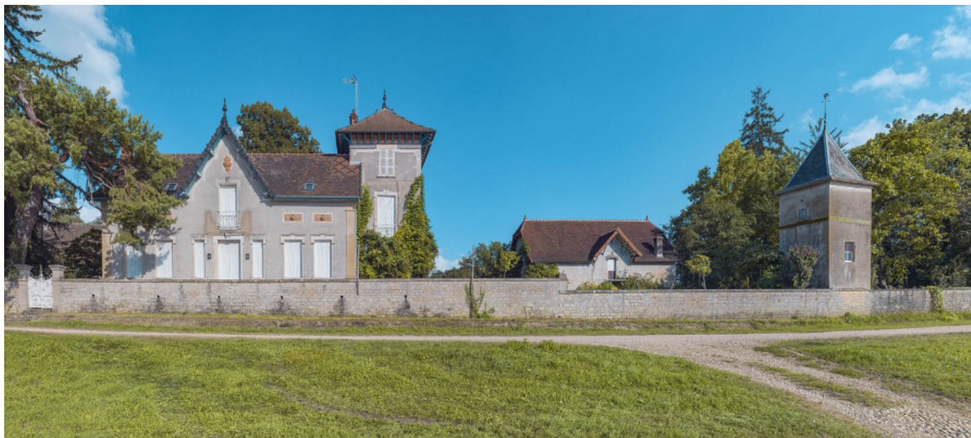
La villa "Beau Rivage" au port d'Ormes.