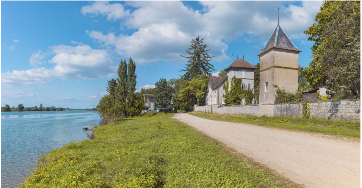
La villa "Beau Rivage" au port d'Ormes.