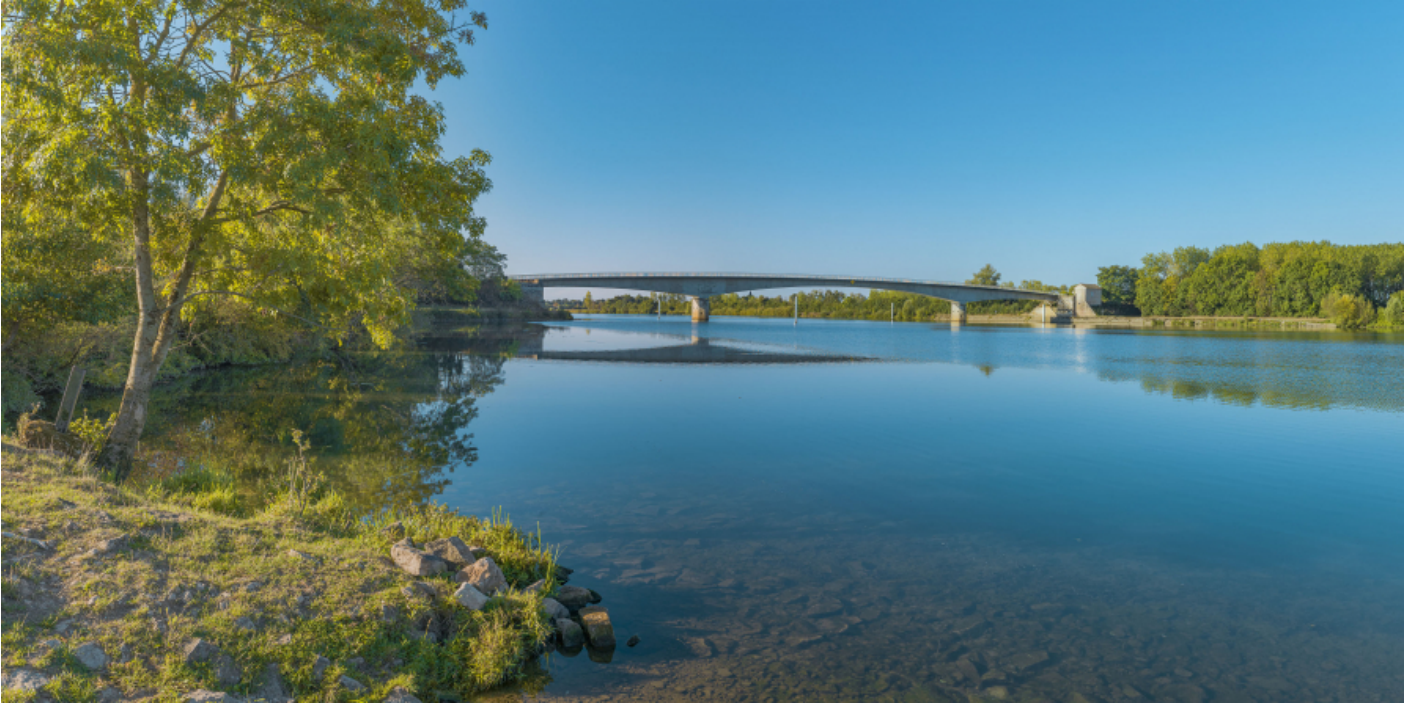
Vue d'ensemble du pont de Thorey depuis la rive gauche.