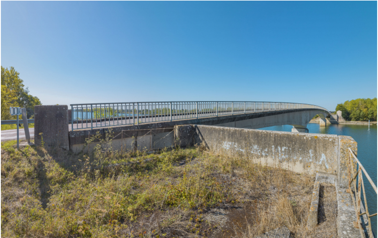
Vue d'ensemble du pont de Thorey depuis la culée de la rive gauche.