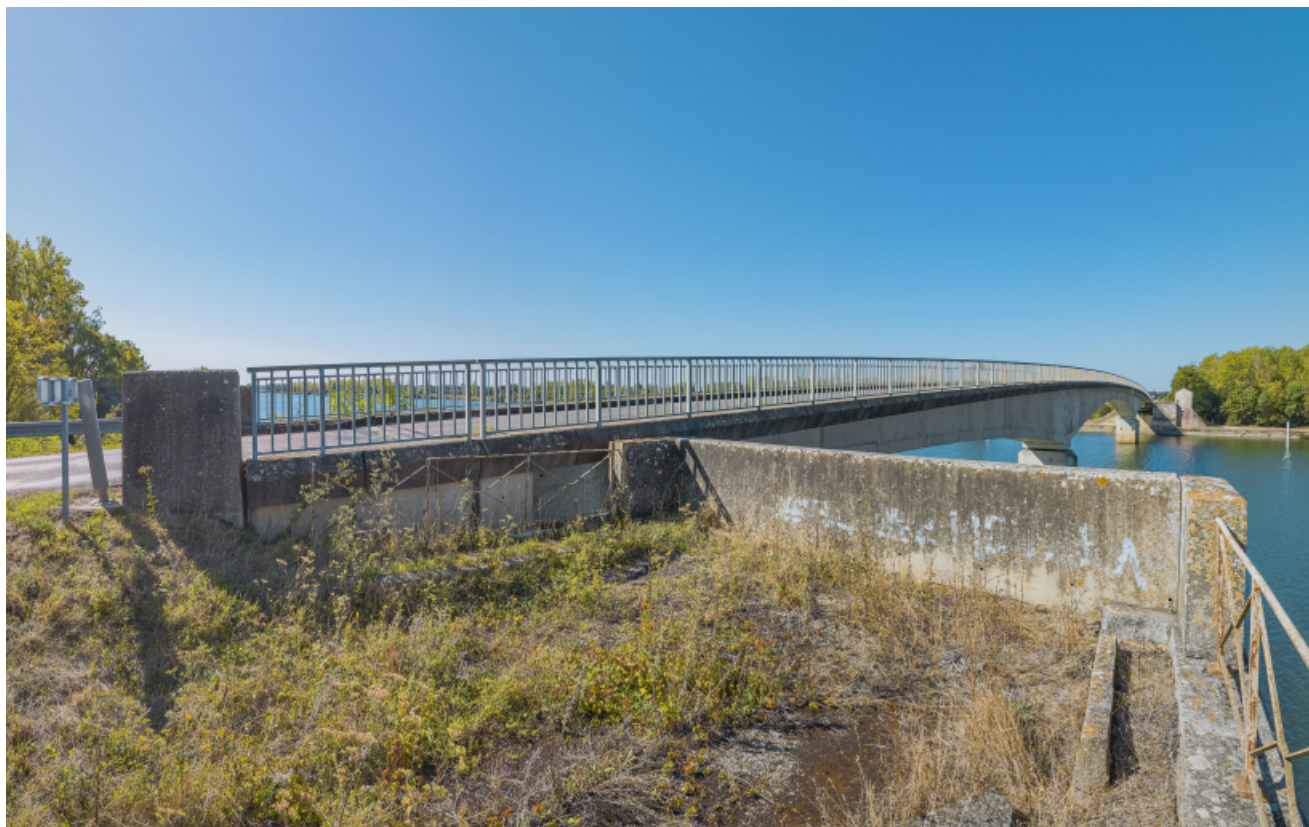
Vue d'ensemble du pont de Thorey depuis la culée de la rive gauche.