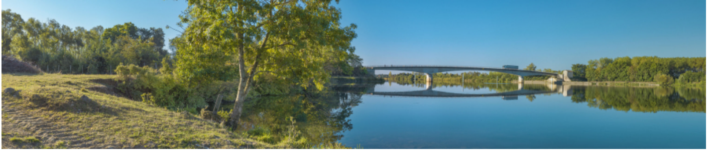
Vue d'ensemble du pont de Thorey depuis la rive gauche.