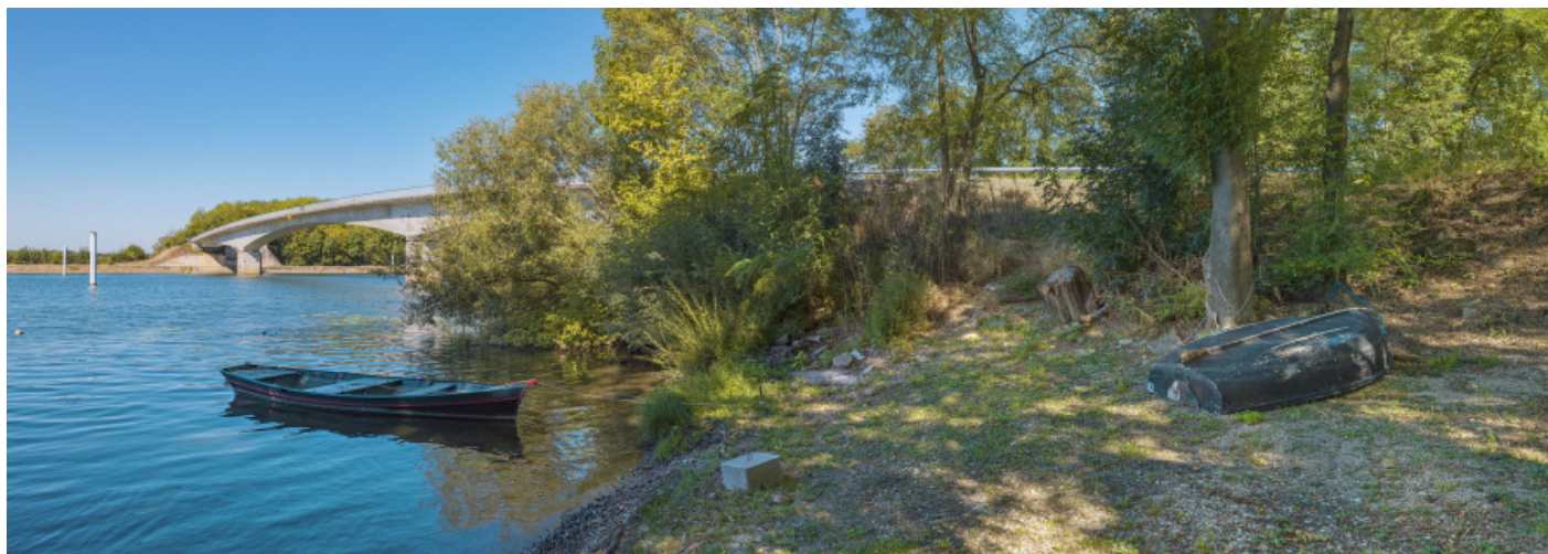
Vue d'ensemble du pont de Thorey, rive gauche, d'aval.