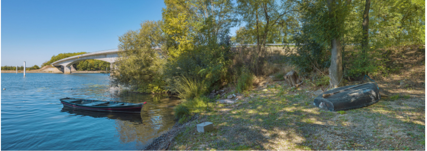
Vue d'ensemble du pont de Thorey, rive gauche, d'aval.