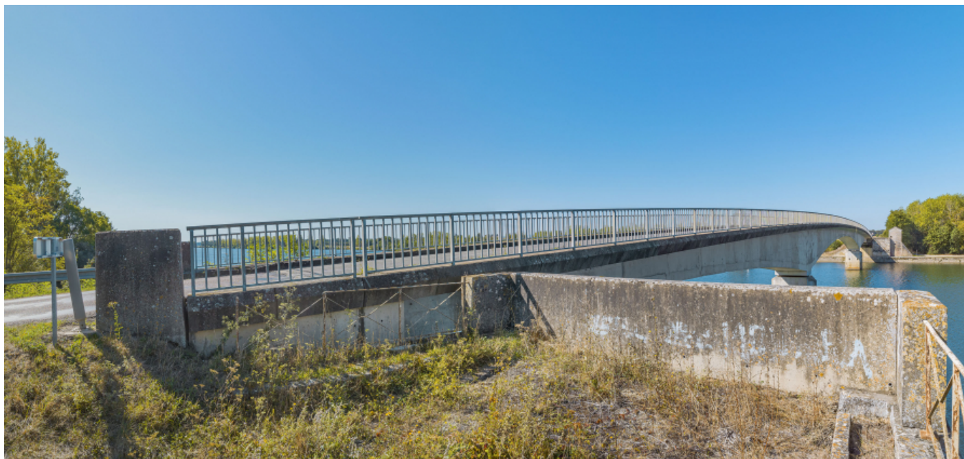
Vue d'ensemble du pont de Thorey depuis la culée de la rive gauche.