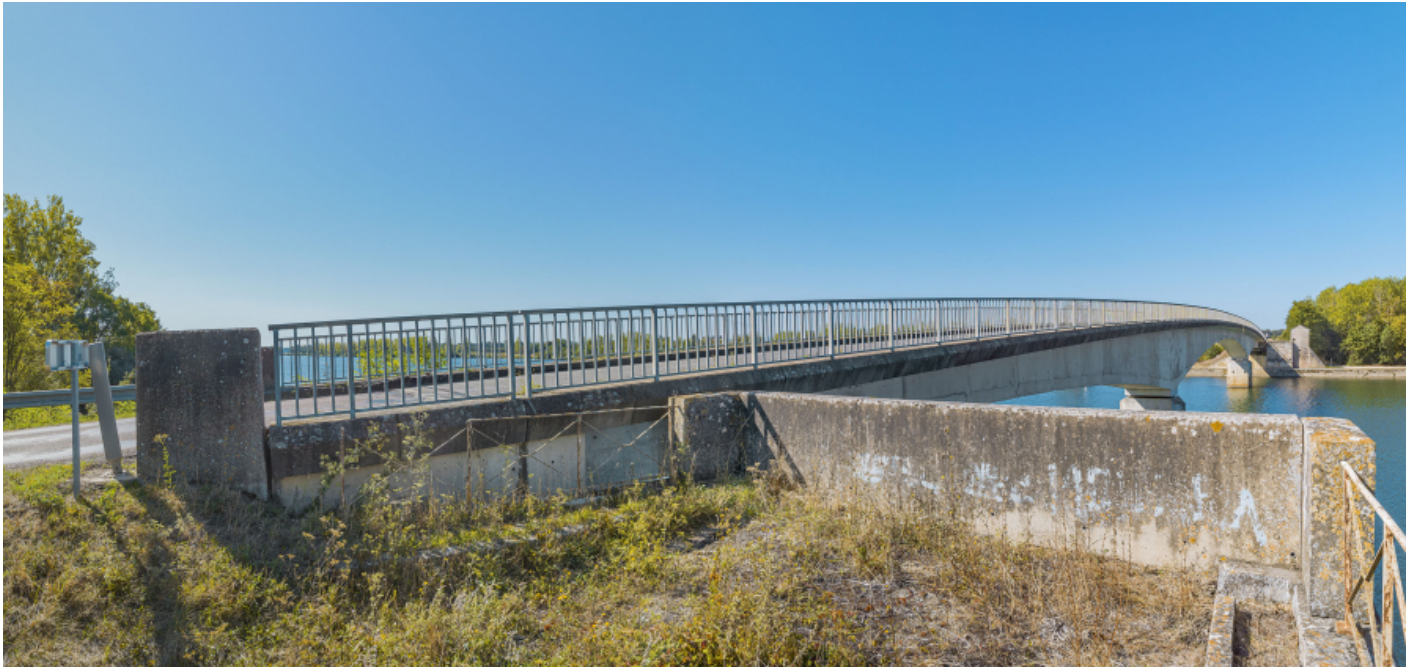
Vue d'ensemble du pont de Thorey depuis la culée de la rive gauche.