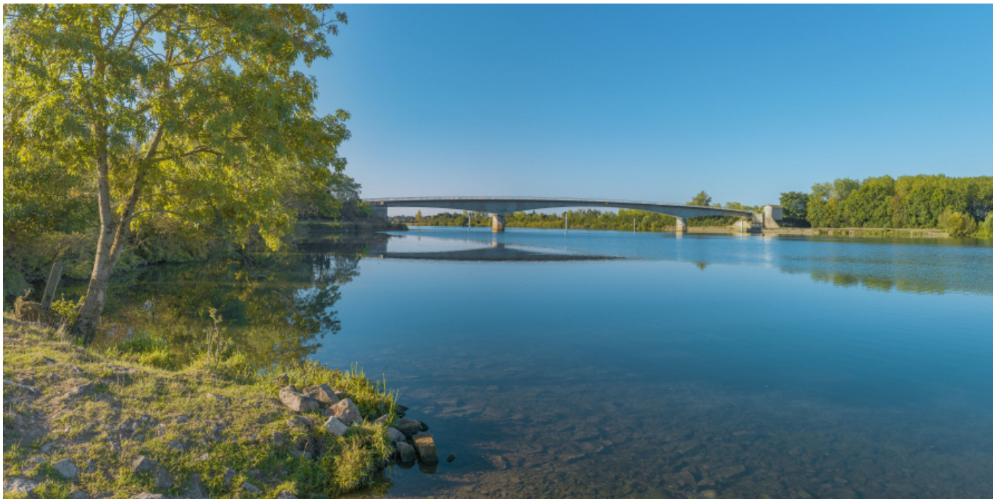
Vue d'ensemble du pont de Thorey depuis la rive gauche.