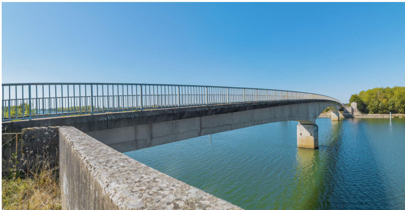
Vue d'ensemble du pont de Thorey depuis la culée de la rive gauche.