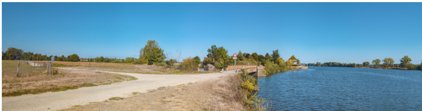
Le pont sur la Grosne et le port de Grosne, vus d'aval.