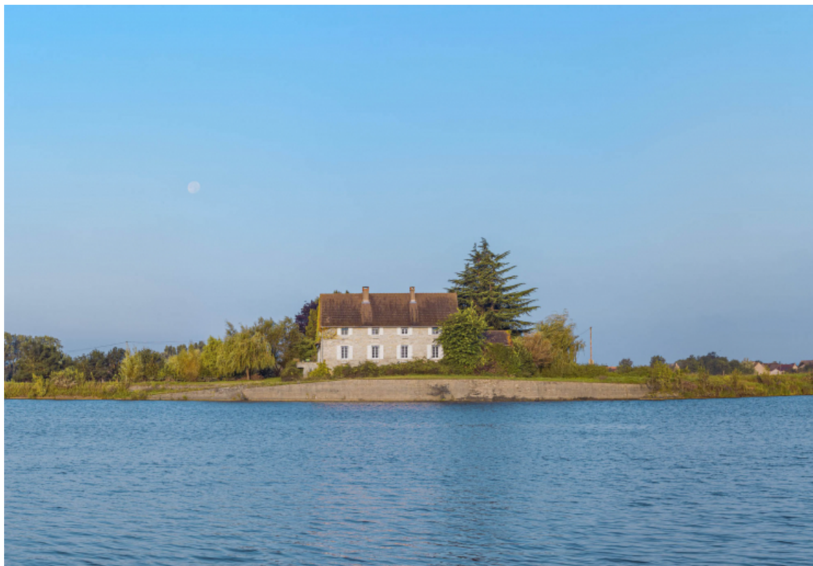
Le port de Grosne, vu depuis la rive gauche.