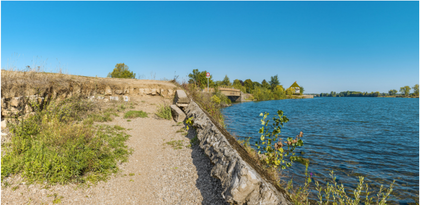
Le pont sur la Grosne et le port de Grosne depuis les perrés aval.