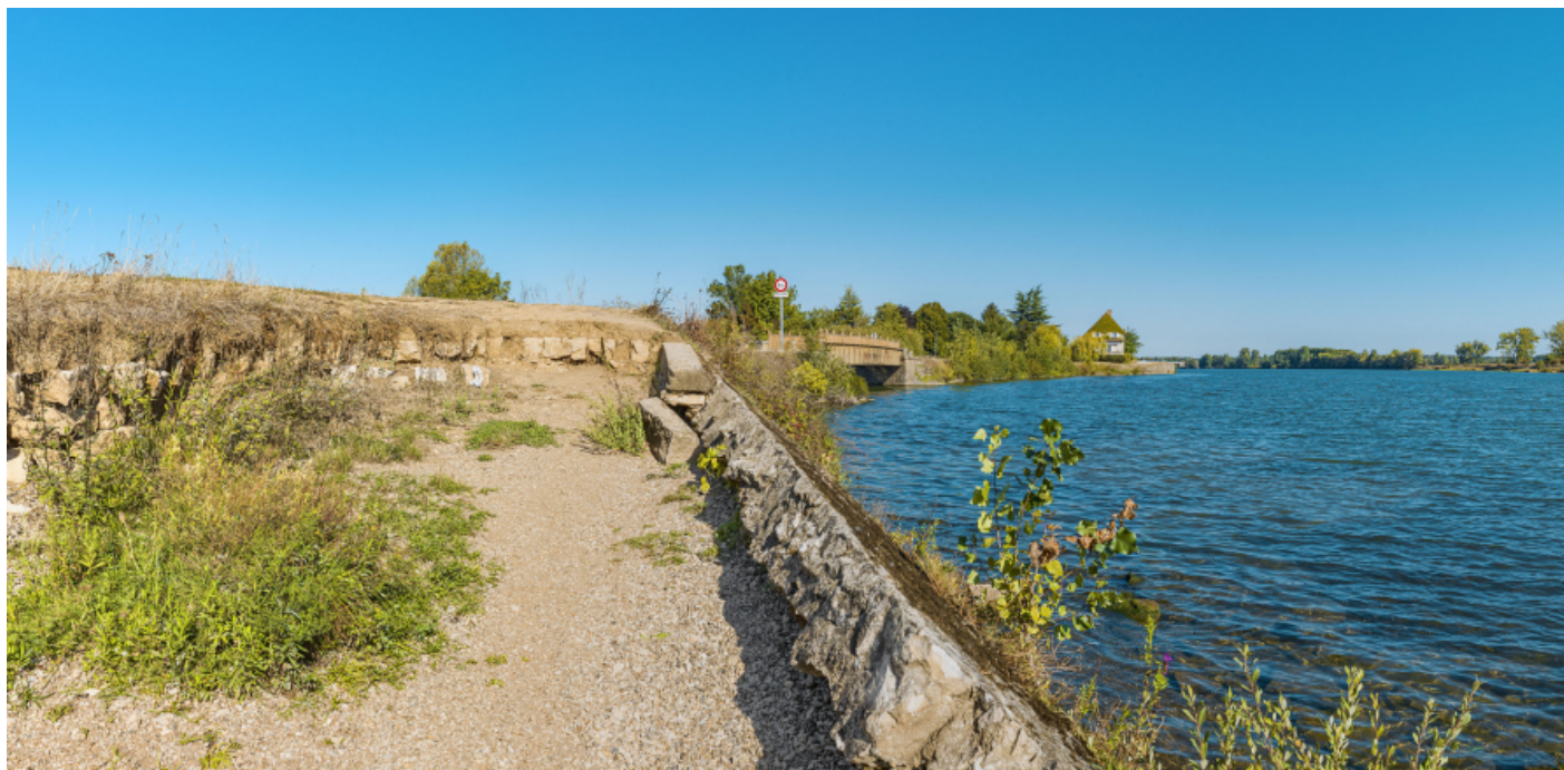
Le pont sur la Grosne et le port de Grosne depuis les perrés aval.