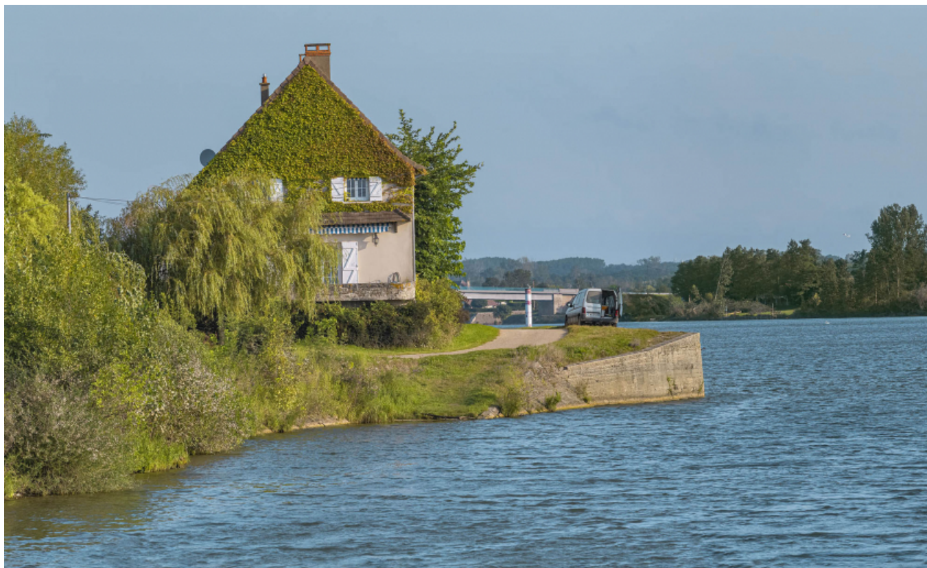
Le port de Grosne. En arrière-plan, le pont d'Ouroux.