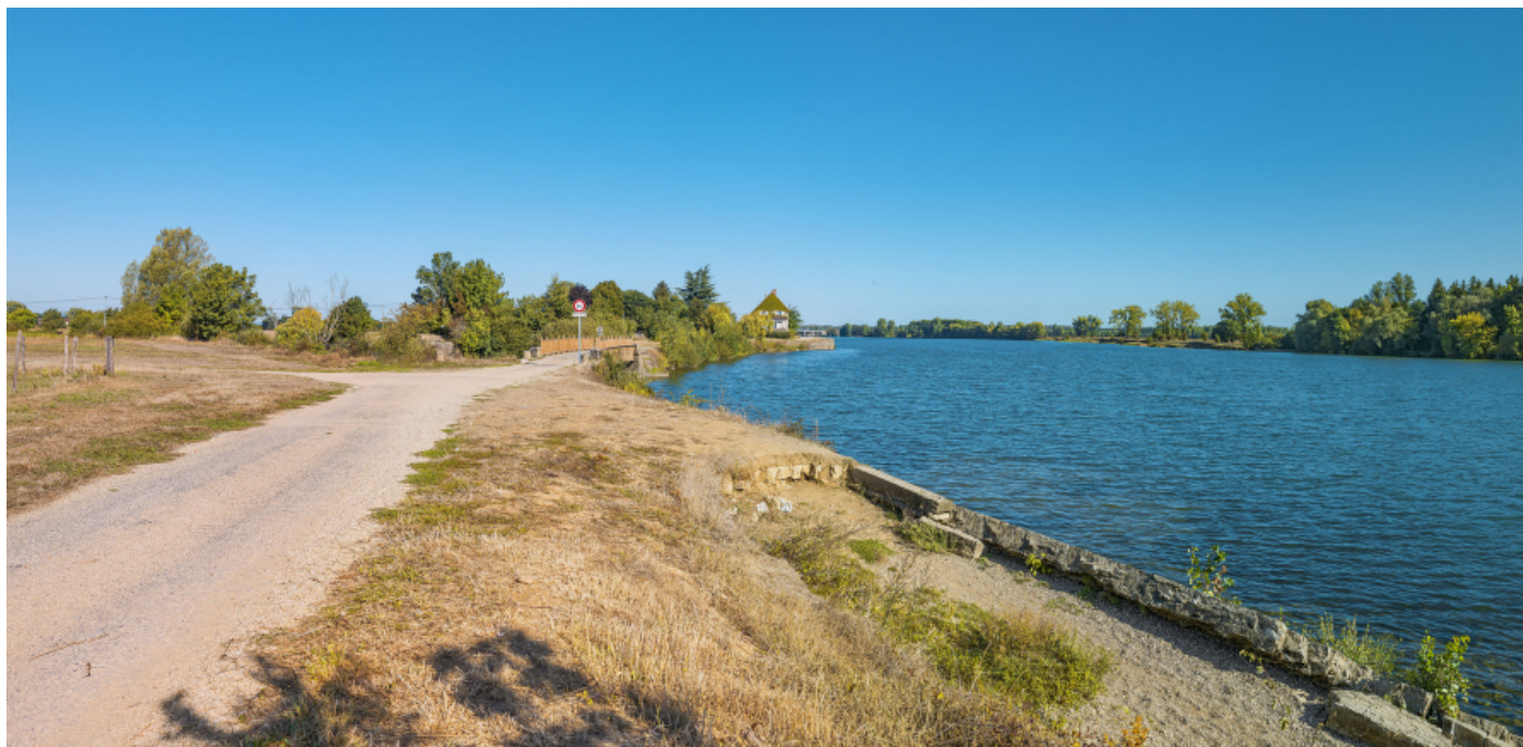
Le pont sur la Grosne et le port de Grosne depuis les perrés aval.