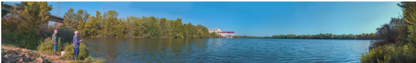
Vue d'ensemble de la darse nord, depuis le pont séparant les deux darses.