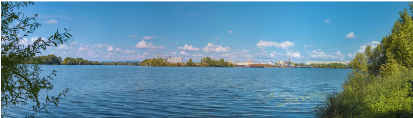
La darse sud et la Saône depuis l'aval.