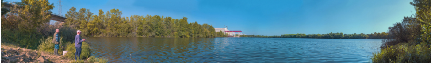
Vue d'ensemble de la darse nord, depuis le pont séparant les deux darses. 71, Saint-Marcel, lieudit : PK 137