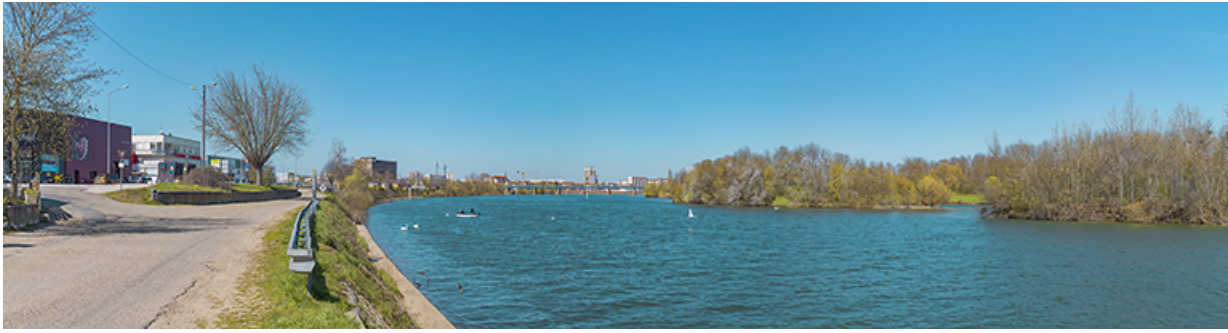
L'amont du quai avec en arrière-plan, le viaduc des Dombes. À droite, les îles de Benne-la-Faux dans la Saône. 71, Saint-Rémy quai Bellevue