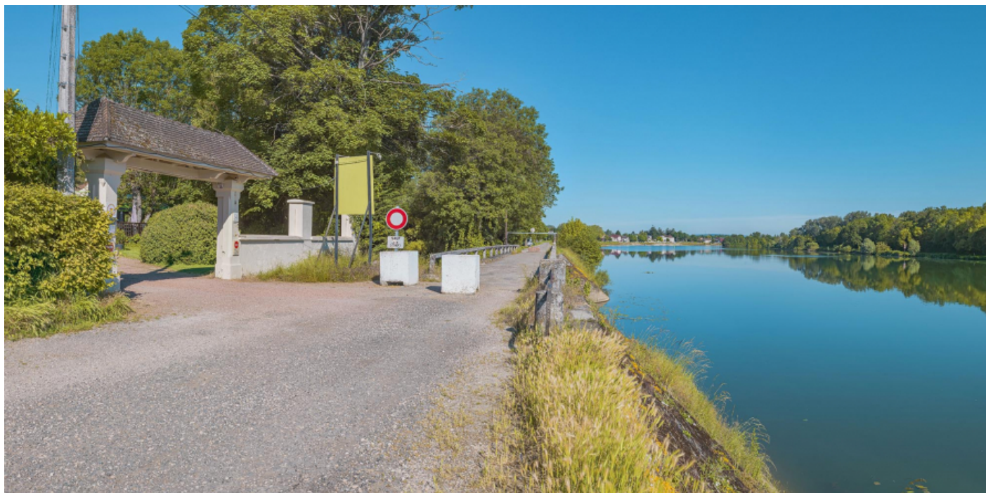
Extrémité aval du quai avec le pont sur la Roie de Droux.