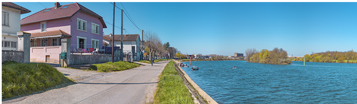
Le quai avec la rampe de mise à l'eau et ses perrés.