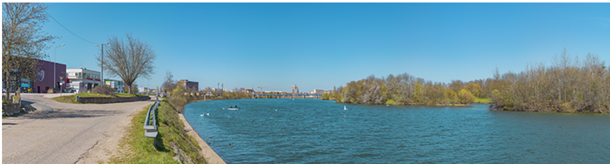
L'amont du quai avec en arrière-plan, le viaduc des Dombes. À droite, les îles de Benne-la-Faux dans la Saône. 71, Saint-Rémy quai Bellevue