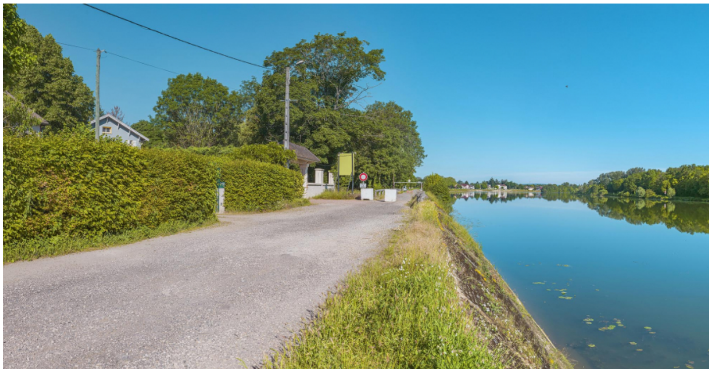
Extrémité aval du quai avec le pont sur la Roie de Droux.