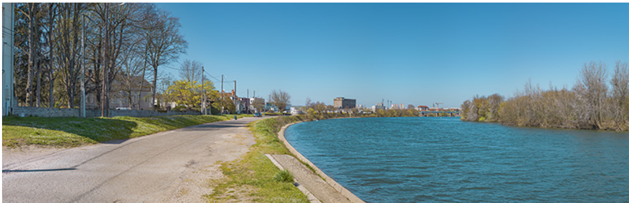
Les perrés du quai, avec en arrière-plan, le viaduc des Dombes.