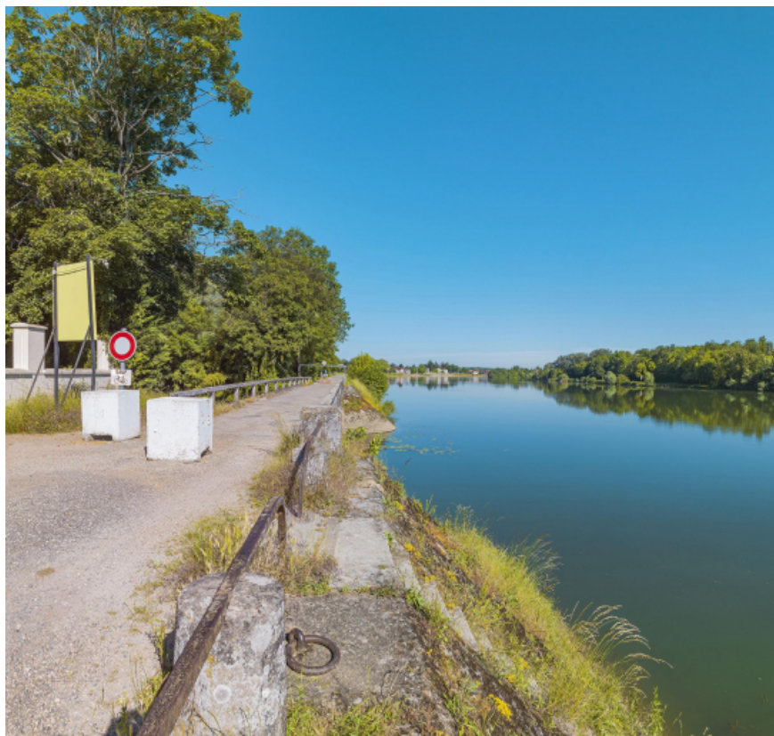
Extrémité aval du quai avec le pont sur la Roie de Droux.