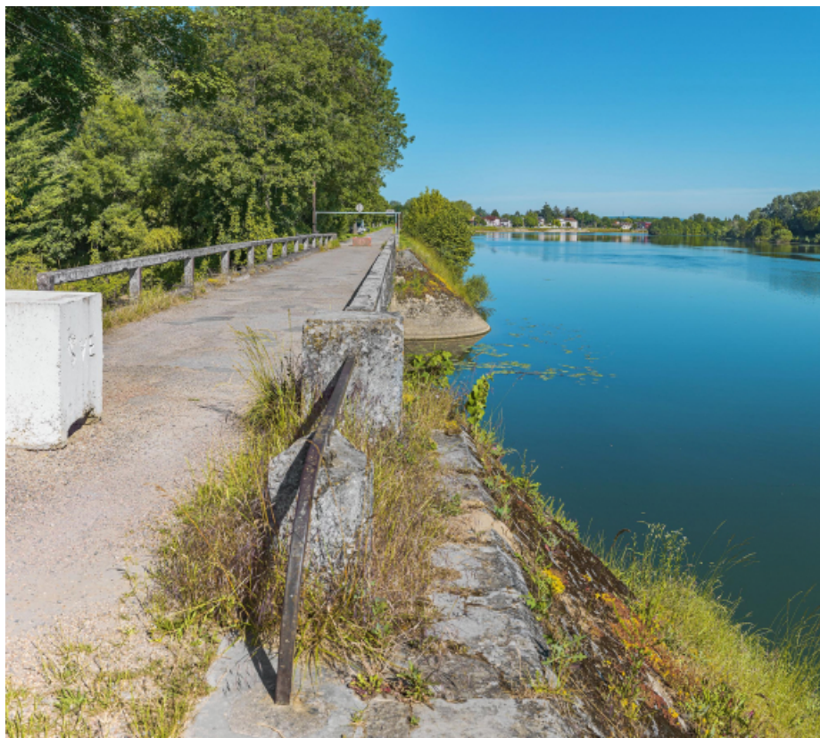
Pont sur la Roie de Droux.