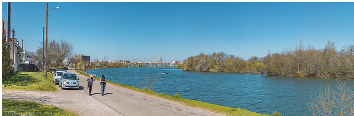
L'amont du quai avec en arrière-plan, le viaduc des Dombes. À droite, les îles de Benne-la-Faux dans la Saône. 71, Saint-Rémy quai Bellevue