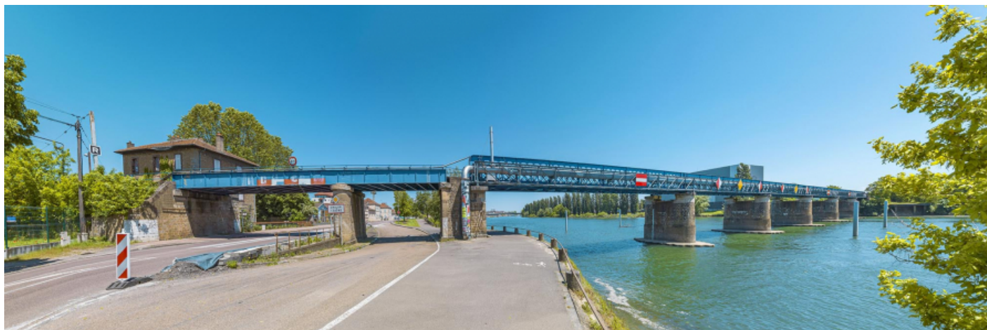
Le viaduc des Dombes : vu d'aval, rive droite.

71, Chalon-sur-Saône, lieudit : PK 140,6