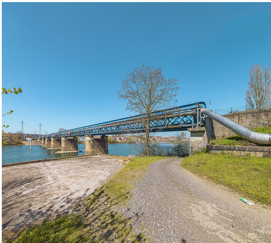
Vue d'ensemble du pont, depuis la rive gauche.

71, Chalon-sur-Saône, lieudit : PK 140,6