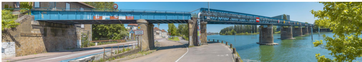
Le viaduc des Dombes : vu d'aval, rive droite.

71, Chalon-sur-Saône, lieudit : PK 140,6