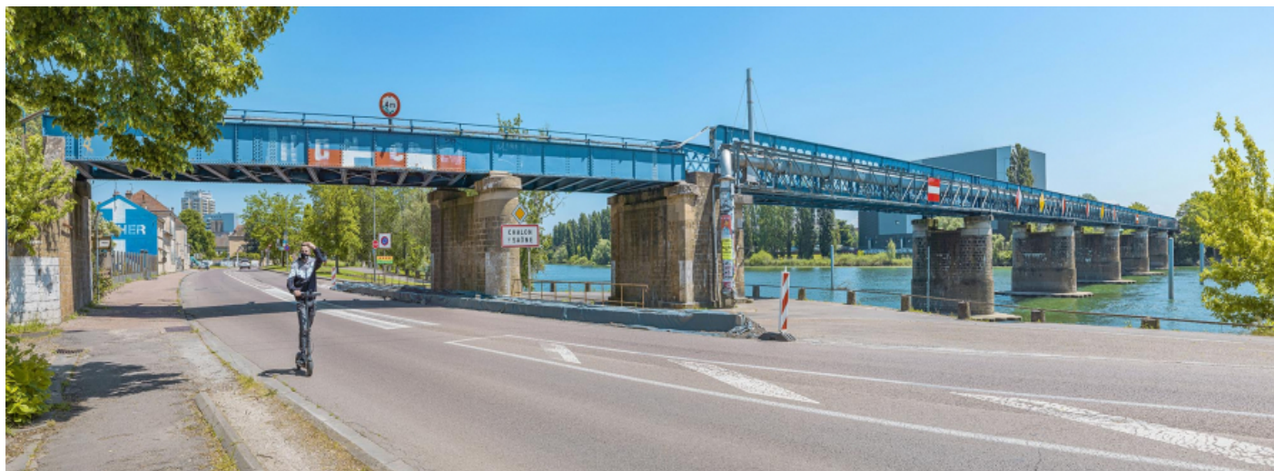
Le viaduc des Dombes : vu d'aval, rive droite.

71, Chalon-sur-Saône, lieudit : PK 140,6