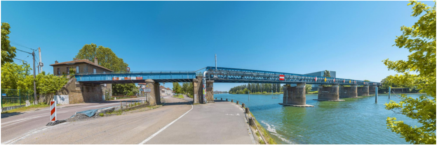
Le viaduc des Dombes : vu d'aval, rive droite.

71, Chalon-sur-Saône, lieudit : PK 140,6