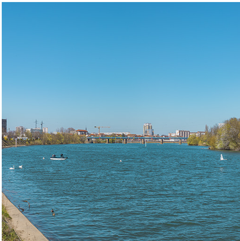
Vue d'ensemble du pont, depuis l'aval.

71, Chalon-sur-Saône, lieudit : PK 140,6