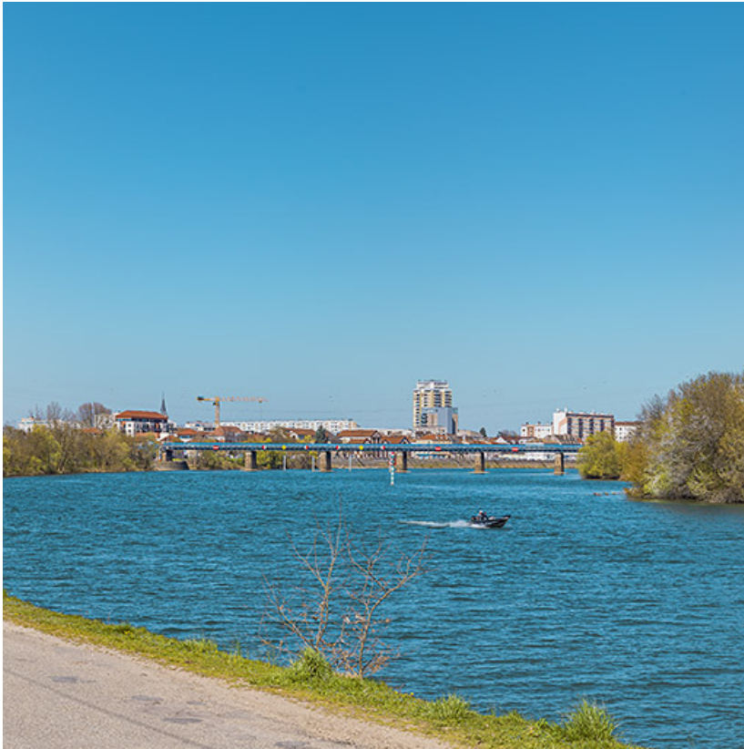
Vue d'ensemble du pont, depuis l'aval.

71, Chalon-sur-Saône, lieudit : PK 140,6