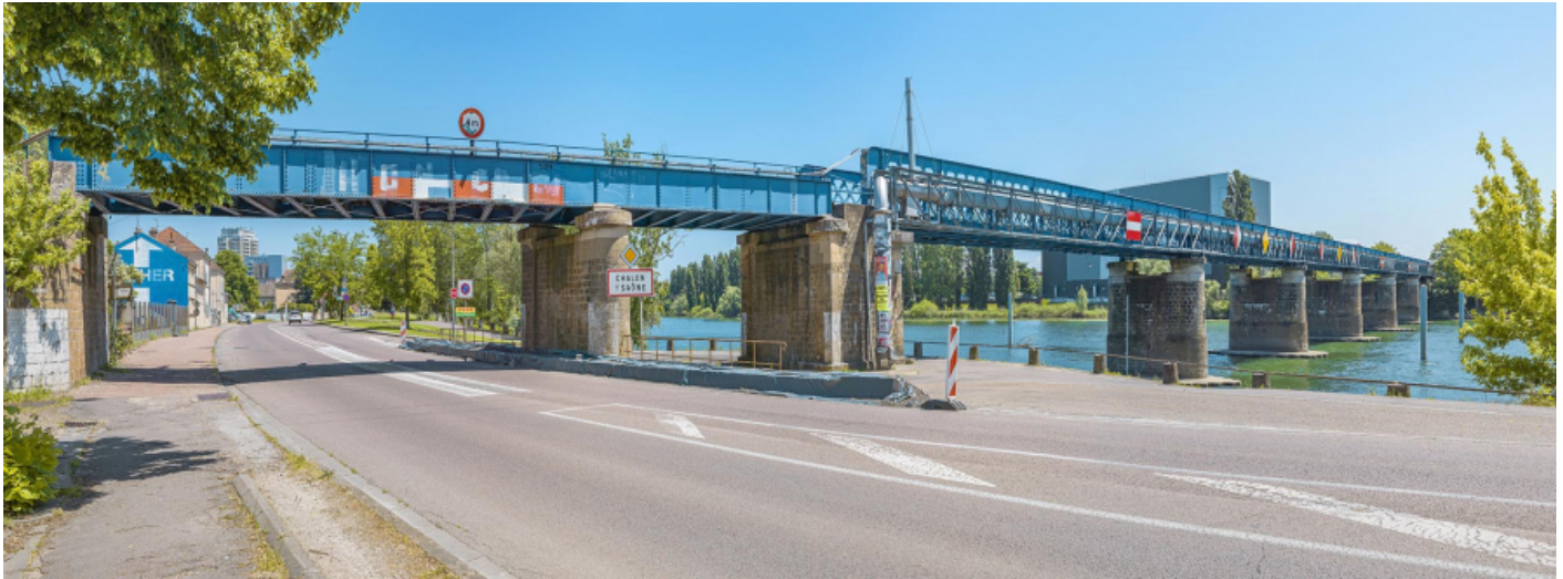
Le viaduc des Dombes : vu d'aval, rive droite. 71, Chalon-sur-Saône, lieudit : PK 140,6