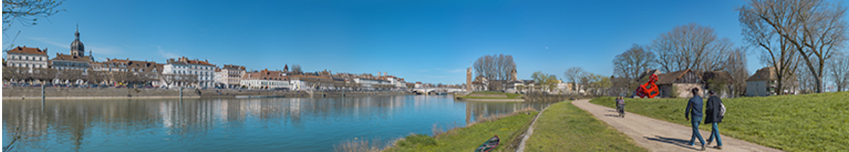
Vue d'ensemble des quais depuis la rive gauche.