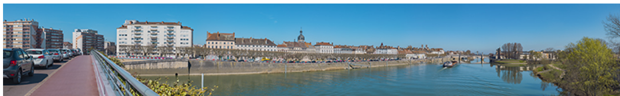
Vue d'ensemble des quais de Chalon entre le pont Saint-Laurent et le pont Jean-Richard : quai des Messageries et port Villiers, puis quai Gambetta.