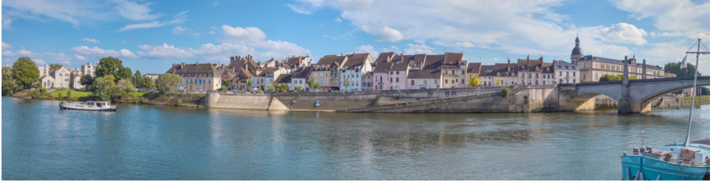
Le quai de la Monnaie vu depuis la rive opposée. A droite, le pont Saint-Laurent. 71, Chalon-sur-Saône quai de la Monnaie