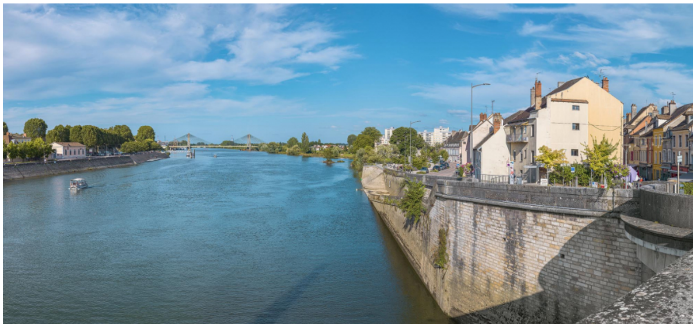
La quai de la Monnaie vu depuis le pont Saint-Laurent. En arrière-plan on distingue le pont de Bourgogne. 71, Chalon-sur-Saône quai de la Monnaie