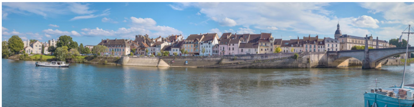
Le quai de la Monnaie vu depuis la rive opposée. A droite, le pont Saint-Laurent.