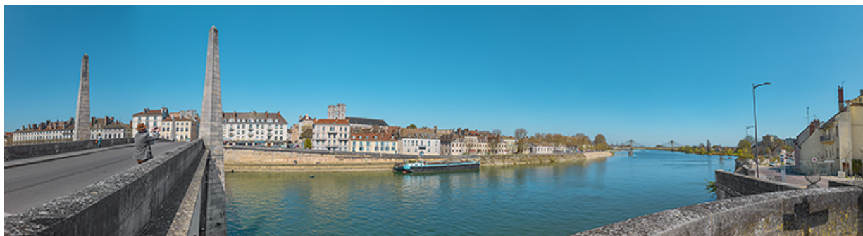
Le quai de la Poterne, dans la continuité du quai Sainte-Marie, vu depuis l'île Saint-Laurent. A gauche, le pont Saint-Laurent. 71, Chalon-sur-Saône quai de la Poterne