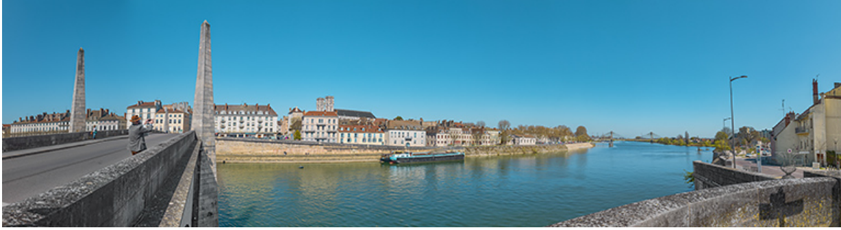
Le quai de la Poterne, dans la continuité du quai Sainte-Marie, vu depuis l'île Saint-Laurent. A gauche, le pont Saint-Laurent. 71, Chalon-sur-Saône quai de la Poterne