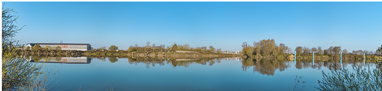
Le port nord et l'arrivée du canal du Centre dans la Saône.