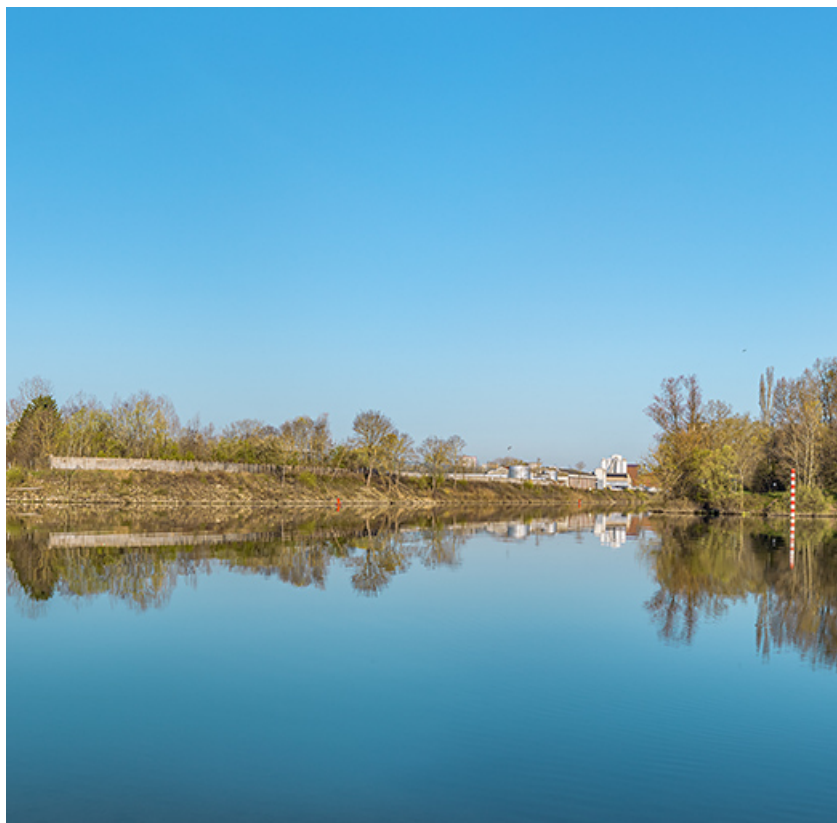
Le port nord et l'arrivée du canal du Centre dans la Saône.