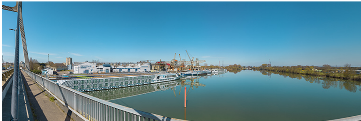
Le port nord vu depuis le pont de Bourgogne.