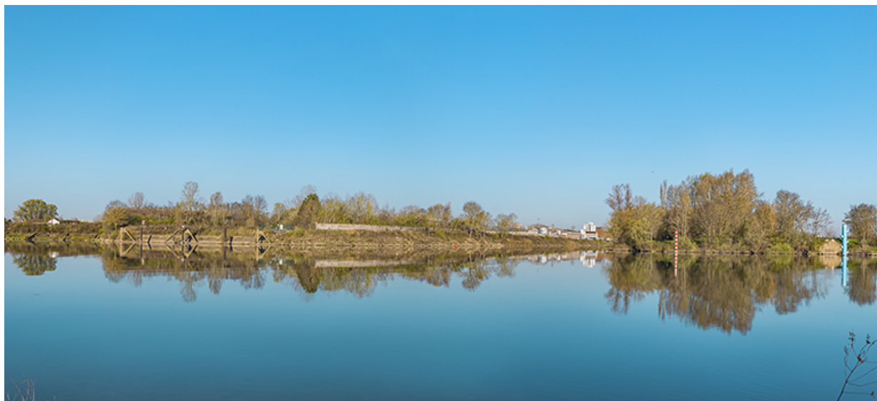
Le port nord et l'arrivée du canal du Centre dans la Saône.