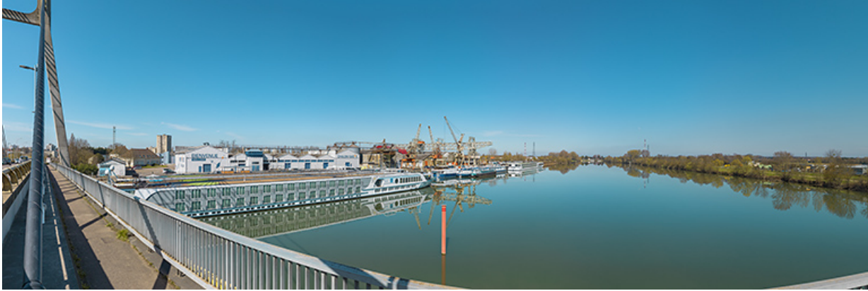
Le port nord vu depuis le pont de Bourgogne.