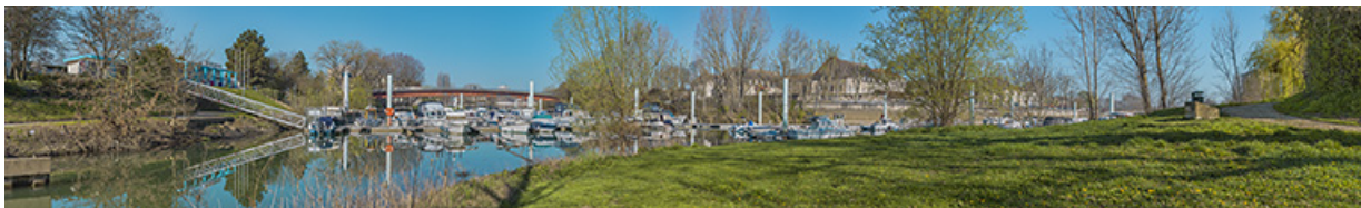
Vue d'ensemble du port de plaisance et de la passerelle.