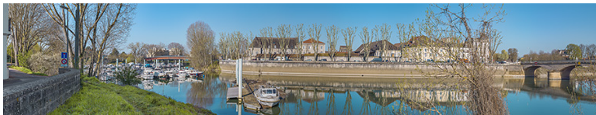
Vue d'ensemble du port de plaisance et des quais de l'île Saint-Laurent. A droite, le pont de la Génise. 71, Chalon-sur-Saône avenue de Verdun