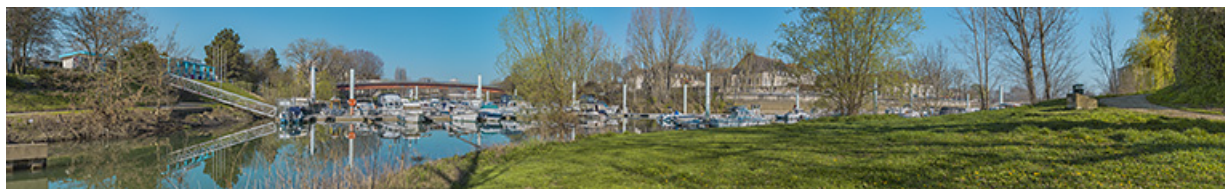
Vue d'ensemble du port de plaisance et de la passerelle.