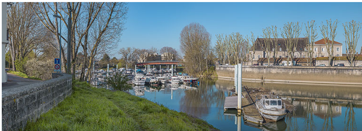
Vue d'ensemble du port de plaisance et de la passerelle.