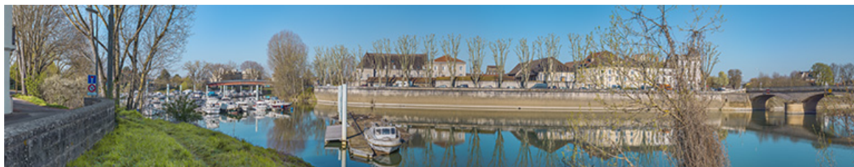
Vue d'ensemble du port de plaisance et des quais de l'île Saint-Laurent. A droite, le pont de la Génise. 71, Chalon-sur-Saône avenue de Verdun