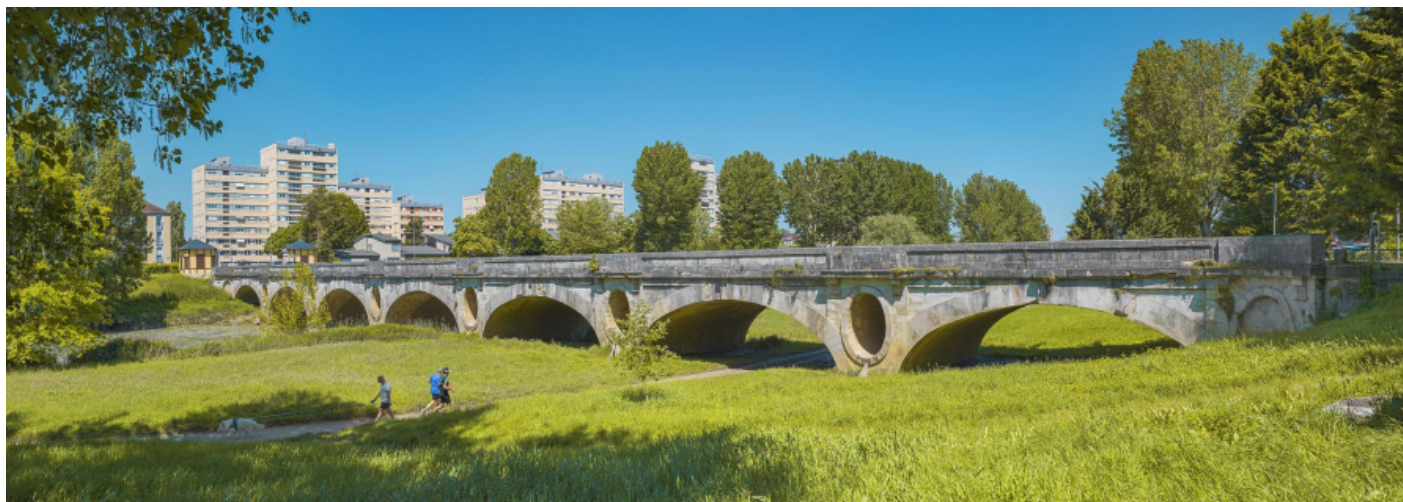
Le pont des Chavannes, vu d'aval.

71, Chalon-sur-Saône route départementale 19