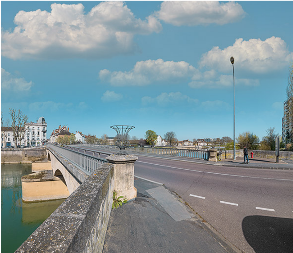
Vue d'ensemble du pont depuis la chaussée. 71, Chalon-sur-Saône rue de Strasbourg