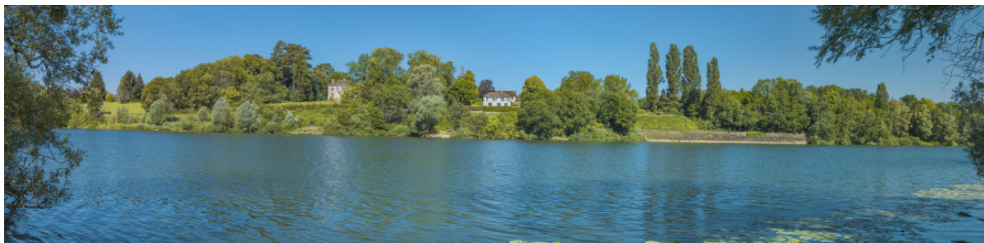
Vue d'ensemble de la banquette de halage et du mur de soutènement, depuis la rive gauche.