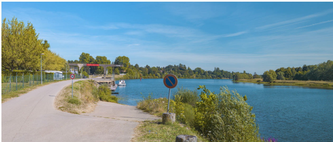
Vue d'ensemble du port de Gergy, depuis la rampe aval.