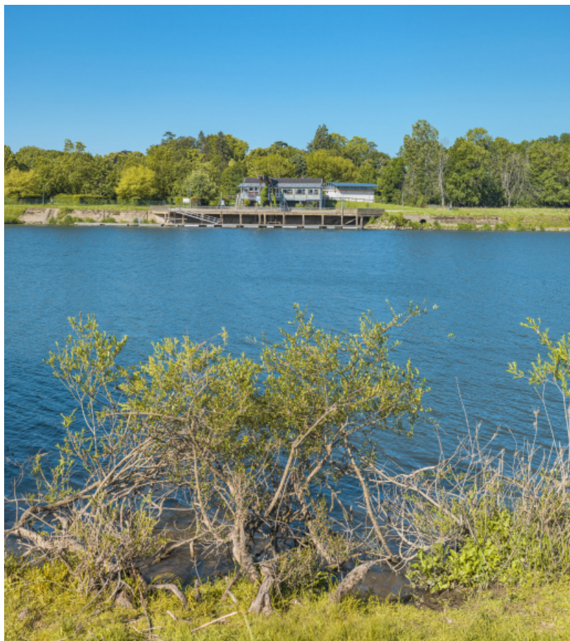
Le port de Gergy depuis la rive opposée.