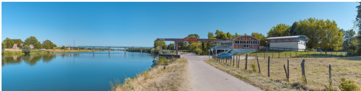
Le port de Gergy, vu d'amont. Le pont Boucicaut en arrière-plan.