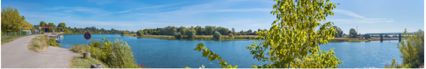
Vue panoramique avec de gauche à droite : le port de Gergy et le pont Boucicaut.