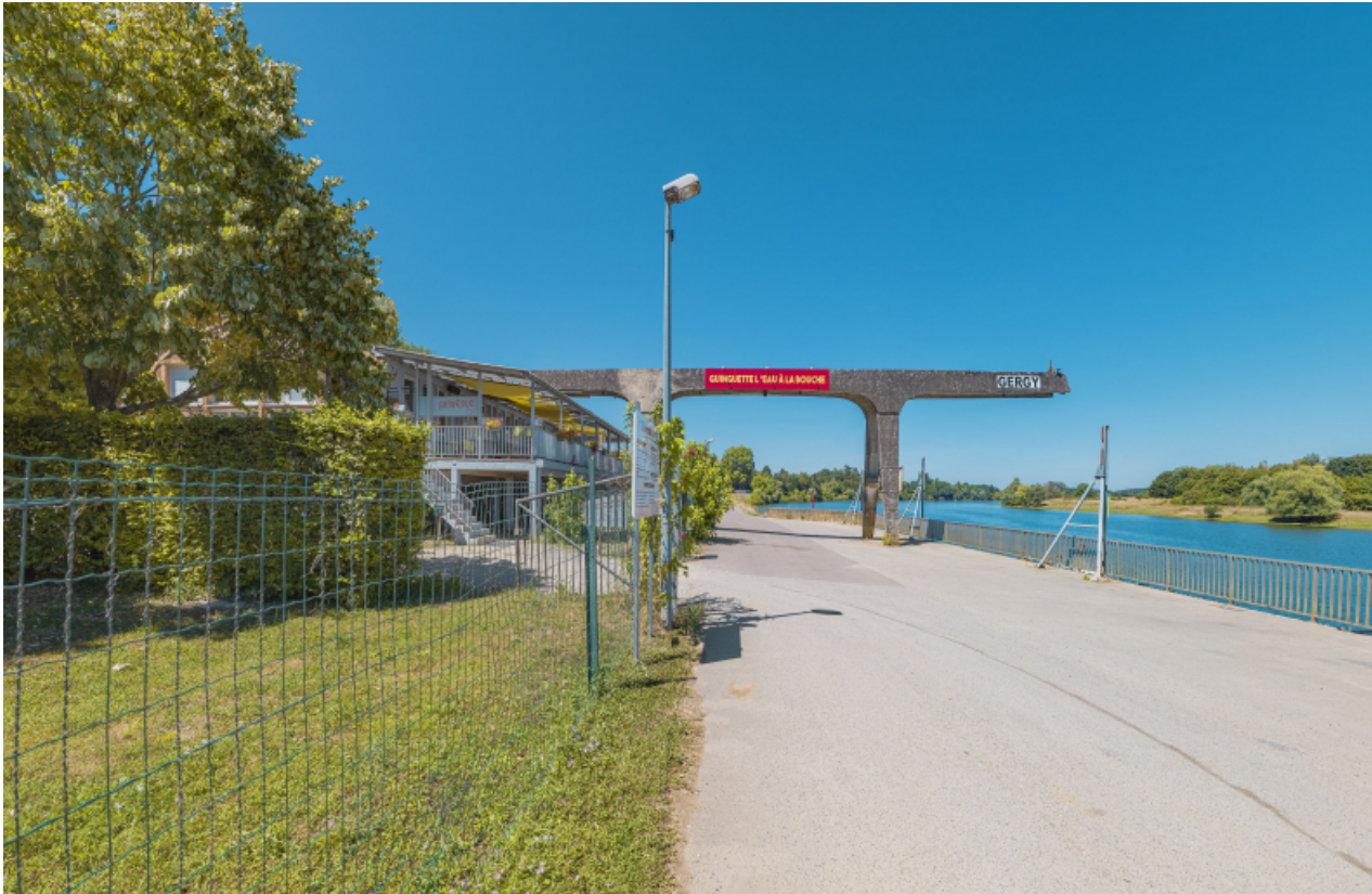
La halte nautique et son restaurant.