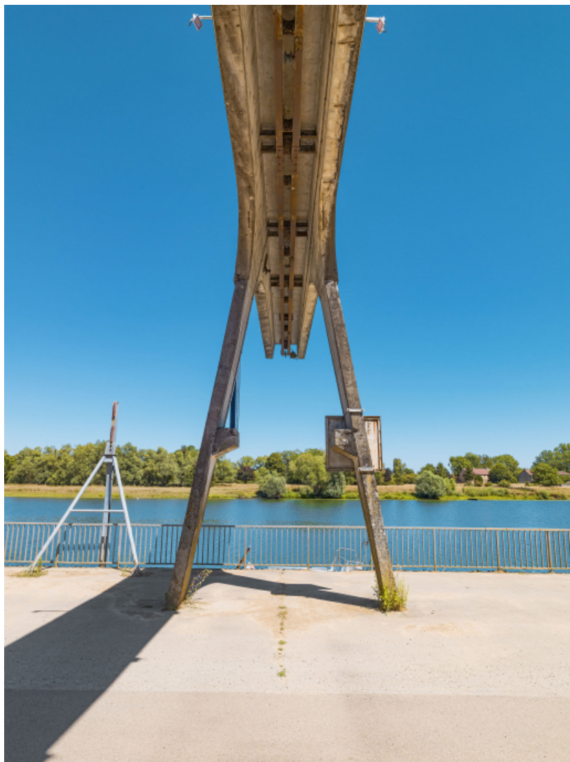
Portique de déchargement avec poulie.