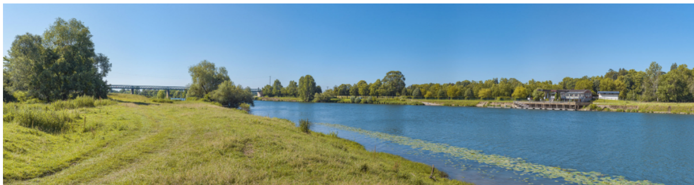
Le port de Gergy depuis la rive opposée. En arrière-plan, le pont Boucicaut.