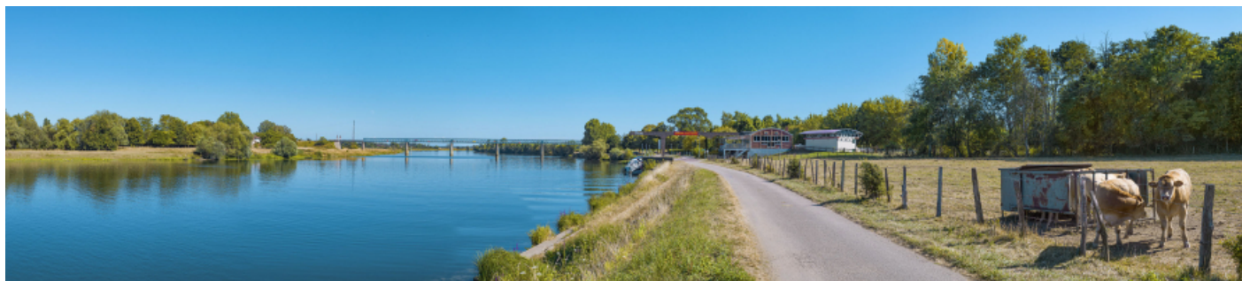
Le port de Gergy, vu d'amont. Le pont Boucicaut en arrière-plan.