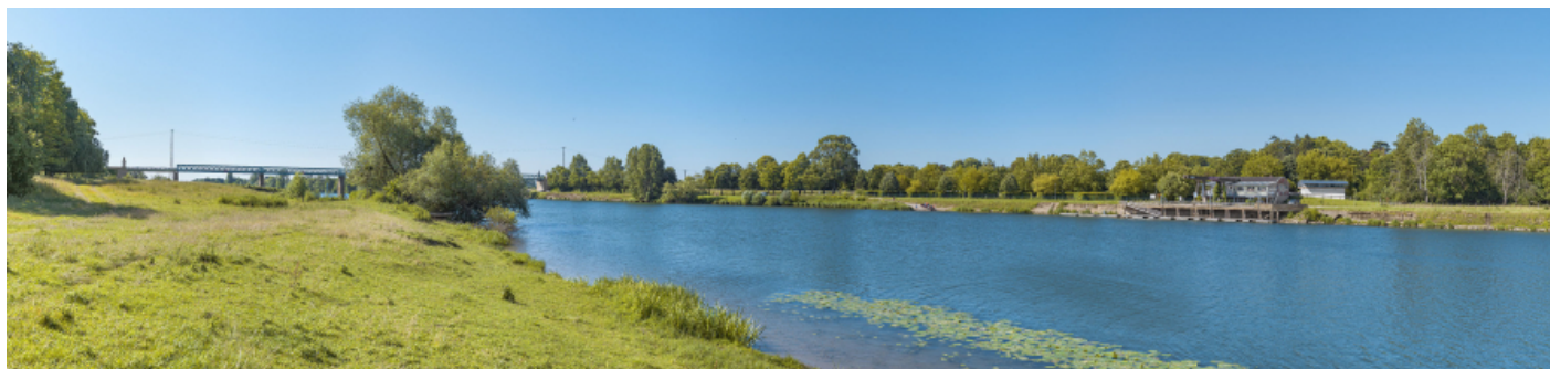
Le port de Gergy depuis la rive opposée. En arrière-plan, le pont Boucicaut.