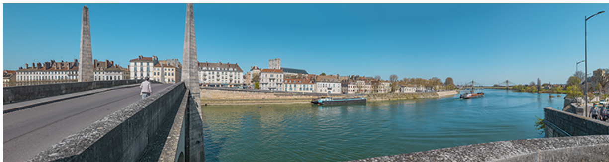
Le pont Saint-Laurent de Chalon-sur-Saône (71).