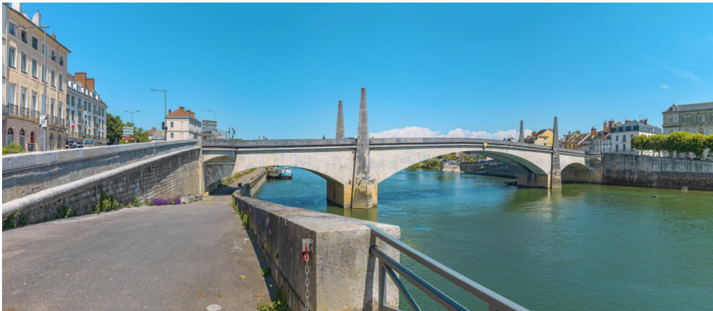
Vue d'ensemble du pont, depuis la banquette de halage aval. 71, Chalon-sur-Saône route départementale 19, lieu dit : PK 141.83