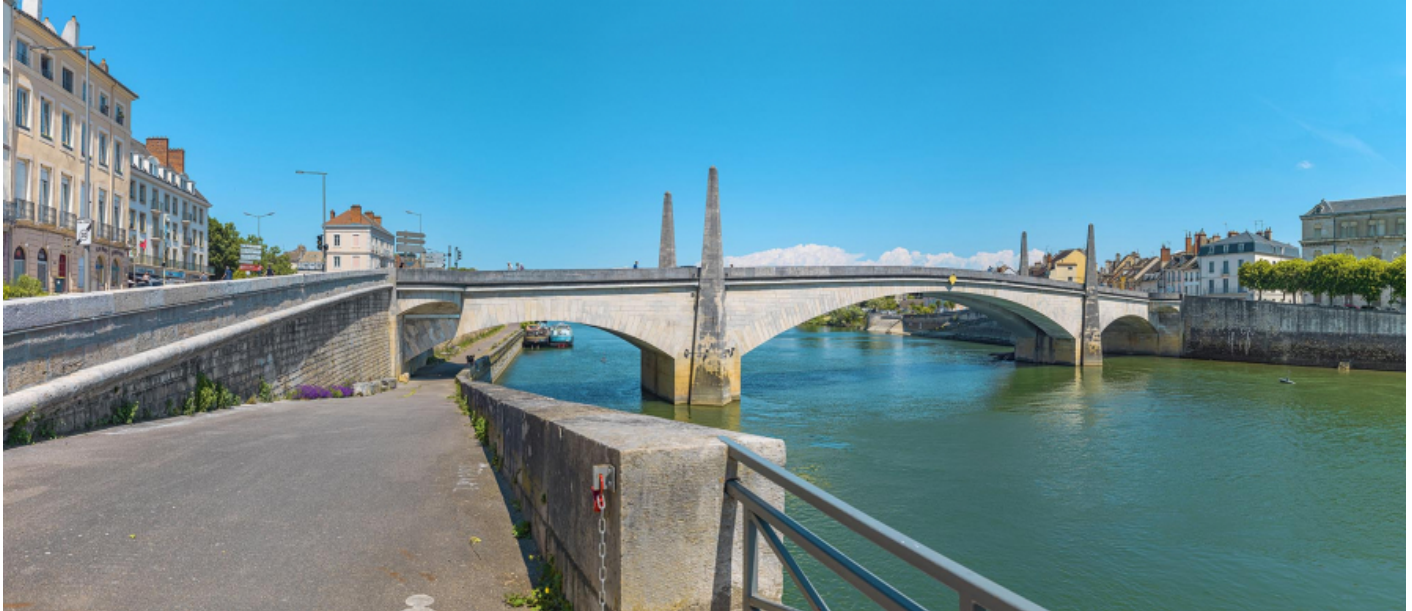
Vue d'ensemble du pont, depuis la banquette de halage aval. 71, Chalon-sur-Saône route départementale 19, lieu dit : PK 141.83