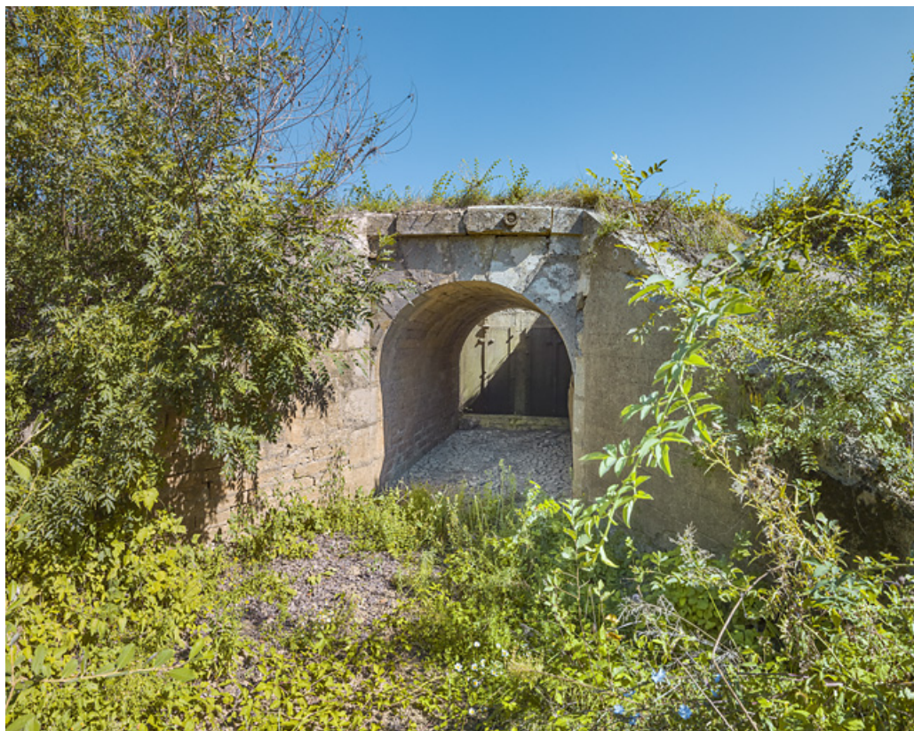
Vue d'ensemble du ponceau et des vannes, rive gauche.

71, Charnay-lès-Chalon, lieudit : PK 171.5