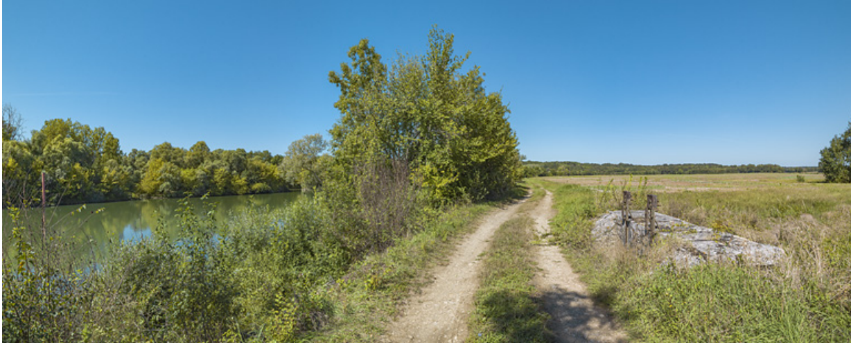
Le chemin de halage au niveau du ponceau : à droite le système de vannes sur la Raie du Grand Meix, à gauche, la Saône. 71, Charnay-lès-Chalon, lieudit : PK 171.5