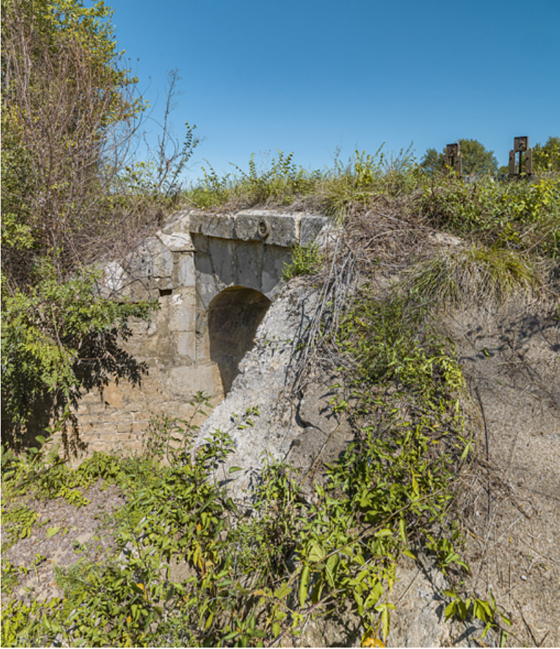
Vue d'ensemble du ponceau et des vannes, rive gauche.

71, Charnay-lès-Chalon, lieudit : PK 171.5