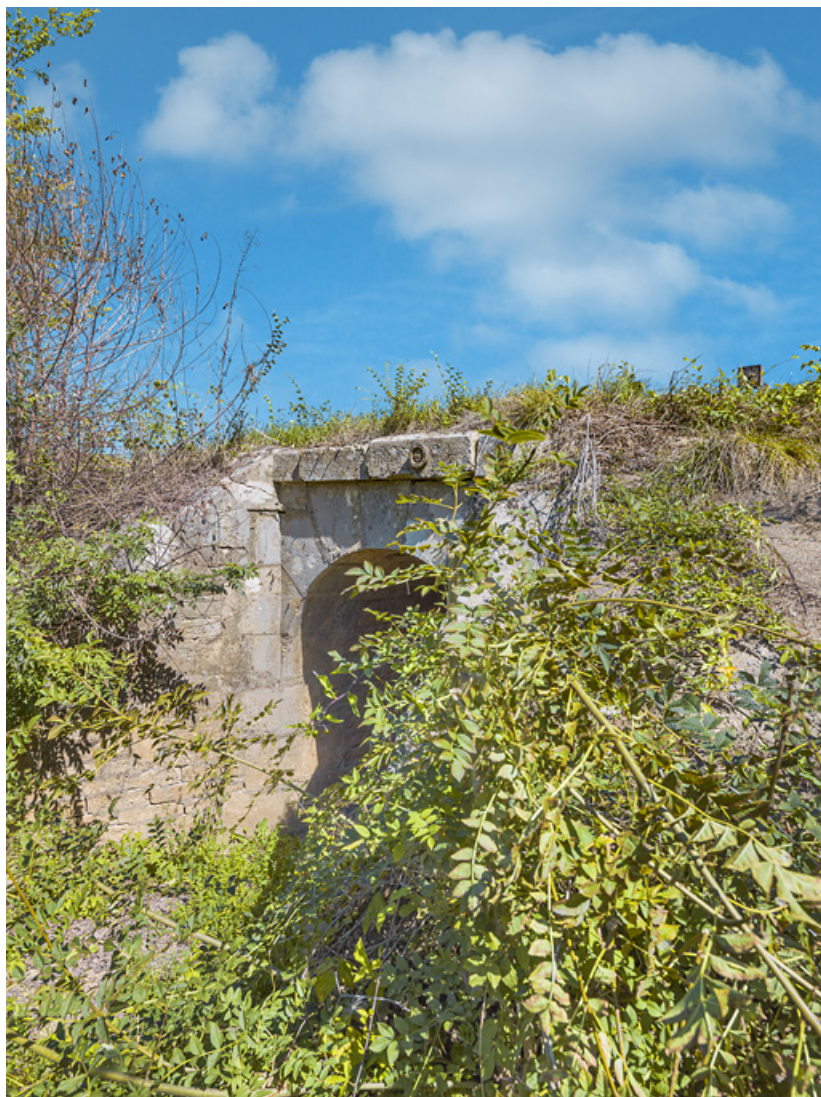
Le ponceau avec ses murs en aile, côté Saône.

71, Charnay-lès-Chalon, lieu dit : PK 171.5