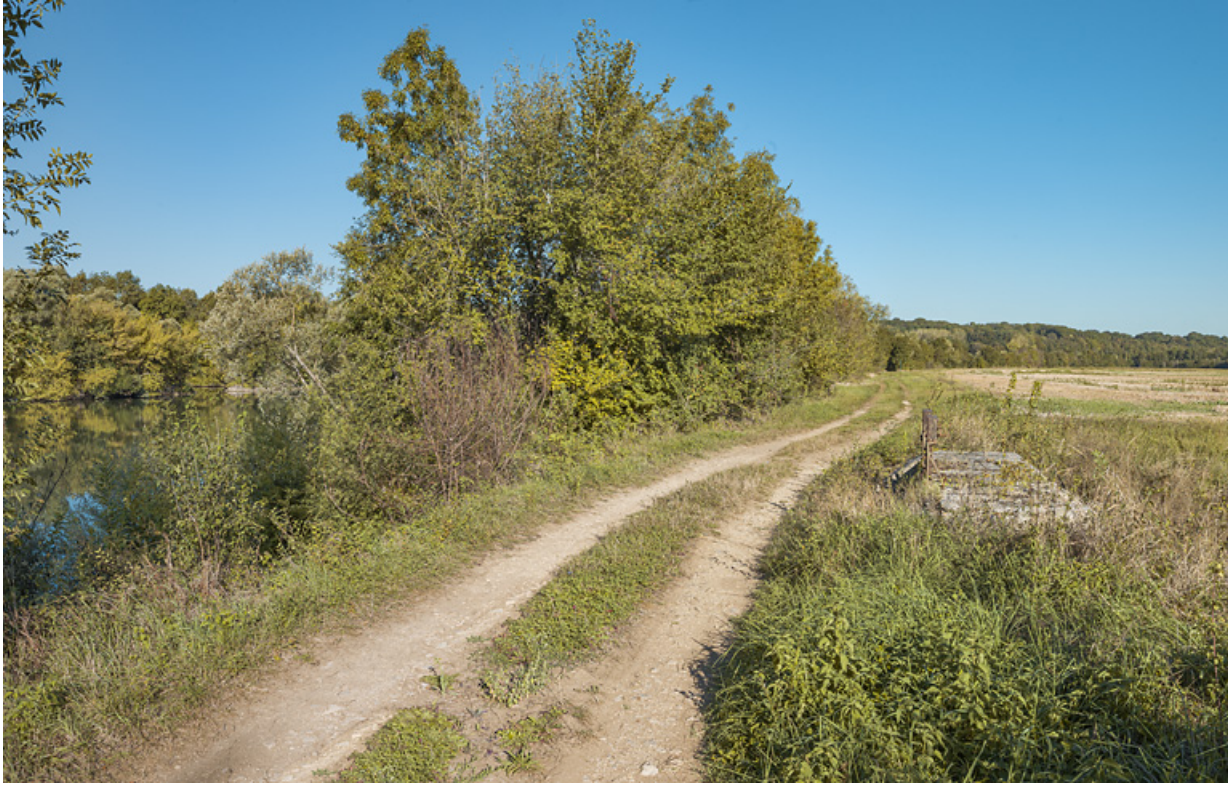
Le chemin de halage au niveau du ponceau : à droite le système de vannes sur la Raie du Grand Meix.

71, Charnay-lès-Chalon, lieudit : PK 171.5