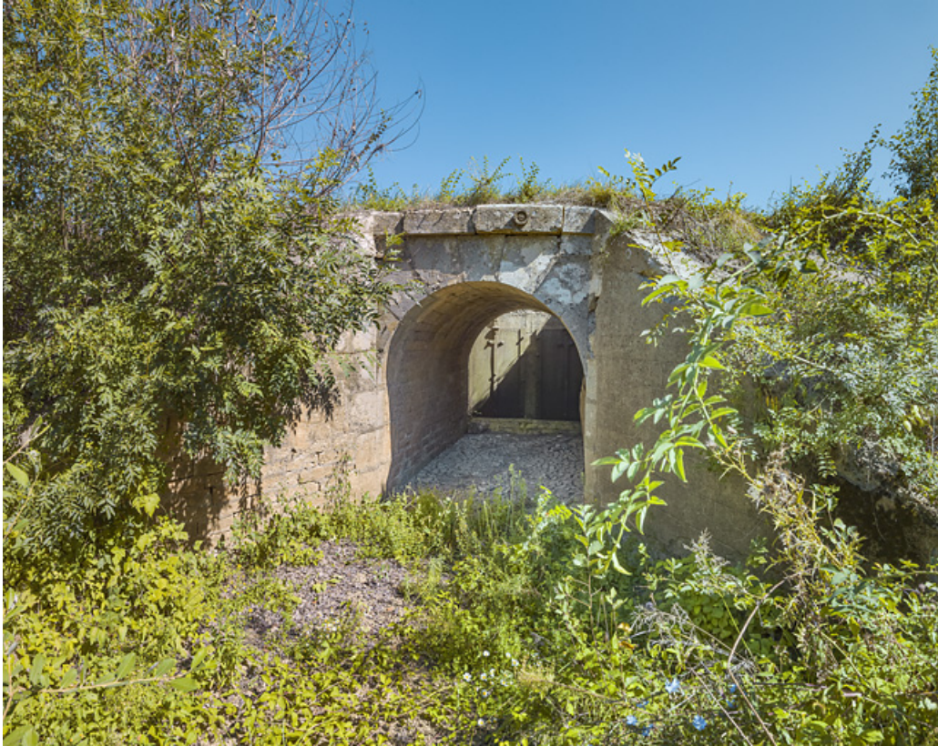
Vue d'ensemble du ponceau et des vannes, rive gauche.

71, Charnay-lès-Chalon, lieudit : PK 171.5