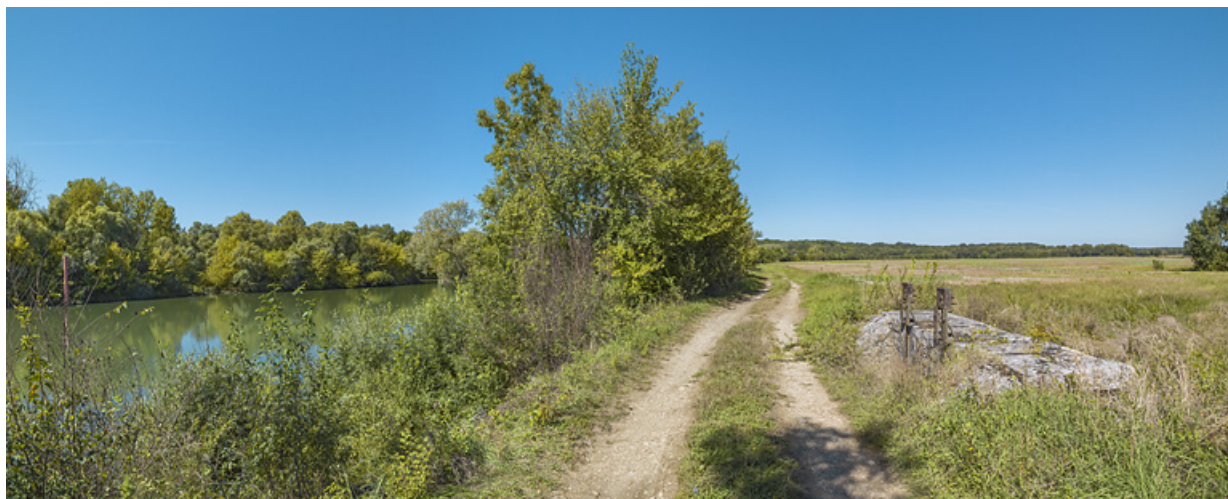
Le chemin de halage au niveau du ponceau : à droite le système de vannes sur la Raie du Grand Meix, à gauche, la Saône. 71, Charnay-lès-Chalon, lieudit : PK 171.5