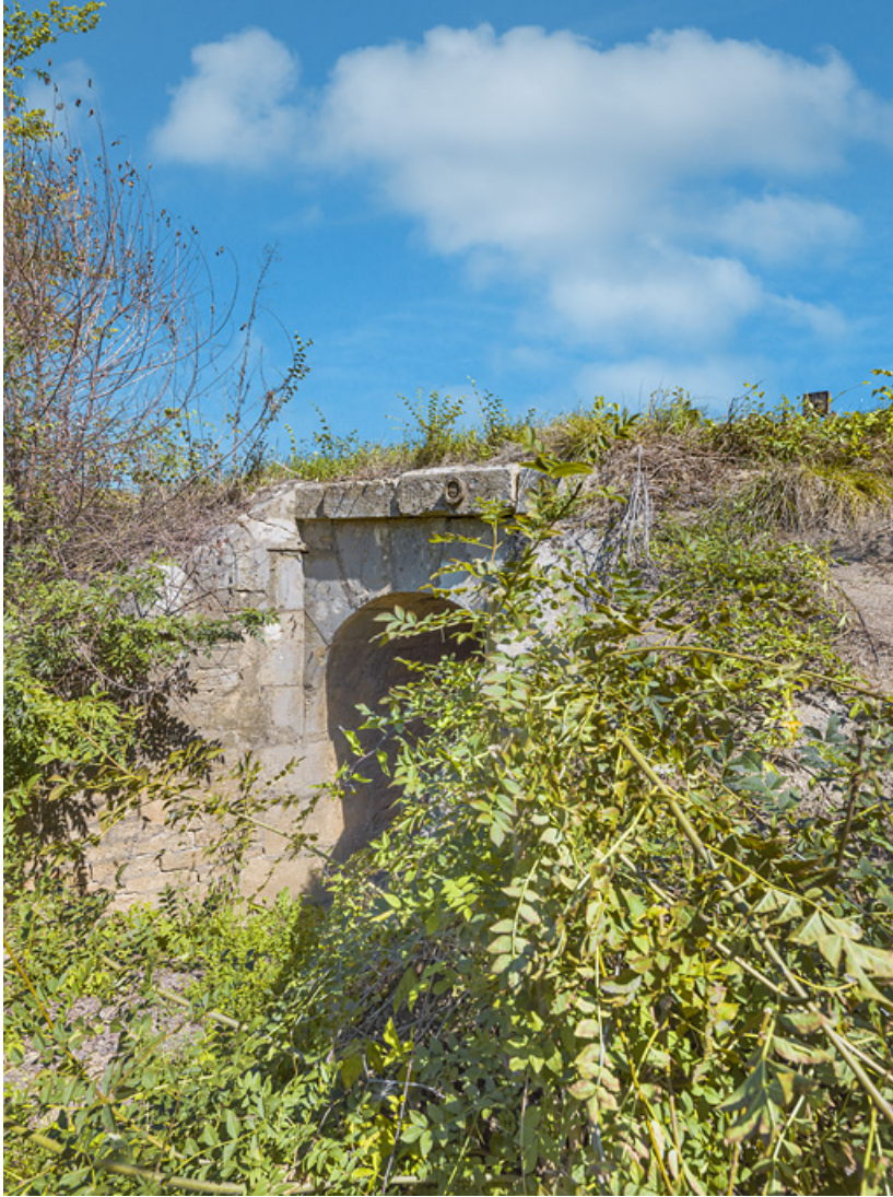
Le ponceau avec ses murs en aile, côté Saône.

71, Charnay-lès-Chalon, lieudit : PK 171.5