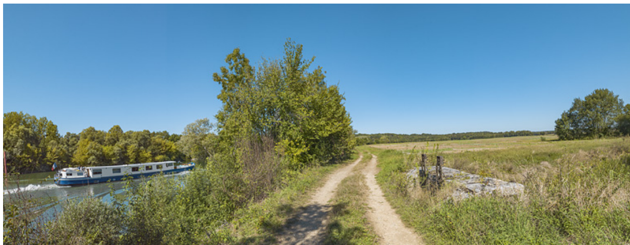
Le chemin de halage au niveau du ponceau : à droite le système de vannes sur la Raie du Grand Meix, à gauche, la Saône. 71, Charnay-lès-Chalon, lieudit : PK 171.5