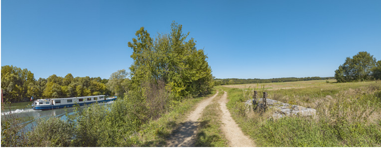
Le chemin de halage au niveau du ponceau : à droite le système de vannes sur la Raie du Grand Meix, à gauche, la Saône. 71, Charnay-lès-Chalon, lieudit : PK 171.5