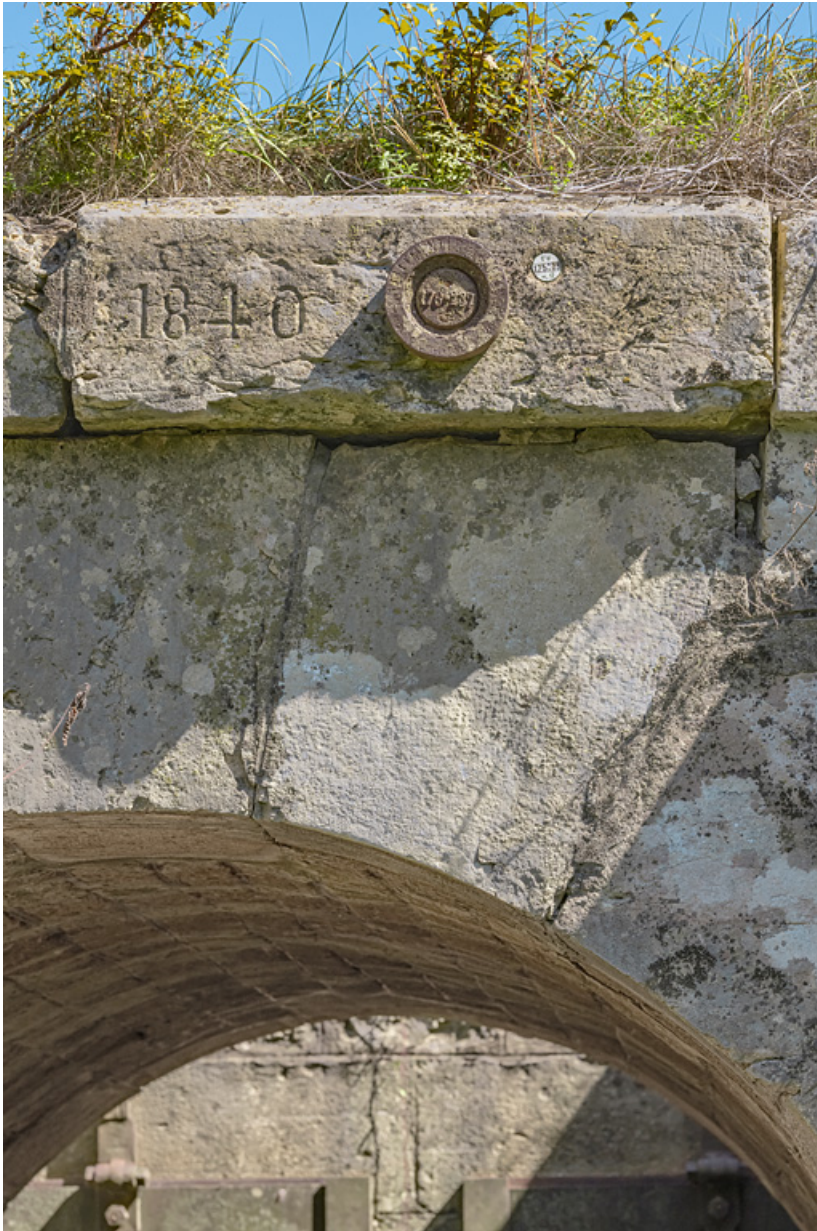
La date de 1840 gravée sur le pont, côté Saône.

71, Charnay-lès-Chalon, lieudit : PK 171.5