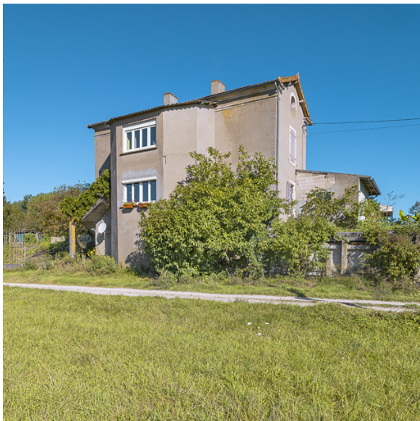
Façade arrière avec l'ajout d'un avant-corps central.