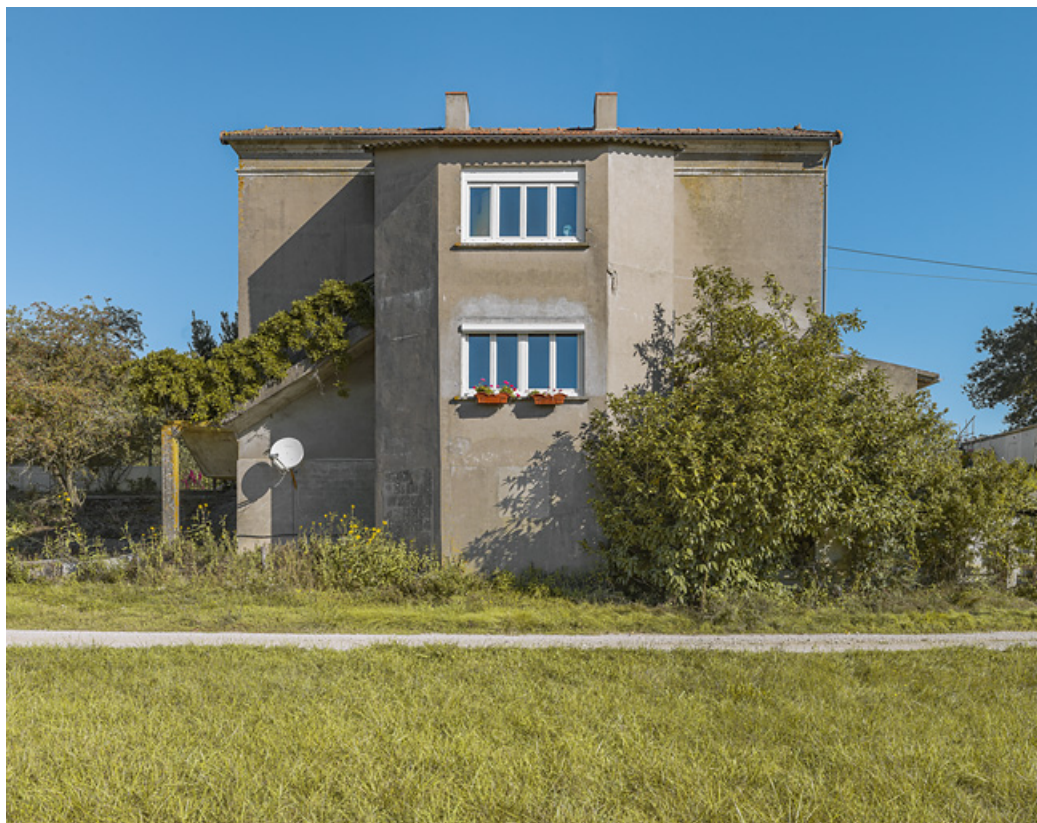
Façade arrière avec l'ajout d'un avant-corps central.

71, Charnay-lès-Chalon, lieudit : PK 176