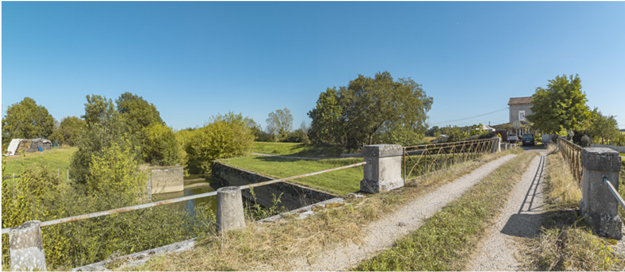
Le site d'écluse vu depuis la rive gauche, au niveau du pont sur écluse.

71, Charnay-lès-Chalon, lieu dit : PK 176