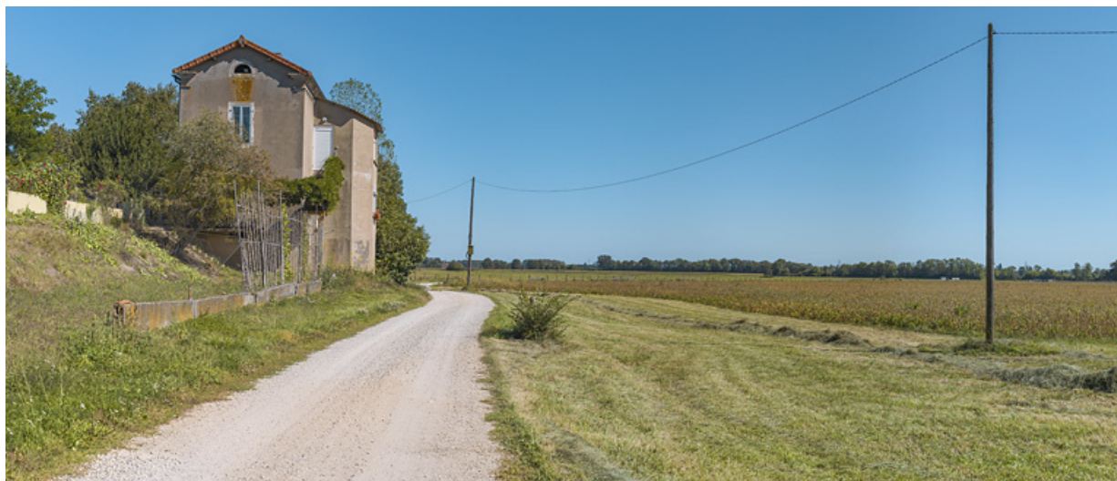
La maison éclusière, vue d'aval, dans son environnement paysager.

71, Charnay-lès-Chalon, lieudit : PK 176