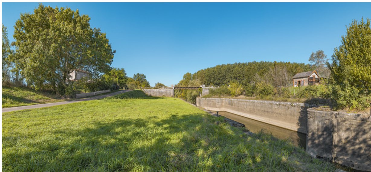
Vue d'ensemble du site de l'écluse de Charnay : à gauche, la maison éclésièrre, au centre, le pont sur écluse et à droite, la remise. 71, Charnay-lès-Chalon, lieudit : PK 176