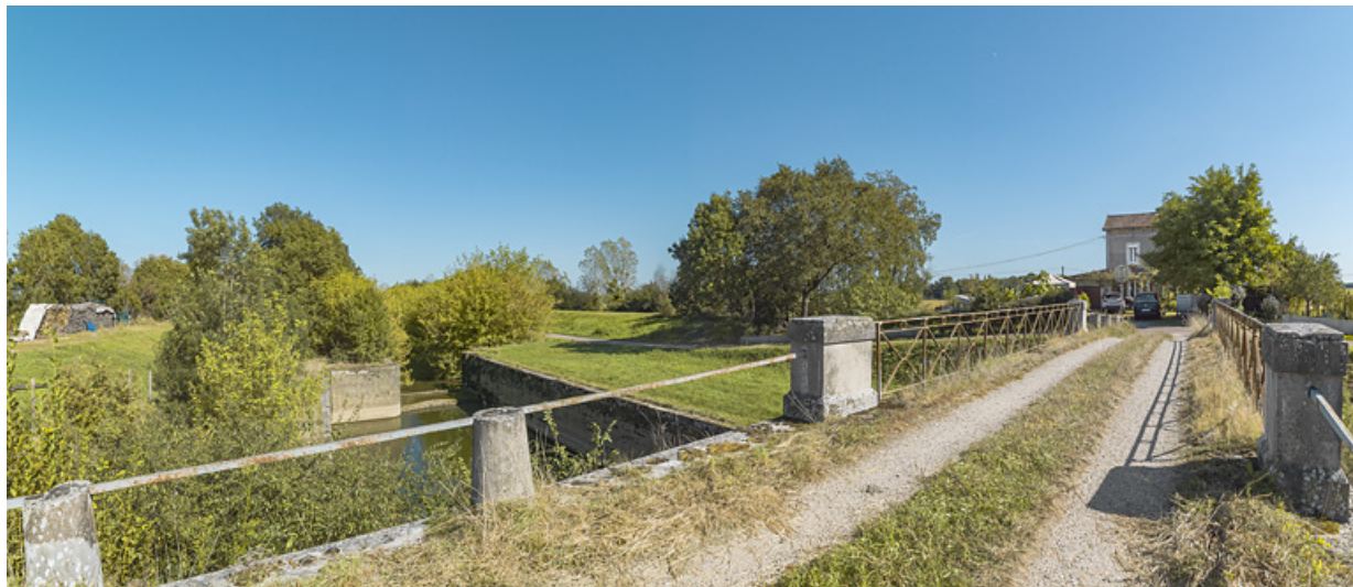
Le site d'écluse vu depuis la rive gauche, au niveau du pont sur écluse.

71, Charnay-lès-Chalon, lieu dit : PK 176