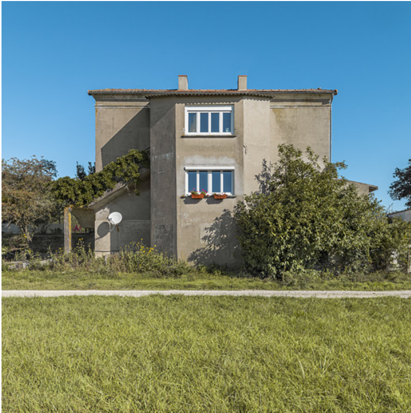
Façade arrière avec l'ajout d'un avant-corps central.

71, Charnay-lès-Chalon, lieudit : PK 176