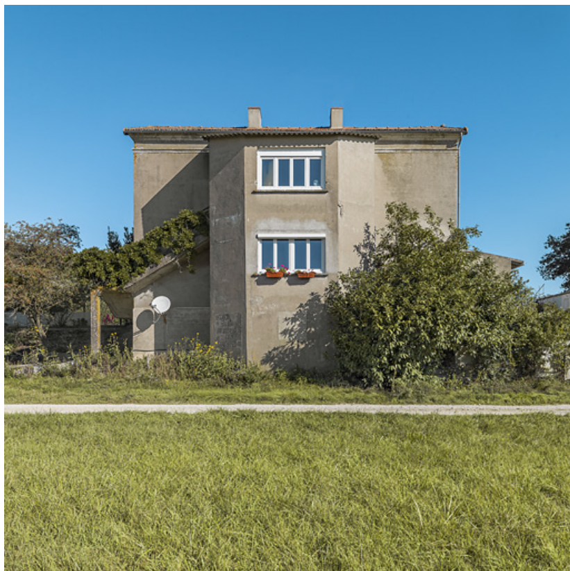
Façade arrière avec l'ajout d'un avant-corps central.

71, Charnay-lès-Chalon, lieudit : PK 176