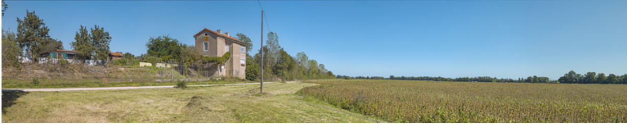
La maison éclusière, vue d'aval, dans son environnement paysager.

71, Charnay-lès-Chalon, lieudit : PK 176