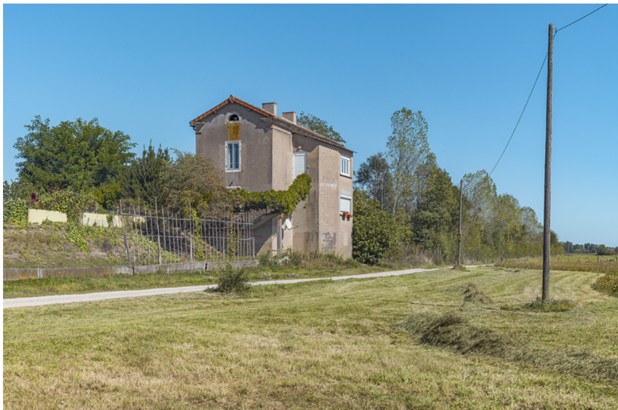
La maison éclusière, vue d'aval, dans son environnement paysager.