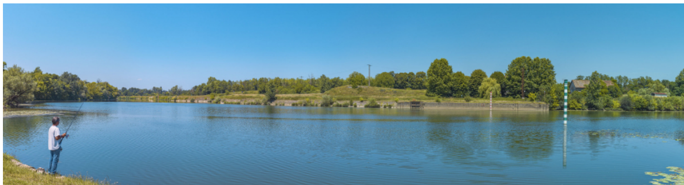
La Saône à hauteur de l'ancien barrage, depuis la rive gauche.

71, Les Bordes rue de l'Île, lieudit : PK 167,5