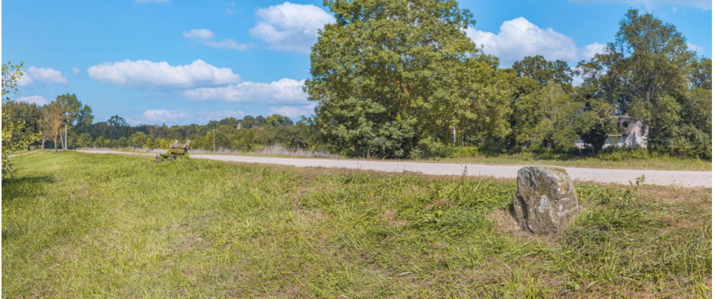
Borne située au PK 120, en rive gauche de la Saône. On peut y lire "D'ORMES".