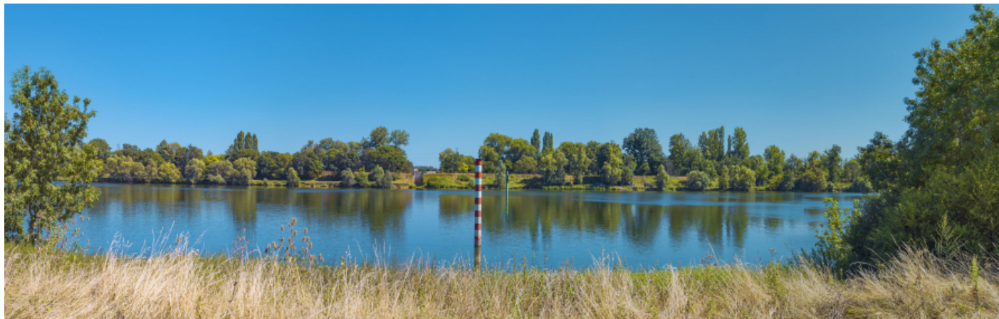
La Saône à hauteur de l'ancienne digue basse de la Motte-Nozillot, entre Gergy et Bey.