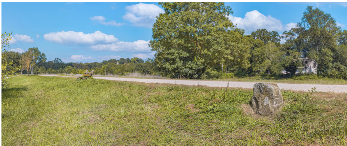
Borne située au PK 120, en rive gauche de la Saône. On peut y lire "D'ORMES". 71, Écuellen, lieudit : PK 175