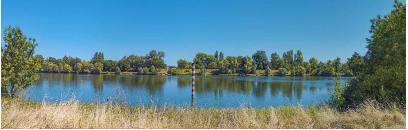
La Sâone à hauteur de l'ancienne digue basse de la Motte-Nozillot, entre Gergy et Bey.