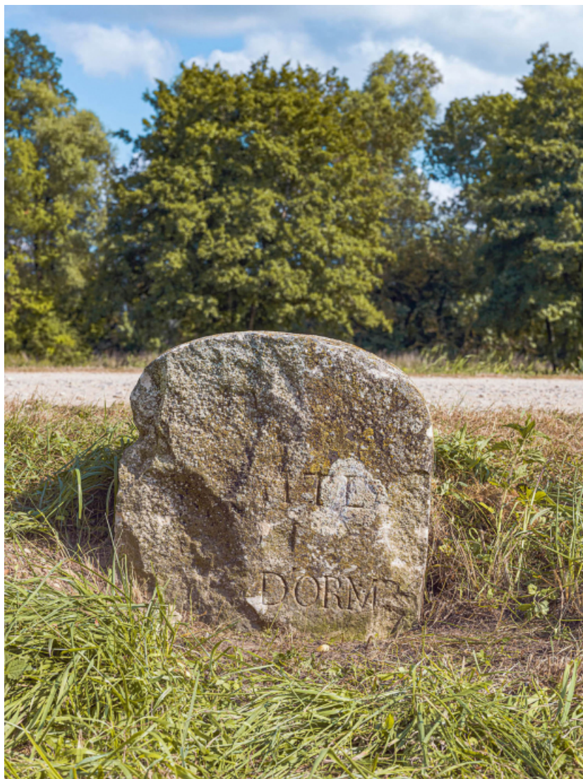
Détail de la borne située au PK 120, rive gauche, en amont du barrage d'Ormes. 71, Écuellen, lieudit : PK 175