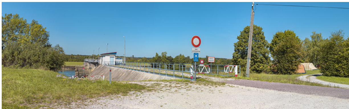
Vue d'ensemble du barrage depuis Charnay-lès-Chalon, rive gauche.

71, Charnay-lès-Chalon rue Neuve, lieudit : PK 178