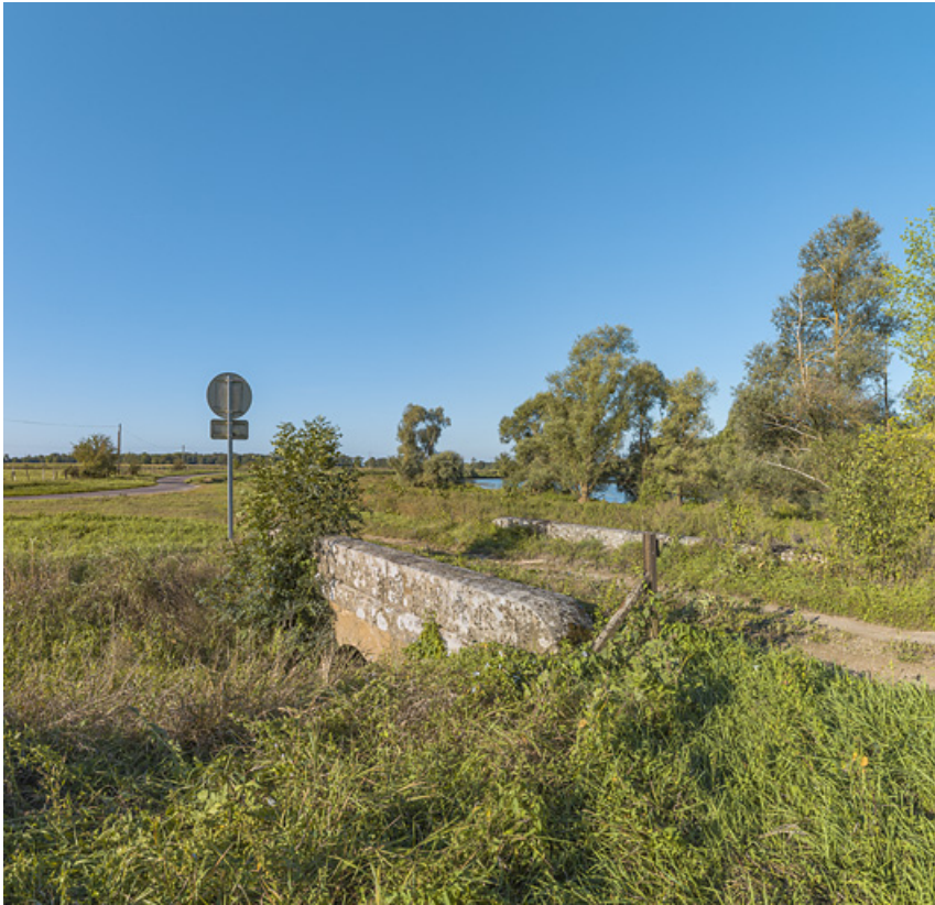
Chemin de halage et ponceau, le long du bief de Charnay sur le chemin de l'ancienne écluse. 71, Charnay-lès-Chalon