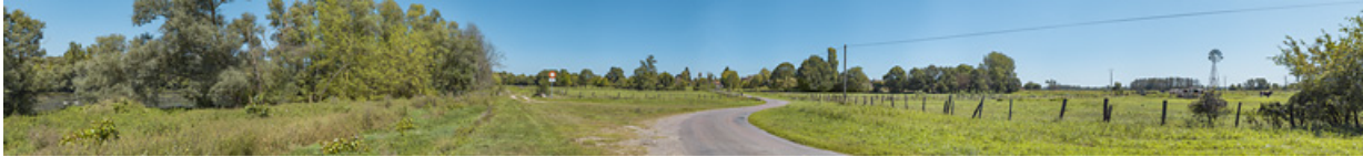
Le village de Charnay-lès-Chalon, en bordure de Saône.