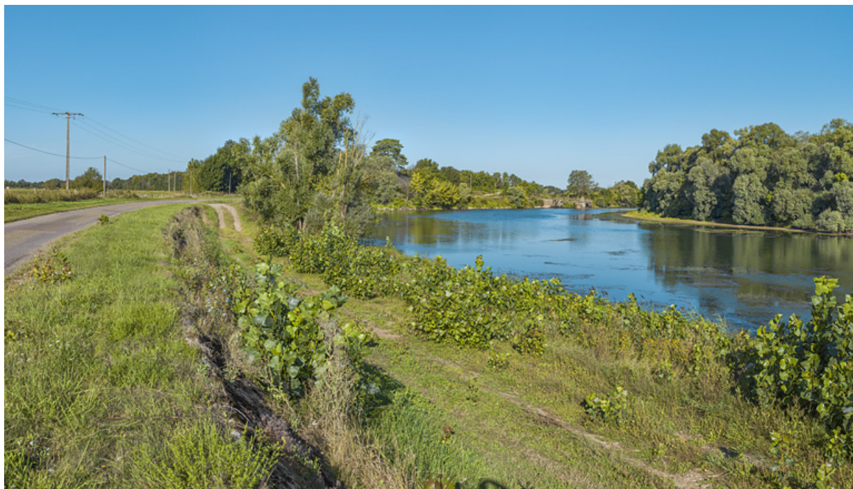
Partie de bief en amont de l'ancien barrage, au niveau de l'entrée dans la dérivation de Charnay.