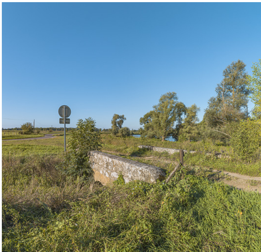
Chemin de halage et ponceau, le long du bief de Charnay sur le chemin de l'ancienne écluse. 71, Charnay-lès-Chalon