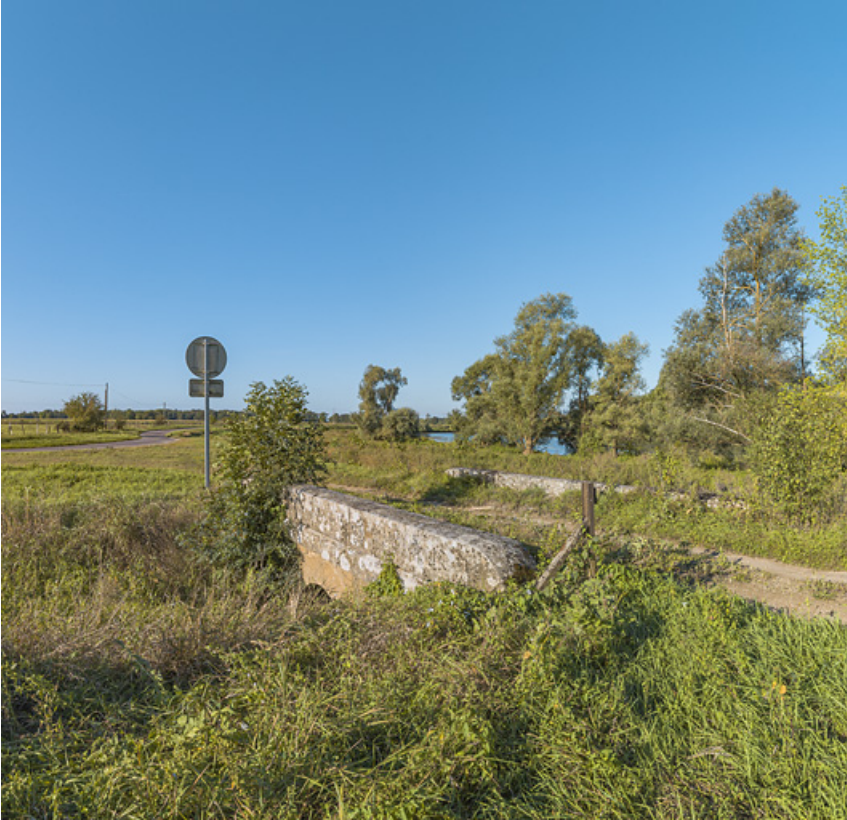
Chemin de halage et ponceau, le long du bief de Charnay sur le chemin de l'ancienne écluse. 71, Charnay-lès-Chalon