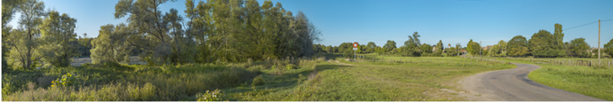
Le village de Charnay-lès-Chalon, en bordure de Saône.