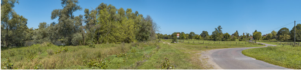
Le village de Charnay-lès-Chalon, en bordure de Saône.