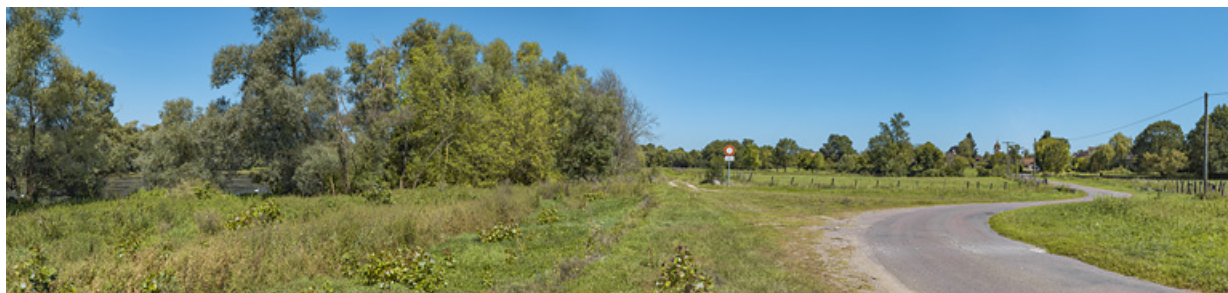
Le village de Charnay-lès-Chalon, en bordure de Saône.