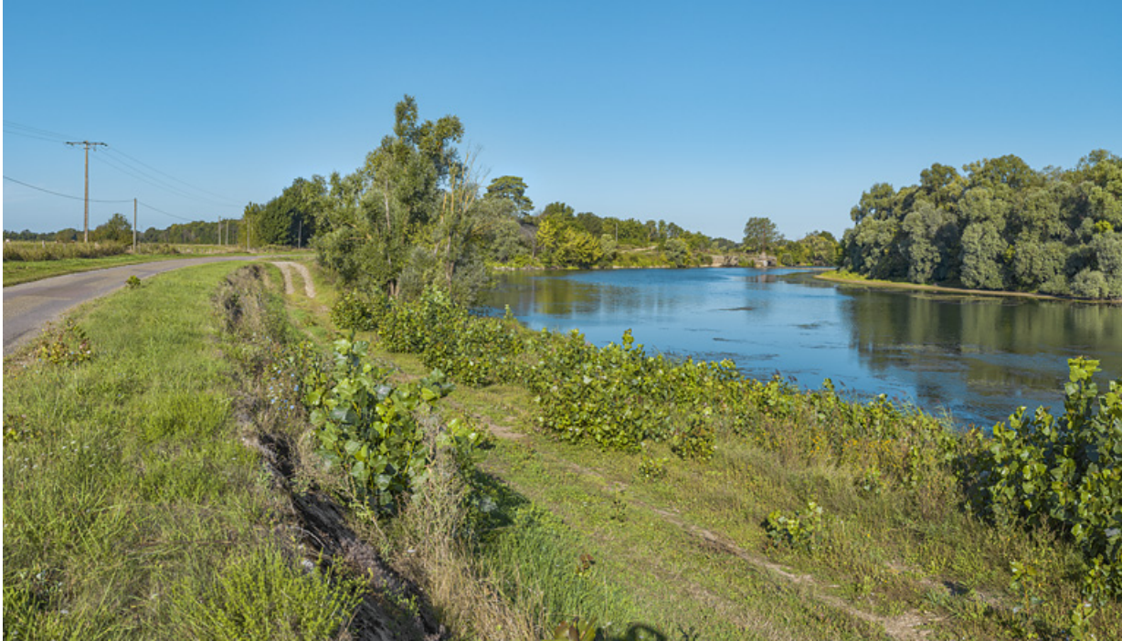
Partie de bief en amont de l'ancien barrage, au niveau de l'entrée dans la dérivation de Charnay. 71, Charnay-lès-Chalon