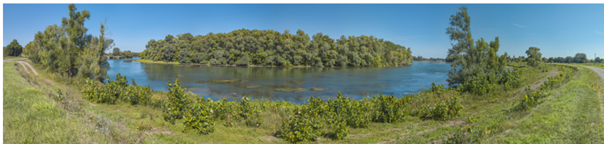
Vue d'ensemble de la partie de bief comprise entre les deux barrages de Charnay. A gauche, l'ancien et à droite, le nouveau. 71, Charnay-lès-Chalon

N° de l'illustration : 20197100471NUC4AQ