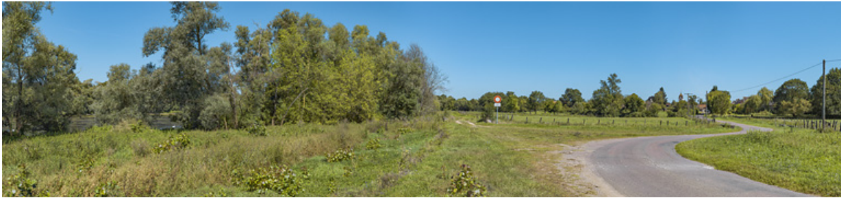
Le village de Charnay-lès-Chalon, en bordure de Saône.