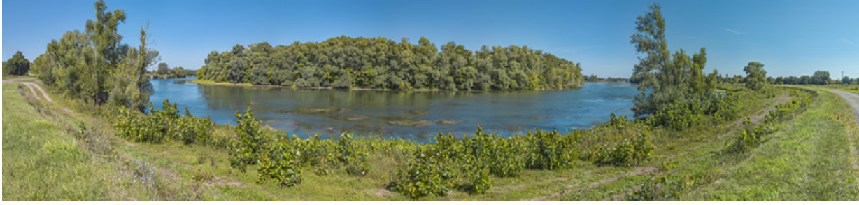
Vue d'ensemble de la partie de bief comprise entre les deux barrages de Charnay. A gauche, l'ancien et à droite, le nouveau. 71, Charnay-lès-Chalon

N° de l'illustration : 20197100471NUC4AQ