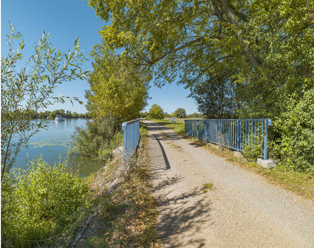
Vue d'ensemble du ponceau à la frontière entre Côte-d'Or et Saône-et-Loire.