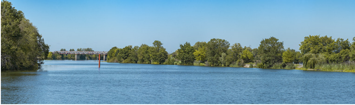
Vue d'ensemble de la Saône à hauteur du hameau de Chazelle, à droite le ponceau à la frontière entre Côte-d'Or et Saône-et-Loire et en arrière-plan le viaduc de Chivres.