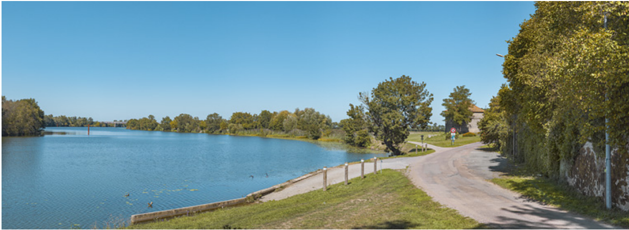
Vue d'ensemble de la cale double et plus précisément de la rampe aval.