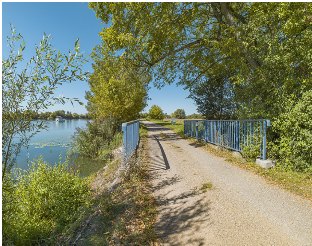
Vue d'ensemble du ponceau à la frontière entre Côte-d'Or et Saône-et-Loire.