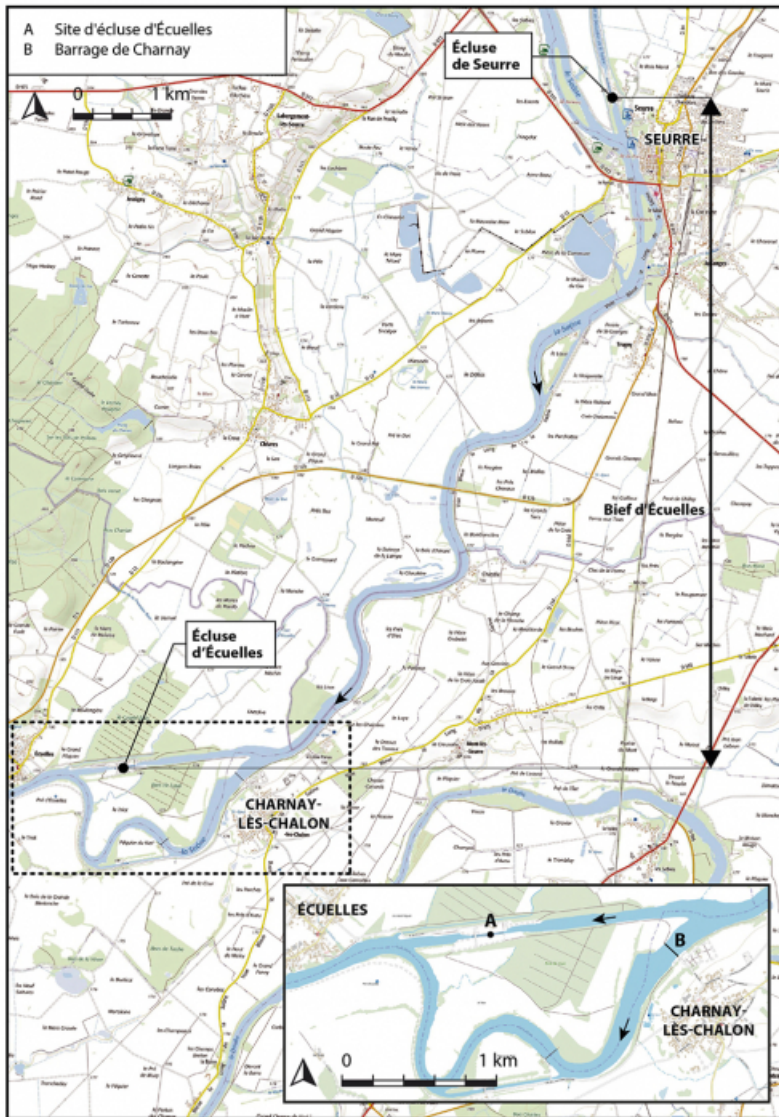
Plan de localisation (1/40 000). Extrait du ScanExpress standard © IGN 2018. 71, Écuellen, lieudit : PK 175