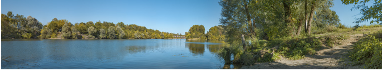
La sortie du bief d'Écuellen, avec en arrière plan, à gauche, le site d'écluse d'Écuellen et à droite, l'ancien bras de la Saône. 71, Écuellen, lieudit : PK 175