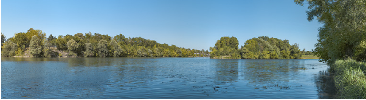
La sortie du bief d'Écuellen, avec en arrière plan, à gauche, le site d'écluse d'Écuellen et à droite, l'ancien bras de la Saône. 71, Écuellen, lieudit : PK 175