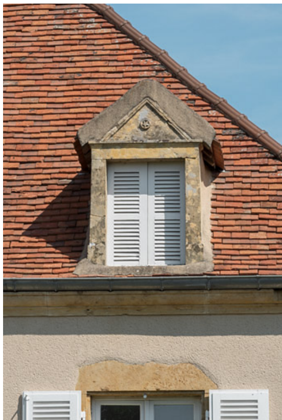
Une des lucarnes du toit de la maison d'emboucheur, dont le fronton est décoré d'une étoile dans un petit médaillon. 71, Changy, lieudit : Tourny