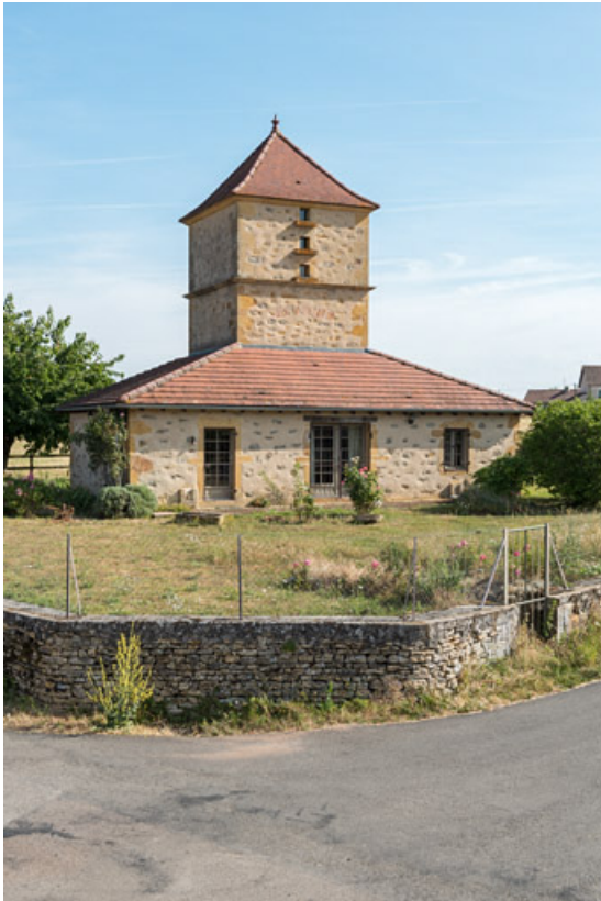
Habitation, surmontée d'un pigeonnier et érigée à la fin du XIXe siècle 71, Changy, lieudit : Tourny