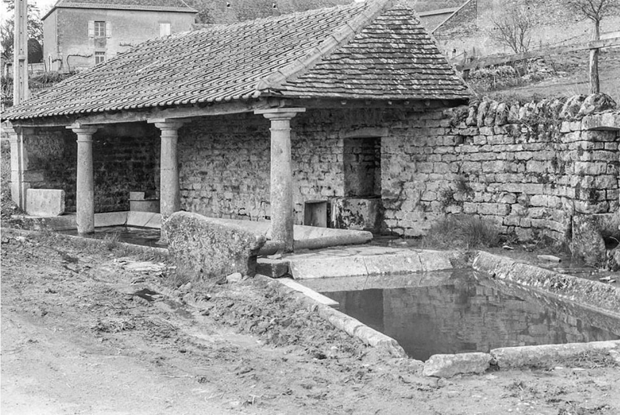
Le lavoir, vers 1970.