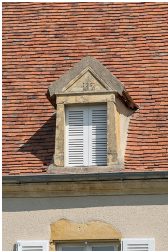
Autre lucarne de la maison d'emboucheur, dont le fronton est gravé de la date "1851", date de la construction de la bâtisse. 71, Changy, lieudit : Tourny