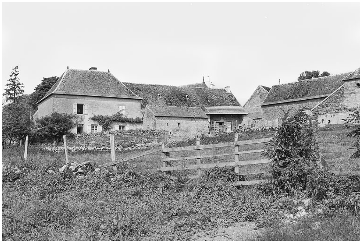
Ferme d'embouche, construite au XIXe siècle, située au coeur du hameau.