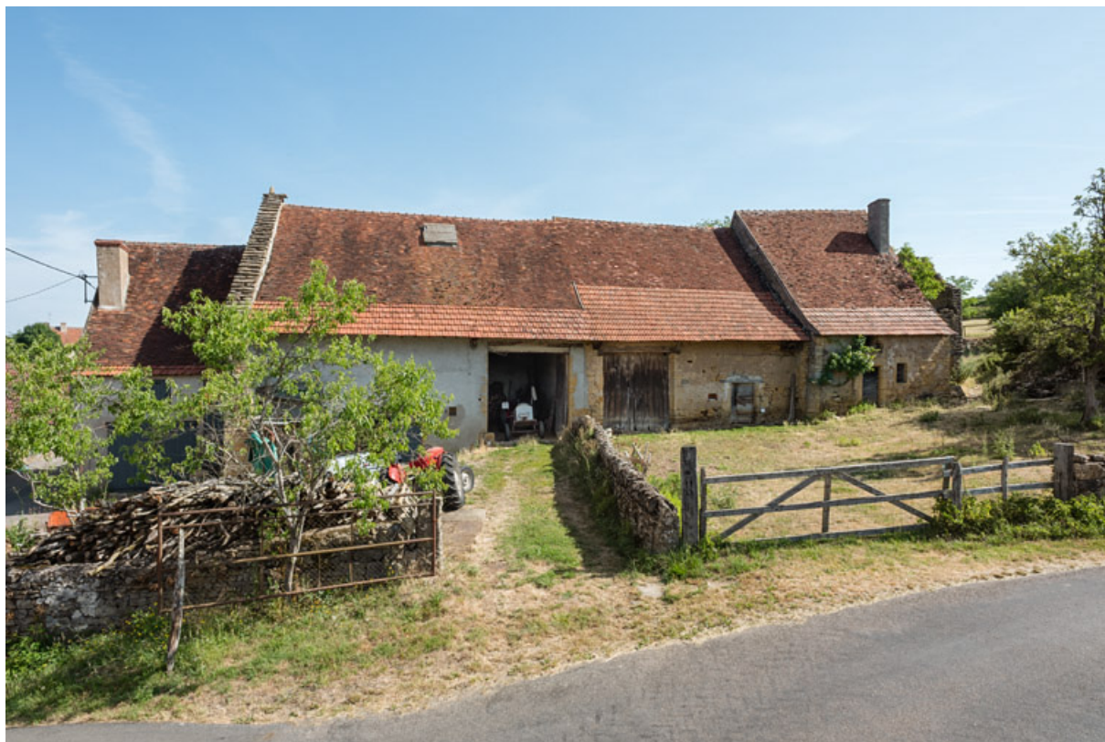
Ensemble formé par deux fermes construites dans le même alignement et situé à un croisement au coeur du village. 71, Changy, lieudit : Tourny