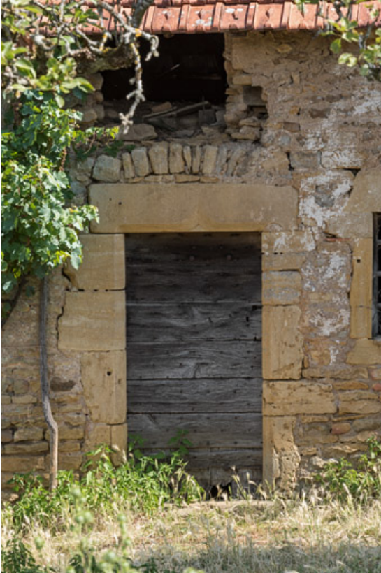
Porte d'une des maisons de l'alignement, avec un linteau à accolade, provenant sans doute d'un autre bâtiment et utilisé en remploi.