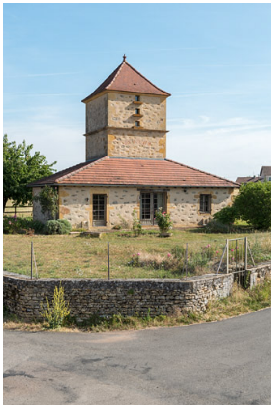
Habitation, surmontée d'un pigeonnier et érigée à la fin du XIXe siècle 71, Changy, lieudit : Tourny