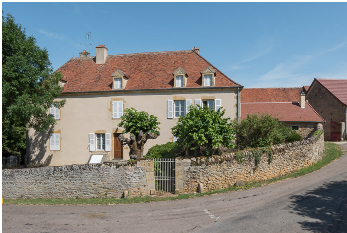
Ferme d'embouche. La maison est construite au milieu du XIXe siècle.