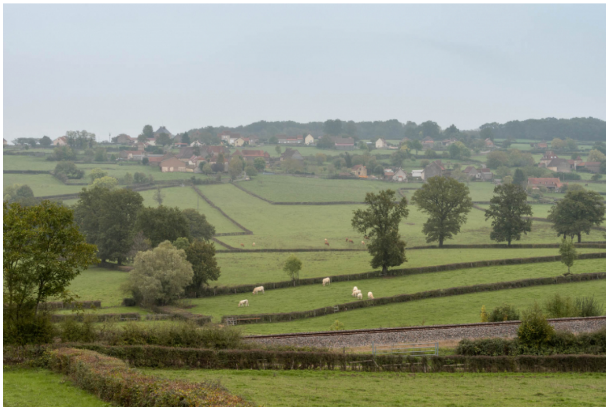
Vue du hameau de Tourny, depuis l'ouest et la route menant au vieux-bourg de Changy