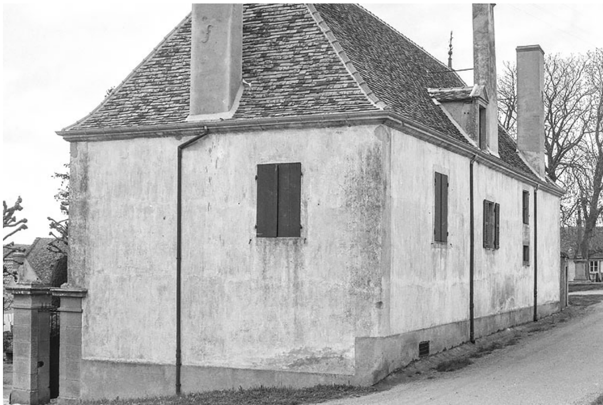
Maison d'emboucheur, construite au début du XIXe siècle, sur une parcelle formant un îlot au coeur du hameau. 71, Changy, lieudit : Tourny