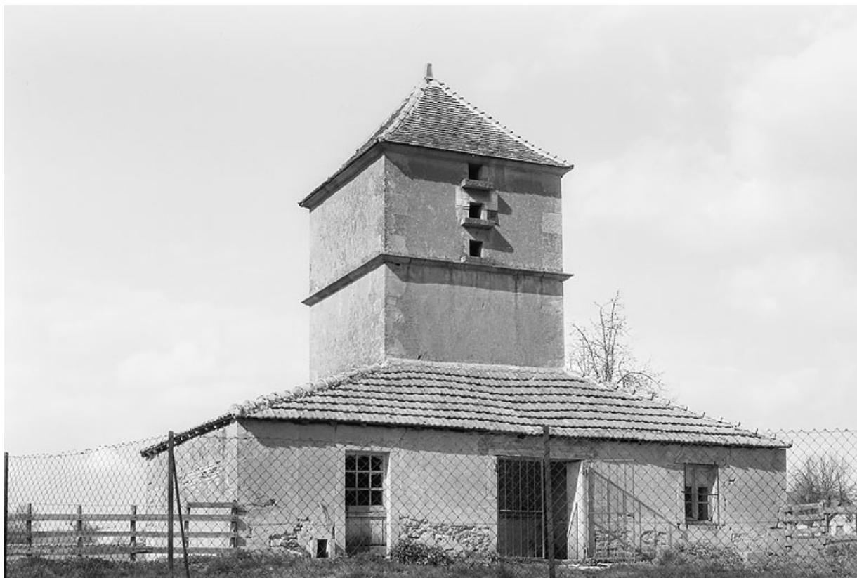
Vue de l'abitation surmontée d'un pigeonnier vers 1970