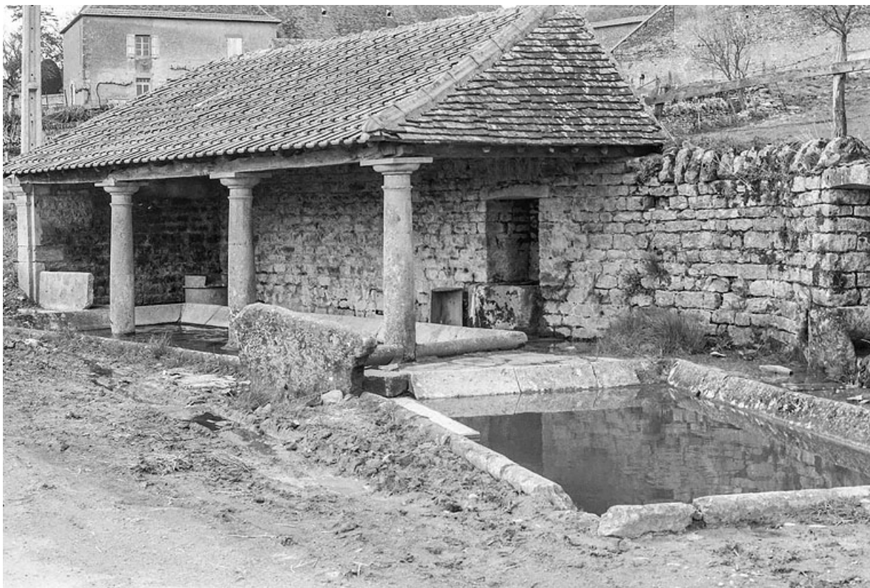
Le lavoir, vers 1970.