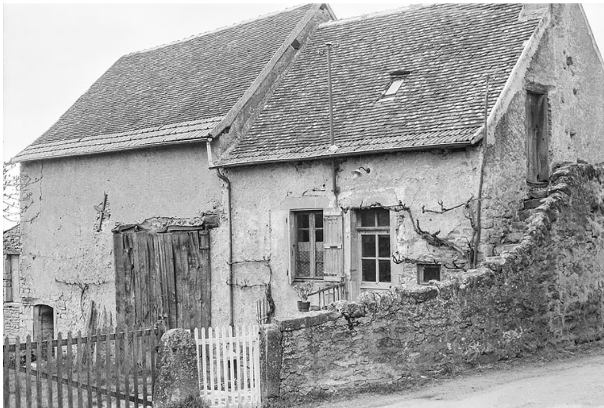
Ferme de polyculture, située dans la partie ouest du hameau.