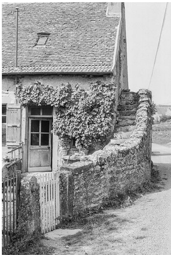
Détail de la même ferme : vue de l'escalier extérieur, construit contre le mur-pignon et donnant accès aux combles de la maison. 71, Changy, lieudit : Tourny