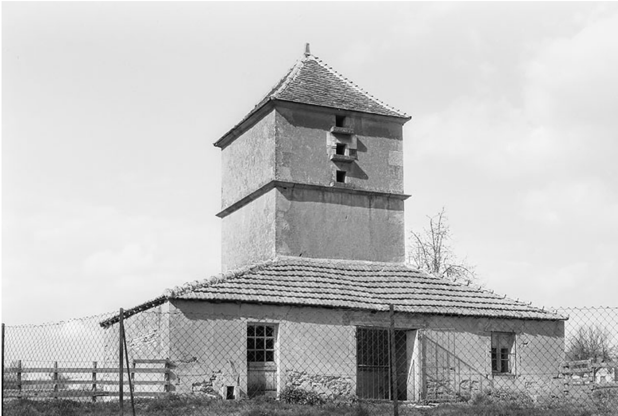
Vue de l'abitation surmontée d'un pigeonnier vers 1970