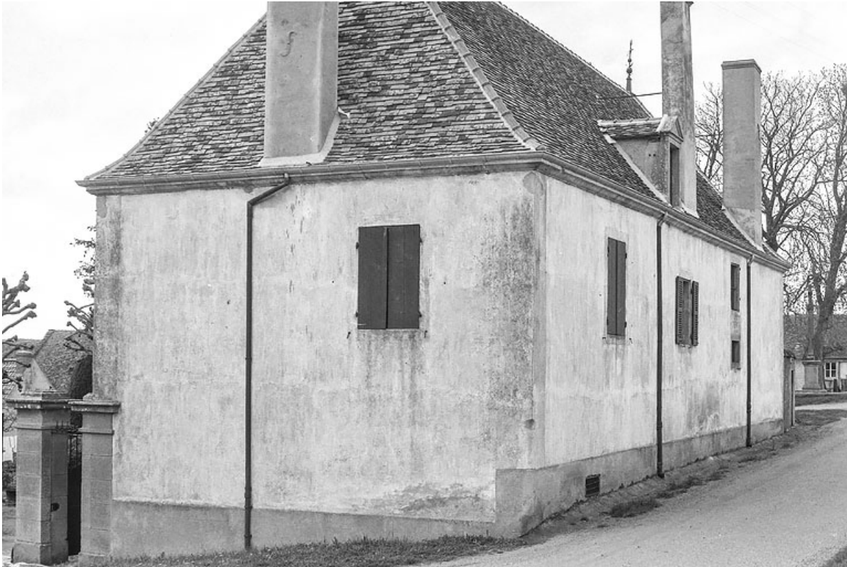
Maison d'emboucheur, construite au début du XIXe siècle, sur une parcelle formant un îlot au coeur du hameau. 71, Changy, lieudit : Tourny