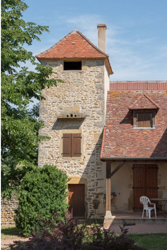
Ancien pigeonnier, dépendant de la ferme d'embouche 71, Changy, lieudit : Tourny