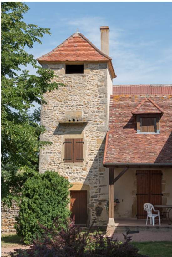
Ancien pigeonnier, dépendant de la ferme d'embouche 71, Changy, lieudit : Tourny