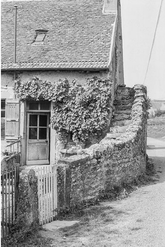
Détail de la même ferme : vue de l'escalier extérieur, construit contre le mur-pignon et donnant accès aux combles de la maison. 71, Changy, lieudit : Tourny