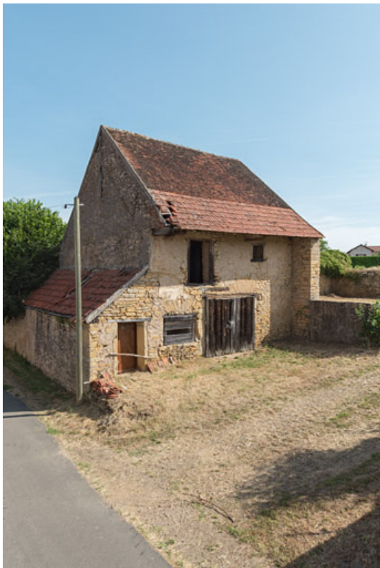
Ancienne maison de laboureur, transformée en bâtiment agricole. La grange, aujourd'hui détruite se situait dans le prolongement de la maison.