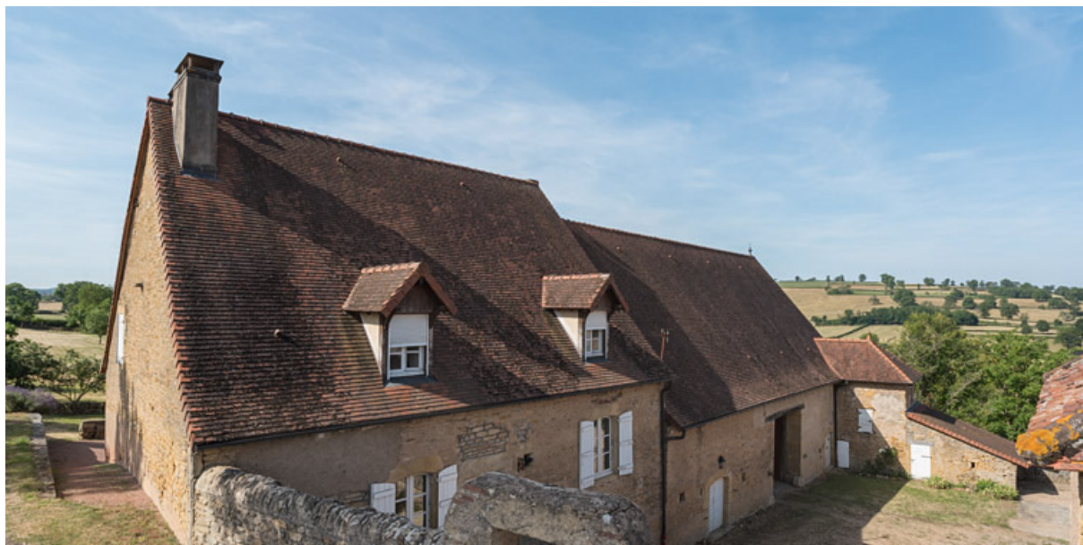
Ferme du XVIIIe siècle, propriété d'un riche laboureur, devenu emboucheur à la fin de ce siècle.