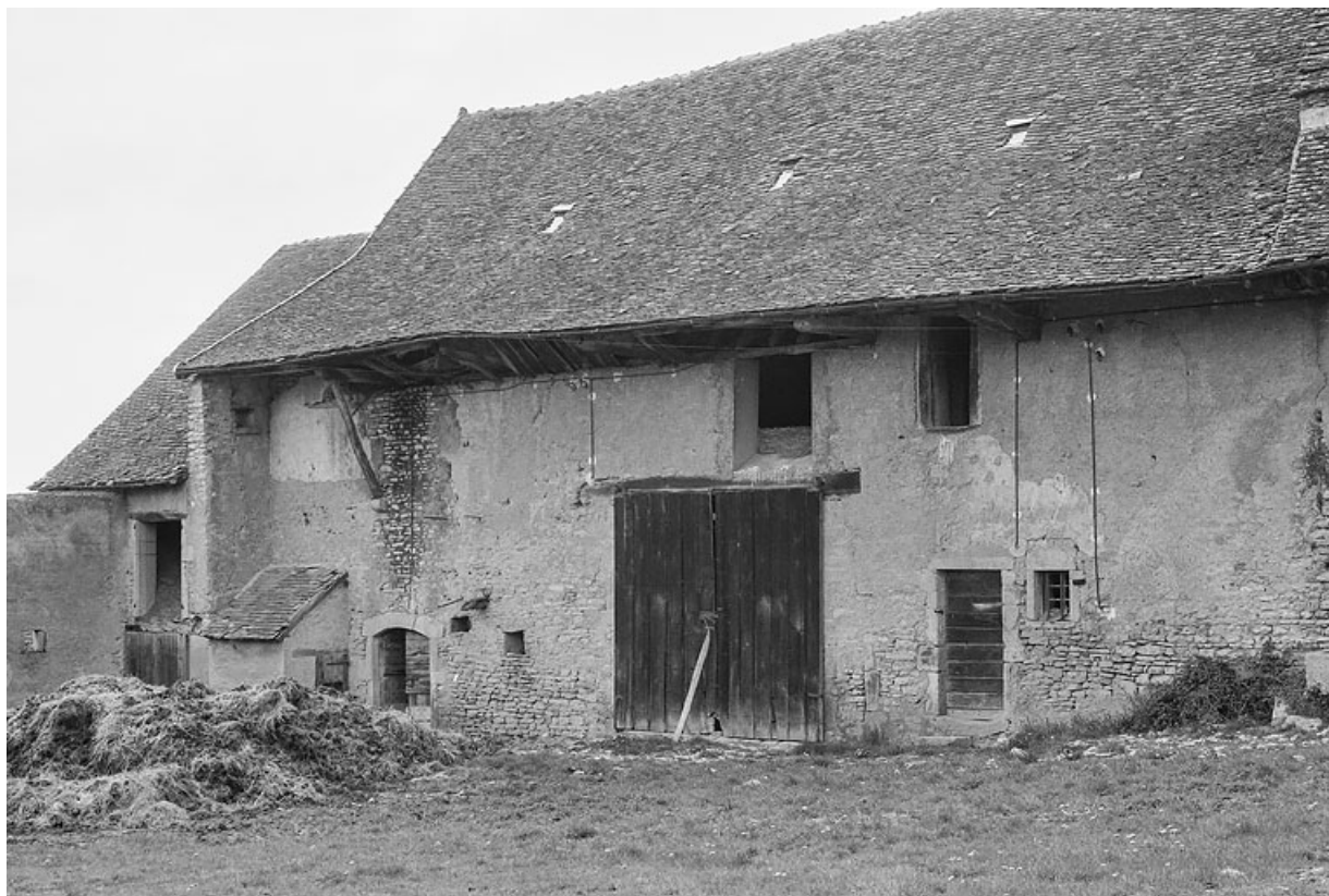
Grange, aujourd'hui détruite, à l'est du carrefour principal du hameau. Seul subsiste aujourd'hui, le bâtiment bas, à l'arrière-plan. 71, Changy, lieudit : Tourny