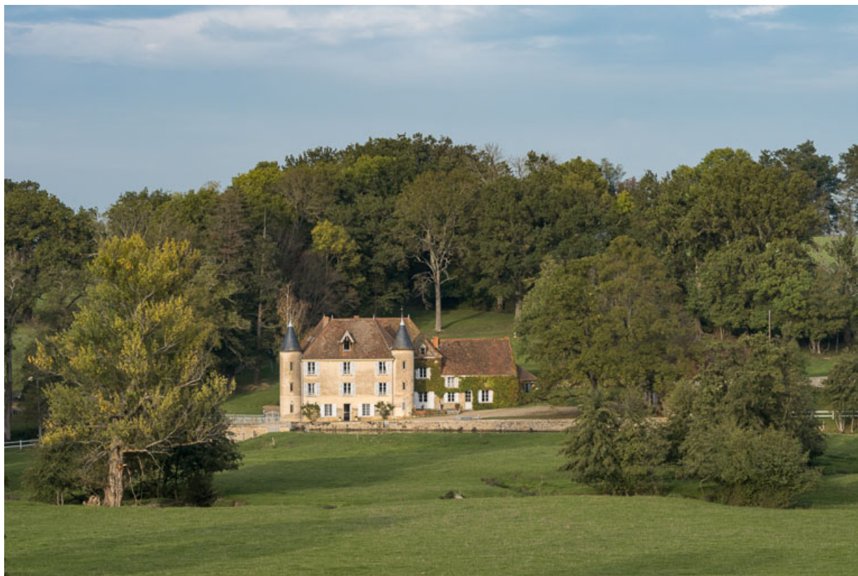
Vue de la demeure, dit "château d'Essiat", à Sarry 71, Sarry, lieudit : Essiat