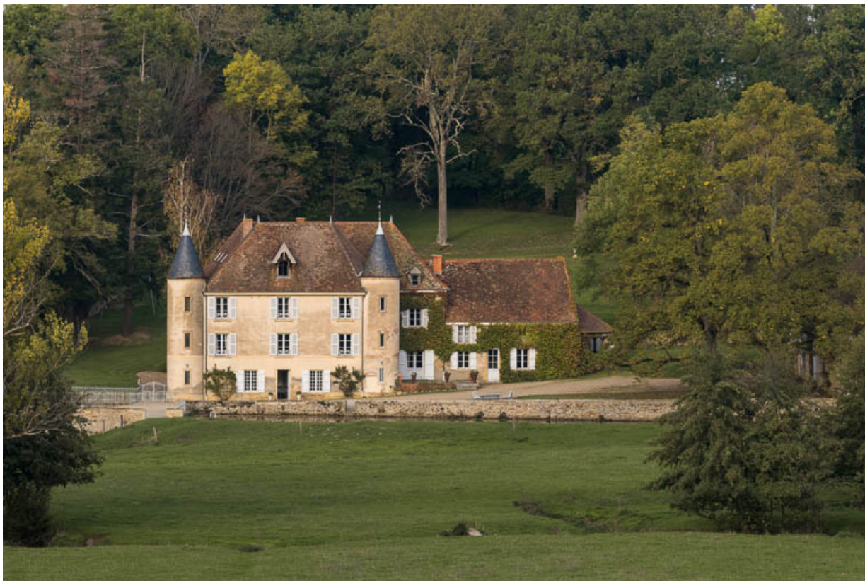
Vue de la façade antérieure de la demeure, dite "château d'Essiat", à Sarry 71, Sarry, lieudit : Essiat