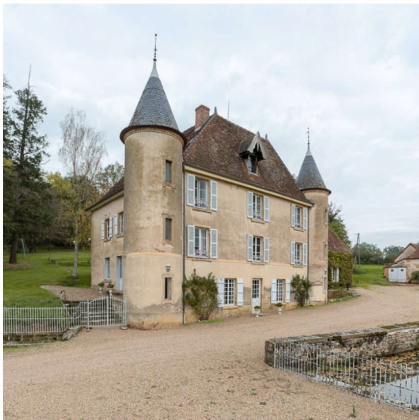
Vue de la façade antérieure du château, construite dans la deuxième moitié du XIXe siècle devant l'ancien corps de logis (fin du XVIIIe siècle).