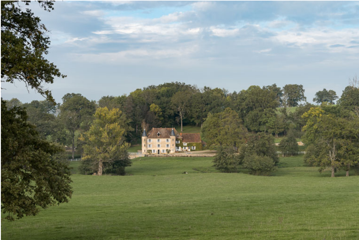
Vue de la demeure, dite "château d'Essiat", à Sarry