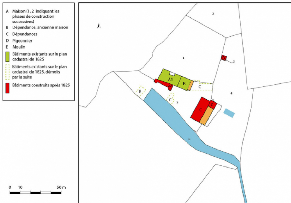
Plan de masse et de situation, présentant l'évolution des bâtiments. Extrait du plan cadastral, 2020, section B, échelle 1/5000. 71, Sarry, lieudit : Essiat