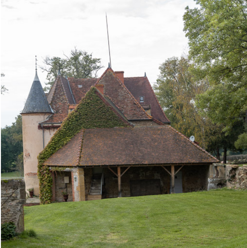
Vue de la demeure à l'est