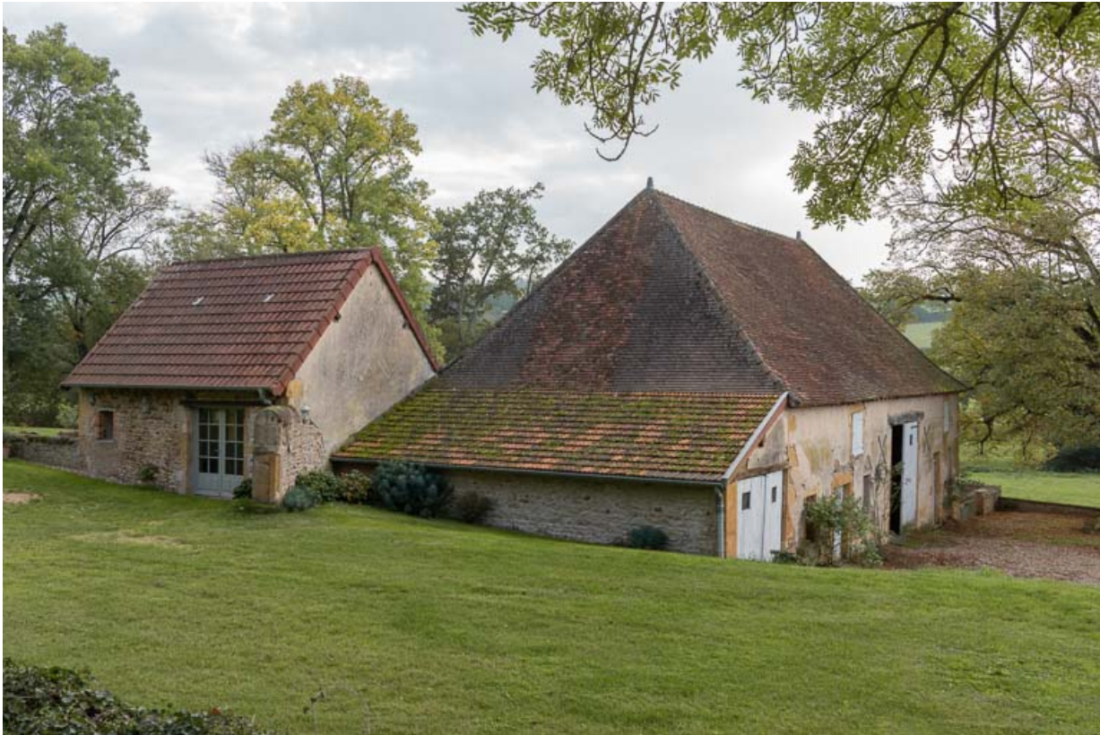
Vue des dépendances, construites dans la seconde moitié du XIXe siècle : le chenil et la grange.