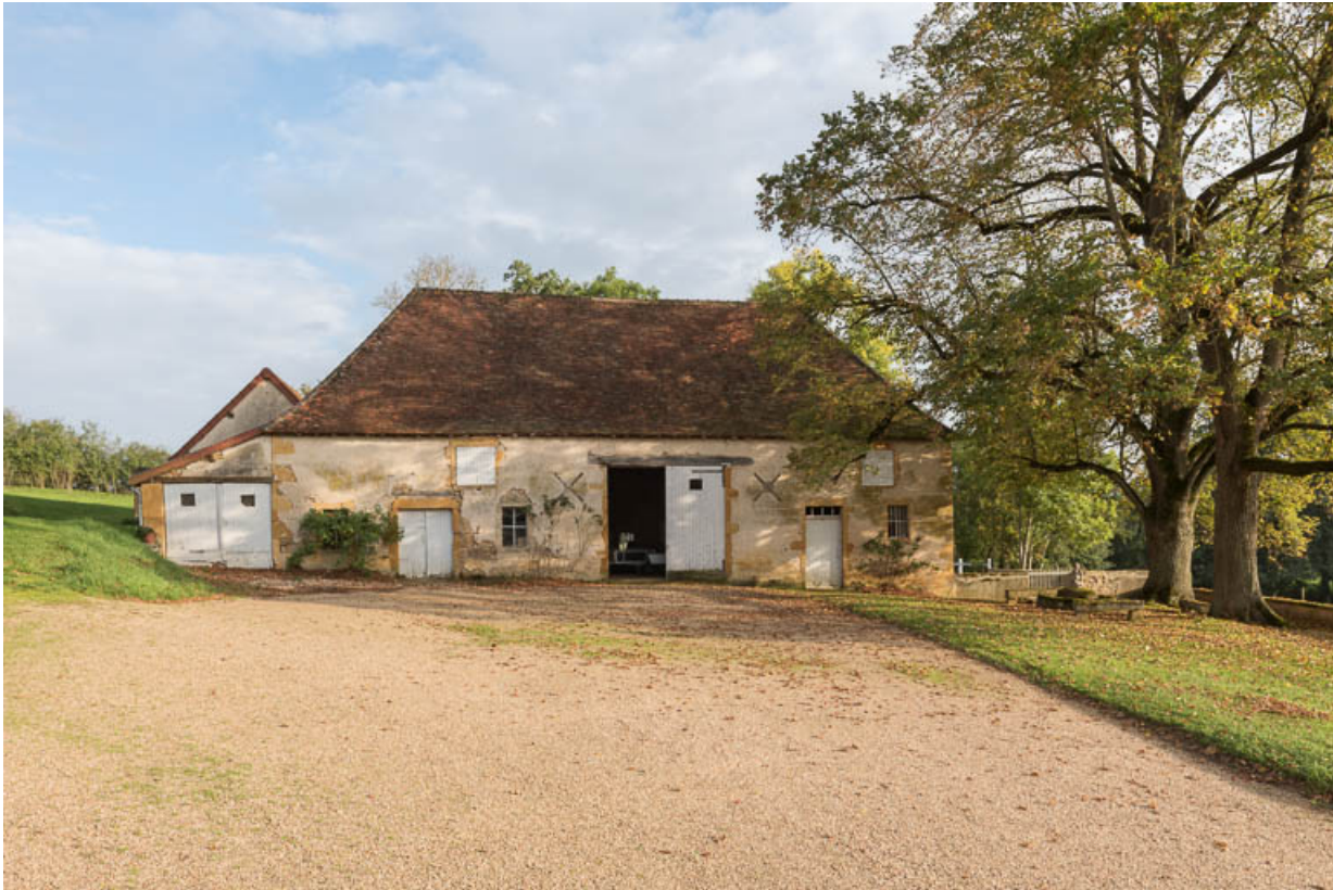
Façade antérieure de la grange