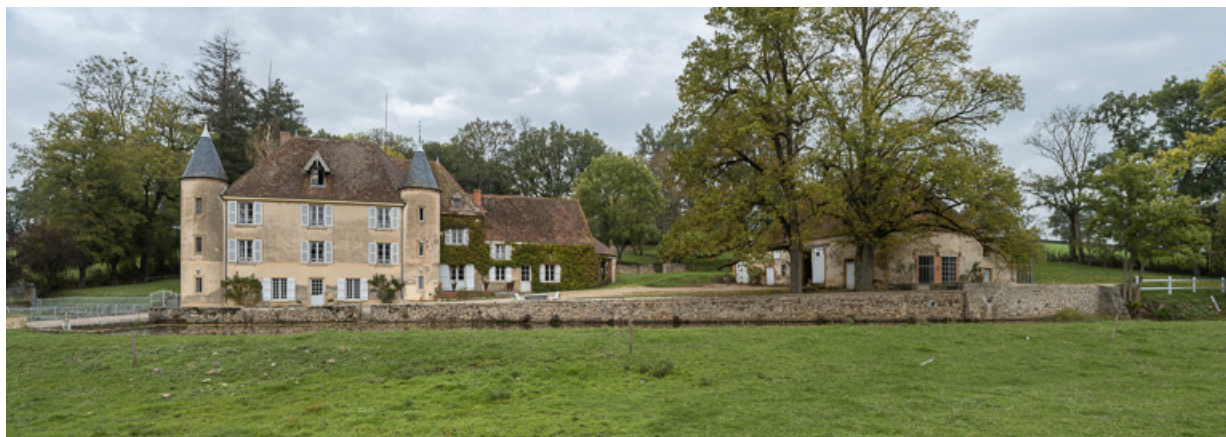
Vue de l'ensemble des bâtiments du domaine : le château, à gauche, et la grange, à droite, partiellement dissimulée par un arbre 71, Sarry, lieudit : Essiat