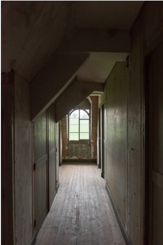
Corridor dans le comble, desservant les anciennes chambres de domestiques 71, Sarry, lieudit : Essiat