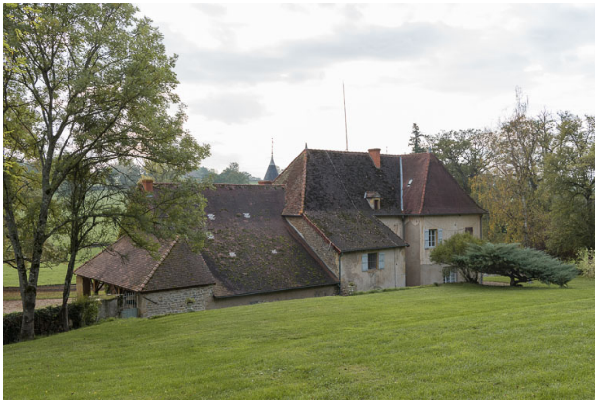
Façade postérieure du château : de gauche à droite, les bâtiments d'origine de la meunerie, en partie conservés, et la maison de maître de la fin du XVIIIe siècle avec ses toits à croupes.