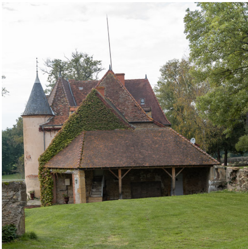
Vue de la demeure à l'est