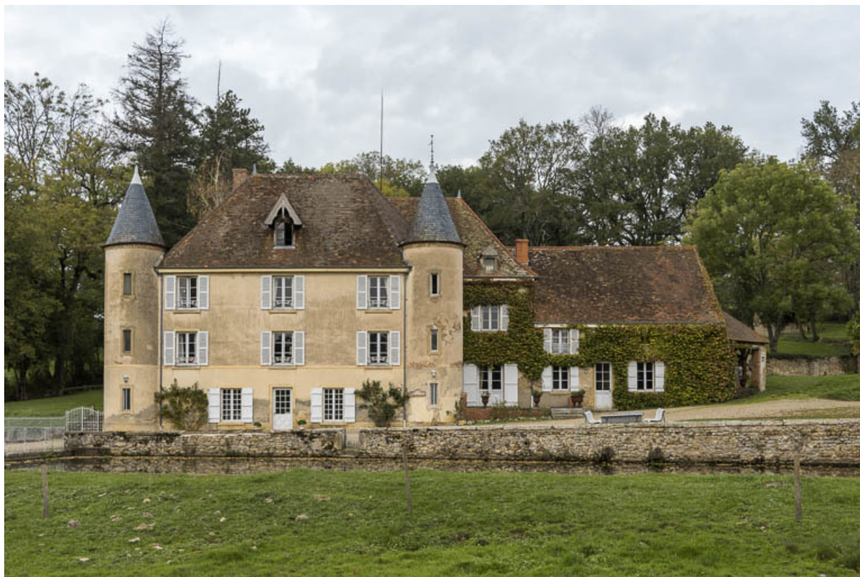
Façade antérieure du château avec ses tours d'angles, construite dans la seconde moitié du XIXe siècle devant le corps de logis de la fin du XVIIIe siècle. A droite, une partie des bâtiments d'origine (première moitié du XVIIIe siècle) a été conservée. 71, Sarry, lieudit : Essiat