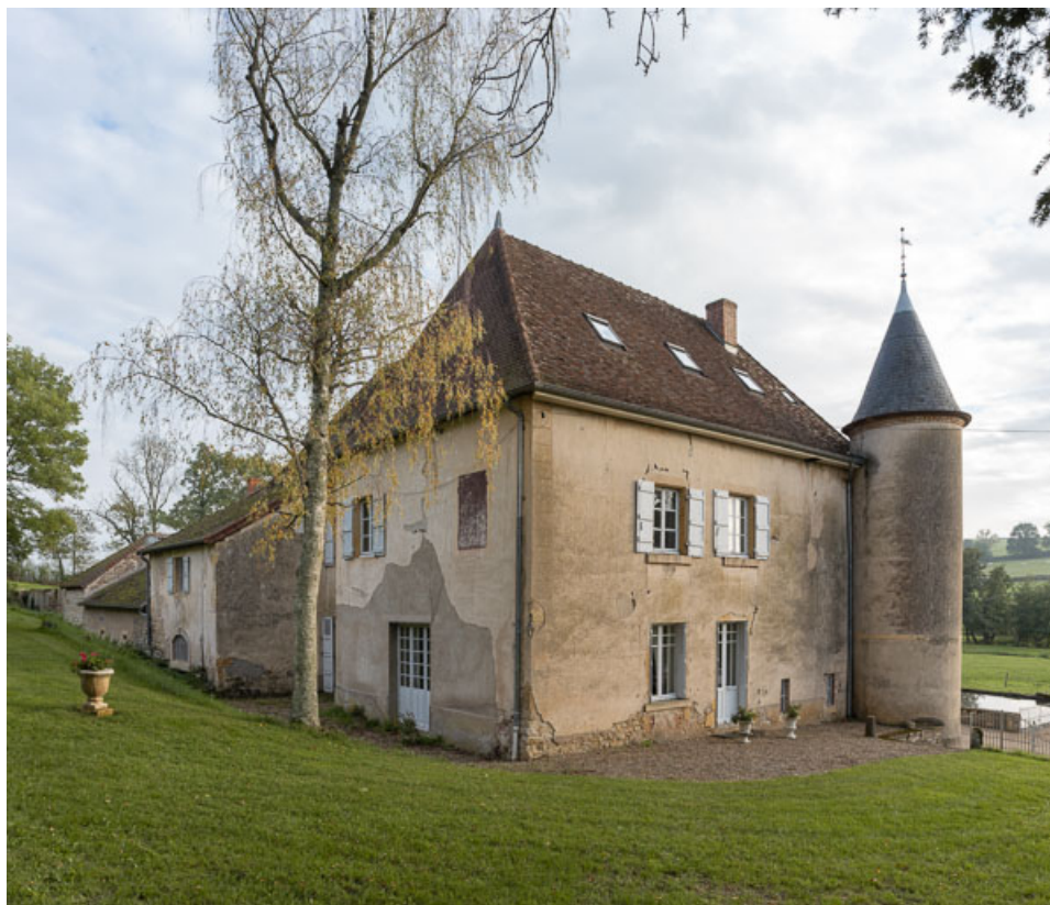
Vue des façades latérale ouest et postérieure du château (fin du XVIIIe siècle), avec une des tours d'angle de la façade antérieure du XIXe siècle.