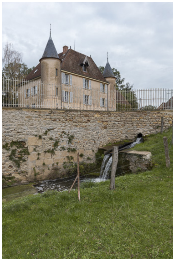
Emplacement de l'ancienne roue à aubes du moulin Gaillot, actionnée grâce au bief, alimenté par le ruisseau de la Belaine 71, Sarry, lieudit : Essiat