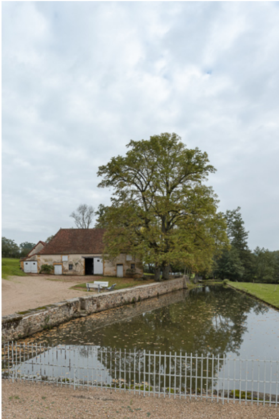
Le bief, alimenté par le ruisseau de la Belaine. A l'arrière-plan, la grange du domaine. 71, Sarry, lieudit : Essiat