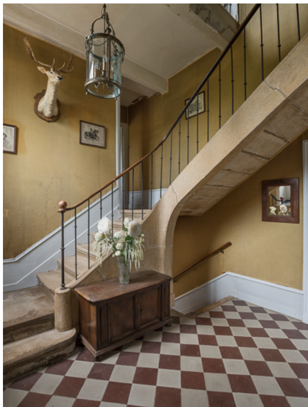
Vestibule et escalier de la demeure (Deuxième moitié du XIXe siècle) 71, Sarry, lieudit : Essiat

N° de l'illustration : 20197100421NUC4AQ