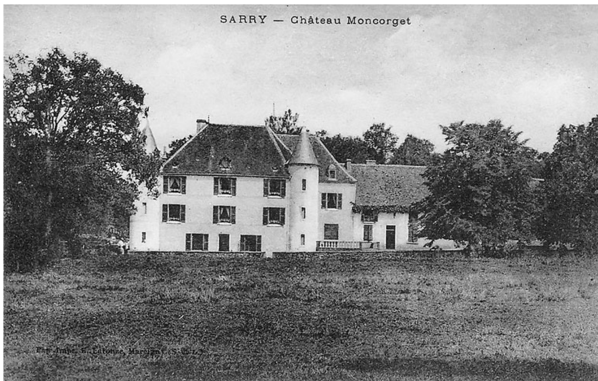
Vue de la demeure d'Essiat, dite "château Moncorget" (du nom du propriétaire), carte postale ancienne, début du XXe siècle. 71, Sarry, lieudit : Essiat