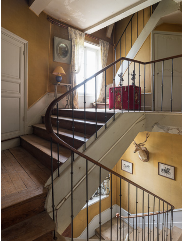
Escalier de la demeure (Deuxième moitié du XIXe siècle)