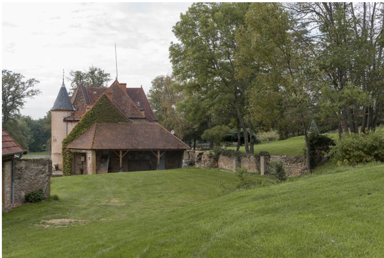
Vue de la demeure à l'est. Le muret, à droite, témoigne de l'emplacement d'anciens bâtiments de dépendances, détruits dans la première moitié du XXe siècle.