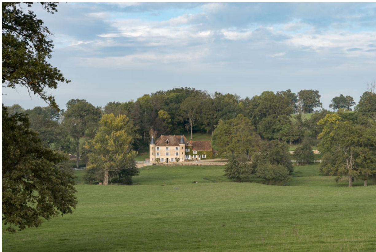
Vue de la demeure, dite "château d'Essiat", à Sarry 71, Sarry, lieudit : Essiat