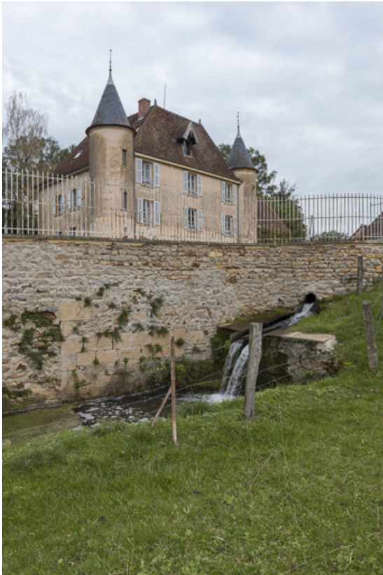
Emplacement de l'ancienne roue à aubes du moulin Gaillot, actionnée grâce au bief, alimenté par le ruisseau de la Belaine 71, Sarry, lieudit : Essiat