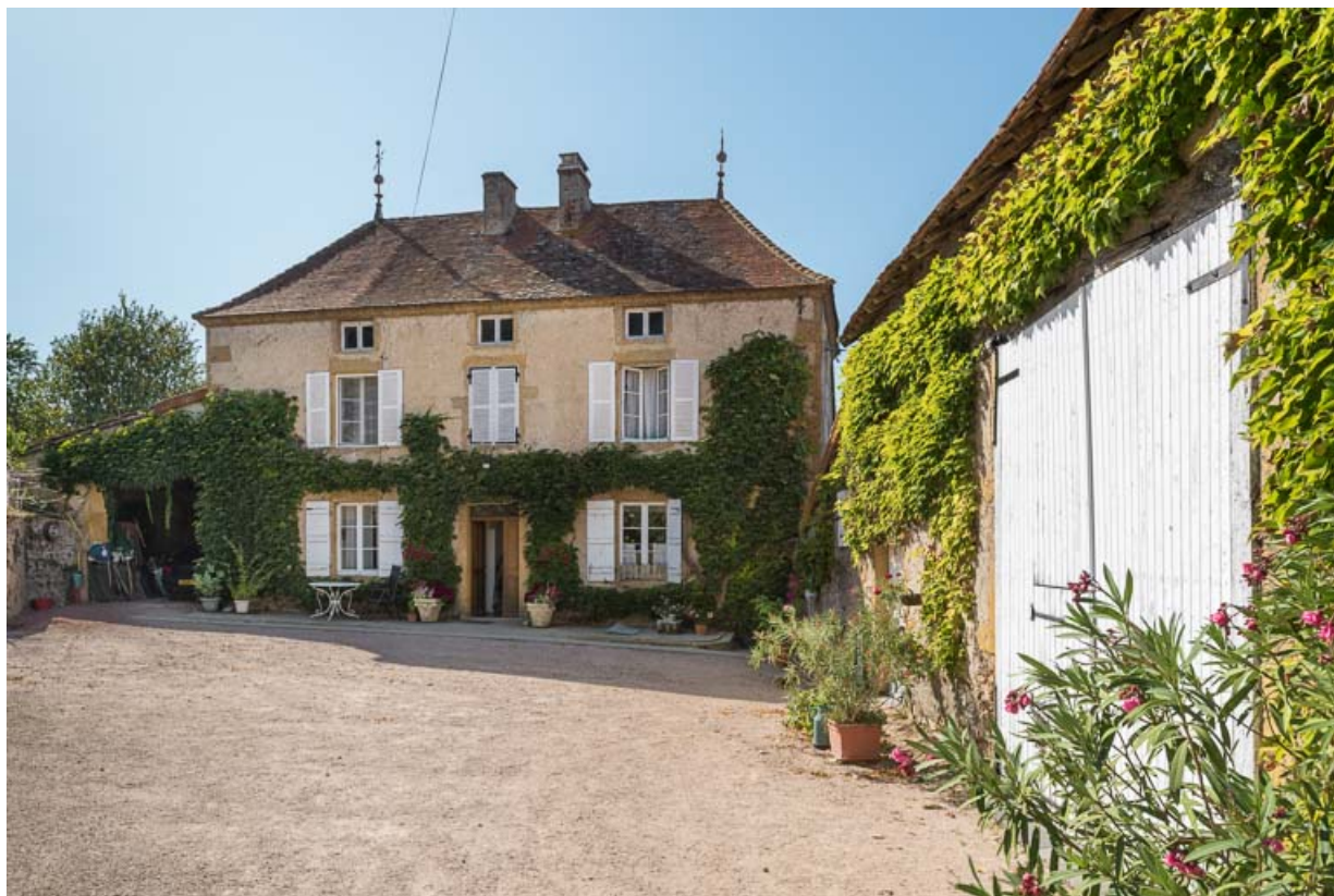
Bâtiments de ferme à Fleury : maison et grange