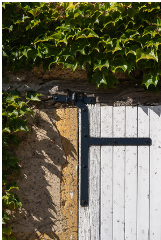
Détail de l'encadrement de la porte de la remise