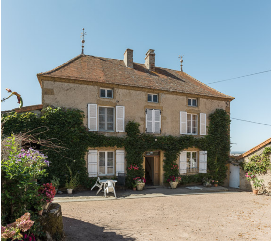
Façade antérieure de la maison