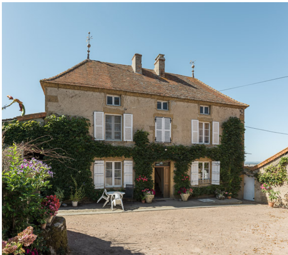
Façade antérieure de la maison