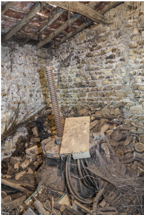
Ancien pressoir, sous l'appentis, contre la façade sud de la maison 71, Sarry, lieudit : Fleury