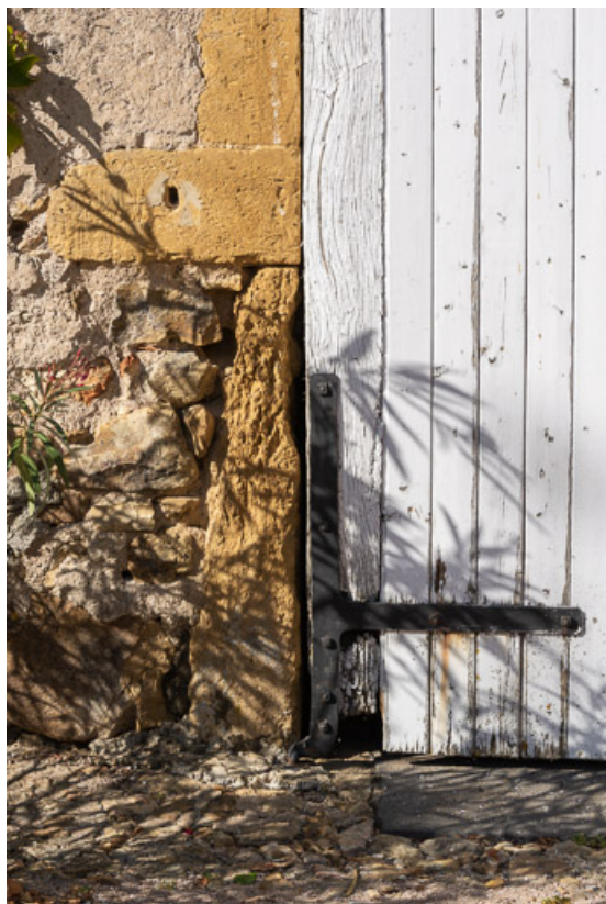
Détail de l'encadrement de la porte de la remise