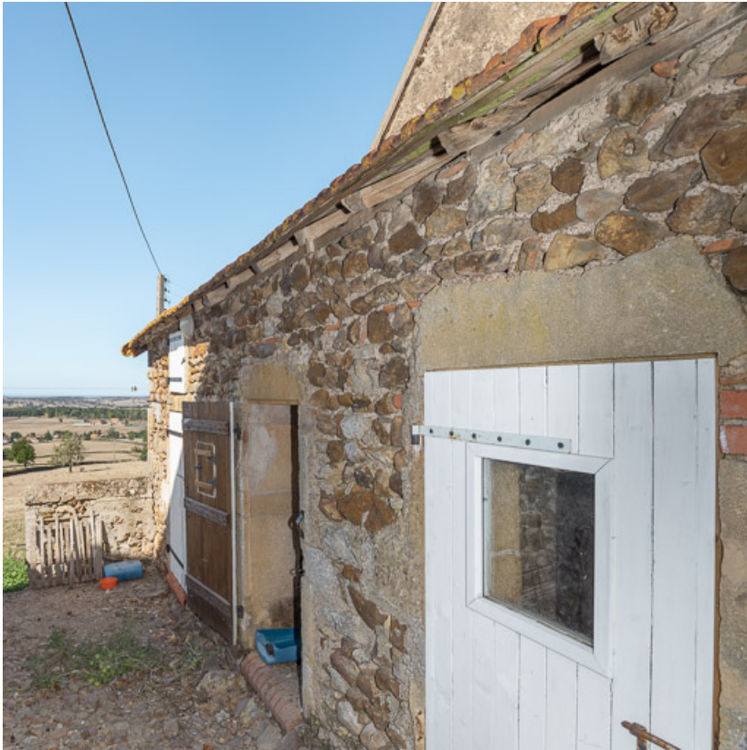
Appentis contre le mur-pignon ouest de la grange abritant des soues à cochons et un pigeonier dans le comble 71, Sarry, lieudit : Fleury