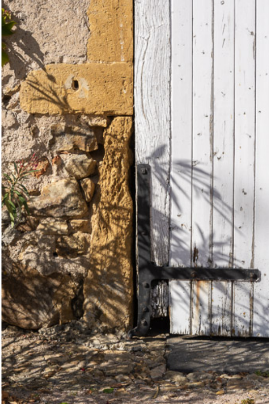
Détail de l'encadrement de la porte de la remise