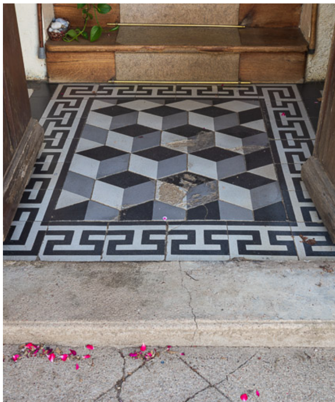
Sol du petit vestibule de la maison, en carreaux de grès céram de la manufacture Paul Charnoz de Paray-le-Monial (fin du XIXe s. - déb. du XXe s.)