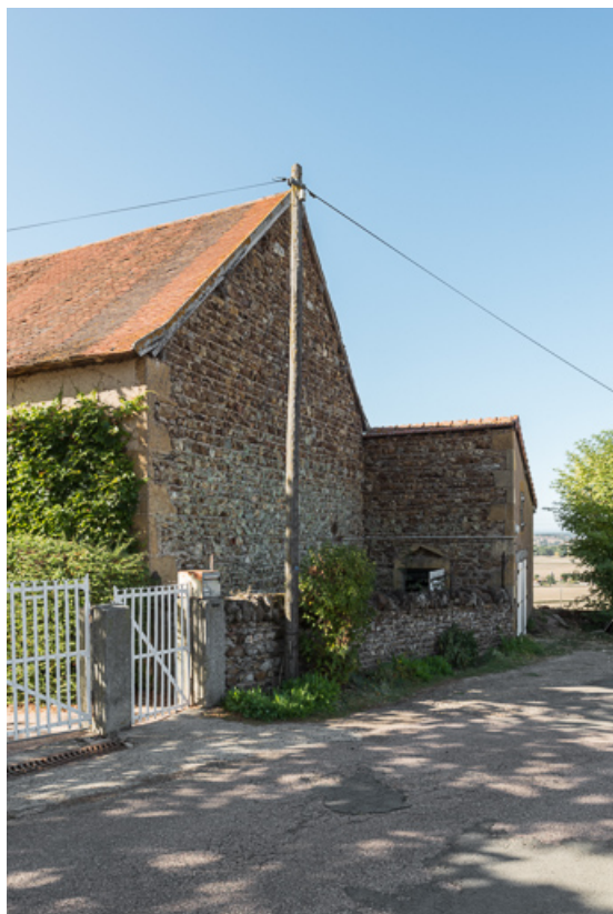
Vue du mur pignon est de la grange et de l'étable, construite en appentis, à l'arrière du bâtiment principal 71, Sarry, lieudit : Fleury