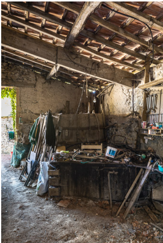
Ancienne cuve à vin, sous l'appentis, contre la façade sud de la maison 71, Sarry, lieudit : Fleury