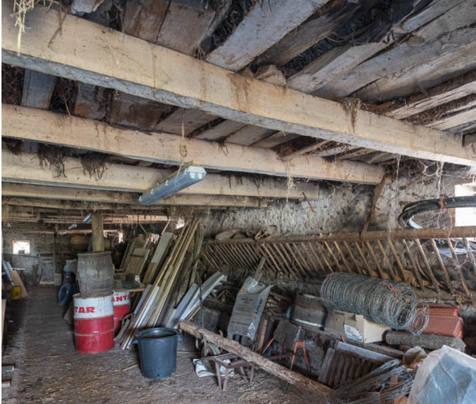
Intérieur de l'étable en appentis, à l'arrière de la grange