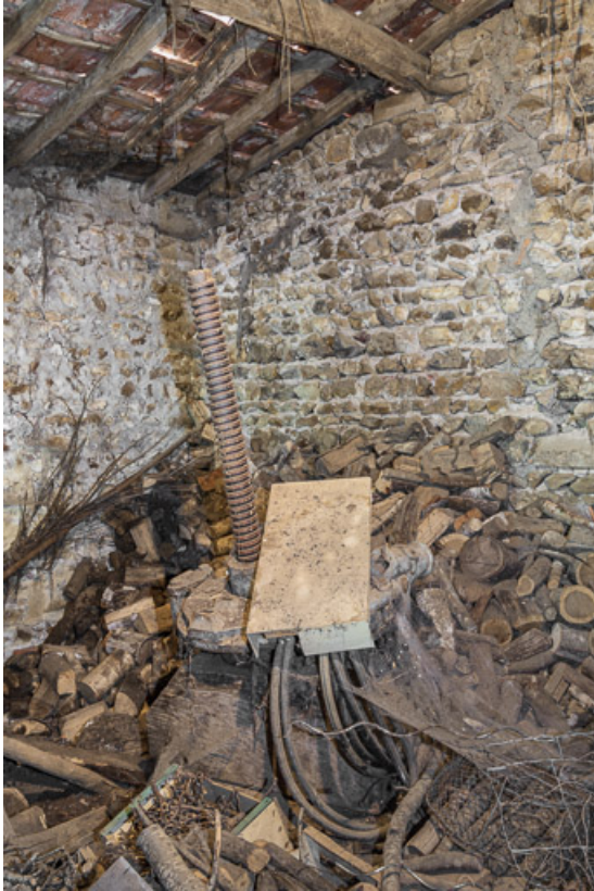
Ancien pressoir, sous l'appentis, contre la façade sud de la maison 71, Sarry, lieudit : Fleury