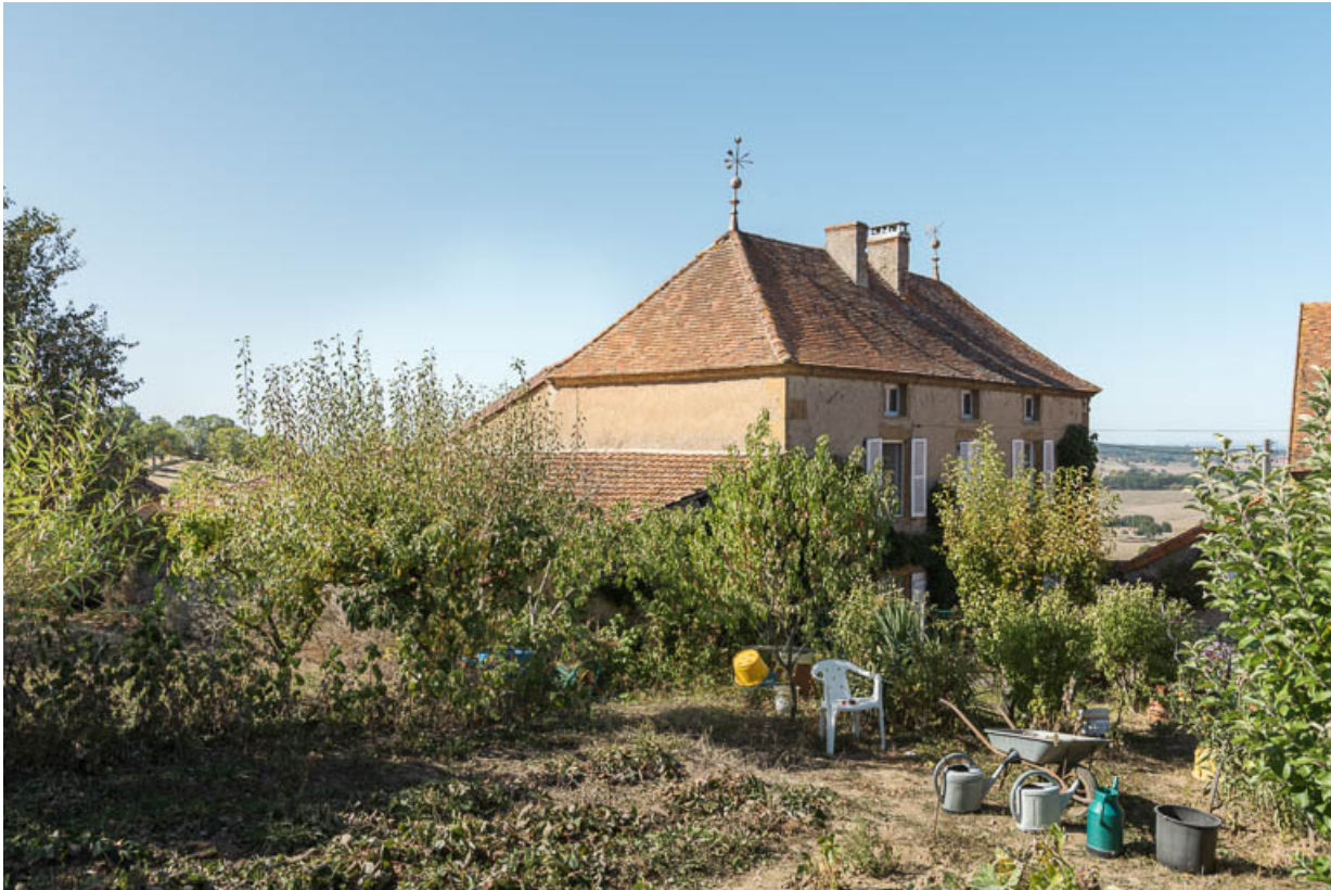
Vue de la maison au sud, depuis le jardin potager