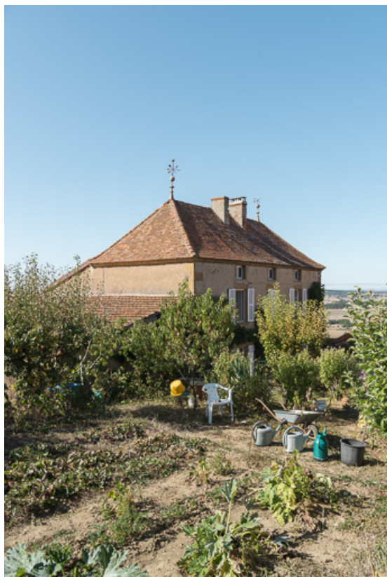
Vue de la maison au sud, depuis le jardin potager