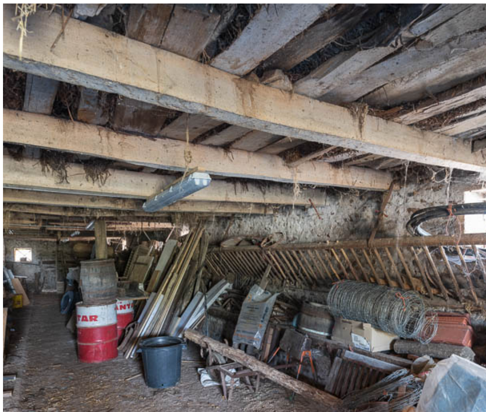
Intérieur de l'étable en appentis, à l'arrière de la grange 71, Sarry, lieudit : Fleury

N° de l'illustration : 20197100366NUC4AQ