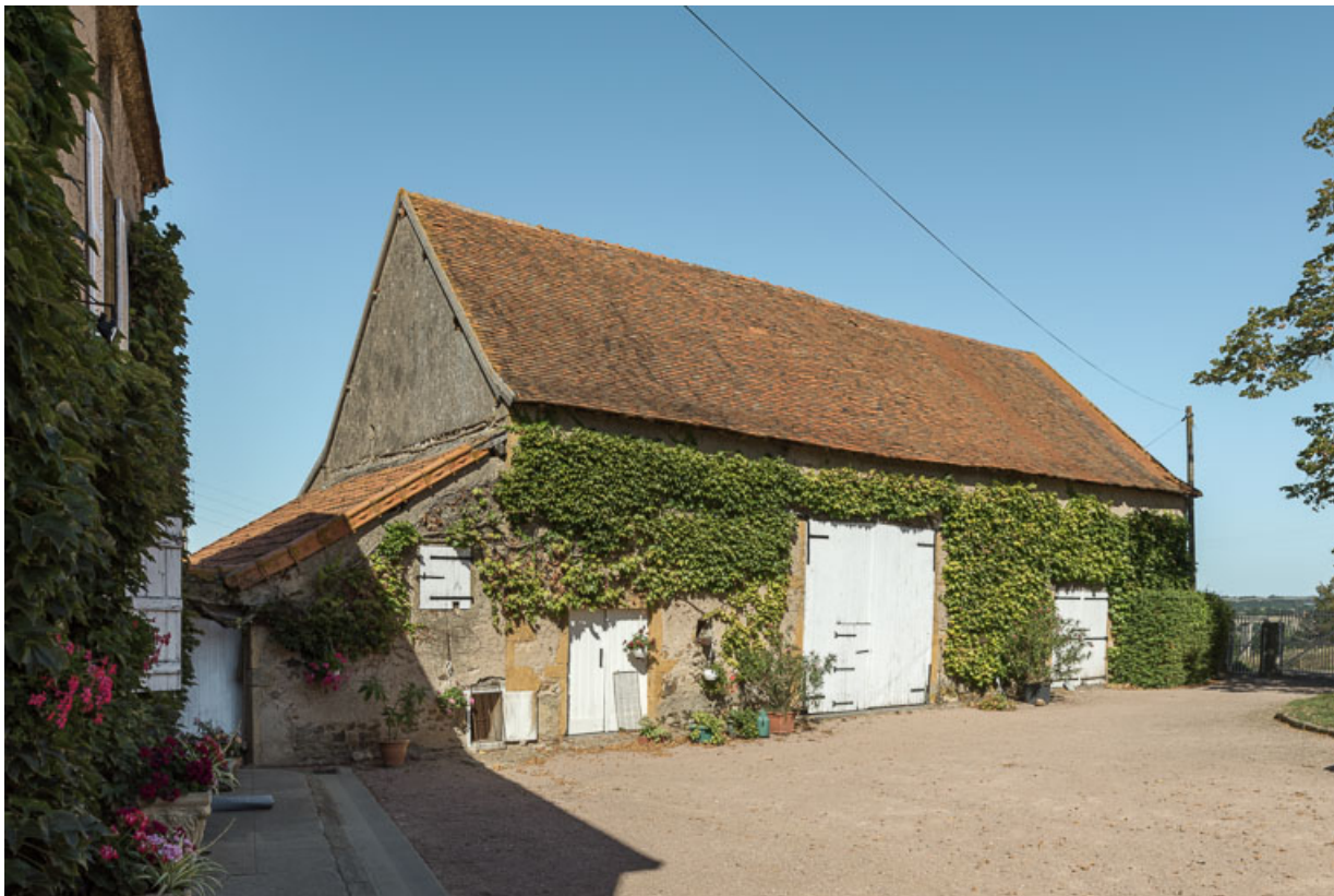
Façade antérieure de la grange