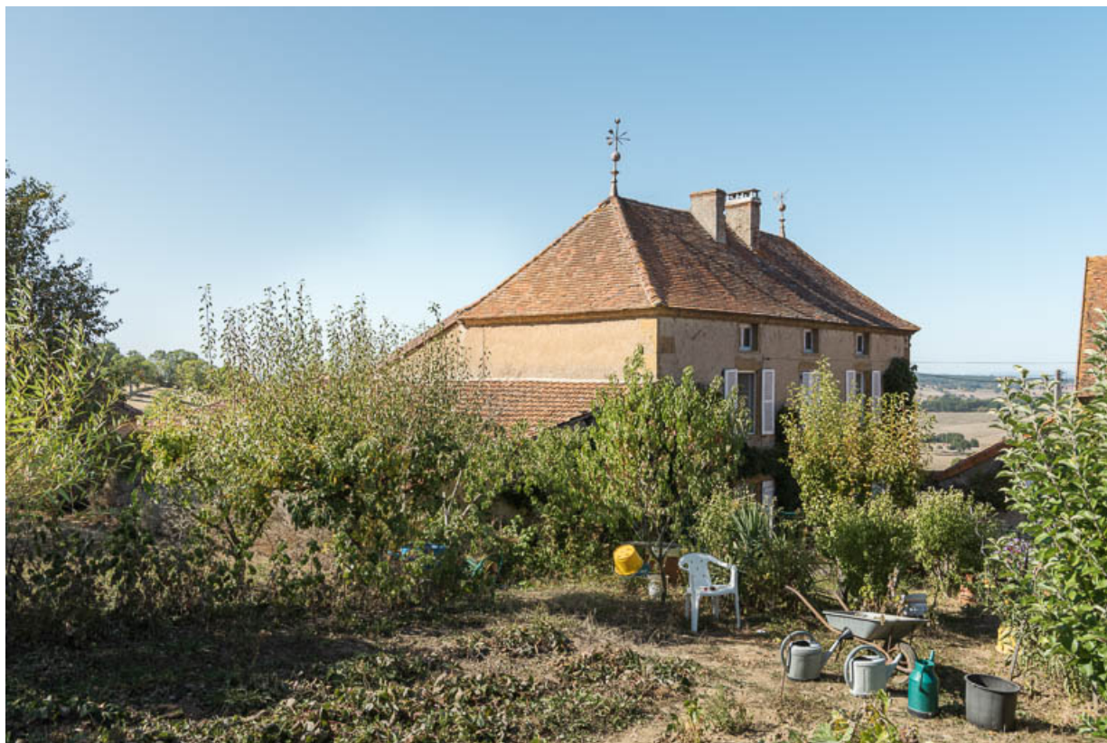
Vue de la maison au sud, depuis le jardin potager