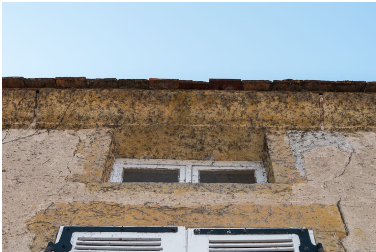
Détail d'une travée et de la corniche de la façade antérieure de la maison