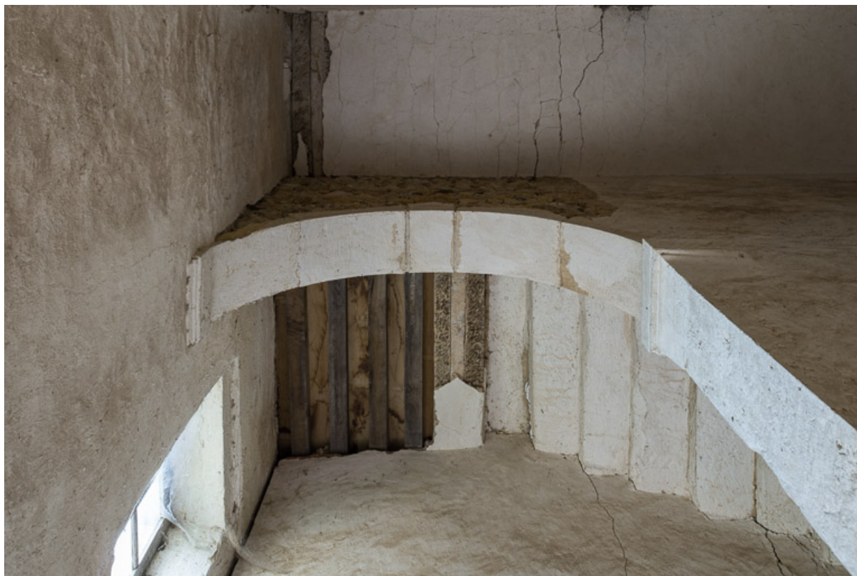
Arche ouvrant sur l'escalier de la demeure