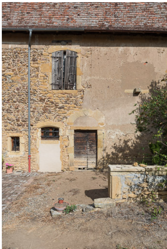
Travée centrale de la façade postérieure de la maison