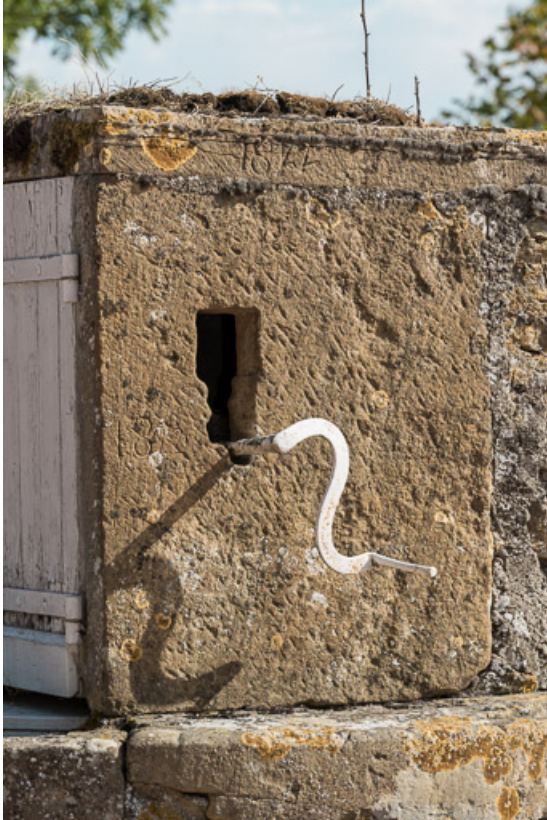
Détail du puits : superstructure avec la date "1822" gravée en partie haute 71, Saint-Julien-de-Jonzy, lieudit : Parigny