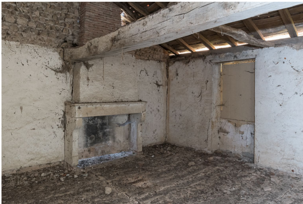
Chambre à l'étage, dans l'ancienne maison. Un plancher sépare la pièce des combles, au niveau où s'arrête l'enduit à la chaux, de couleur blanche, couvrant les murs.

71, Saint-Julien-de-Jonzy, lieudit : Parigny