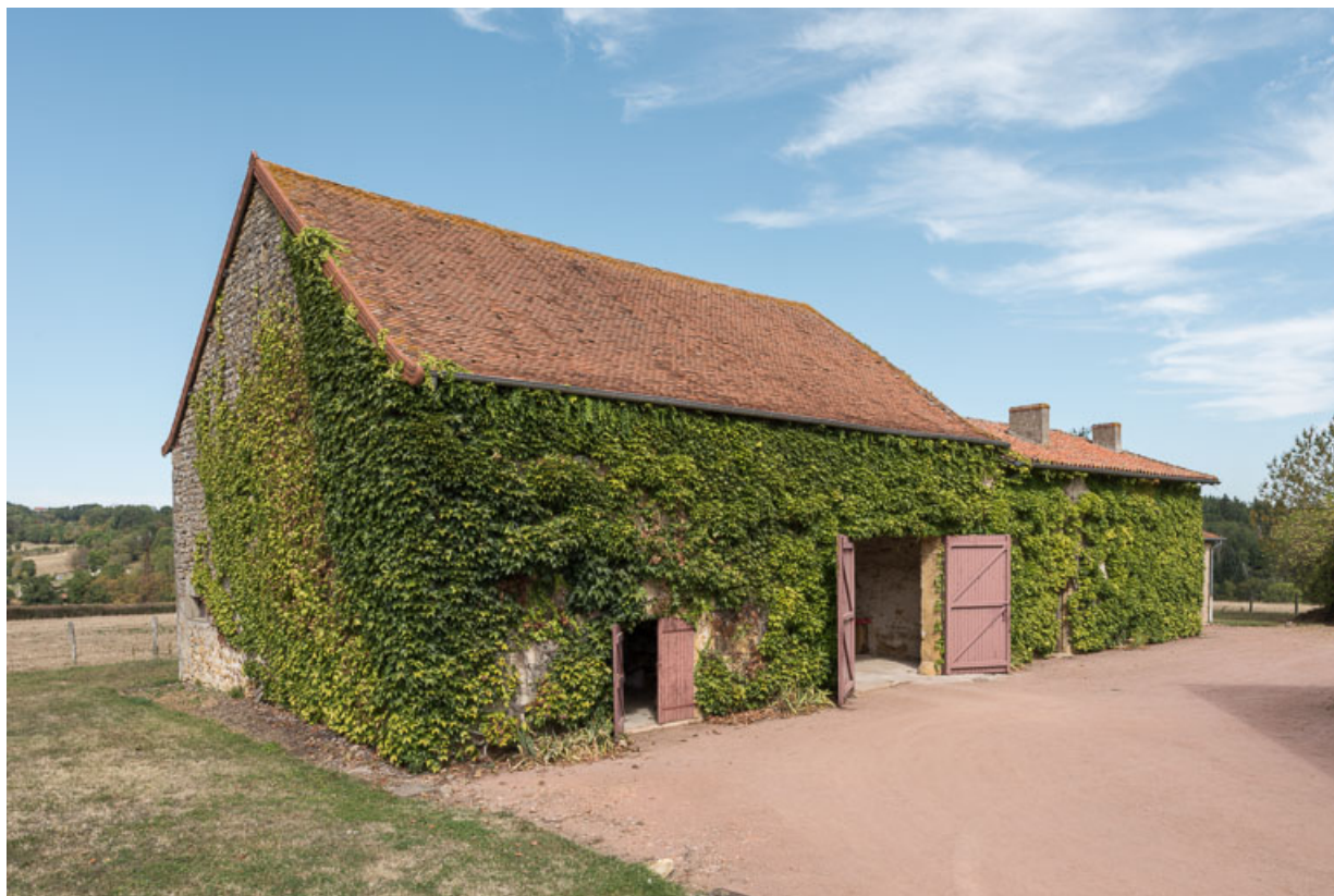
Vue de l'ensemble formé par la grange, l'ancienne maison (XVIII e siècle) et un hangar, ajouté postérieurement, depuis l'ouest 71, Saint-Julien-de-Jonzy, lieudit : Parigny