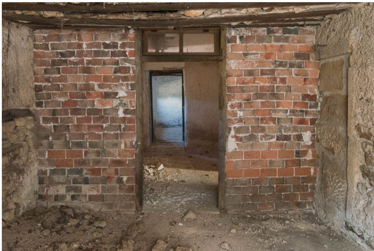
Vue intérieure de l'appentis abritant la bassie (ou arrière-cuisine). Une cloison en briques, ajoutée au XIXe siècle, a amené le bouchage d'une ancienne porte.

71, Saint-Julien-de-Jonzy, lieudit : Parigny