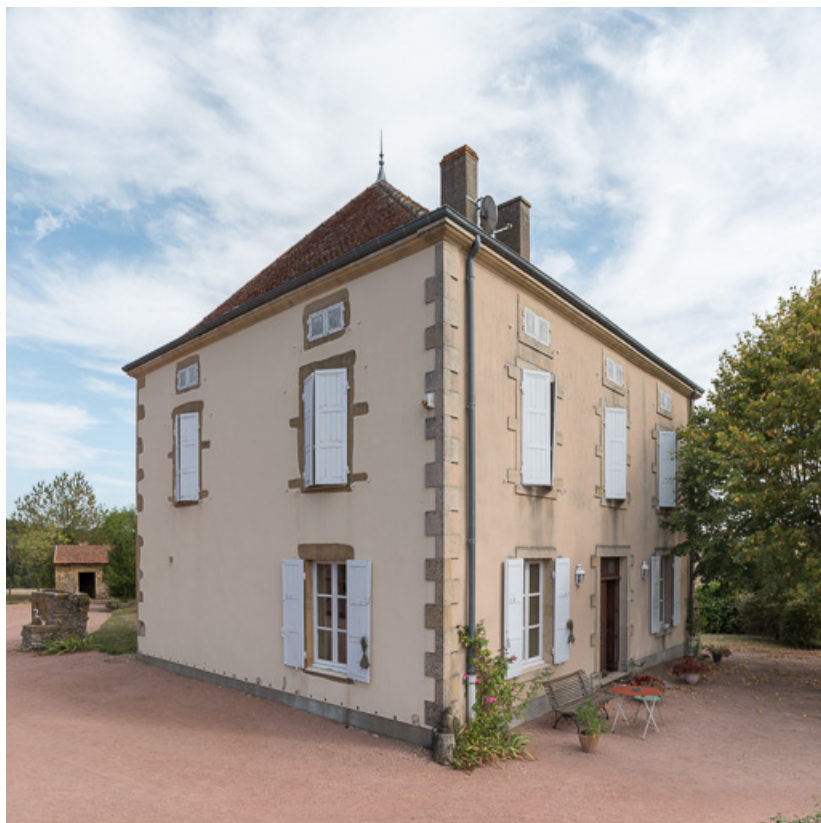
Vue de la façade antérieure de la demeure, construite à la fin du XIXe siècle, et de sa façade latérale ouest 71, Saint-Julien-de-Jonzy, lieudit : Parigny

N° de l'illustration : 20197100336NUC4AQ