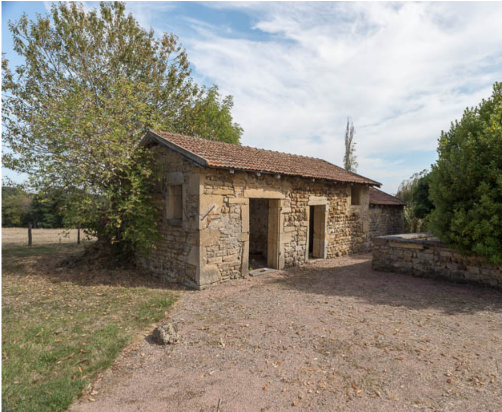
Vue du bâtiment abritant le four à pain et les soues à cochons, à l'est de la cour 71, Saint-Julien-de-Jonzy, lieudit : Parigny

N° de l'illustration : 20197100343NUC4AQ