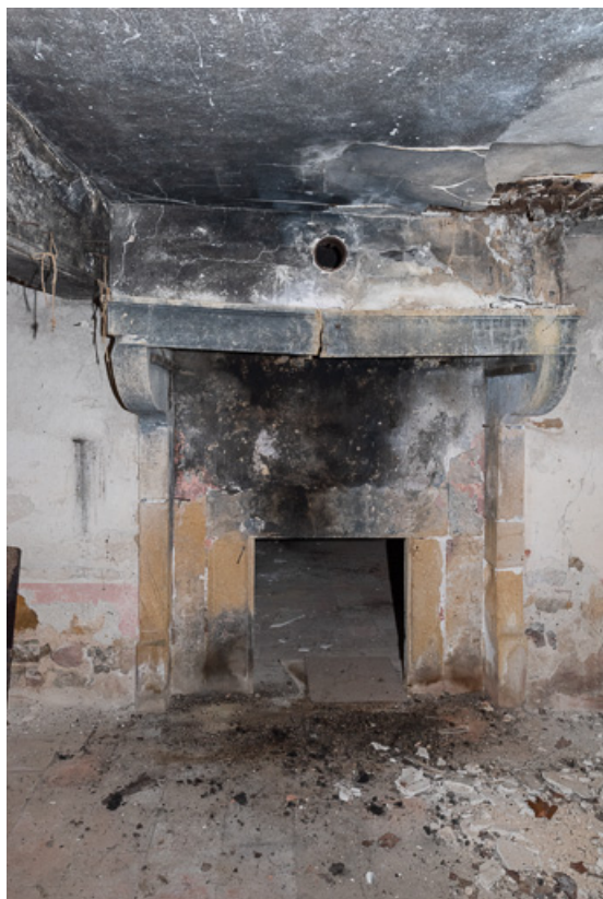
Vue de la cheminée de la cuisine, dans l'ancienne maison. Il s'agit d'un foyer double, donnant à la fois dans la cuisine et dans la pièce voisine. L'âtre est percé d'une ouverture, fermée d'une plaque en fonte. Ce type de cheminée est assez répandu dans l'architecture rurale du Brionnais des XVIIIe et XIXe siècles.

71, Saint-Julien-de-Jonzy, lieudit : Parigny