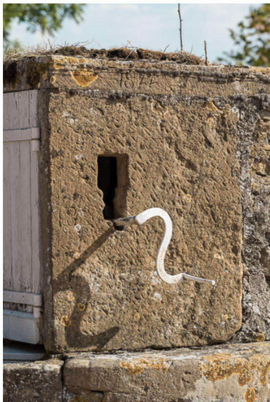
Détail du puits : superstructure avec la date "1822" gravée en partie haute 71, Saint-Julien-de-Jonzy, lieudit : Parigny