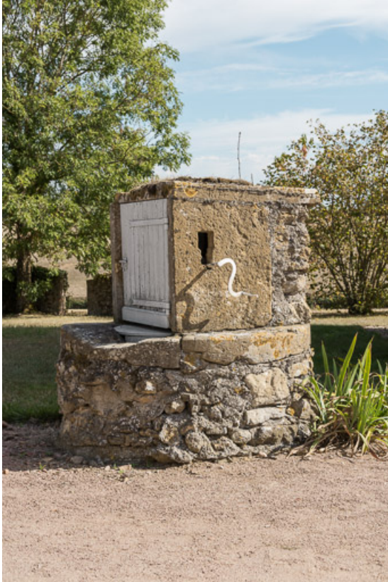
Vue du puits, dans la cour

71, Saint-Julien-de-Jonzy, lieudit : Parigny