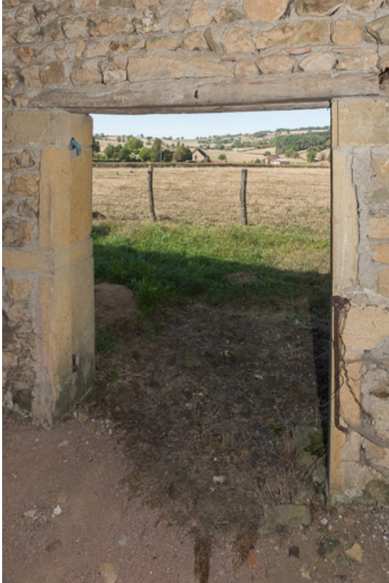
Vue du paysage environnant, depuis l'ouverture au fond du hangar

71, Saint-Julien-de-Jonzy, lieudit : Parigny