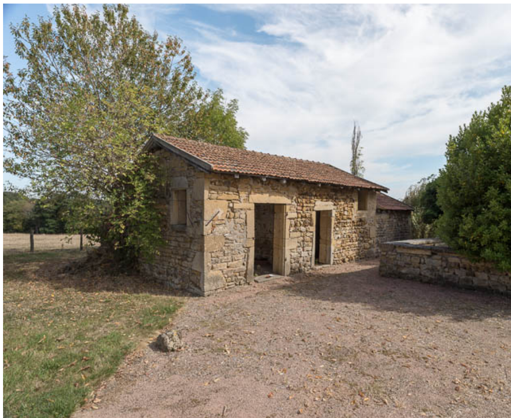
Vue du bâtiment abritant le four à pain et les soues à cochons, à l'est de la cour 71, Saint-Julien-de-Jonzy, lieudit : Parigny

N° de l'illustration : 20197100343NUC4AQ