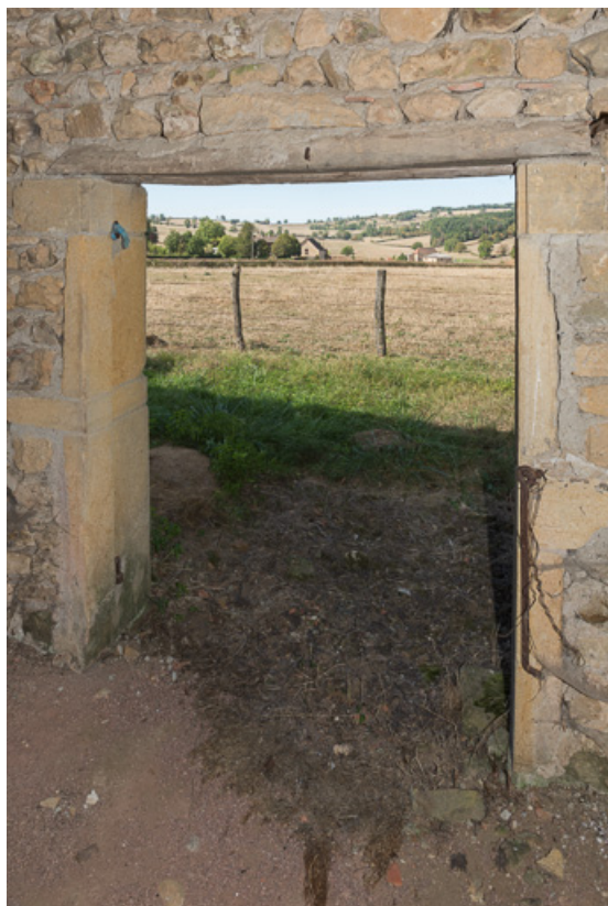
Vue du paysage environnant, depuis l'ouverture au fond du hangar

71, Saint-Julien-de-Jonzy, lieudit : Parigny