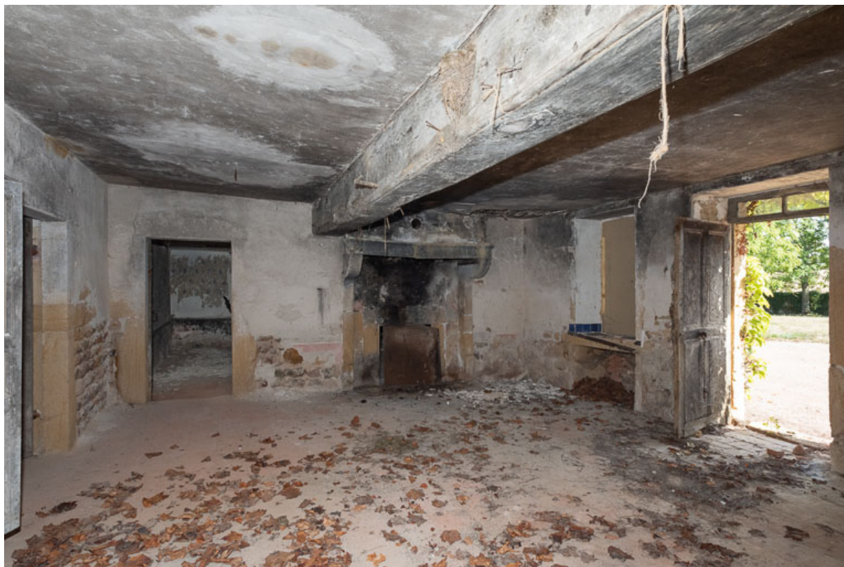
Vue de la pièce principale (cuisine) de l'ancienne maison

71, Saint-Julien-de-Jonzy, lieudit : Parigny