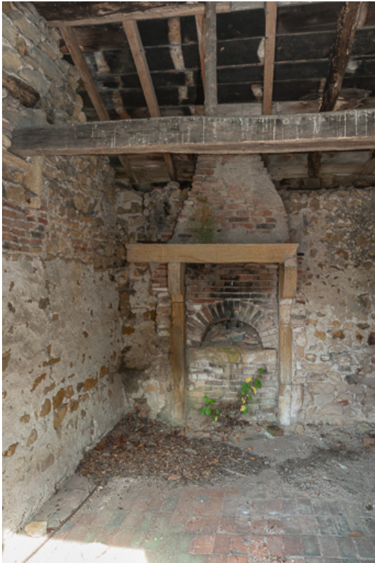
Vue intérieure du four à pain

71, Saint-Julien-de-Jonzy, lieudit : Parigny