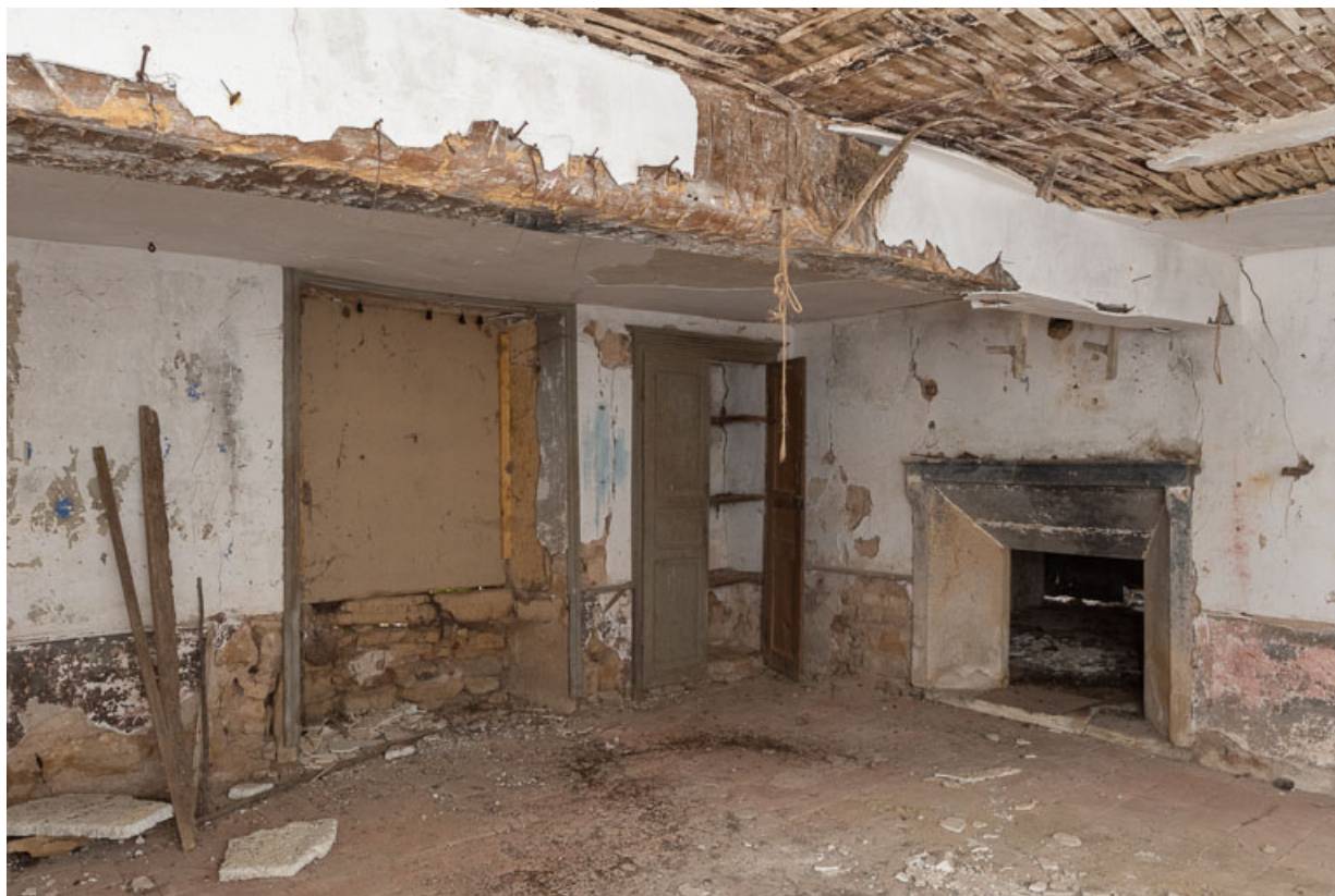
Vue d'une chambre, au rez-de-chaussée de l'ancienne maison, à droite de la cuisine 71, Saint-Julien-de-Jonzy, lieudit : Parigny