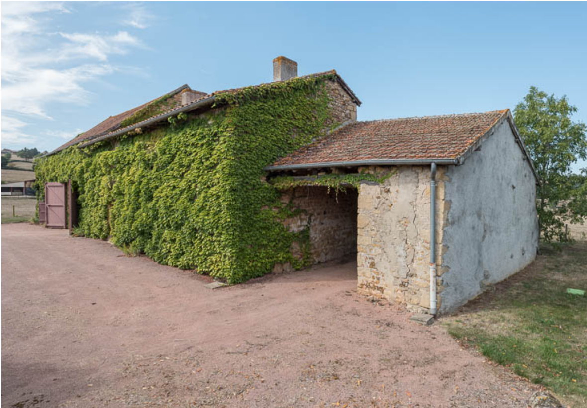
Vue du même ensemble, depuis l'est

71, Saint-Julien-de-Jonzy, lieudit : Parigny