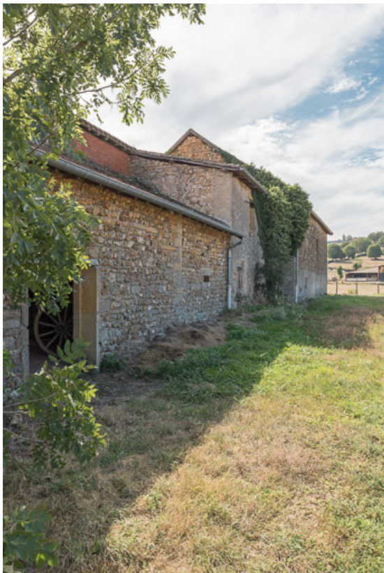
Vue de la façade postérieure du même ensemble: de gauche à droite, le hangar agricole, l'ancienne maison avec son appentis et la grange

71, Saint-Julien-de-Jonzy, lieudit : Parigny