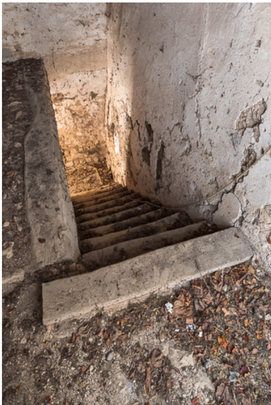
Escalier de l'ancienne maison, à deux volées droites

71, Saint-Julien-de-Jonzy, lieudit : Parigny