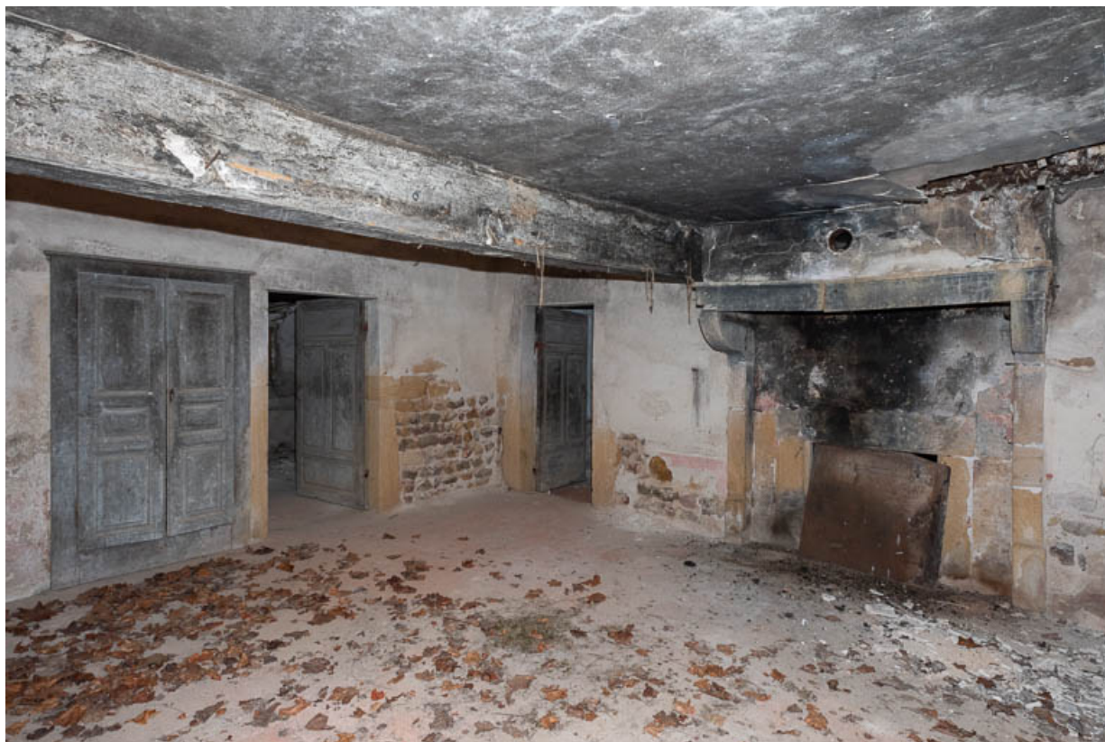
Vue de la pièce principale (cuisine) de l'ancienne maison

71, Saint-Julien-de-Jonzy, lieudit : Parigny