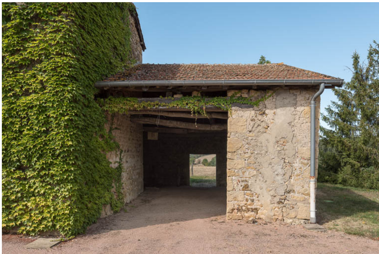
Vue du hangar agricole, construit contre le mur-pignon est de l'ancienne maison

71, Saint-Julien-de-Jonzy, lieudit : Parigny