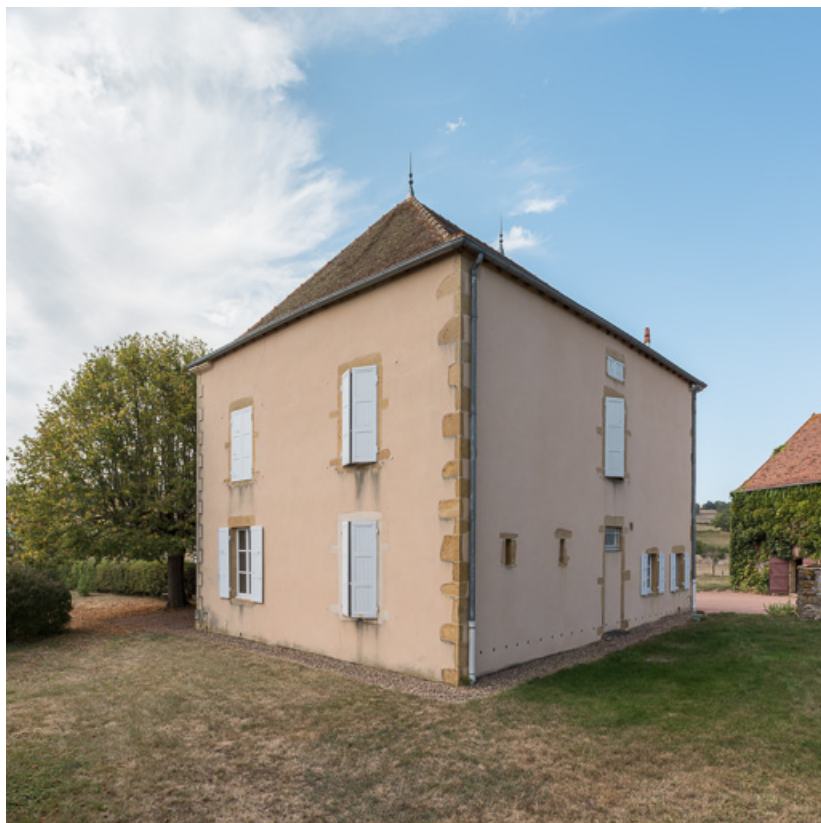
Vue de la façade postérieure de la demeure et de sa façade latérale est 71, Saint-Julien-de-Jonzy, lieudit : Parigny

N° de l'illustration : 20197100339NUC4AQ