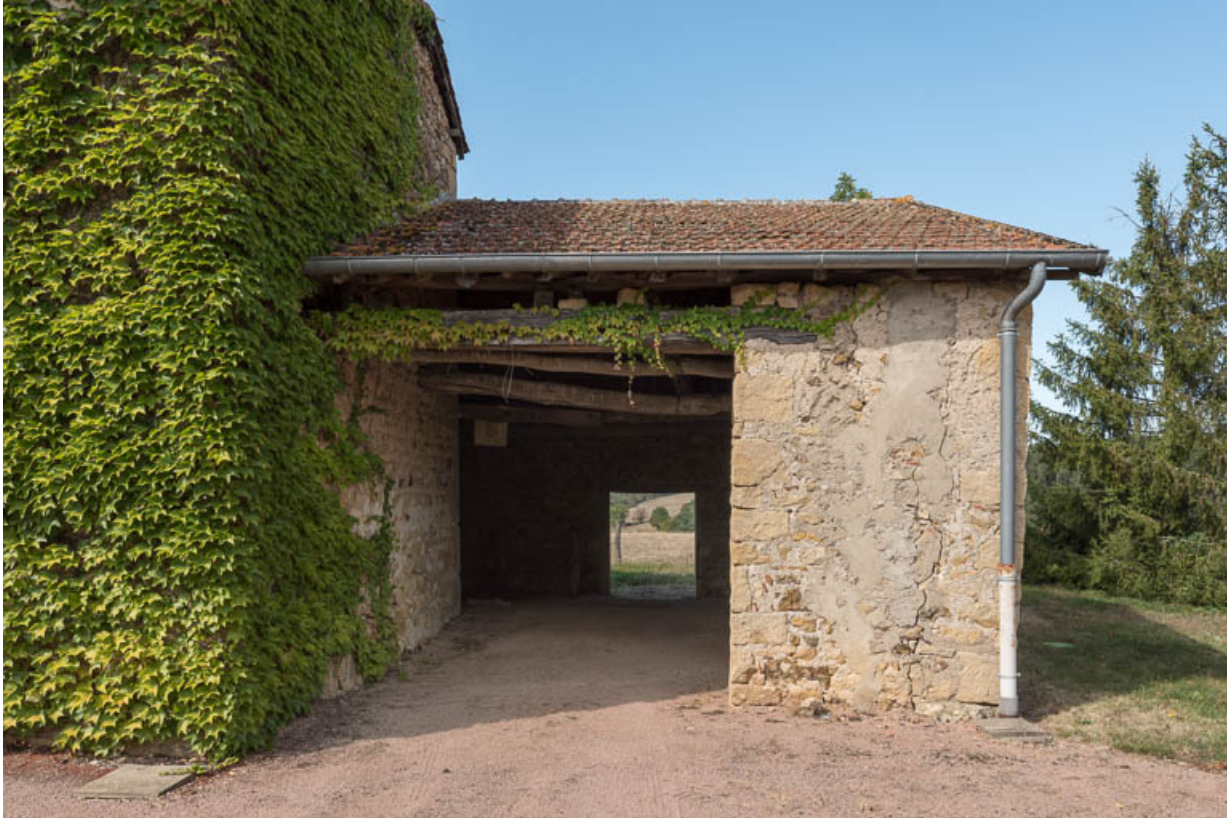
Vue du hangar agricole, construit contre le mur-pignon est de l'ancienne maison

71, Saint-Julien-de-Jonzy, lieudit : Parigny