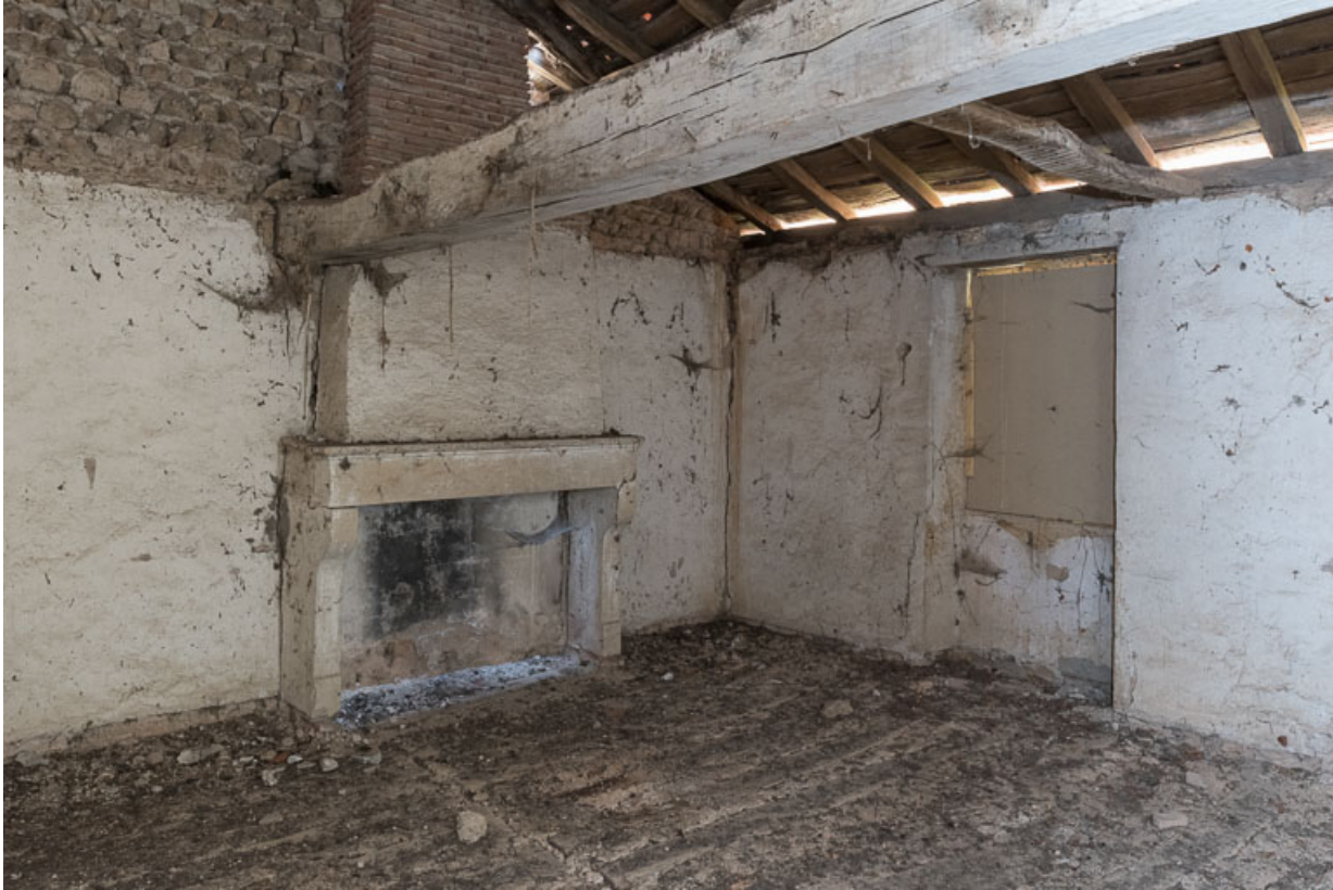
Chambre à l'étage, dans l'ancienne maison. Un plancher sépare la pièce des combles, au niveau où s'arrête l'enduit à la chaux, de couleur blanche, couvrant les murs.

71, Saint-Julien-de-Jonzy, lieudit : Parigny