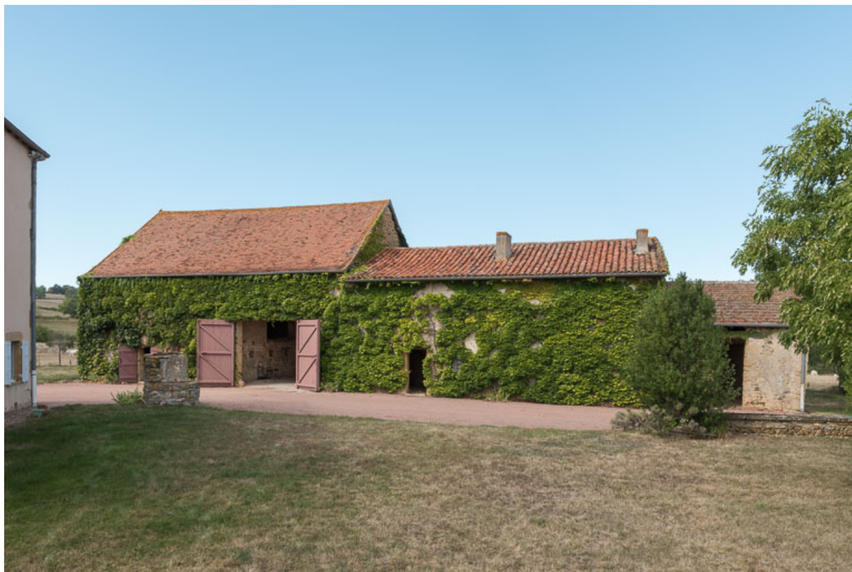
Vue du même ensemble, depuis le sud

71, Saint-Julien-de-Jonzy, lieudit : Parigny