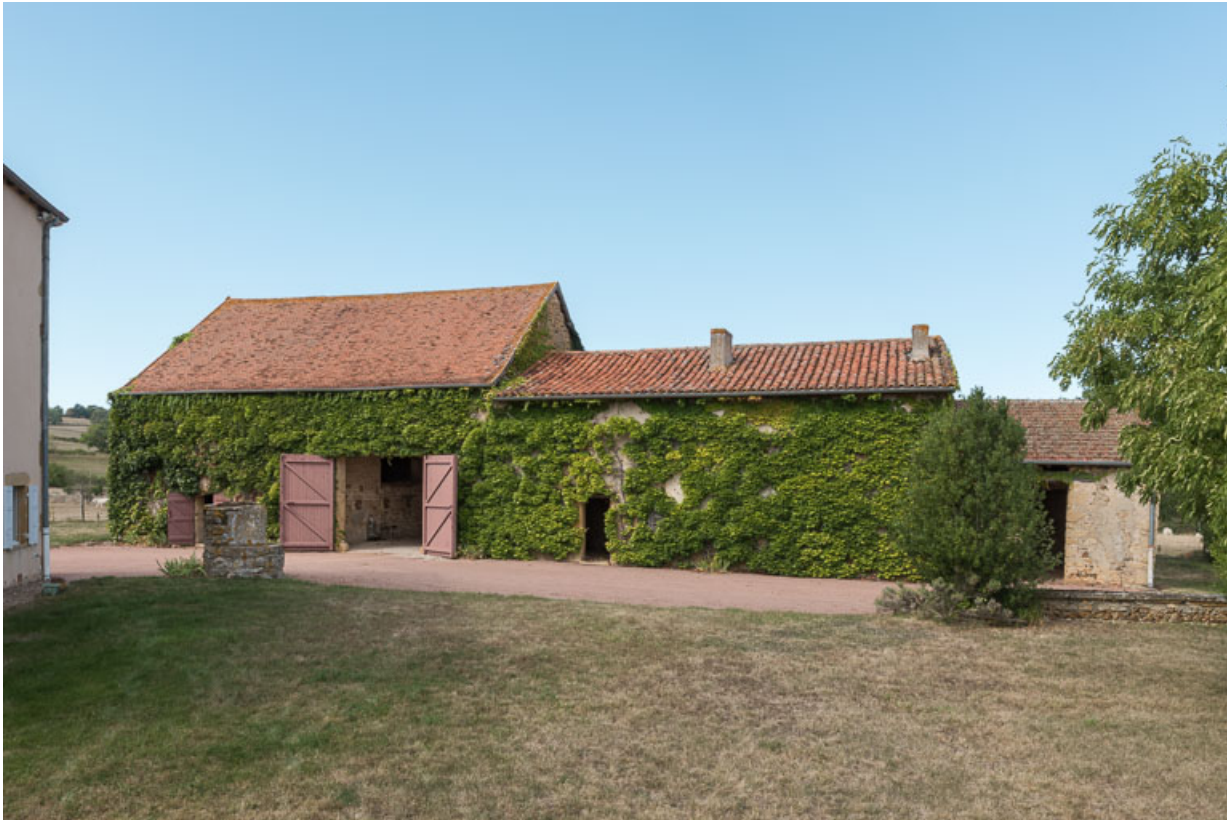
Vue du même ensemble, depuis le sud

71, Saint-Julien-de-Jonzy, lieudit : Parigny