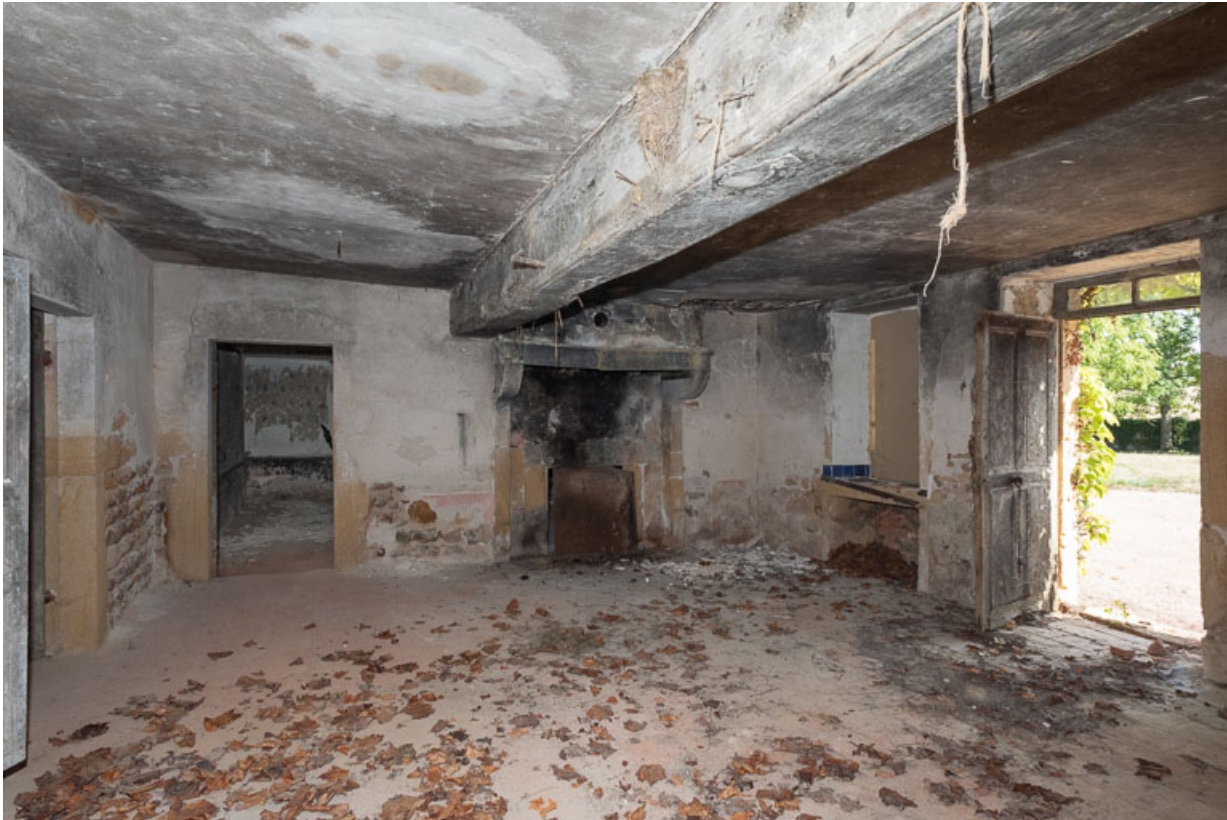
Vue de la pièce principale (cuisine) de l'ancienne maison

71, Saint-Julien-de-Jonzy, lieudit : Parigny