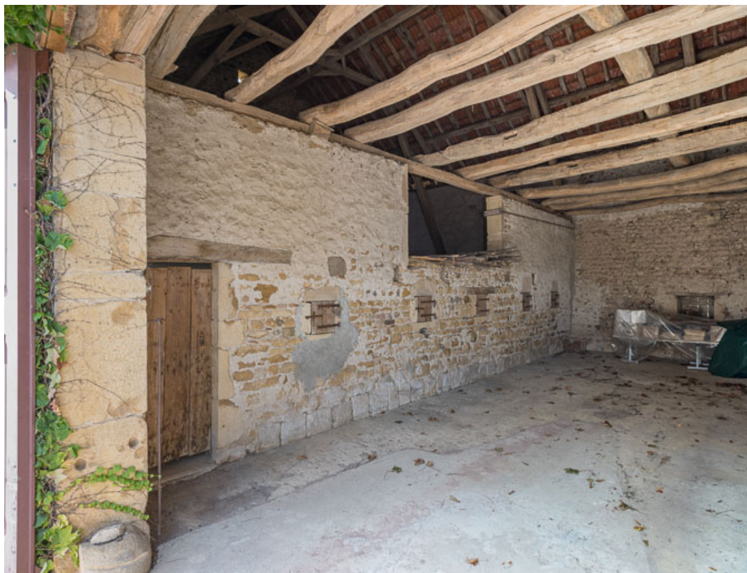
Vue intérieure de la grange. Le mur entre la remise et l'étable est percé de feurons.

71, Saint-Julien-de-Jonzy, lieudit : Parigny