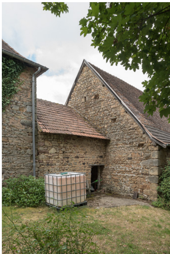
Façade postérieure de cette même remise.

71, Colombier-en-Brionnais, 55 route de Frâgne, lieudit : Frâgne