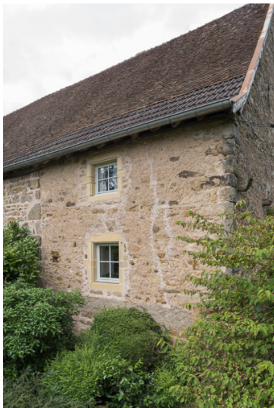
Vue de la façade postérieure de la maison. La rupture de maçonnerie montre qu'il s'agit bien d'un agrandissement de la grange primitive vers l'ouest.

71, Colombier-en-Brionnais, 55 route de Frâgne, lieudit : Frâgne