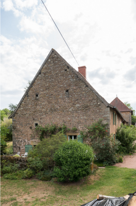
Vue du pignon de la seconde maison

71, Colombier-en-Brionnais, 55 route de Frâgne, lieudit : Frâgne