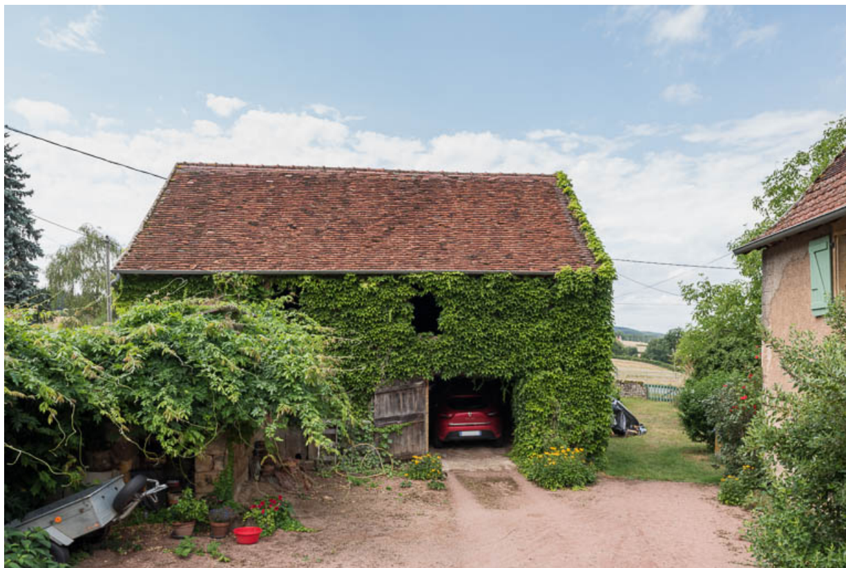
Vue de la dépendance construite au XIXe siècle, abritant une remise (ou garage) et une étable

71, Colombier-en-Brionnais, 55 route de Frâgne, lieudit : Frâgne