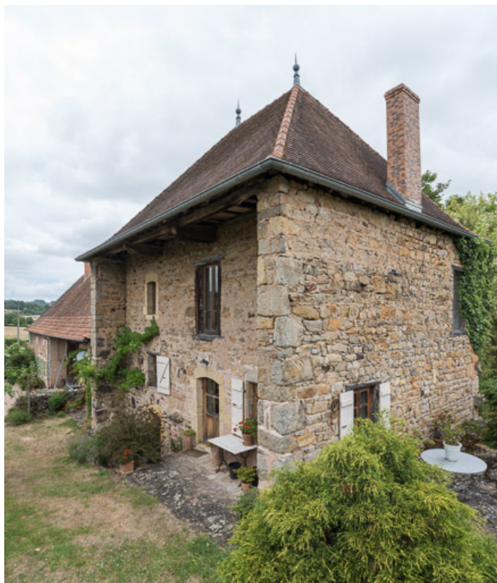
Vue d'ensemble de l'alignement. Au premier plan, la maison d'origine, construite dans le premier quart du XVIIIe siècle. 71, Colombier-en-Brionnais, 55 route de Frâgne, lieudit : Frâgne

N° de l'illustration : 20197100287NUC4AQ