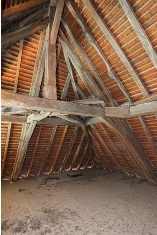
Vue de la charpente du toit à croupes de la maison

71, Colombier-en-Brionnais, 55 route de Frâgne, lieudit : Frâgne