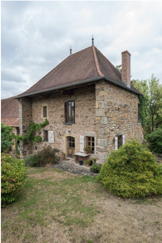
Vue des façades antérieures et latérales de la maison à l'origine de l'ensemble en alignement 71, Colombier-en-Brionnais, 55 route de Frâgne, lieudit : Frâgne