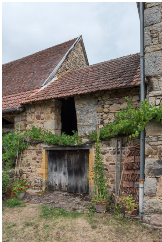
Façade antérieure de la remise, construite entre la maison et la grange primitive, après le partage de la propriété au milieu du XVIIIe siècle.

71, Colombier-en-Brionnais, 55 route de Frâgne, lieudit : Frâgne