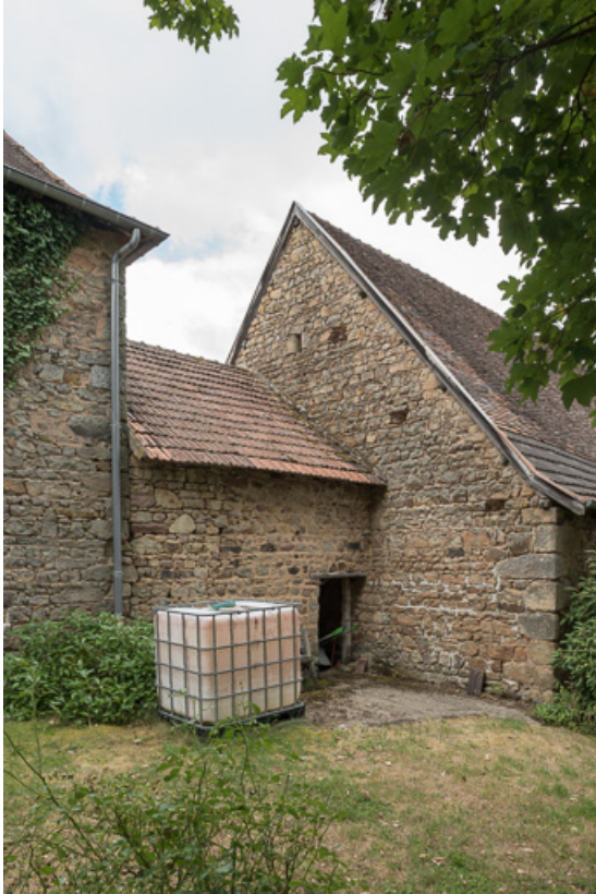
Façade postérieure de cette même remise.

71, Colombier-en-Brionnais, 55 route de Frâgne, lieudit : Frâgne