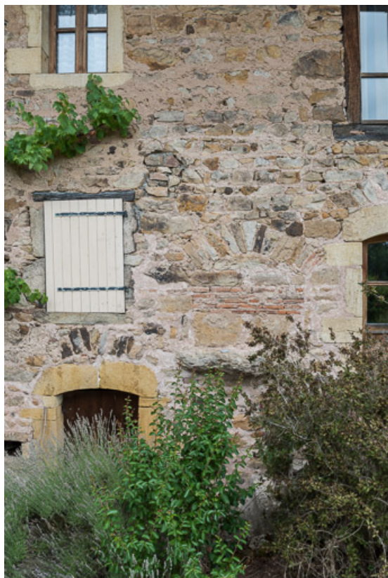
Détail de la façade antérieure de la maison. Au centre, l'évacuation de la pierre d'évier.

71, Colombier-en-Brionnais, 55 route de Frâgne, lieudit : Frâgne