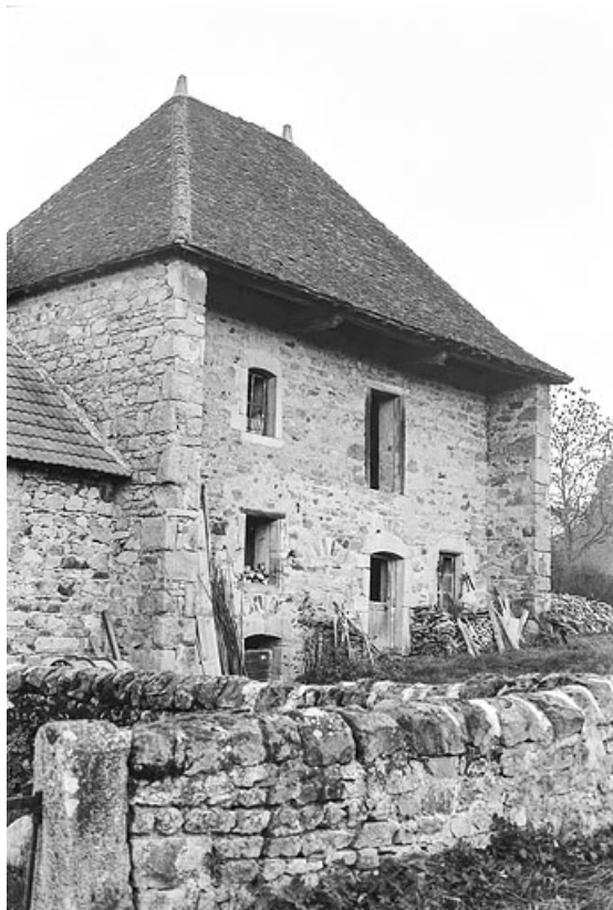
Maison, anciennement à galerie ou à balcon, à Frâgne, vers 1970.

71, Colombier-en-Brionnais, 55 route de Frâgne, lieudit : Frâgne