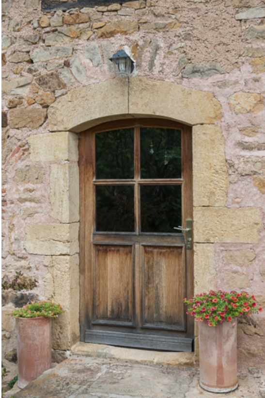
Porte d'entrée de la maison, couverte d'un arc segmentaire

71, Colombier-en-Brionnais, 55 route de Frâgne, lieudit : Frâgne