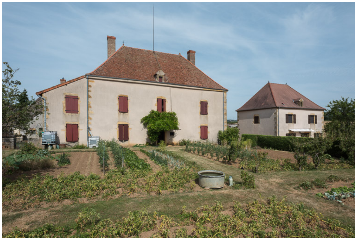
Façade postérieure de la demeure avec le jardin potager. A droite, une seconde maison a été construite dans la deuxième moitié du XIXe siècle, probablement pour abriter les fermiers en charge de l'exploitation du domaine.