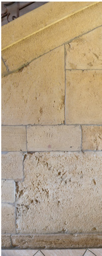
Mur d'échiffre de l'escalier, dont la maçonnerie est faite de pierre de remploi 71, Briant, lieudit : Haut de Rouy

N° de l'illustration : 20197100231NUC4AQ