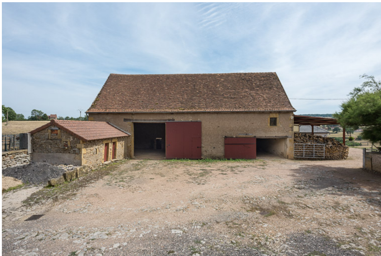
Vue du bâtiment du cuvage, au sud de la cour. A gauche, la petite aile en retour d'équerre, a été ajoutée au XIXe siècle et abritait les soues à cochons.