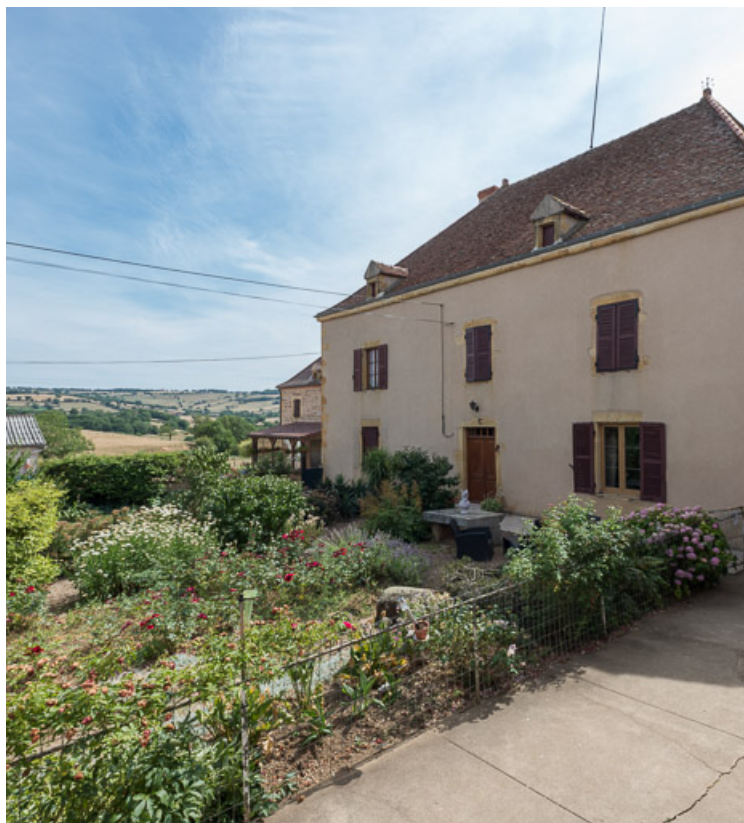
Façade antérieure de la demeure et jardin