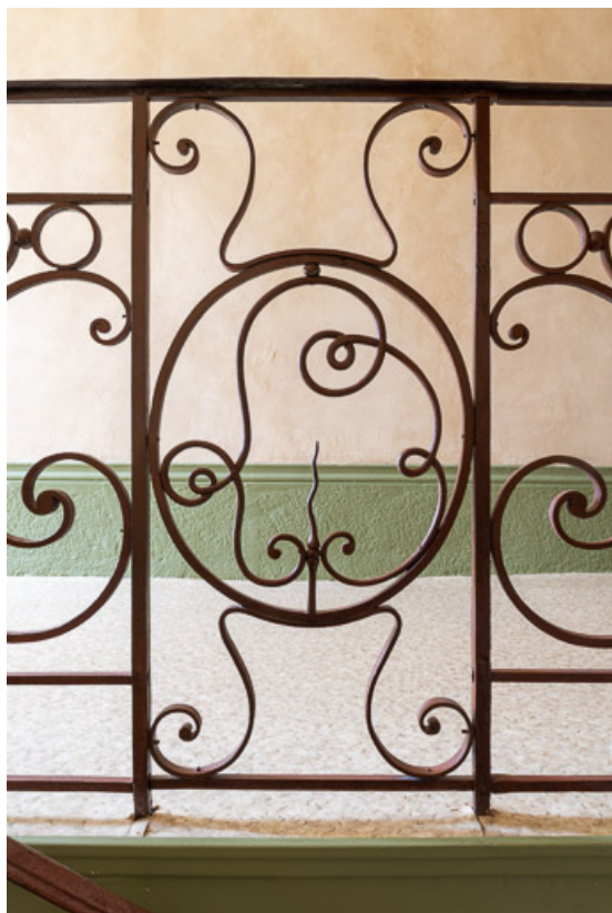
Garde corps en fer forgé de l'escalier avec le chiffre "LB" (Lazare Bordat)