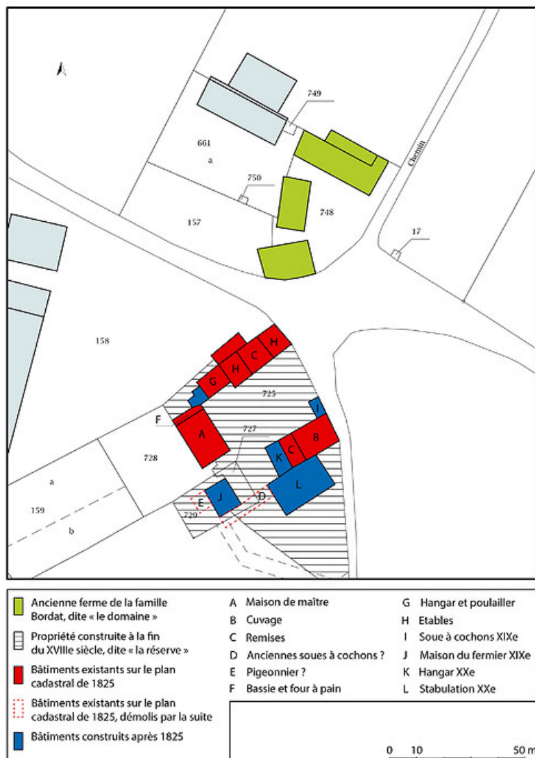
Plan de masse et de situation, présentant l'évolution des bâtiments. Extrait du plan cadastral, 2020, section A, échelle 1/5000 71, Briant, lieudit : Haut de Rouy