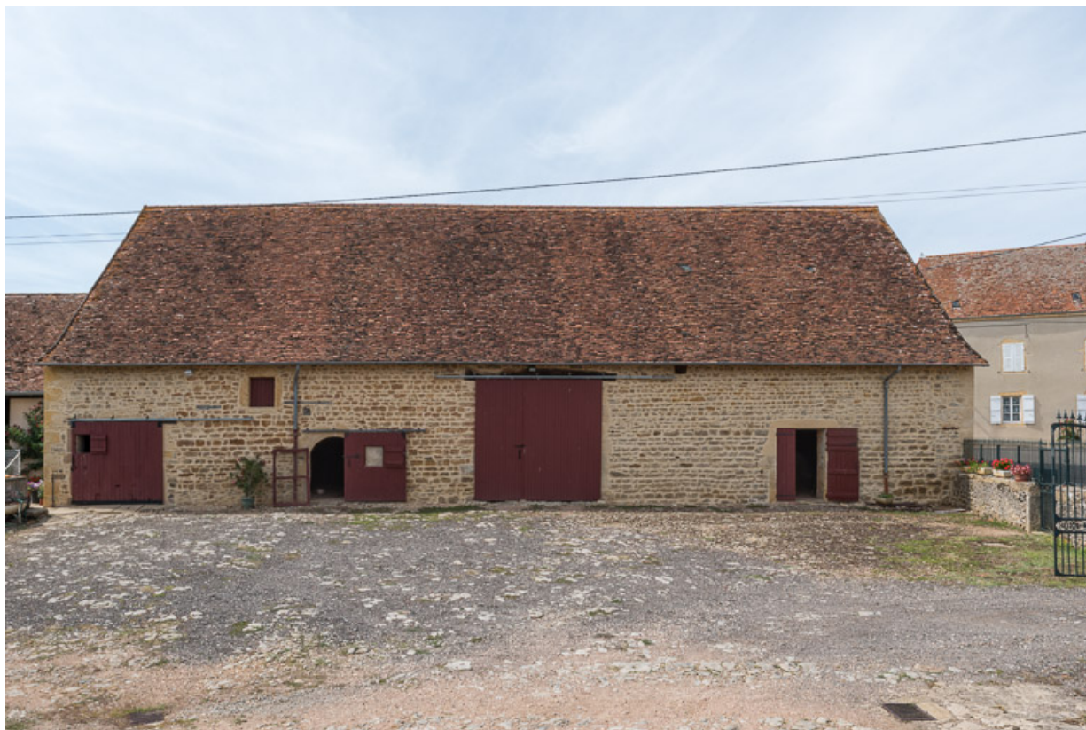
Façade antérieure de la grange, au nord de la cour, abritant une remise et trois étables