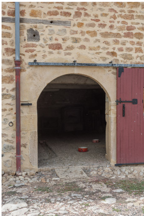
Ouverture d'une étable à bovins, couverte d'un arc en plein cintre 71, Briant, lieudit : Haut de Rouy