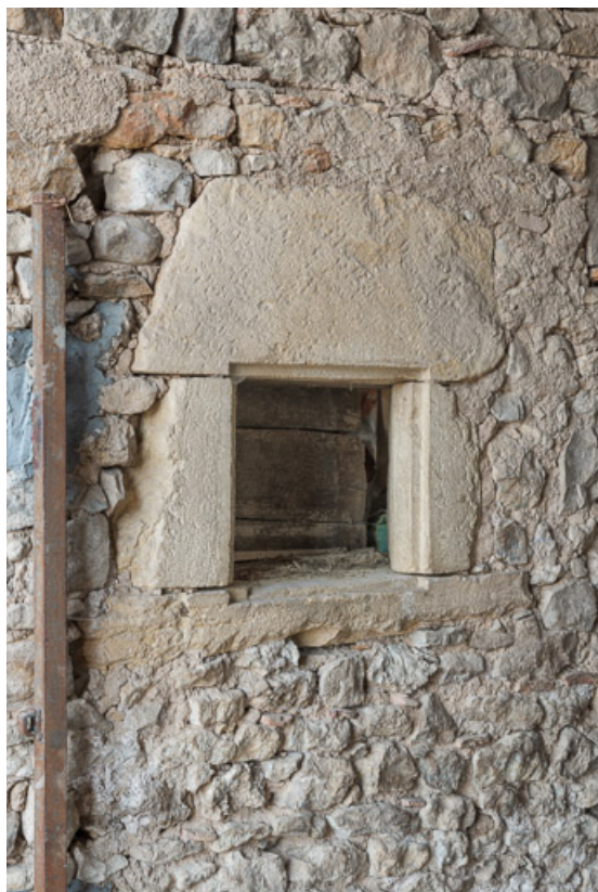
Feuron percé dans le mur entre la remise et l'étable 71, Briant, lieudit : Haut de Rouy