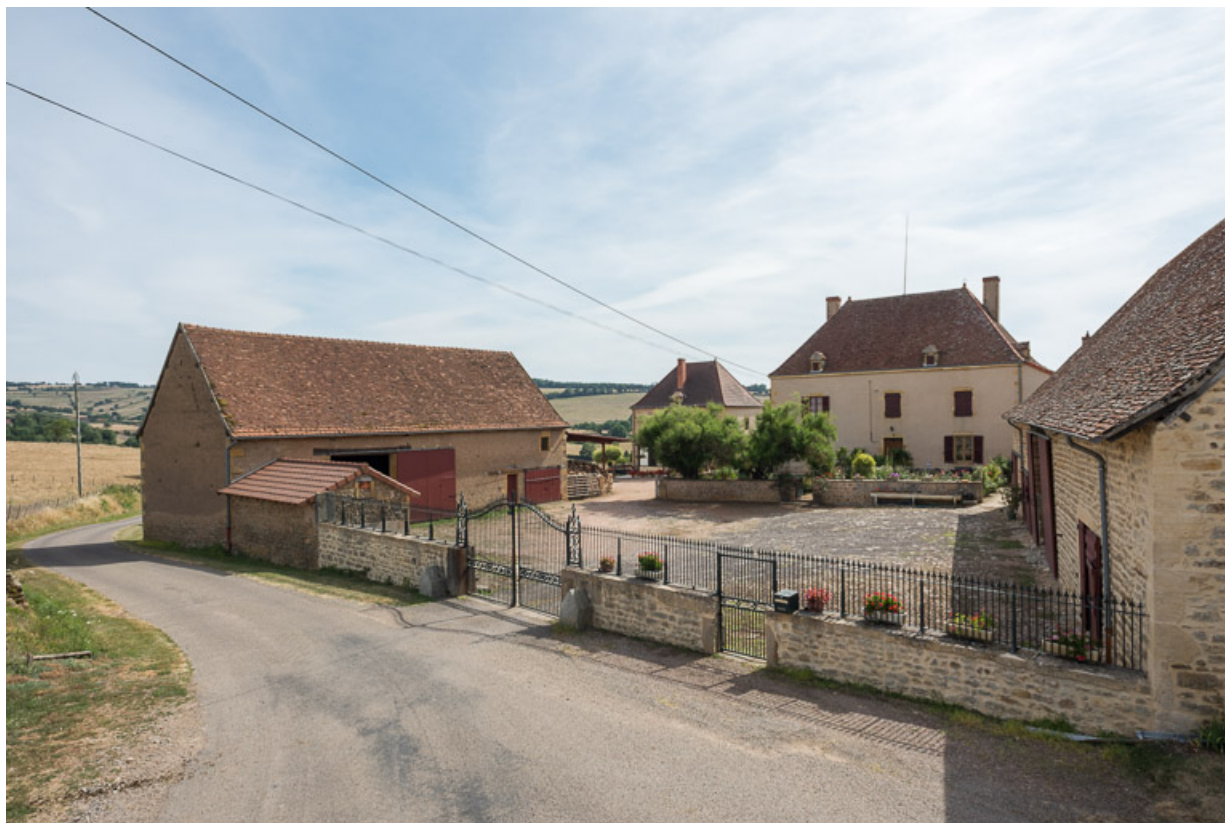
Vue d'ensemble des bâtiments du domaine du Haut de Rouy