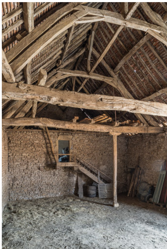
Vue intérieure du cuvage : escalier permettant l'accès à un grenier, situé dans le même bâtiment. 71, Briant, lieudit : Haut de Rouy