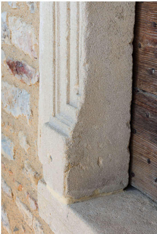
Détail d'une baie moulurée du XVI e siècle, à l'étage de la maison 71, Vauban, lieudit : la Place