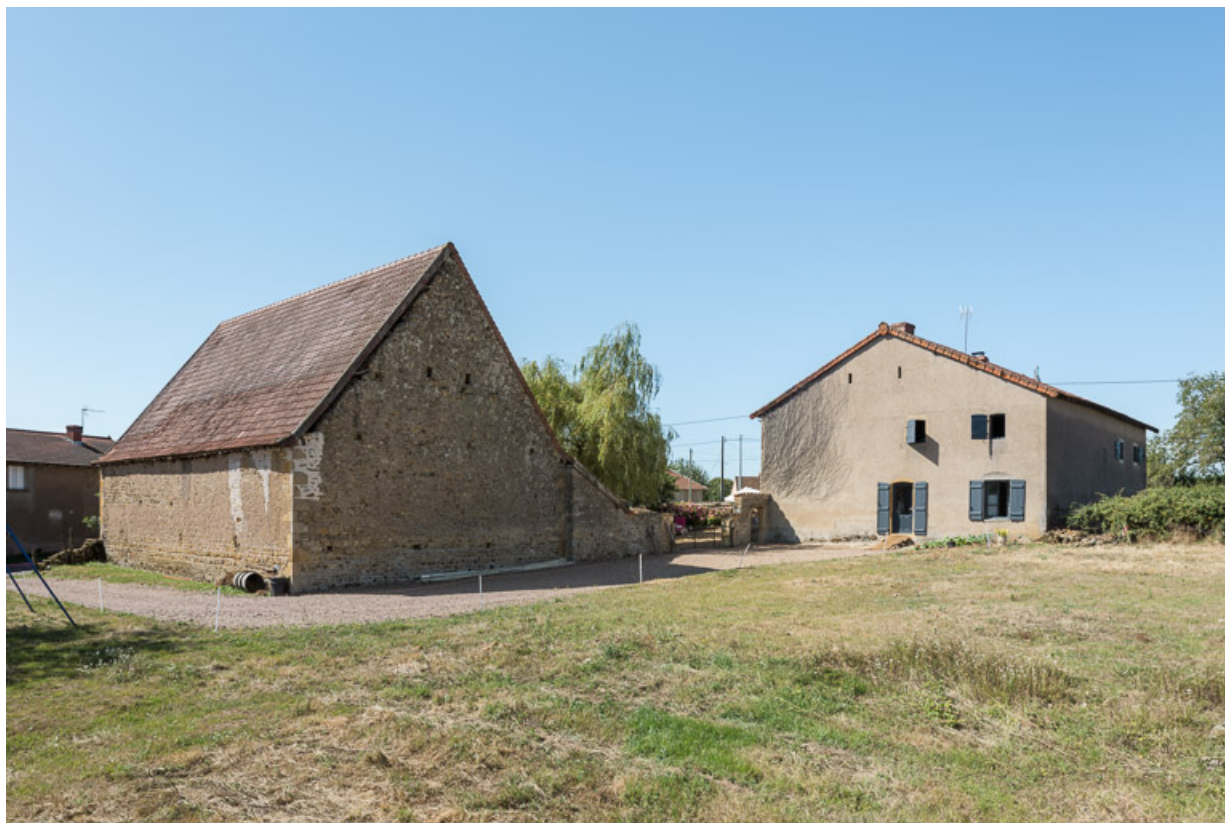
Vue d'ensemble de la ferme au nord