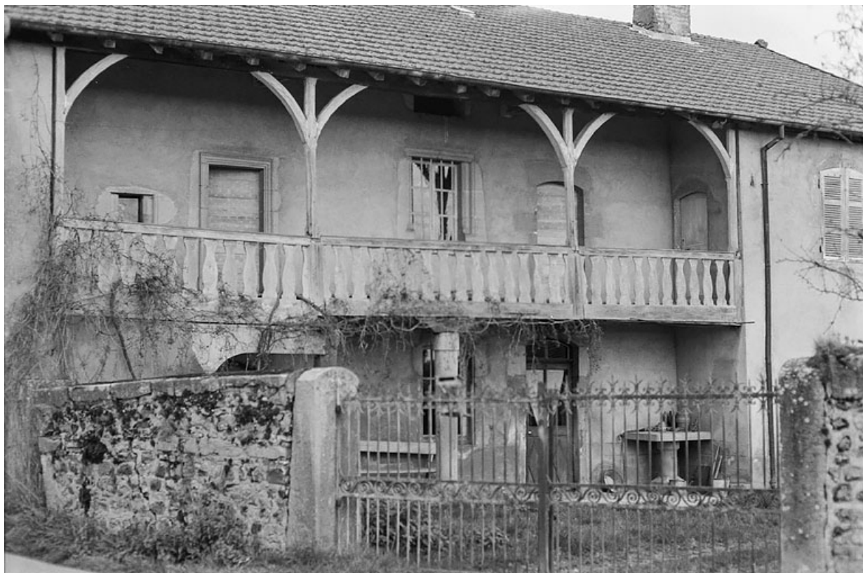
Vue de la maison, centrée sur la galerie, vers 1970.