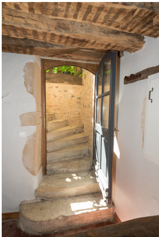
Escalier donnant accès à la galerie