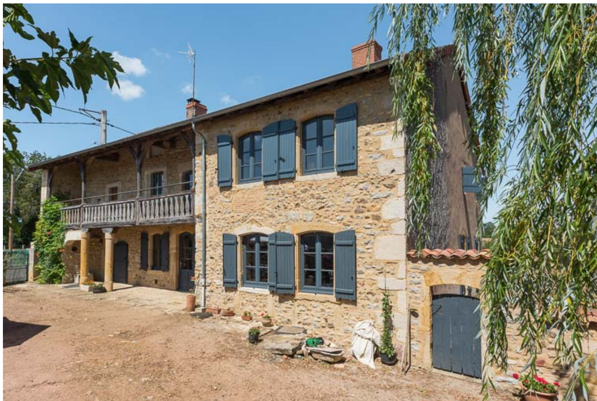
Vue de la façade antérieure de la maison