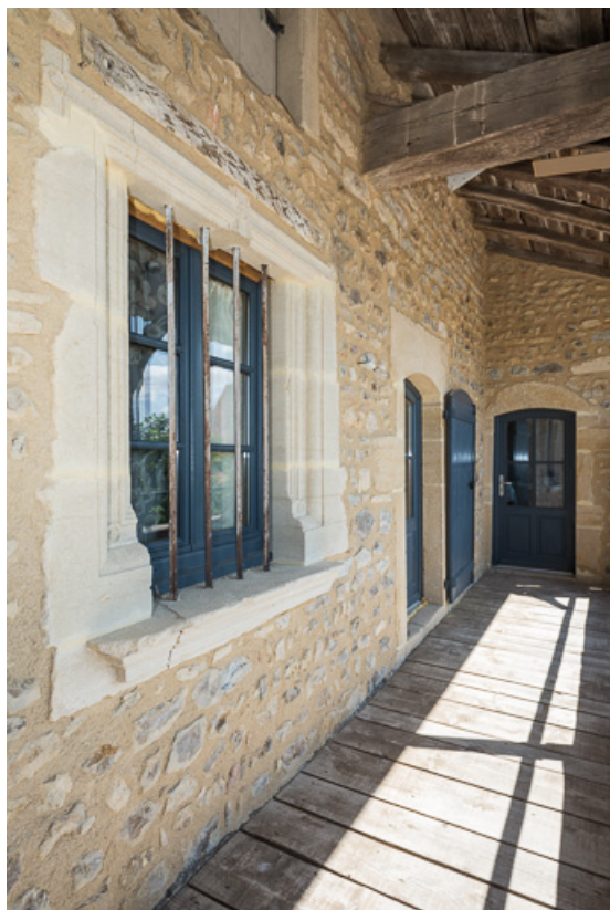
Vue de la galerie