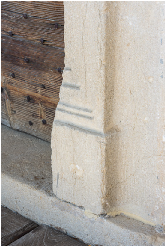
Détail d'une baie moulurée du XVI e siècle, à l'étage de la maison 71, Vauban, lieudit : la Place