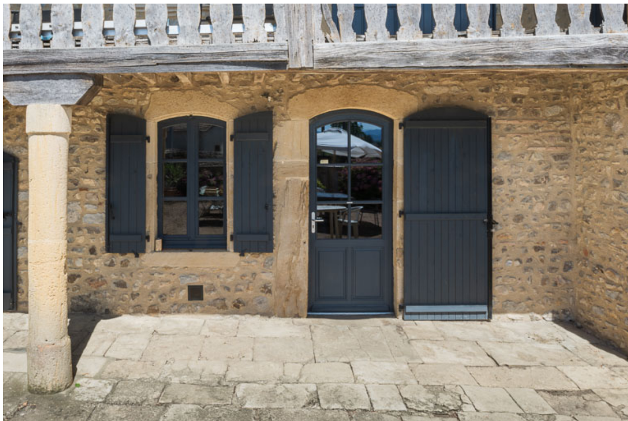
Détail du rez-de-chaussée de la façade antérieure de la maison : baies en arc segmentaire (milieu du XVIIIe siècle) 71, Vauban, lieudit : la Place