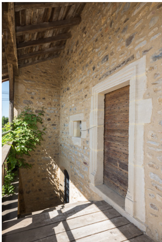
Vue de la galerie, protégée par un débord de toit soutenu par le dépassement des murs-pignons