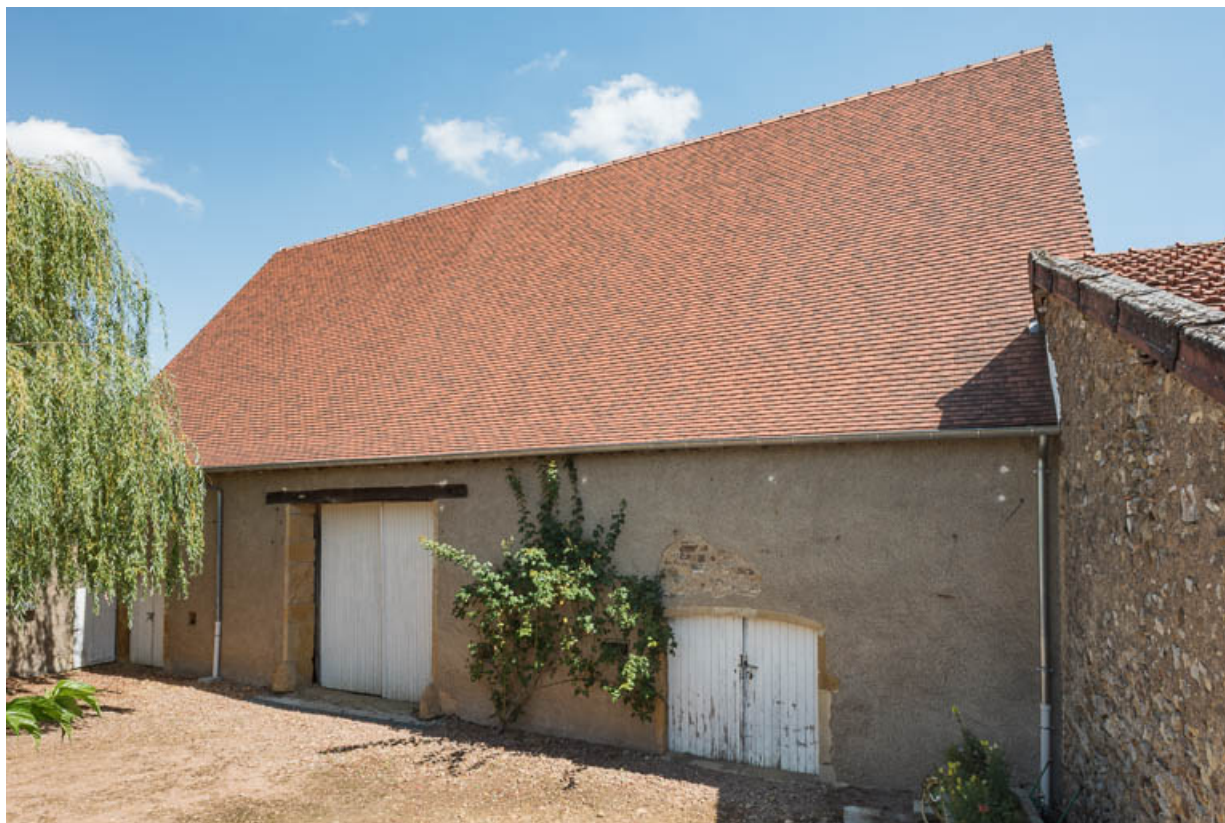
Vue de la façade postérieure de la grange. A droite, une portion du mur du bâtiment du cuvage, construit au sud de la grange, apparaît.