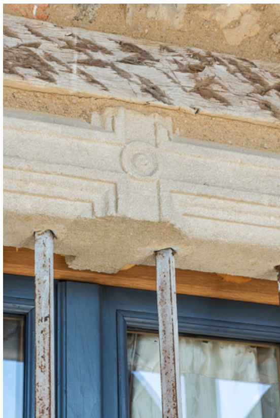
Détail d'une baie moulurée du XVI e siècle, à l'étage de la maison 71, Vauban, lieudit : la Place