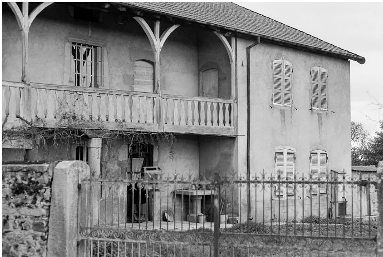
Vue de la maison, vers 1970