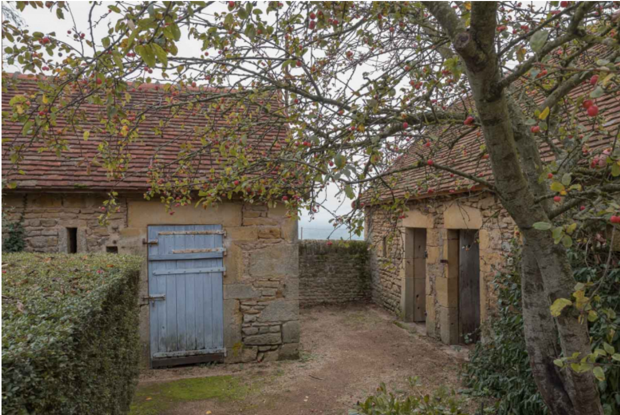
Petits bâtiments de dépendance ayant abrité les soues à cochons et poulaillers.

71, Saint-Julien-de-Civry, lieudit : En Vaux