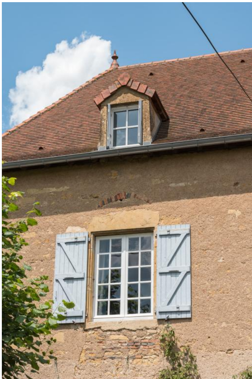
Détail de la façade antérieure de la maison (lucarne et baie de l'étage)

71, Saint-Julien-de-Civry, lieudit : En Vaux