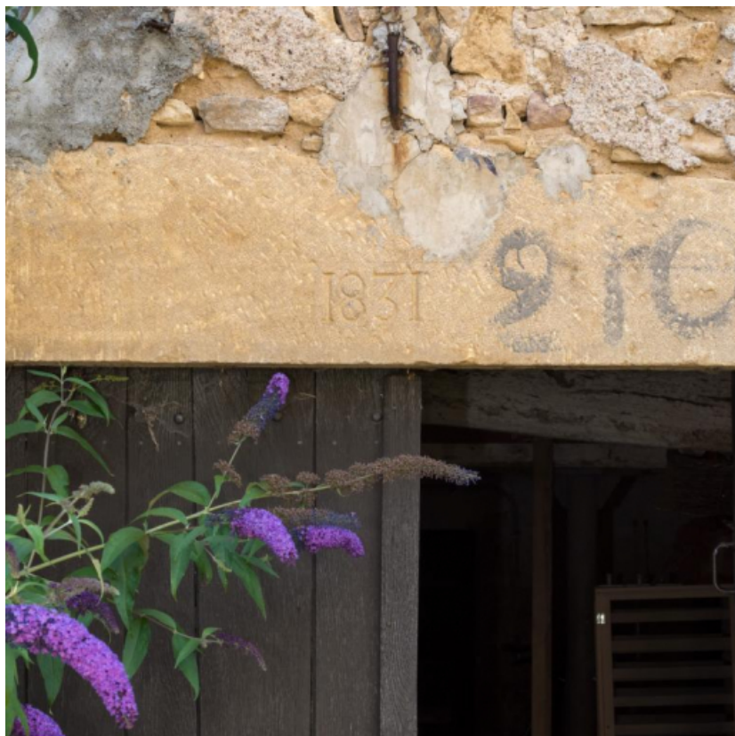
Détail du linteau d'une des portes d'étables portant la date de 1831

71, Saint-Julien-de-Civry, lieudit : En Vaux