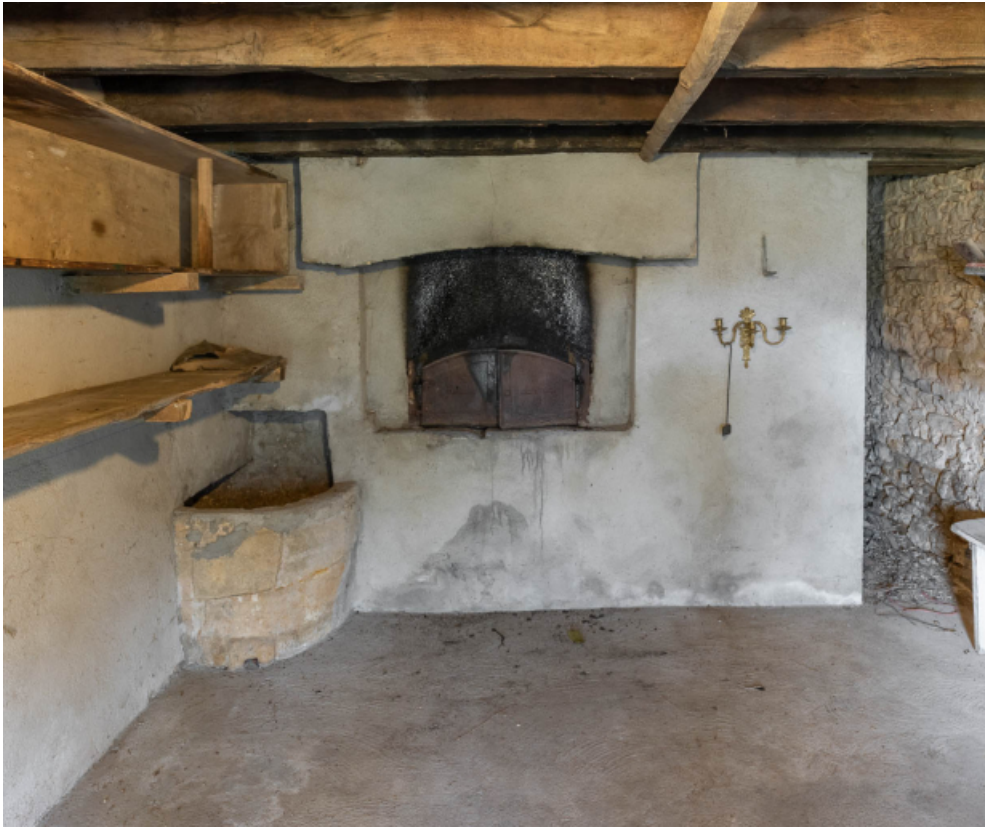
Intérieur de la boulangerie et four à pain.

71, Saint-Julien-de-Civry, lieudit : En Vaux