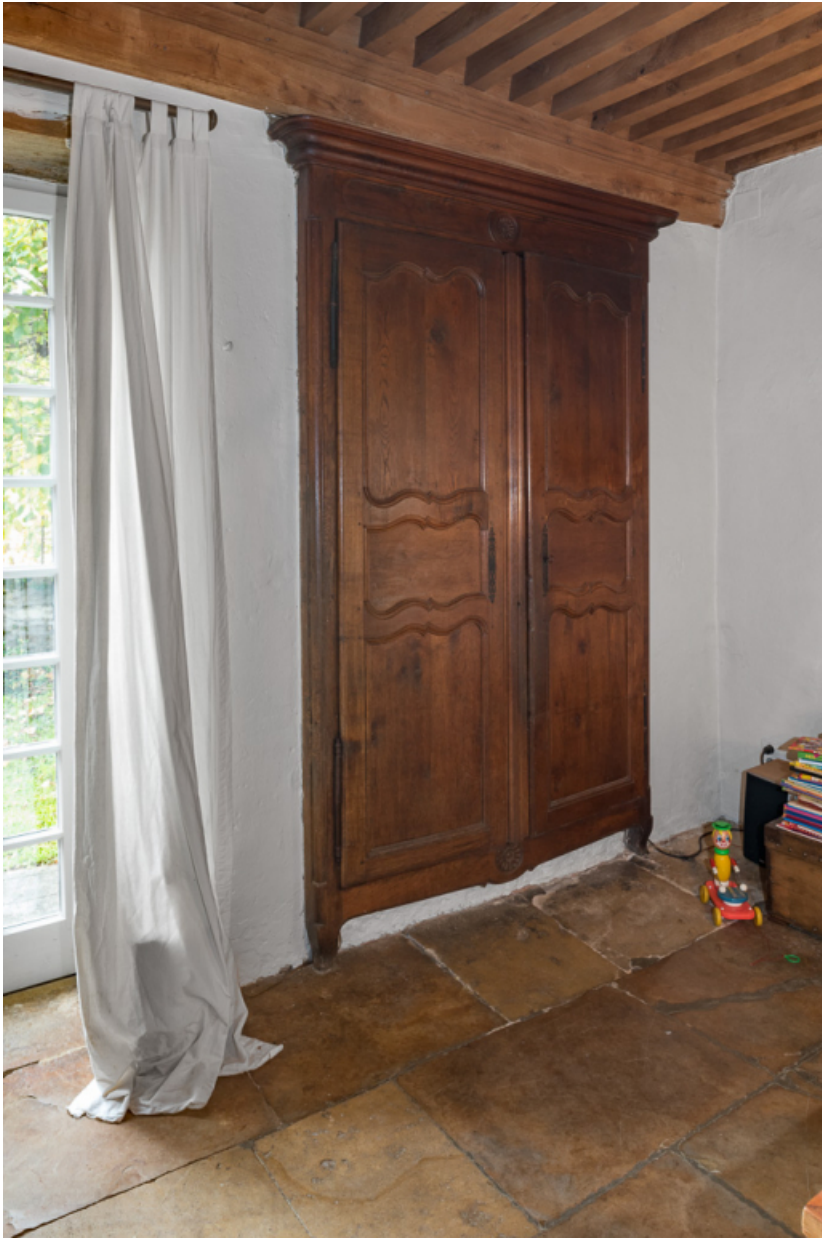
Placard mural dans l'ancienne cuisine ou pièce commune de la maison.

71, Saint-Julien-de-Civry, lieudit : En Vaux