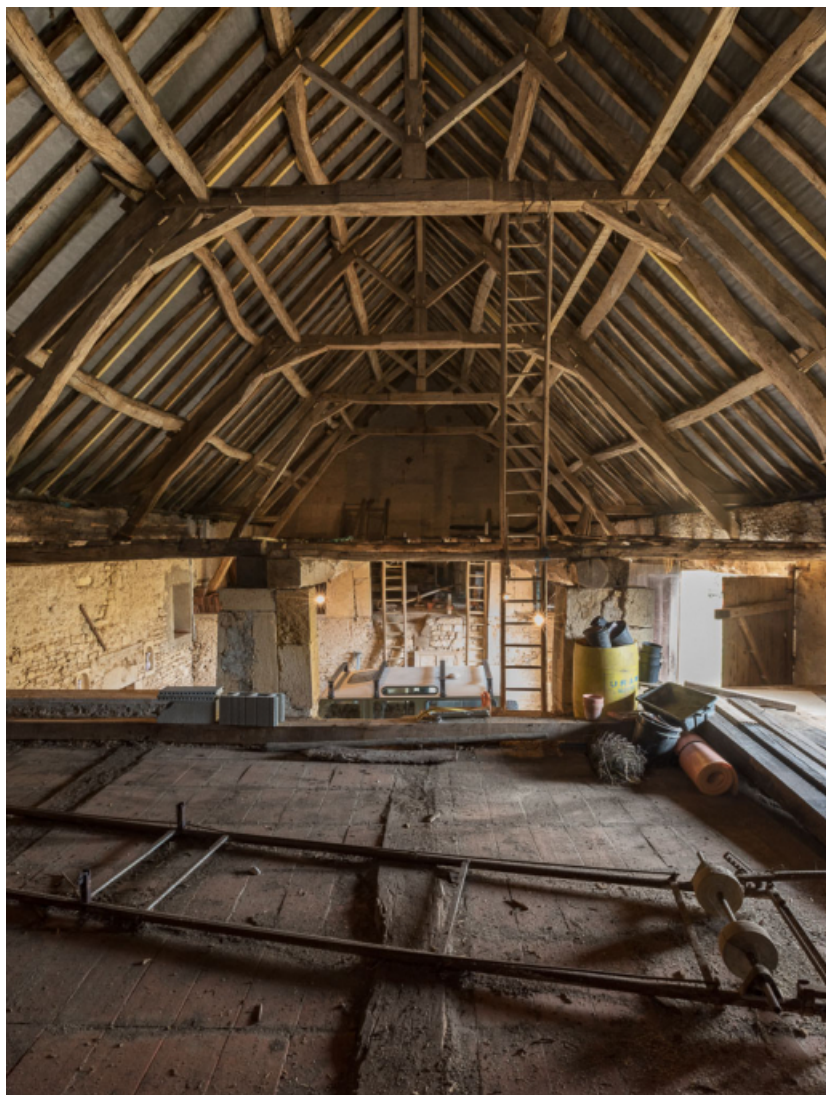
Charpente de la grange, construite en 1831.

71, Saint-Julien-de-Civry, lieudit : En Vaux