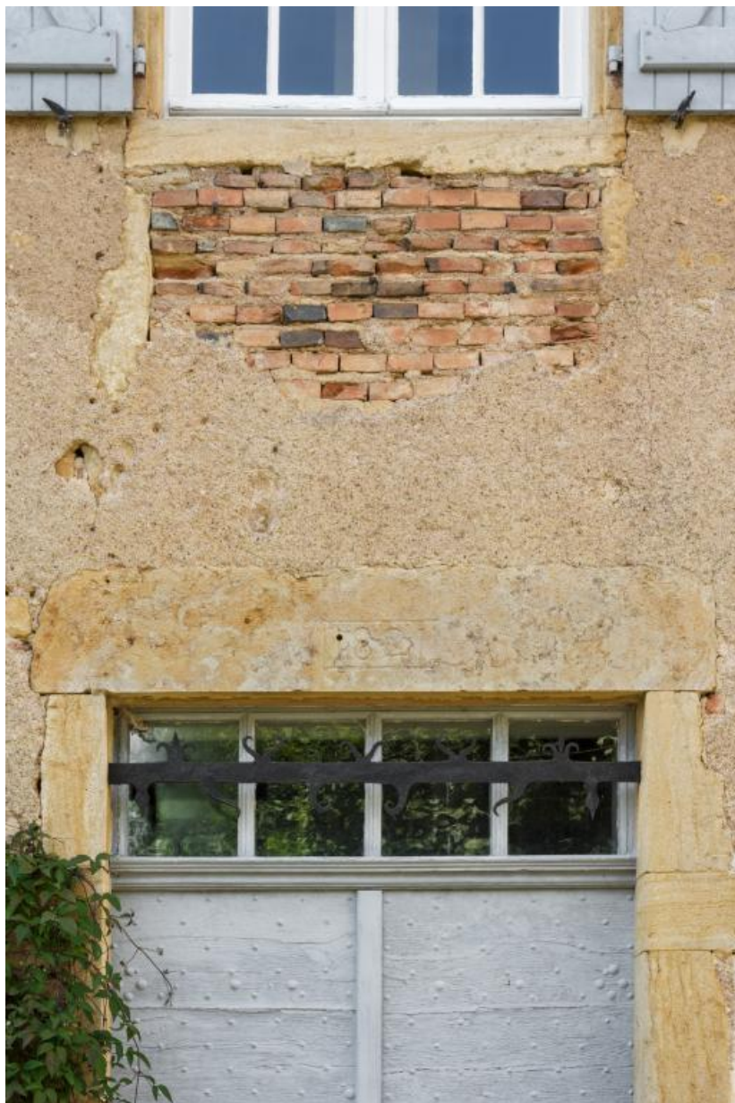
Linteau de la porte de la maison portant la date de 1821 et détail de la maçonnerie en brique sous les assises de fenêtres 71, Saint-Julien-de-Civry, lieudit : En Vaux