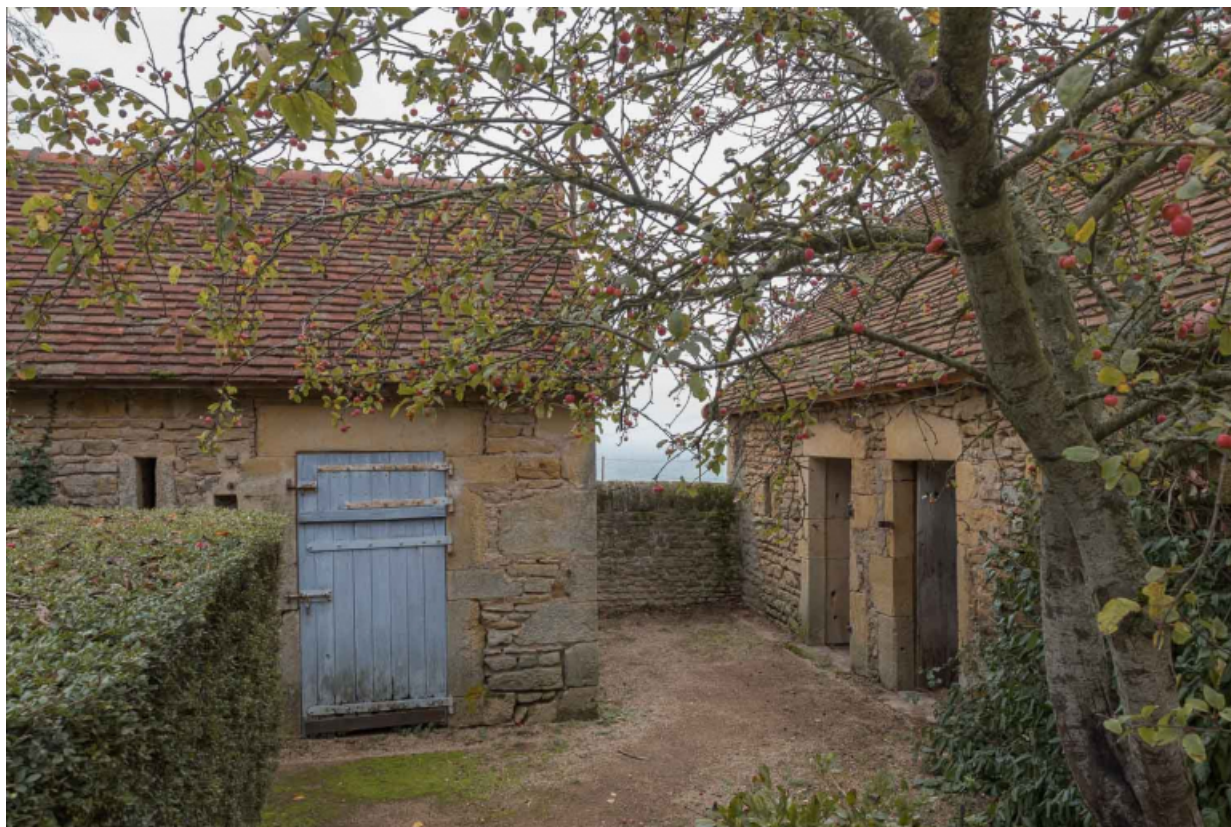
Petits bâtiments de dépendance ayant abrité les soues à cochons et poulaillers.

71, Saint-Julien-de-Civry, lieudit : En Vaux