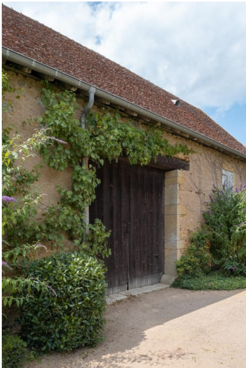
Porte d'une des remises de la dépendance construite en 1831.

71, Saint-Julien-de-Civry, lieudit : En Vaux