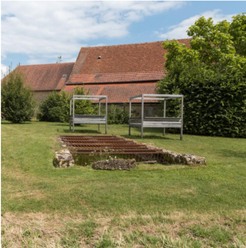
Vue des façades postérieures des granges et de la mare, à l'arrière de ces bâtiments.

71, Saint-Julien-de-Civry, lieudit : En Vaux