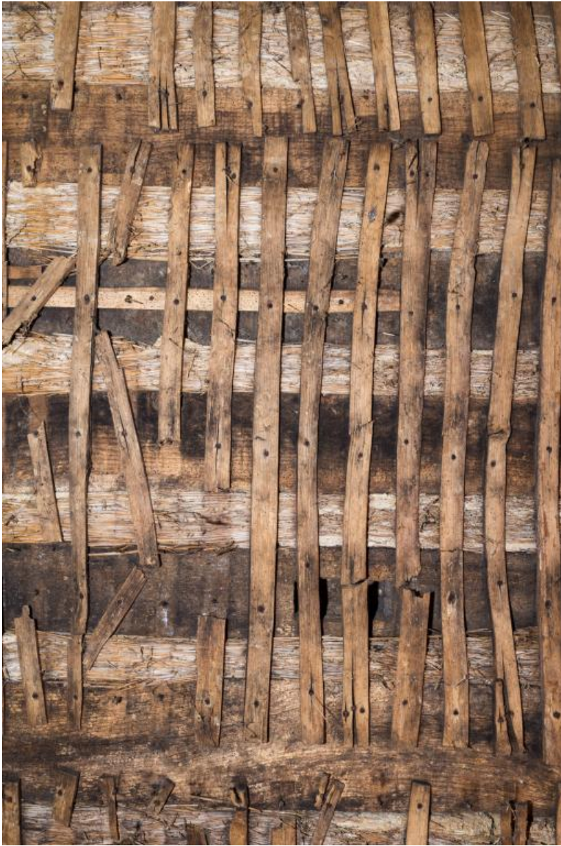
Détail d'un plancher dans la dépendance, constitué de pièces de bois (solives), de bottes de paille et couvert d'un lattis 71, Saint-Julien-de-Civry, lieudit : En Vaux