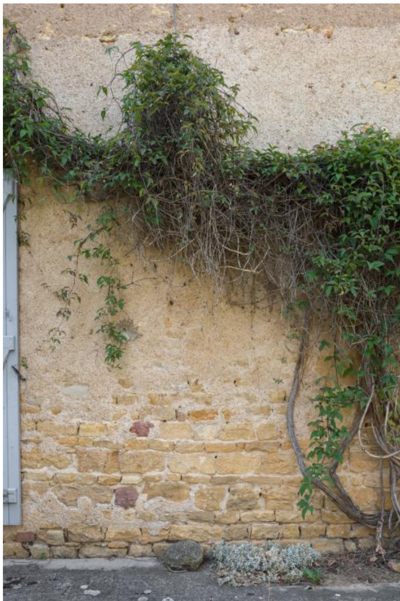
Détail de la façade antérieure de la maison : maçonnerie

71, Saint-Julien-de-Civry, lieudit : En Vaux