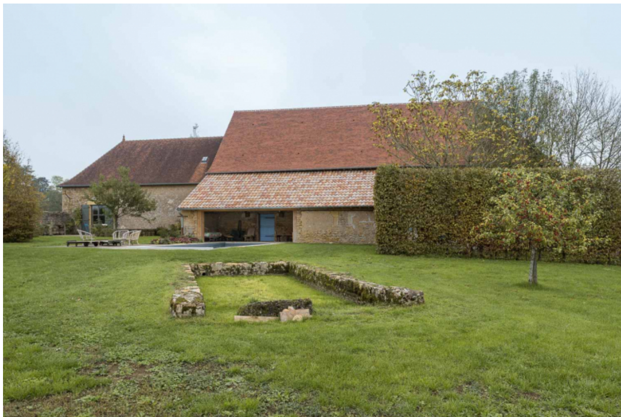
Vue de la façade postérieure des granges en 2019. Seul, l'appentis a été modifié et ouvert pour l'aménagement d'une piscine. 71, Saint-Julien-de-Civry, lieudit : En Vaux