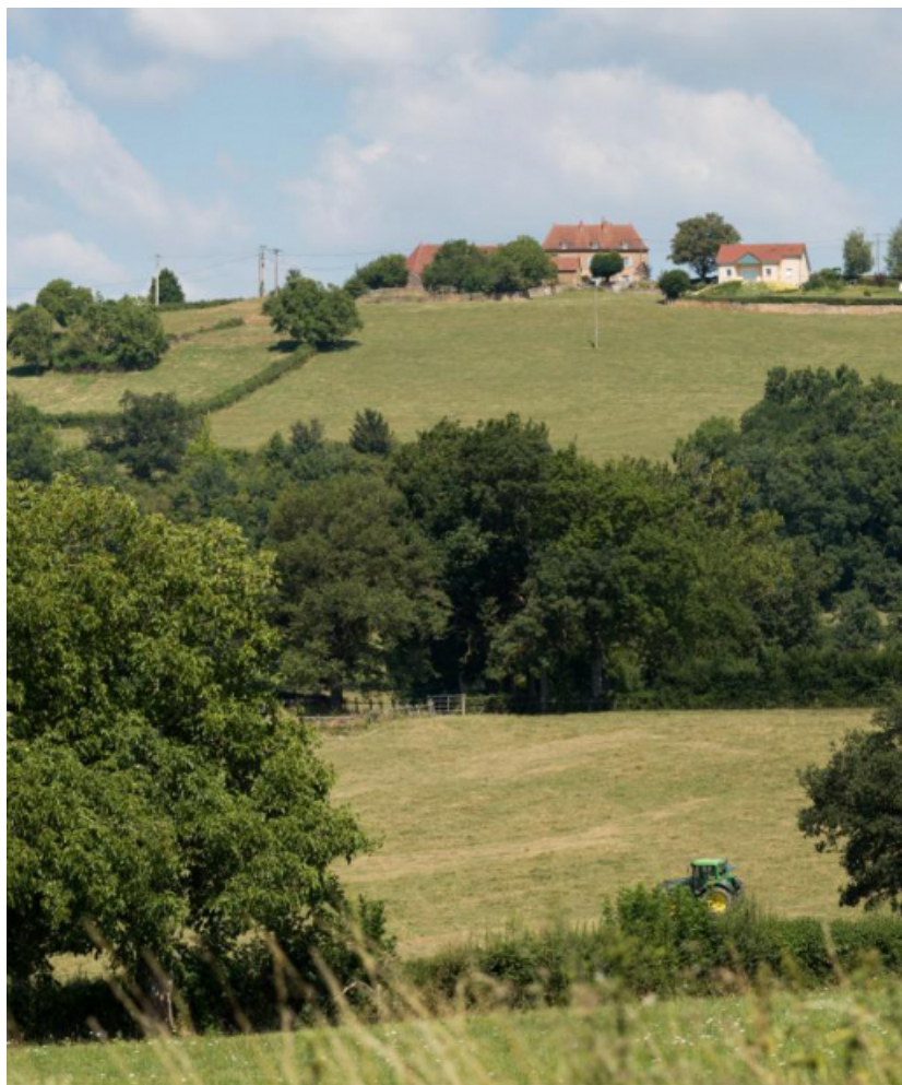
Vue de la ferme au sommet de la colline de Vaux

71, Saint-Julien-de-Civry, lieudit : En Vaux