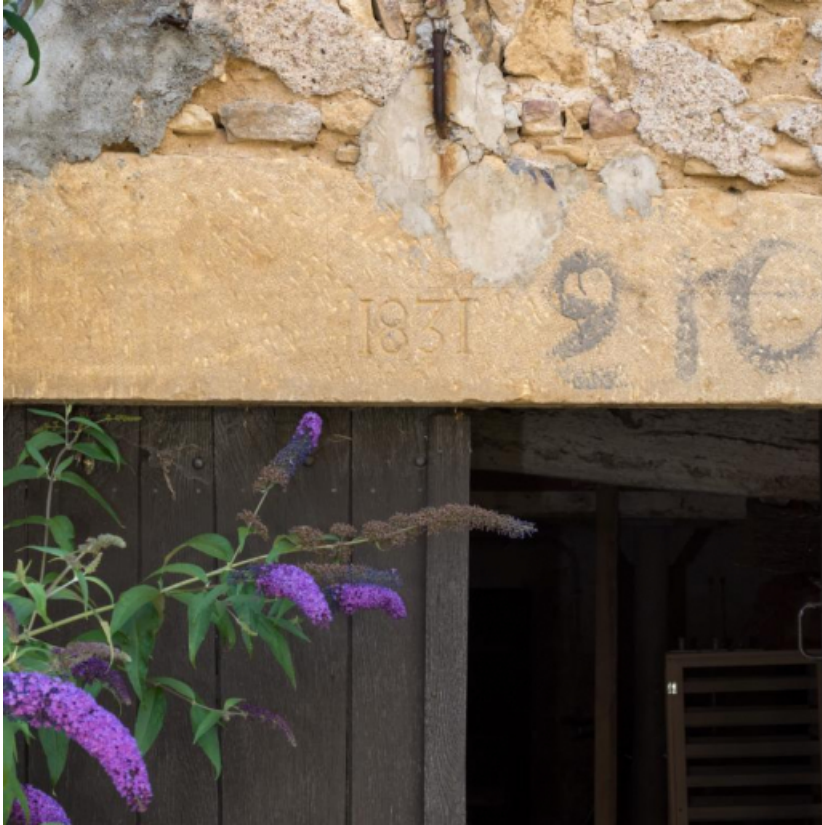
Détail du linteau d'une des portes d'étables portant la date de 1831

71, Saint-Julien-de-Civry, lieudit : En Vaux