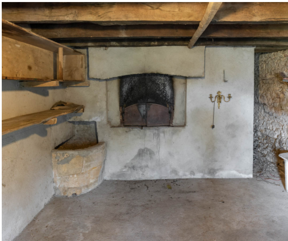
Intérieur de la boulangerie et four à pain.

71, Saint-Julien-de-Civry, lieudit : En Vaux