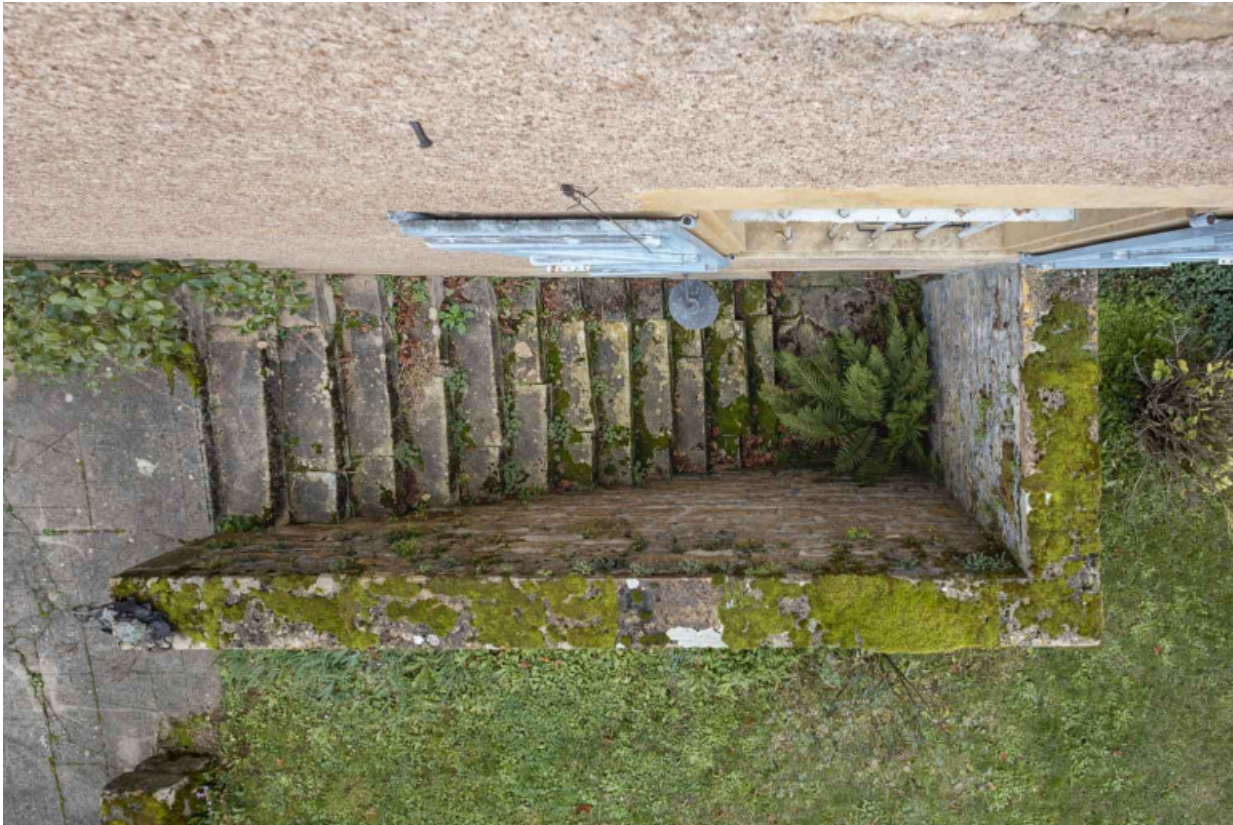
Vue en plongée sur la descente de la cave, sur la façade antérieure de la maison.

71, Saint-Julien-de-Civry, lieudit : En Vaux