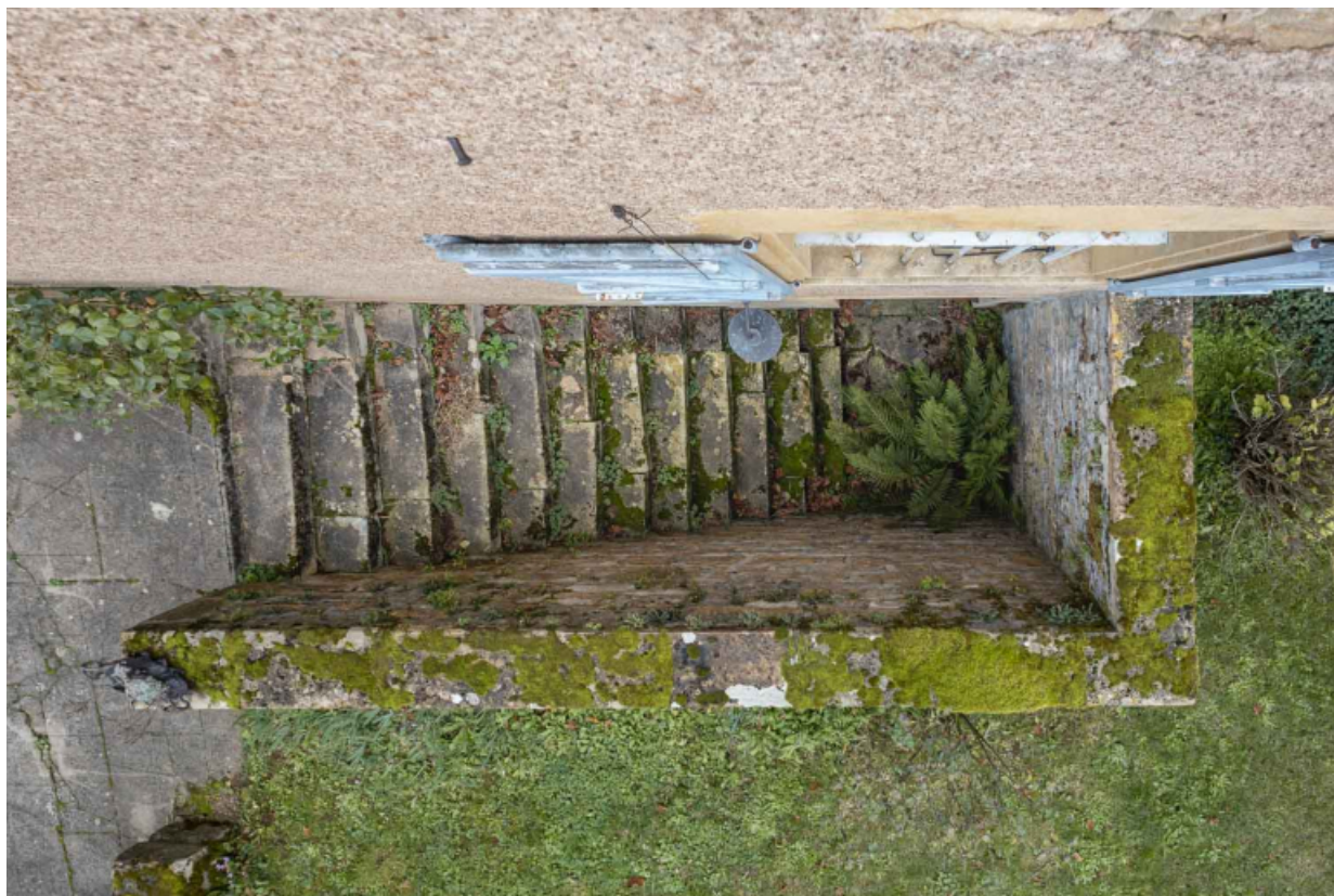
Vue en plongée sur la descente de la cave, sur la façade antérieure de la maison.

71, Saint-Julien-de-Civry, lieudit : En Vaux