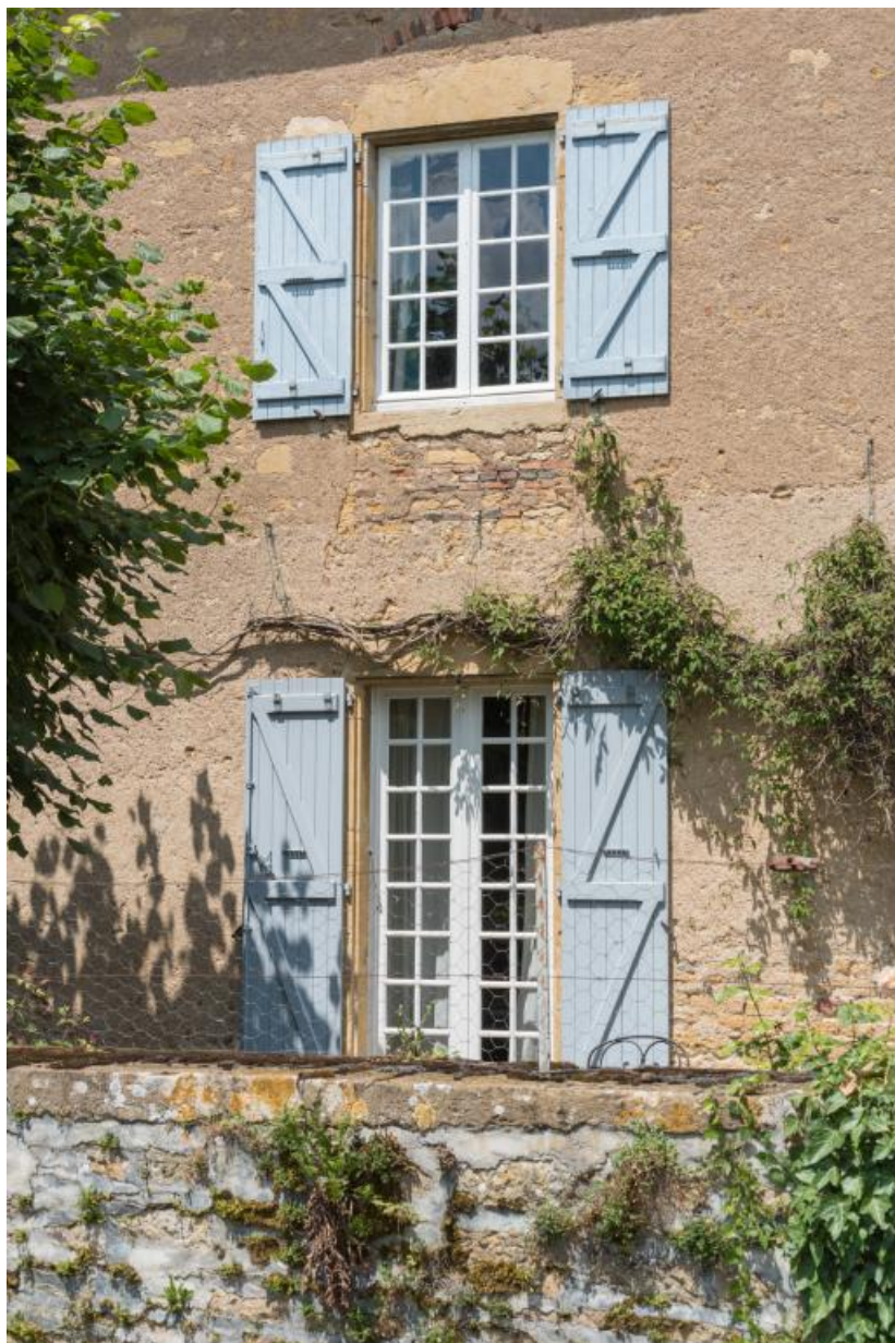
Détail de la façade antérieure de la maison : baie du rez-de-chaussée et de l'étage 71, Saint-Julien-de-Civry, lieudit : En Vaux