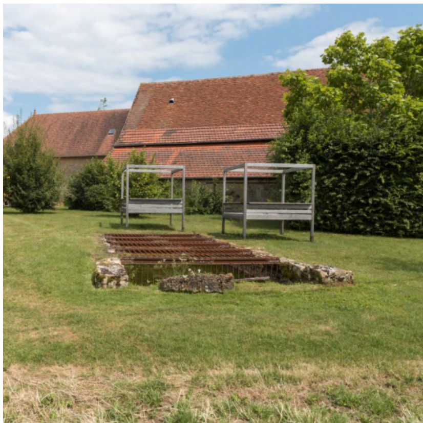
Vue des façades postérieures des granges et de la mare, à l'arrière de ces bâtiments.

71, Saint-Julien-de-Civry, lieudit : En Vaux