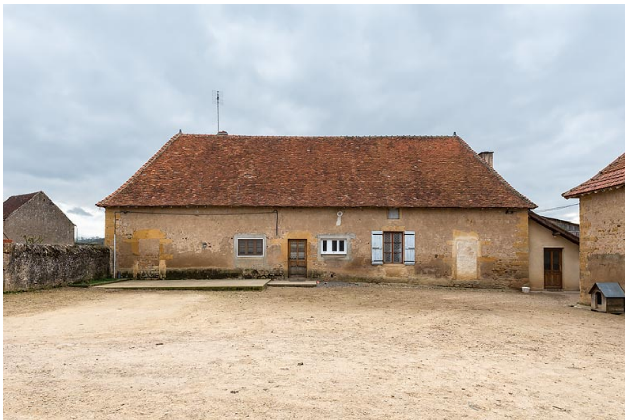
Vue de la façade antérieure de la maison