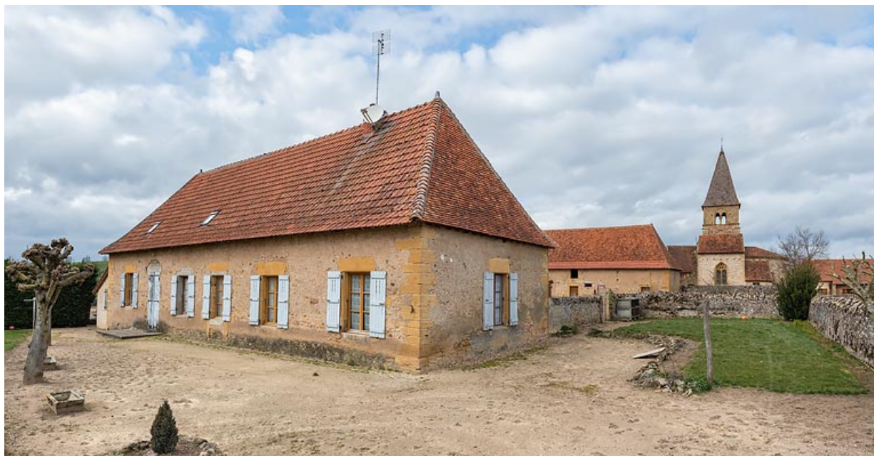
Façade postérieure de la maison. A l'arrière-plan, l'ancienne église paroissiale de Changy. 71, Changy, lieudit : le Vieux Bourg

N° de l'illustration : 20197100753NUC4AQ