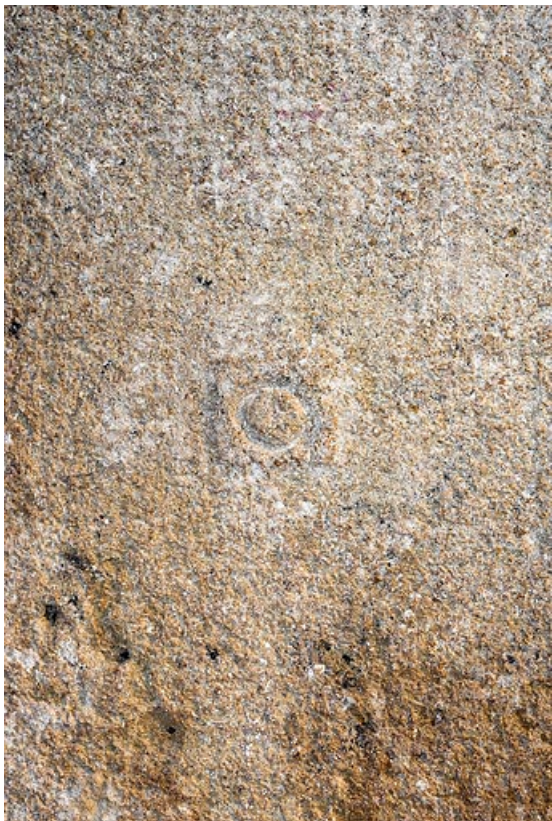
Pierre avec marque de tâcheron dans l'encadrement d'une porte, à l'intérieur de la maison 71, Changy, lieudit : le Vieux Bourg