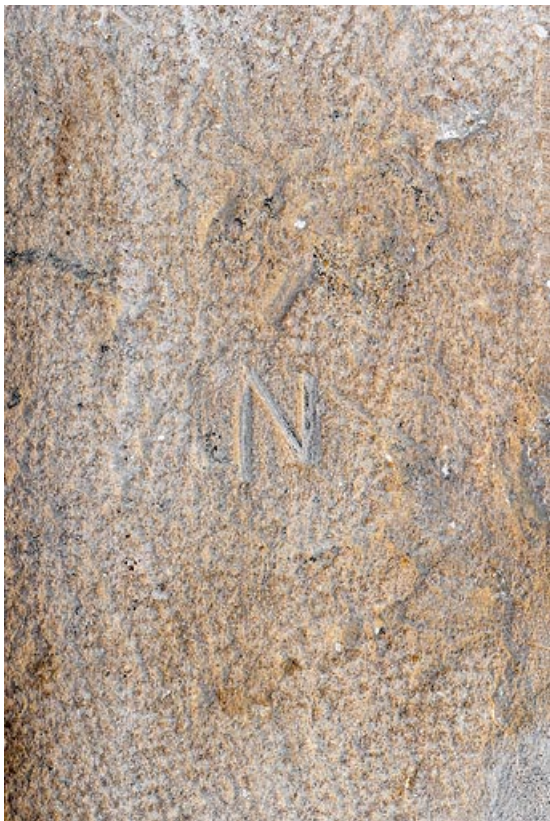
Pierre avec marque de tâcheron, dans l'encadrement d'une porte, à l'intérieur de la maison 71, Changy, lieudit : le Vieux Bourg