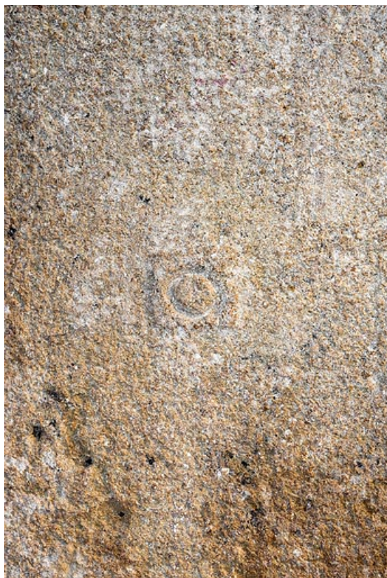
Pierre avec marque de tâcheron dans l'encadrement d'une porte, à l'intérieur de la maison 71, Changy, lieudit : le Vieux Bourg