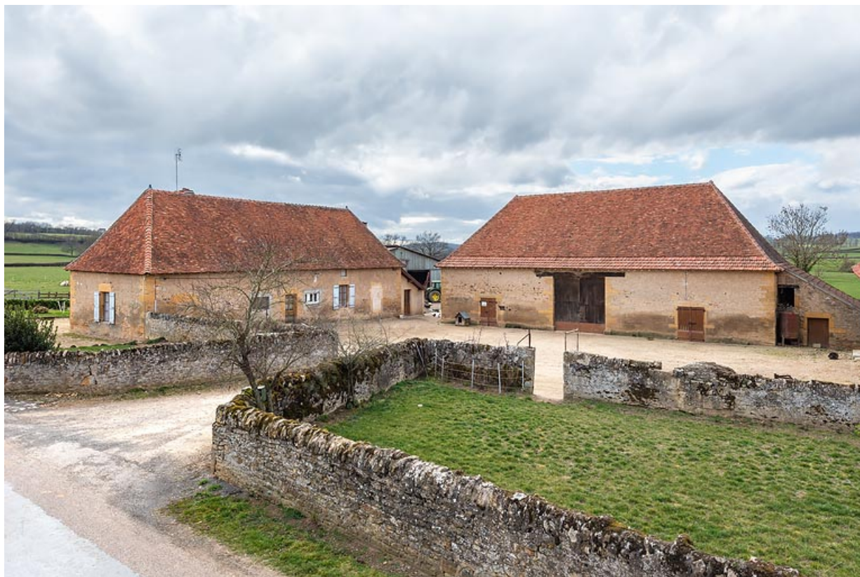
Vue de la maison, au sud, et de la grange, au fond de la cour, à l'ouest.