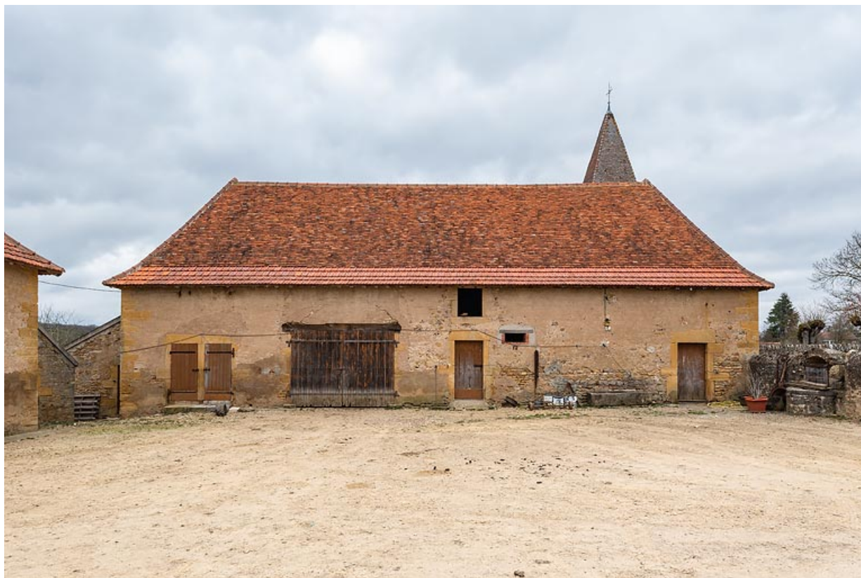
Seconde dépendance, abritant notamment une remise et des soues à cochons