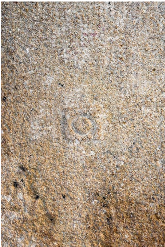
Pierre avec marque de tâcheron dans l'encadrement d'une porte, à l'intérieur de la maison 71, Changy, lieudit : le Vieux Bourg