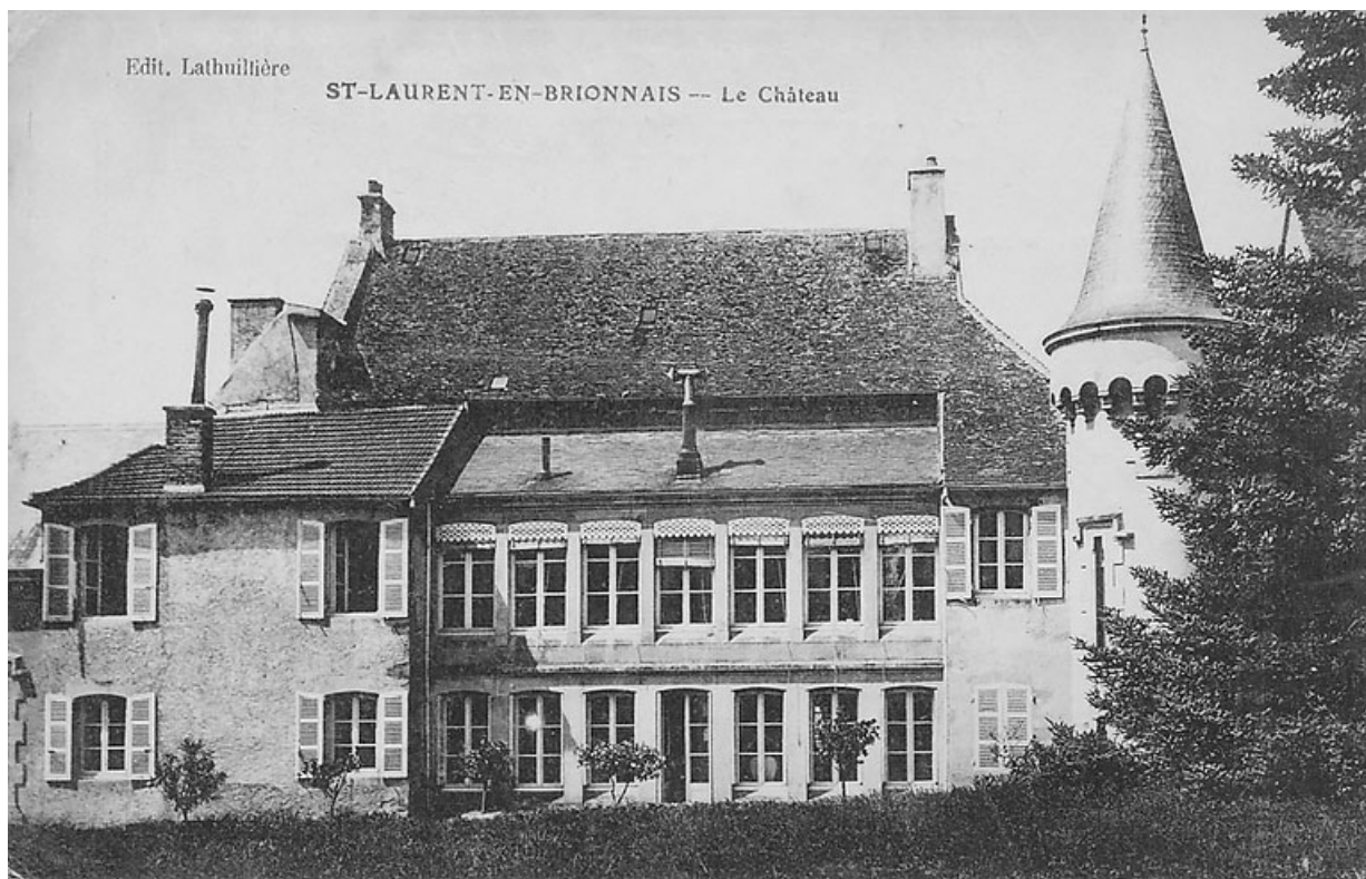
Vue de la façade postérieur du château, côté jardin, carte postale ancienne, vers 1900.

71, Saint-Laurent-en-Brionnais, lieudit : Le Bourg