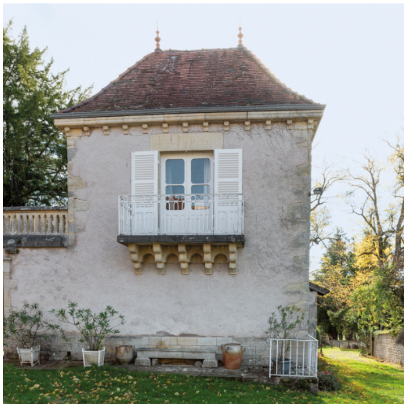
Façade nord du pavillon.

71, Saint-Laurent-en-Brionnais, lieudit : Le Bourg