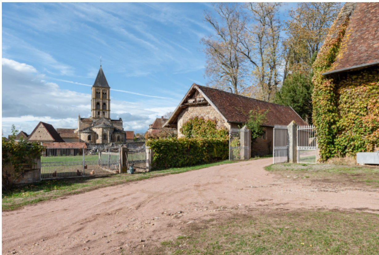
Vue du poulailler depuis la cour.

71, Saint-Laurent-en-Brionnais, lieudit : Le Bourg