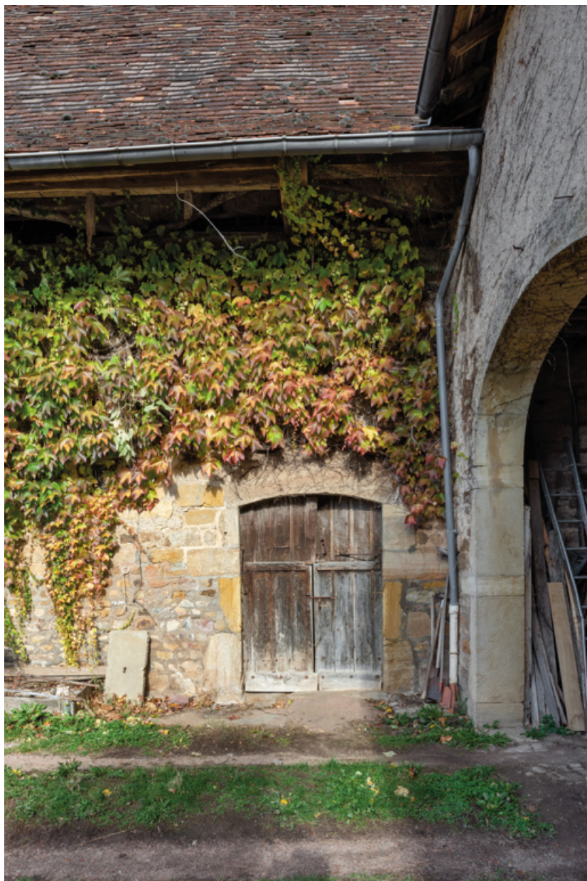
Porte d'étable du bâtiment nord.

71, Saint-Laurent-en-Brionnais, lieudit : Le Bourg