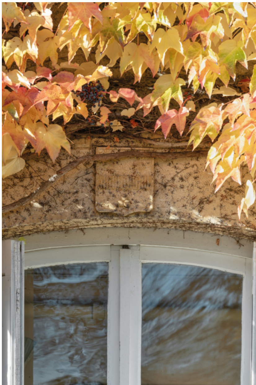
Logis. Détail d'un blason sur un linteau de la façade est.

71, Saint-Laurent-en-Brionnais, lieudit : Le Bourg