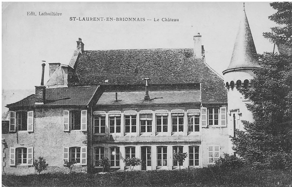
Vue de la façade postérieur du château, côté jardin, carte postale ancienne, vers 1900.

71, Saint-Laurent-en-Brionnais, lieudit : Le Bourg