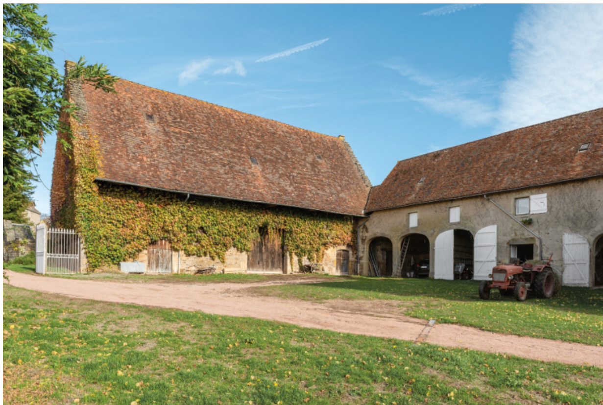
Bâtiments agricoles depuis le sud-ouest de la cour.

71, Saint-Laurent-en-Brionnais, lieudit : Le Bourg