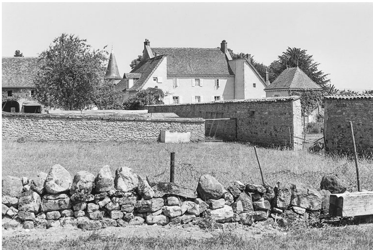
Vue de la façade antérieure du château, vers 1970.

71, Saint-Laurent-en-Brionnais, lieu-dit : Le Bourg