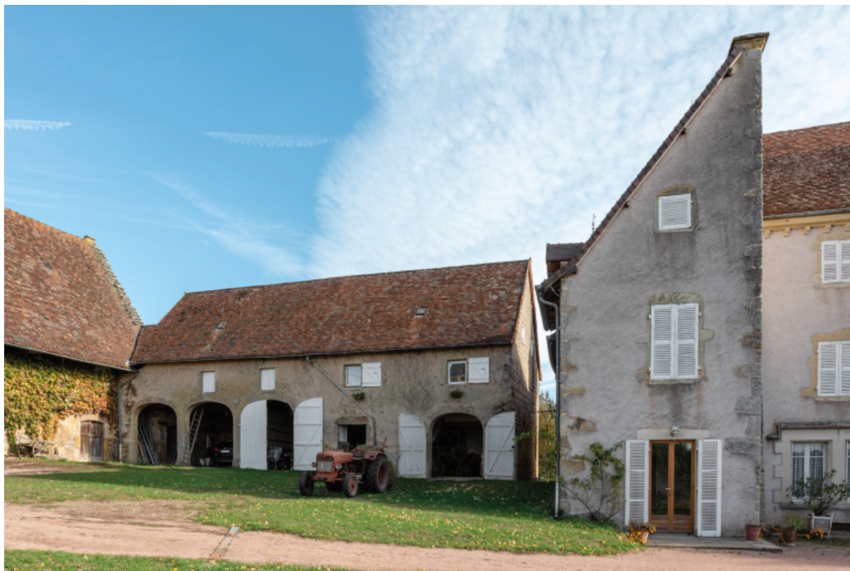
Bâtiment des remises et écuries et aile nord du logis.

71, Saint-Laurent-en-Brionnais, lieudit : Le Bourg