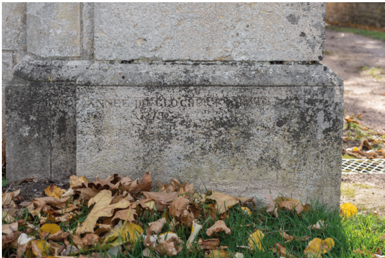
Base du pilier de la grille d'entrée.

71, Saint-Laurent-en-Brionnais, lieudit : Le Bourg