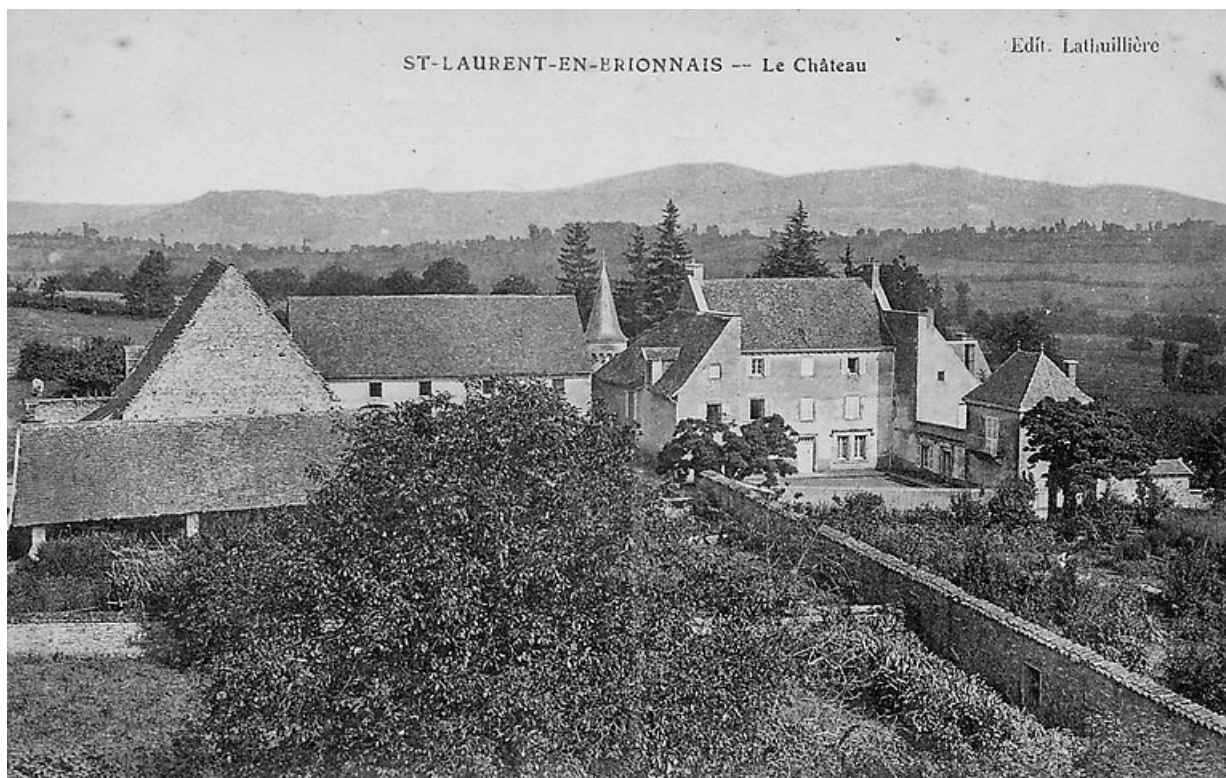
Vue des bâtiments du domaine, depuis le clocher de l'église, carte postale ancienne, vers 1900. 71, Saint-Laurent-en-Brionnais, lieudit : Le Bourg