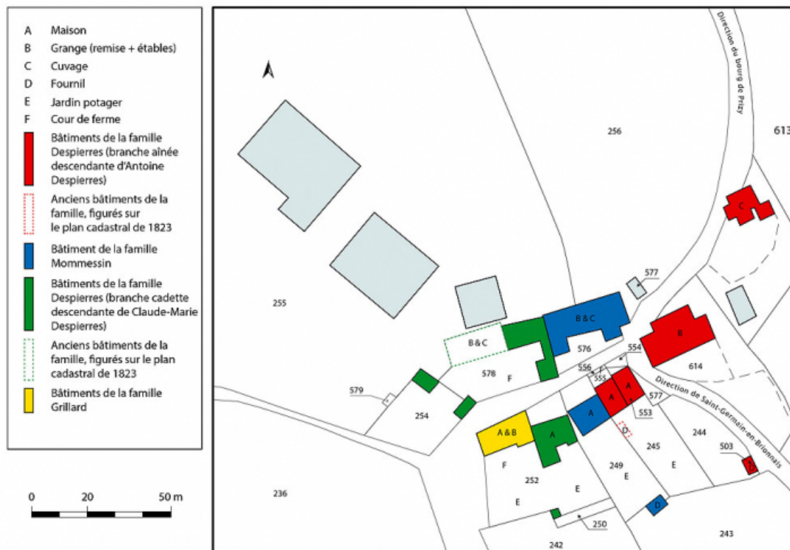
Plan de masse et de situation. Extrait du plan cadastral, 2020, section A, échelle 1/5000 71, Prizy, lieudit : les Bouffiers