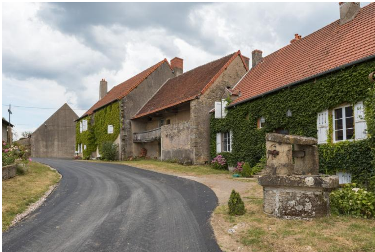
Vue de l'alignement des maisons du hameau des Bouffiers