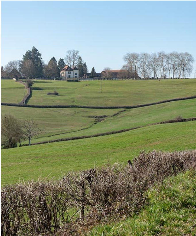
Le château et la ferme de Martigny, dans son paysage, au sommet du coteau dominant le val d'Arconce. 71, Poisson, lieudit : Martigny