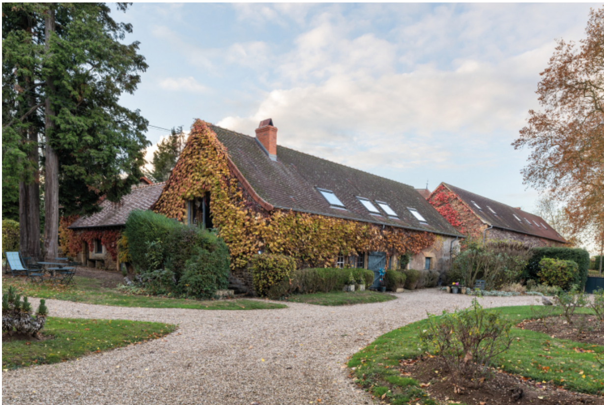
Vue des dépendances dont le bâtiment abritant l'ancien fournil au premier plan