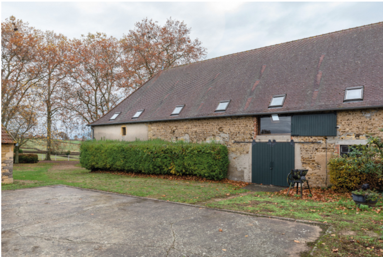
Façade antérieure de la grange