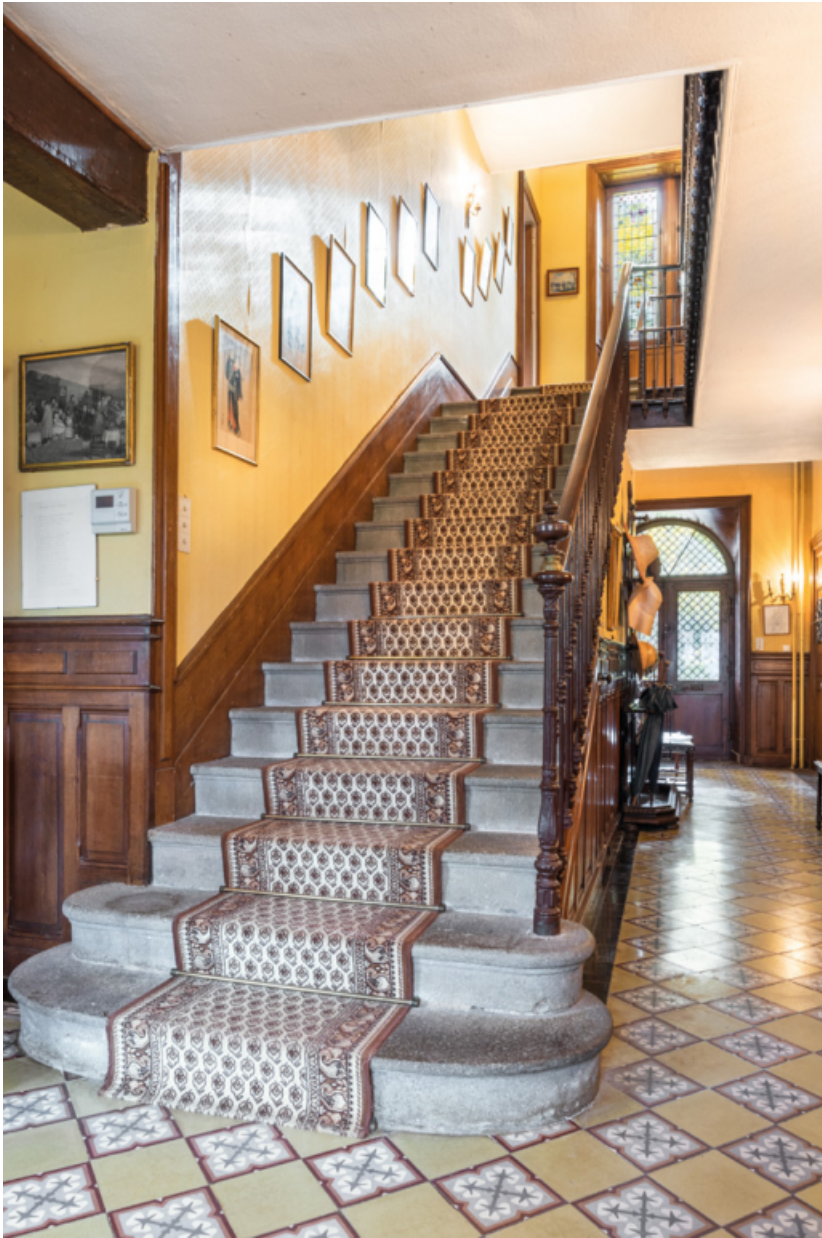
Vestibule du château