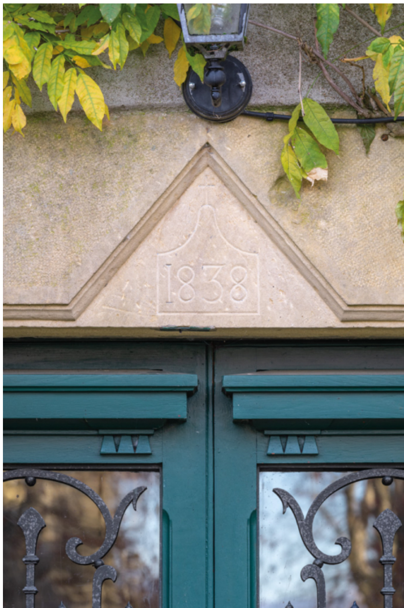
Linteau de la porte d'entrée du château avec la date de 1838