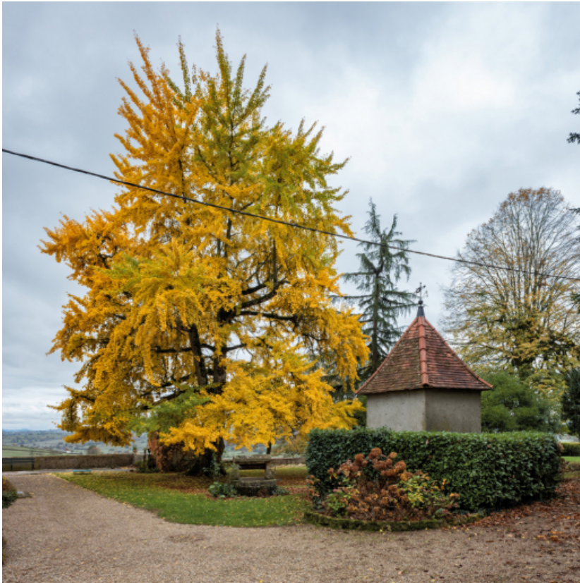
Ginkgo Biloba dans le parc