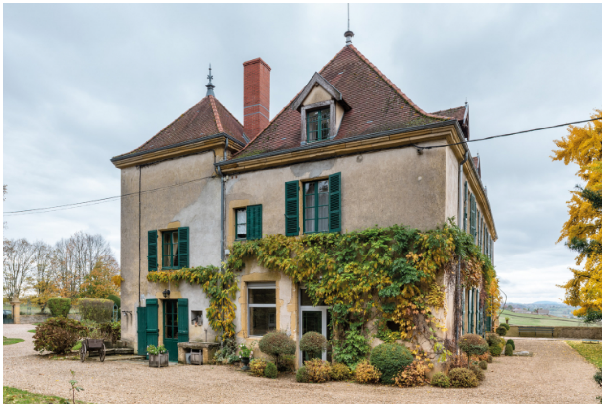
Façade latérale ouest du château