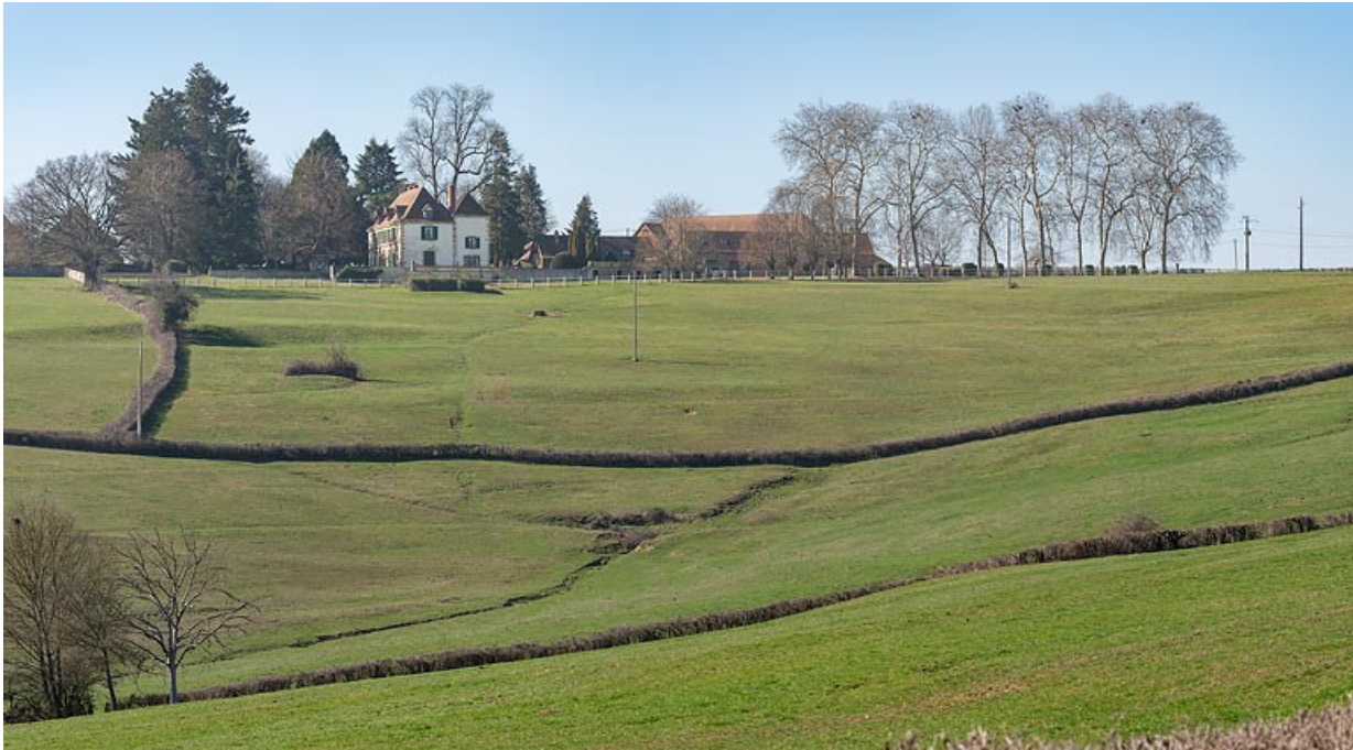
Le château et la ferme de Martigny, dans son paysage, au sommet du coteau dominant le val d'Arconce. 71, Poisson, lieudit : Martigny

N° de l'illustration : 20197100767NUC4AQ