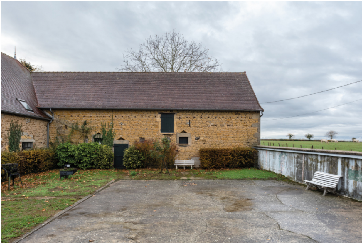
Façade du bâtiment perpendiculaire à la grange (abritant à l'origine des étables et aujourd'hui un petit théâtre) 71, Poisson, lieudit : Martigny