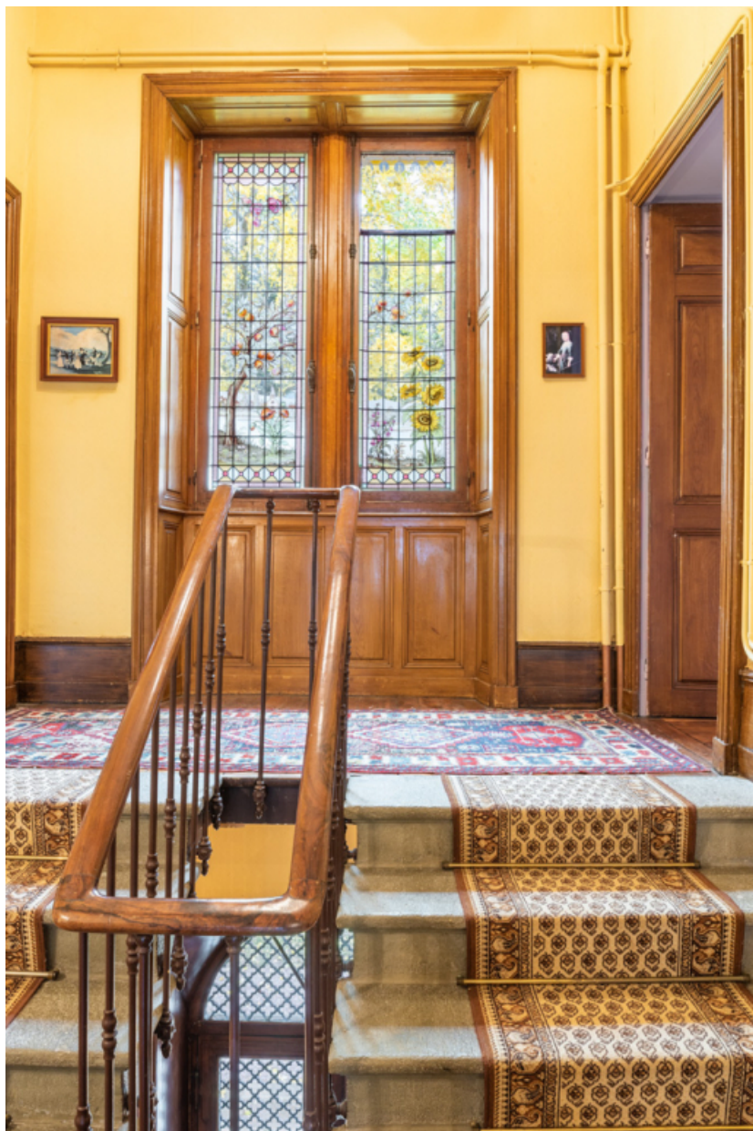
Baie dans l'escalier, ornée d'un vitrail des ateliers Bertrand de Chalon-sur-Saône 71, Poisson, lieudit : Martigny