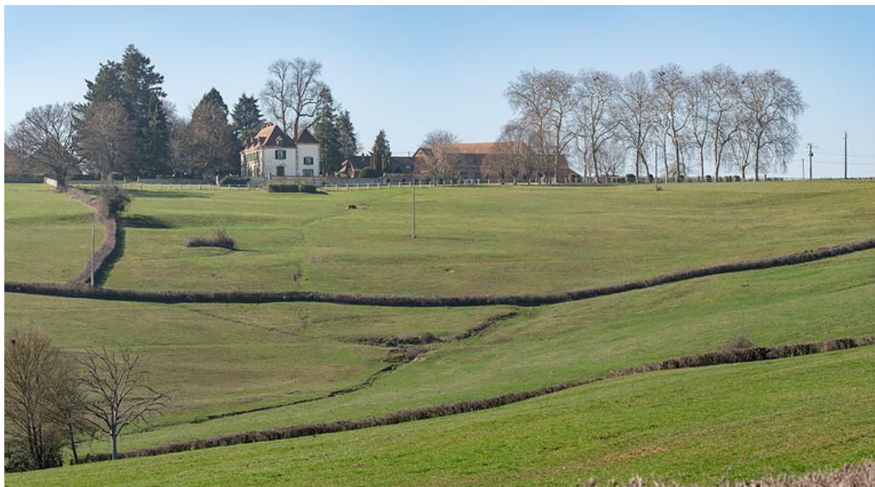
Le château et la ferme de Martigny, dans son paysage, au sommet du coteau dominant le val d'Arconce. 71, Poisson, lieudit : Martigny

N° de l'illustration : 20197100767NUC4AQ