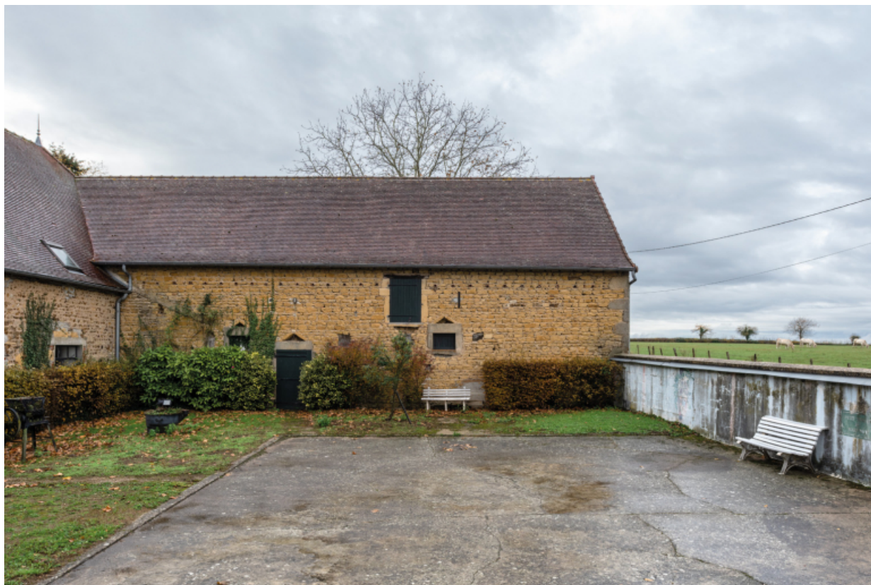
Façade du bâtiment perpendiculaire à la grange (abritant à l'origine des étables et aujourd'hui un petit théâtre) 71, Poisson, lieudit : Martigny