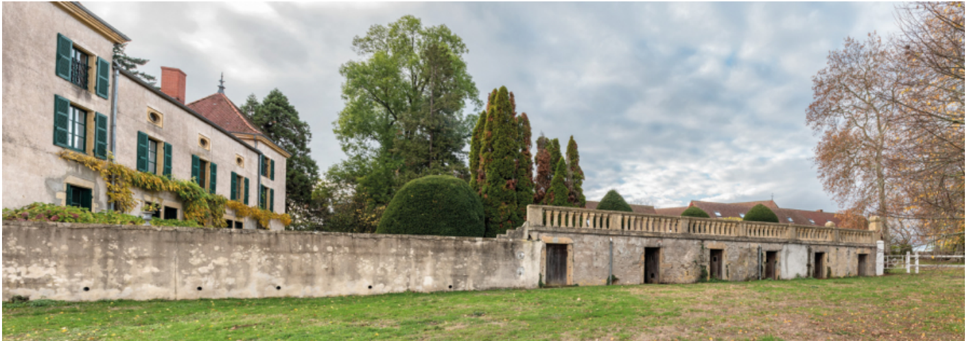
Vue du château, du mur de soutènement de la cour et des chenils