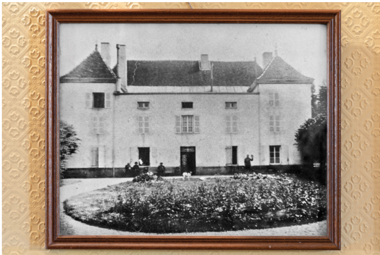
Vue de la façade antérieure du château au début du XXe siècle