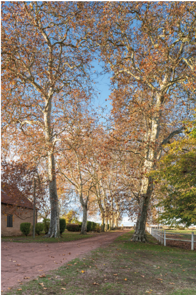
Allée devant le château