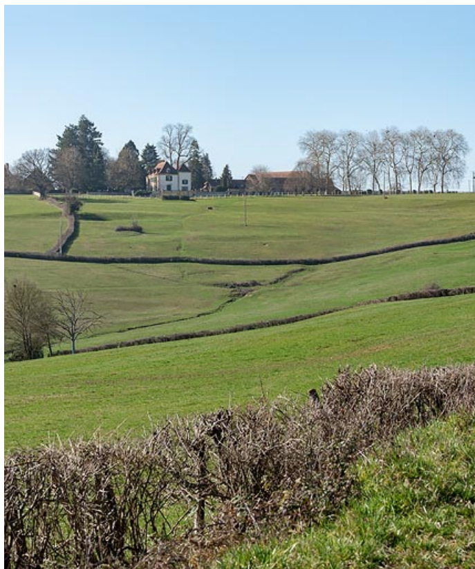
Le château et la ferme de Martigny, dans son paysage, au sommet du coteau dominant le val d'Arconce. 71, Poisson, lieudit : Martigny