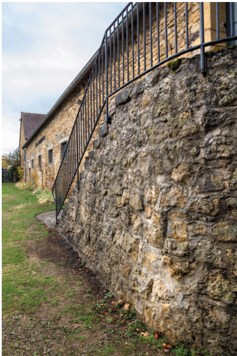
Vue de la grange et de l'escalier, à l'extrémité nord du bâtiment, dont la maçonnerie présente des fossiles 71, Poisson, lieudit : Martigny