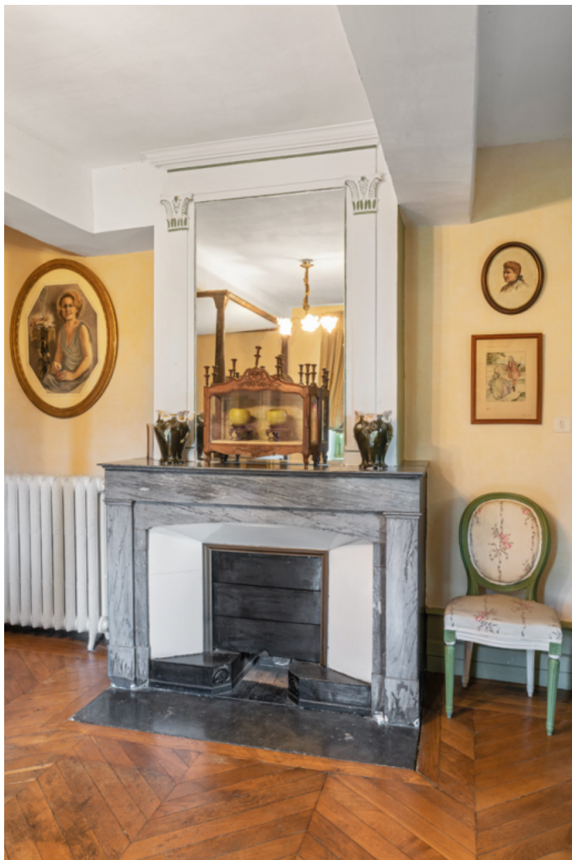
Cheminée dans une des chambres du château