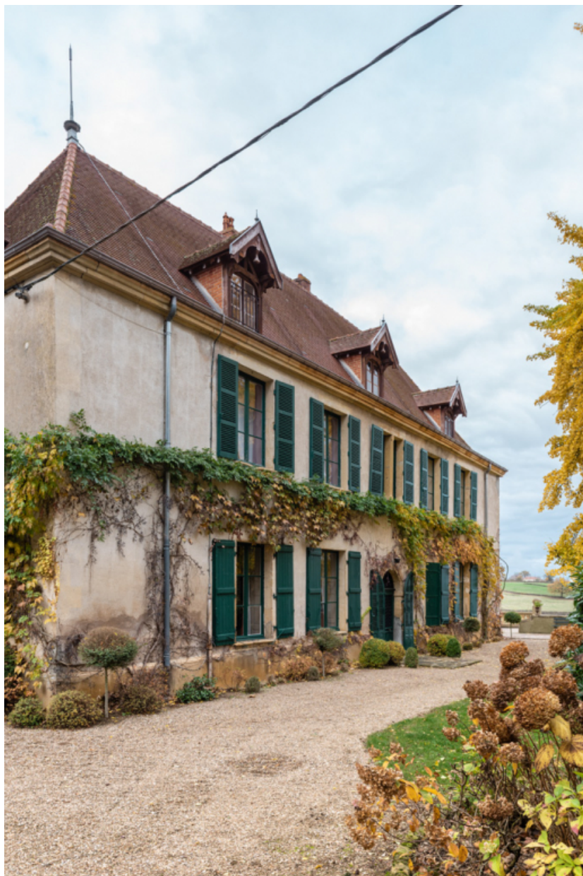
Façade postérieure du château