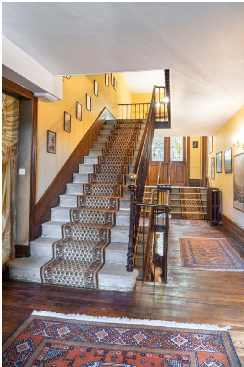
Escalier principal du château