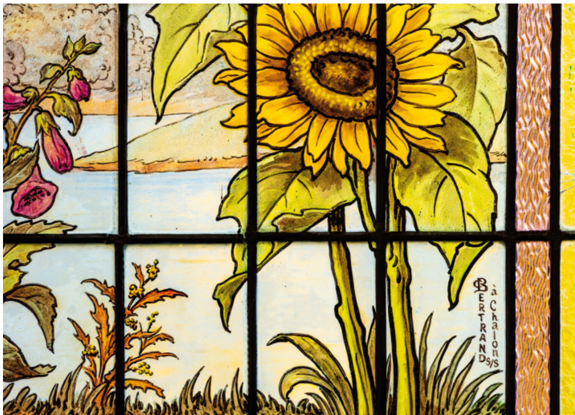
Détail du vitrail dans l'escalier