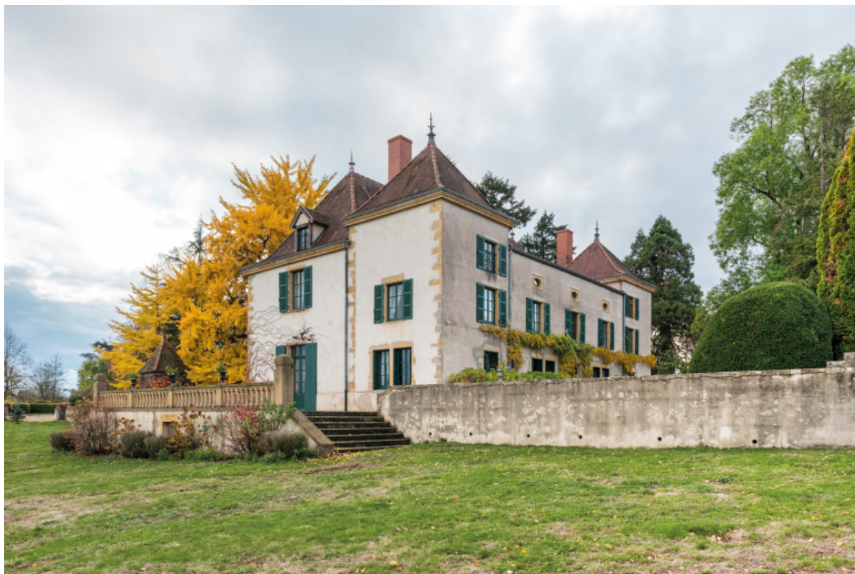
Château : vue de l'est