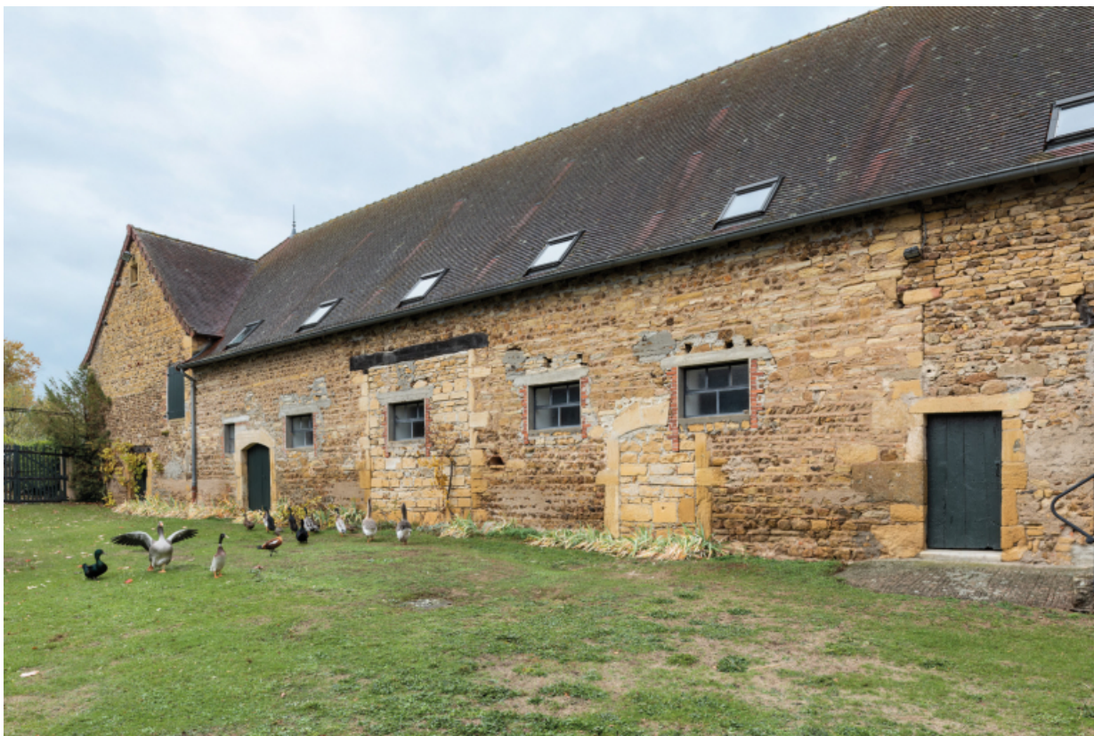
Façade antérieure de la grange, modifiée au XXe siècle