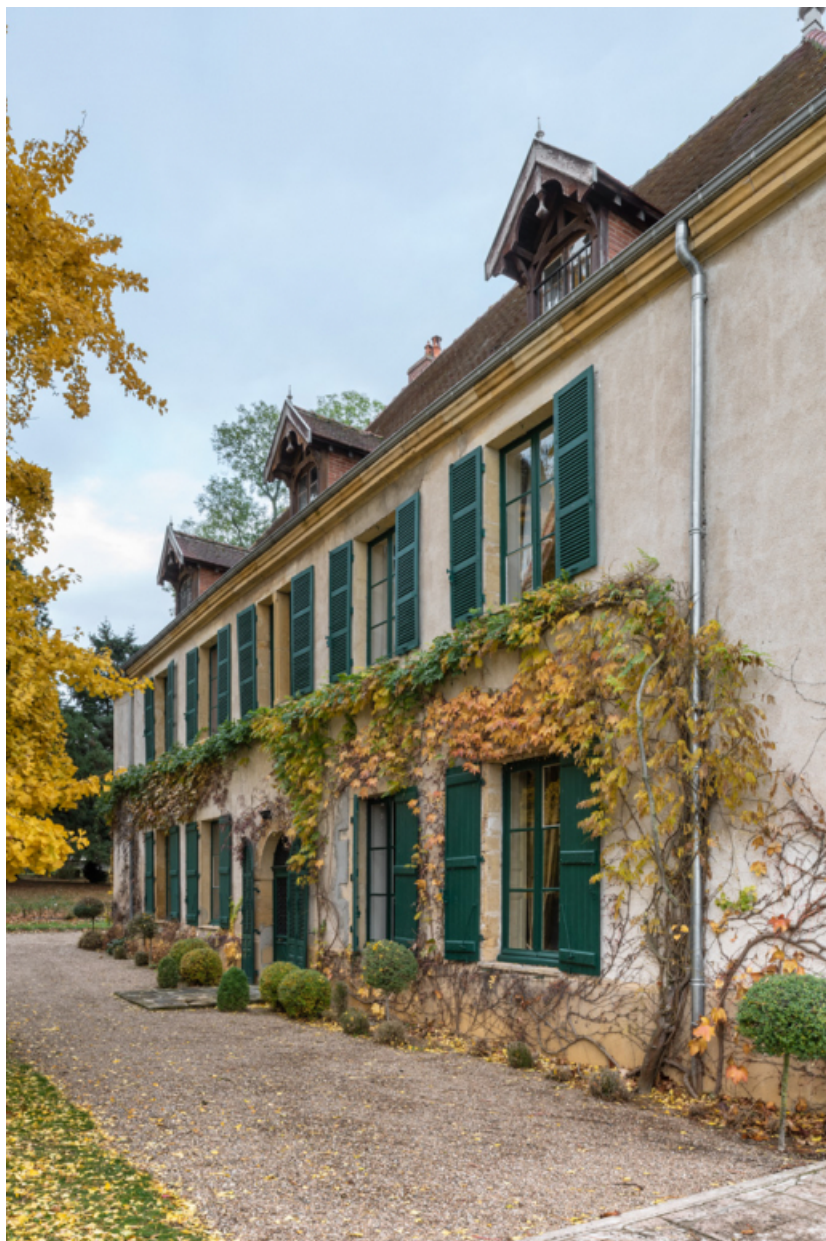
Façade antérieure du château