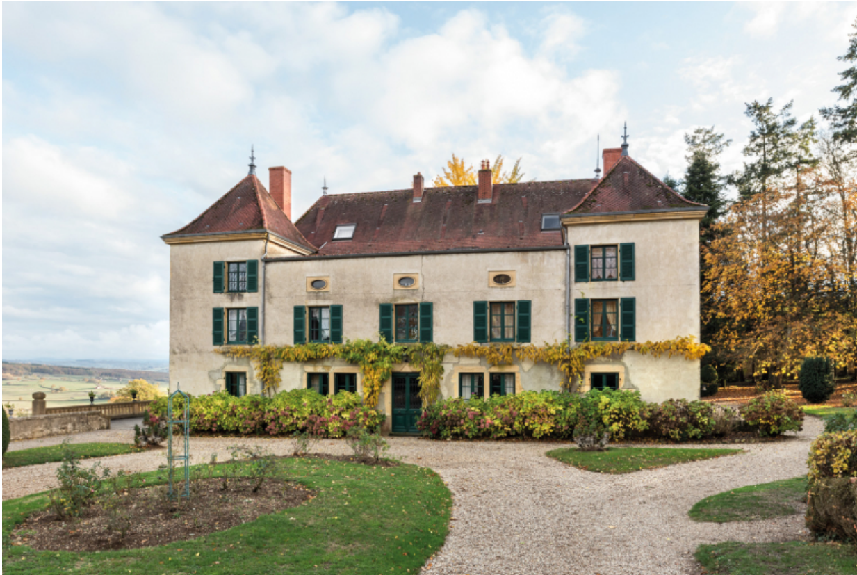
Façade antérieure du château