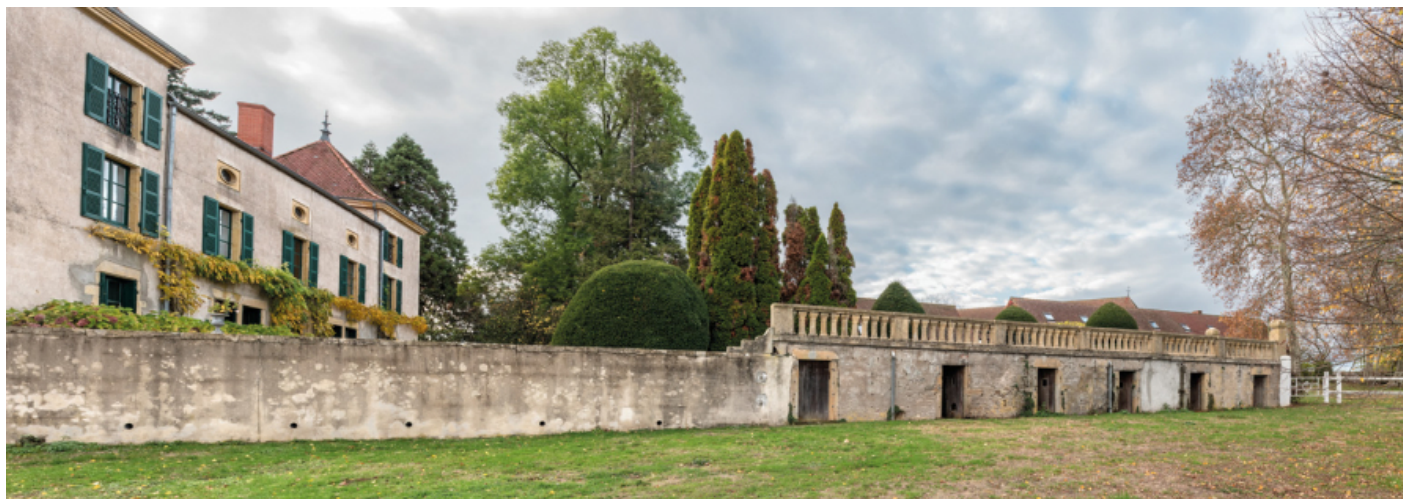
Vue du château, du mur de soutènement de la cour et des chenils