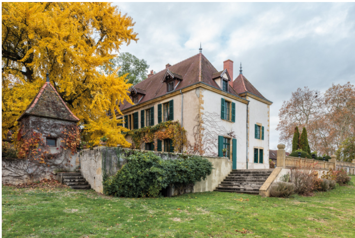
Château : vue de l'est