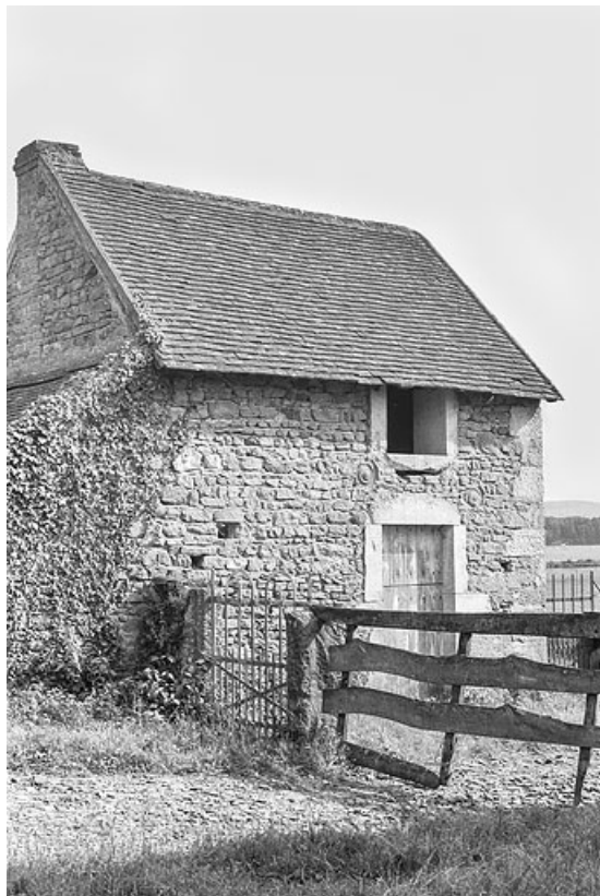
Vue du fournil vers 1970

71, Varenne-l'Arconce, lieudit : Les Crots de Perche