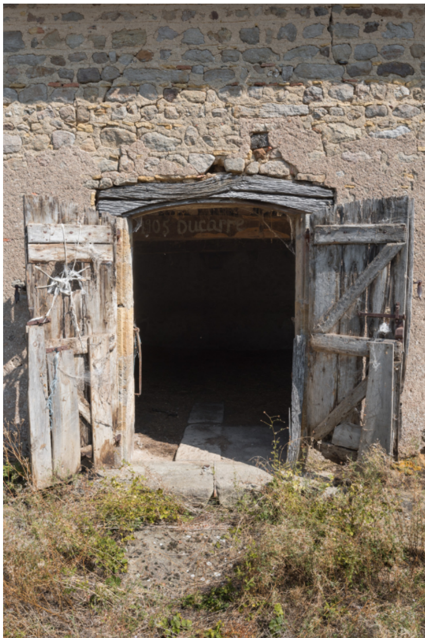
Porte de l'étable à vaches.

71, Varenne-l'Arconce, lieudit : Les Crots de Perche