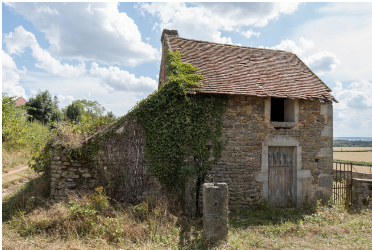
Vue de trois-quart de la façade antérieure de la dépendance et de son appentis.

71, Varenne-l'Arconce, lieu-dit : Les Crots de Perche