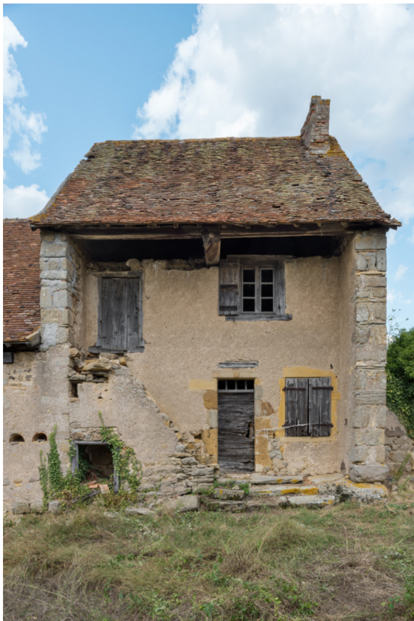
Vue de face de la façade antérieure de l'habitation.

71, Varenne-l'Arconce, lieu-dit : Les Crots de Perche