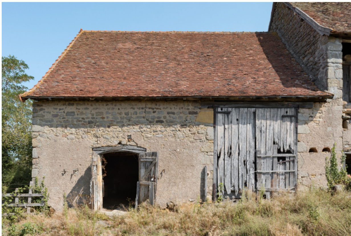
Vue de face des parties agricoles.

71, Varenne-l'Arconce, lieu-dit : Les Crots de Perche