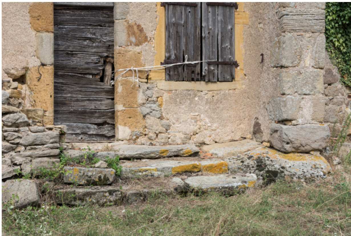
Vue sur les marches et les affleurements de roche devant la maison.

71, Varenne-l'Arconce, lieudit : Les Crots de Perche