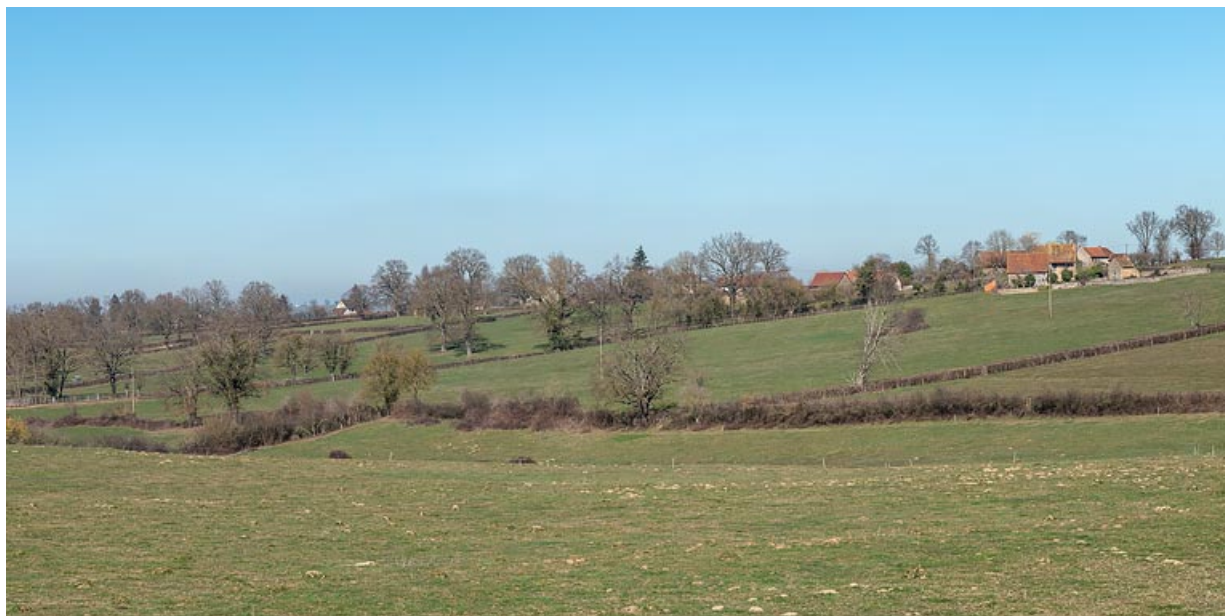
La ferme et le hameau du Crot de Perche dans son paysage environnant dominé par les prés.

71, Varenne-l'Arconce, lieudit : Les Crots de Perche