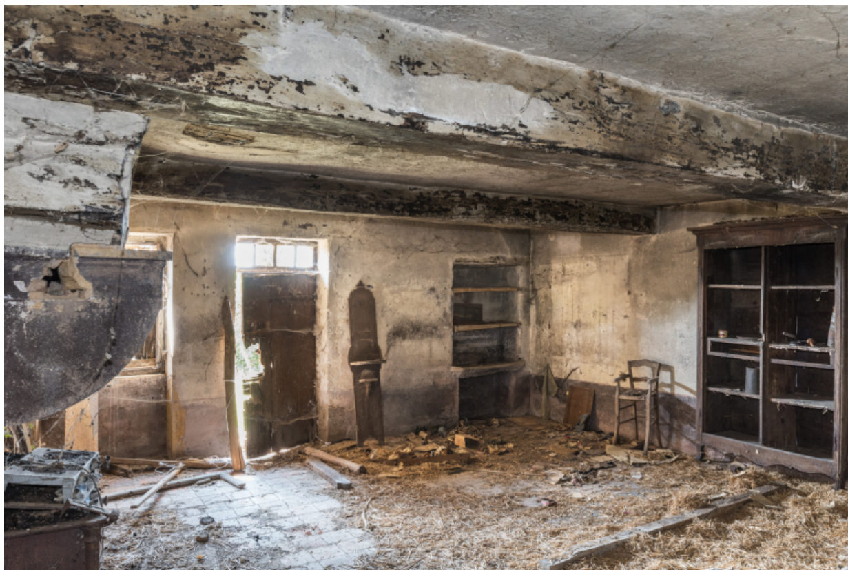
Vue intérieure de la pièce unique en rez-de-chaussée.

71, Varenne-l'Arconce, lieu-dit : Les Crots de Perche