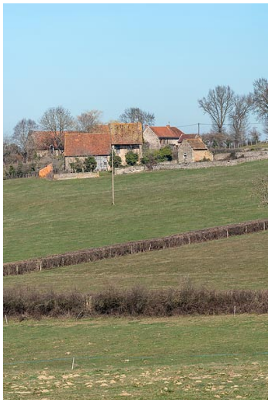
Vue de la ferme au sud

71, Varenne-l'Arconce, lieudit : Les Crots de Perche