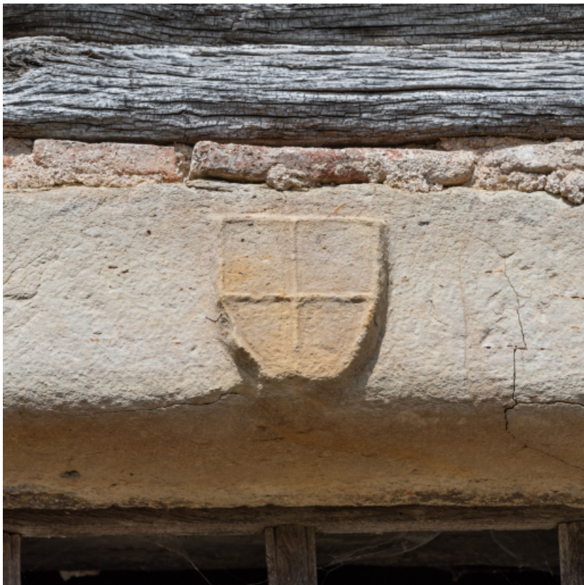
Vue rapprochée du blason sur le linteau de la porte d'entrée.

71, Varenne-l'Arconce, lieu-dit : Les Crots de Perche