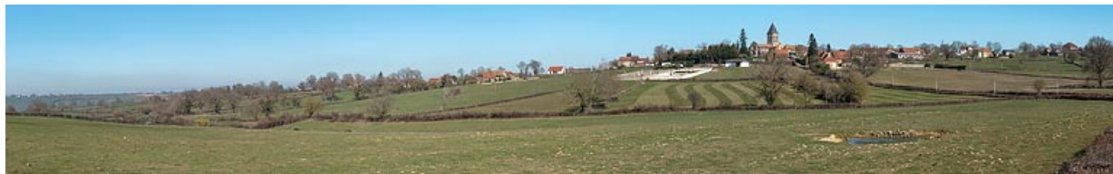
Panorama sur le bourg de Varenne-l'Arconce et le hameau du Crot de Perche dominant le vallon du ruisseau des Mauvières. 71, Varenne-l'Arconce, lieudit : Les Crots de Perche

N° de l'illustration : 20197100762NUC4AQ