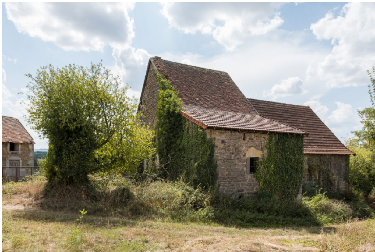
Vue de trois-quart nord-est des façades postérieures.

71, Varenne-l'Arconce, lieudit : Les Crots de Perche