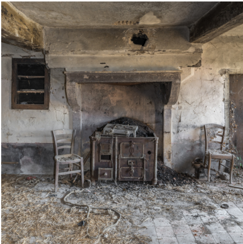
Vue de face de la cheminée. Pièce unique du rez-de-chaussée.

71, Varenne-l'Arconce, lieudit : Les Crots de Perche