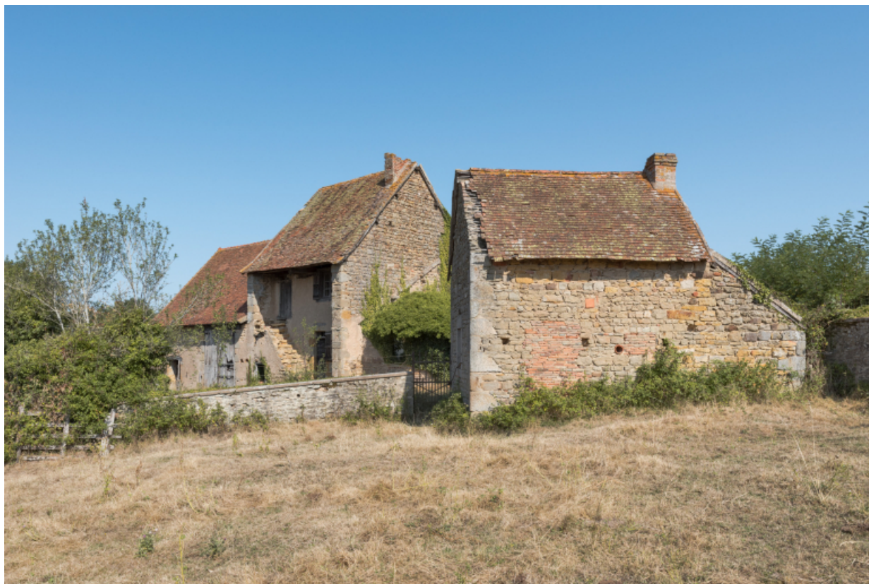
Vue d'ensemble depuis le sud-est des façades antérieures de la maison.

71, Varenne-l'Arconce, lieudit : Les Crots de Perche