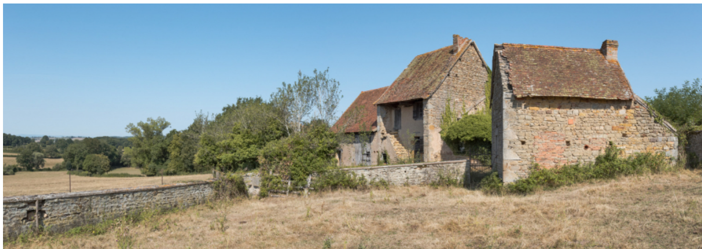
Vue d'ensemble depuis le sud-est des façades antérieures de la maison.

N° de l'illustration : 20187100385NUC4AQ