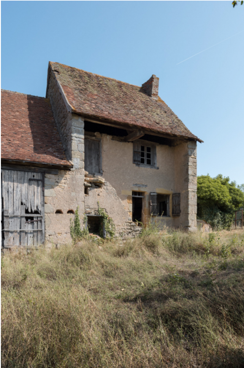
Vue de trois quart sud-ouest de la maison ferme.

71, Varenne-l'Arconce, lieudit : Les Crots de Perche