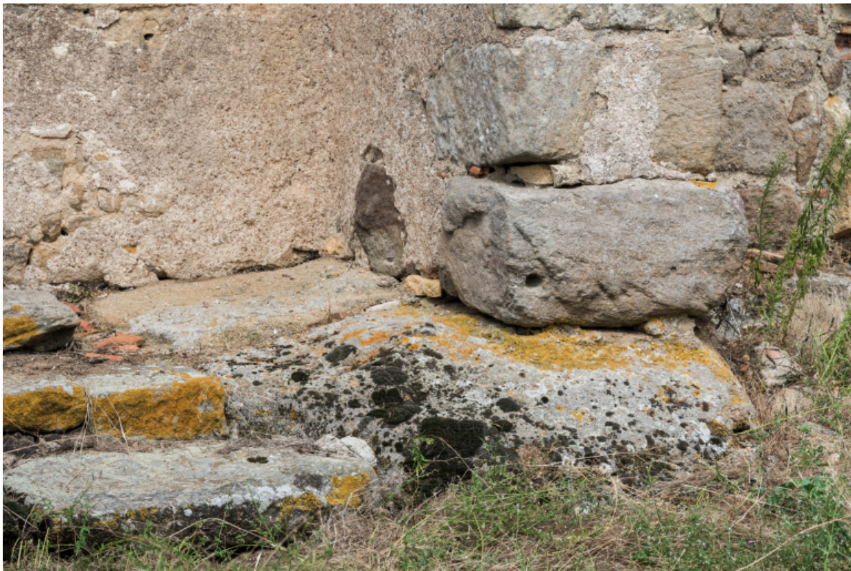
détail des marches et des affleurements de roche devant la maison.

71, Varenne-l'Arconce, lieudit : Les Crots de Perche