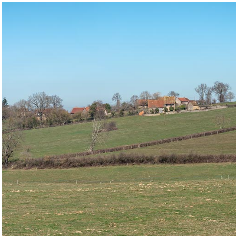
La ferme, au sommet du coteau, et à l'arrière-plan le hameau du Crot de Perche. 71, Varenne-l'Arconce, lieudit : Les Crots de Perche

N° de l'illustration : 20197100766NUC4AQ