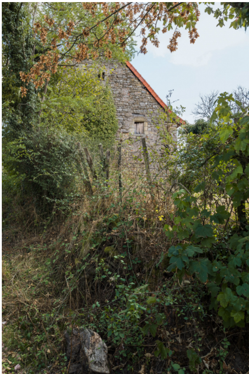
Pignon ouest de la partie agricole.

71, Varenne-l'Arconce, lieudit : Les Crots de Perche