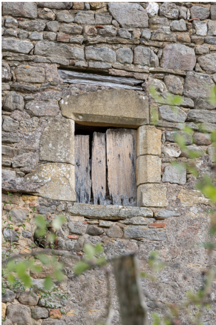
Vue rapprochée de la baie ouverte dans le pignon ouest.

71, Varenne-l'Arconce, lieu-dit : Les Crots de Perche