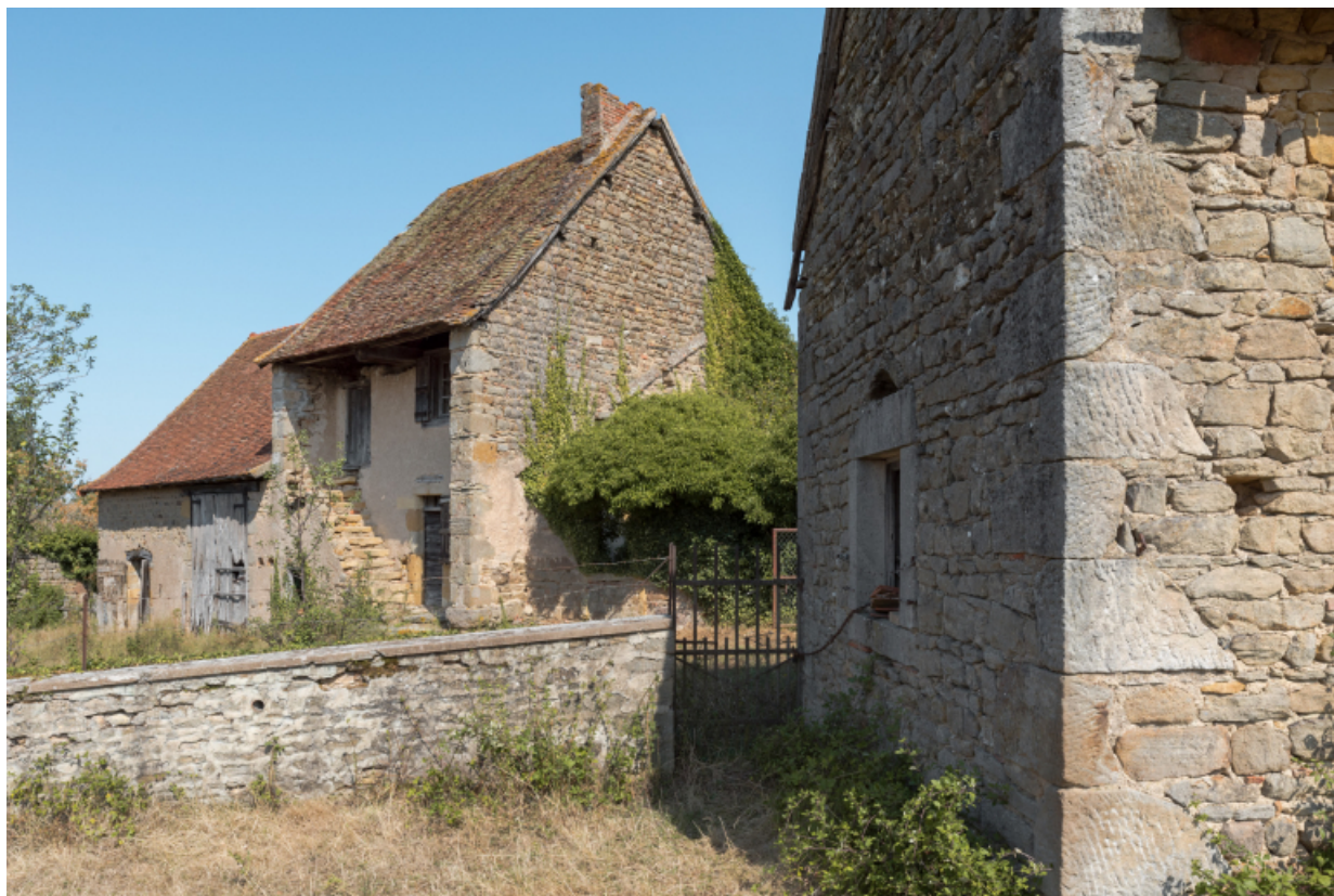
Vue rapprochée depuis l'angle sud de la dépendance.

71, Varenne-l'Arconce, lieu-dit : Les Crots de Perche