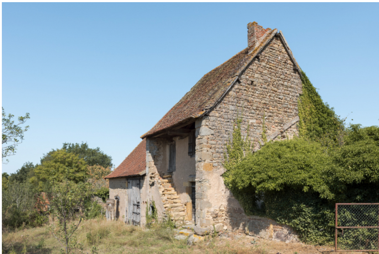
Vue de trois quart sud-est de la maison ferme.

71, Varenne-l'Arconce, lieudit : Les Crots de Perche