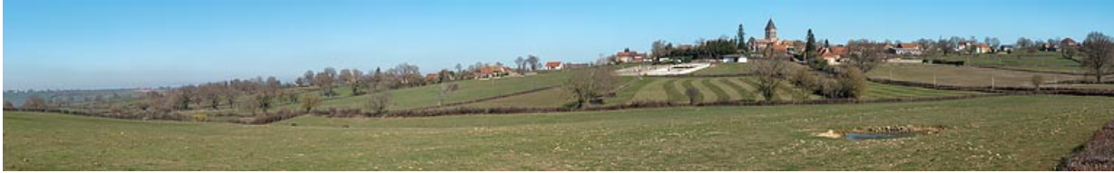
Panorama sur le bourg de Varenne-l'Arconce et le hameau du Crot de Perche dominant le vallon du ruisseau des Mauvières.

71, Varenne-l'Arconce, lieudit : Les Crots de Perche