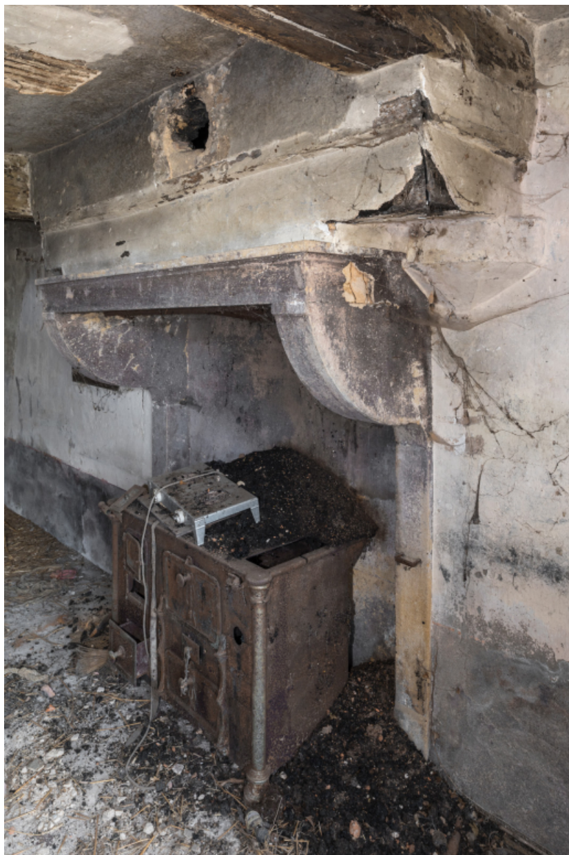
Vue de trois-quart de la cheminée. Pièce unique du rez-de-chaussée.

71, Varenne-l'Arconce, lieudit : Les Crots de Perche