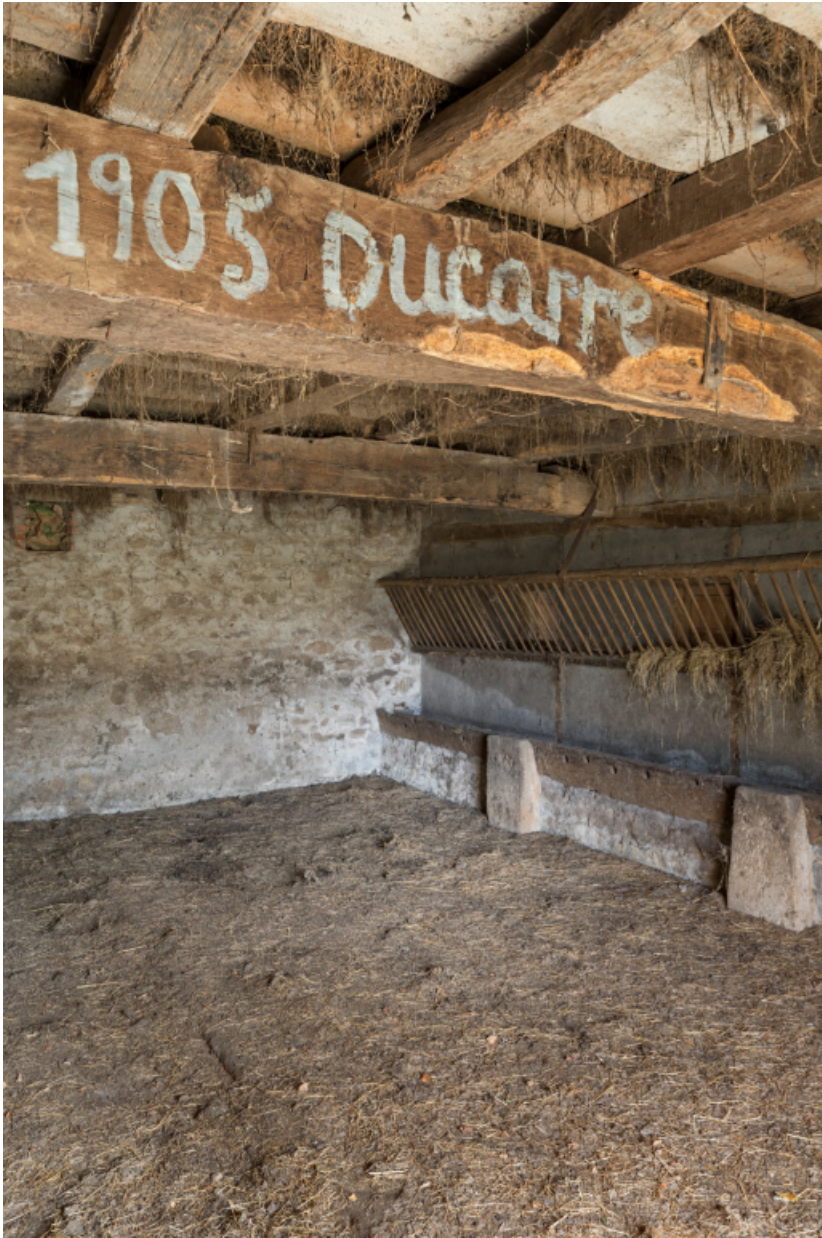
Vue intérieure de l'étable à vache. inscription et date sur la charpente.

71, Varenne-l'Arconce, lieu-dit : Les Crots de Perche