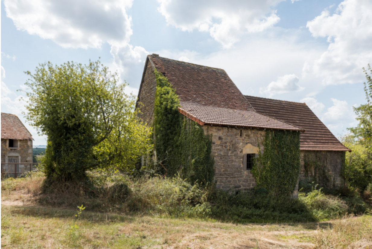
Vue de trois-quart nord-est des façades postérieures.

71, Varenne-l'Arconce, lieudit : Les Crots de Perche