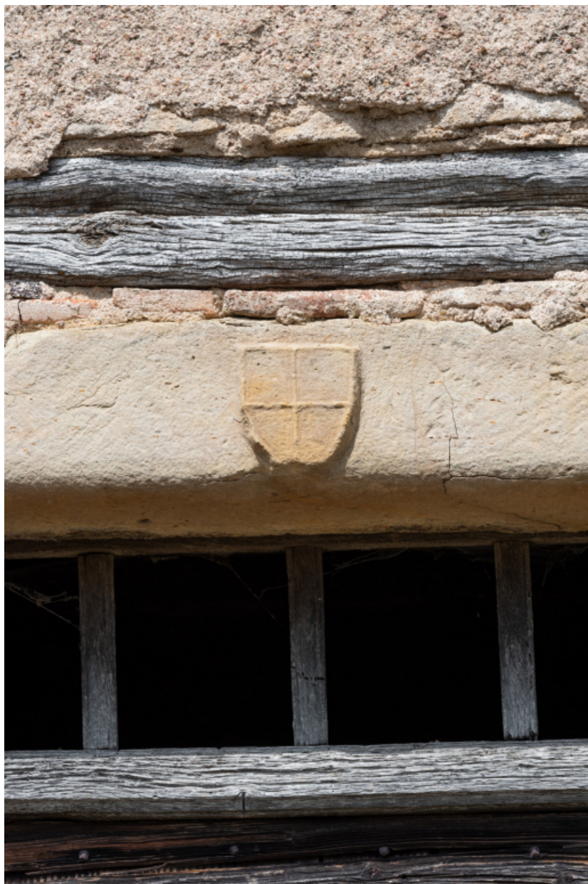
Détail du blason sur le linteau de la porte d'entrée.

71, Varenne-l'Arconce, lieudit : Les Crots de Perche