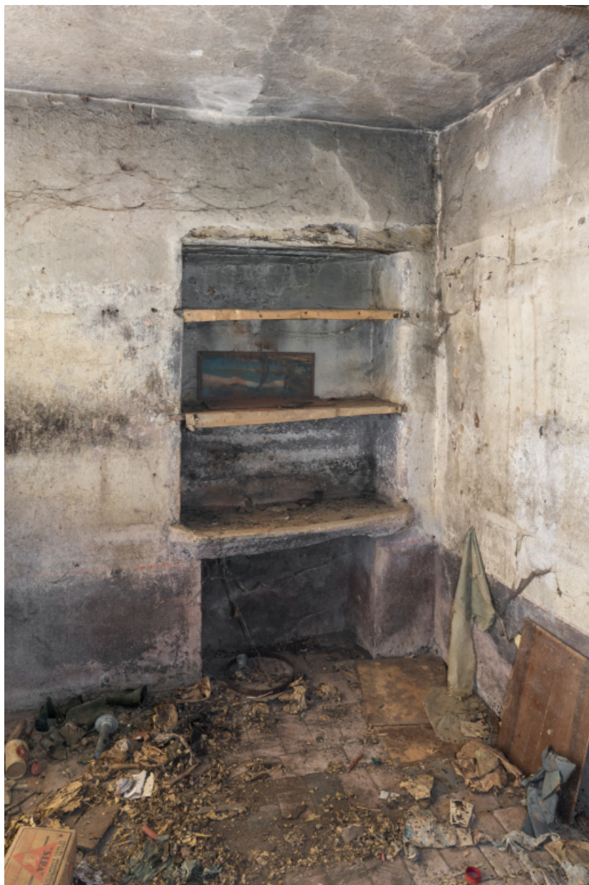
Niche et pierre d'évier dans la pièce du rez-de-chaussée.

71, Varenne-l'Arconce, lieudit : Les Crots de Perche