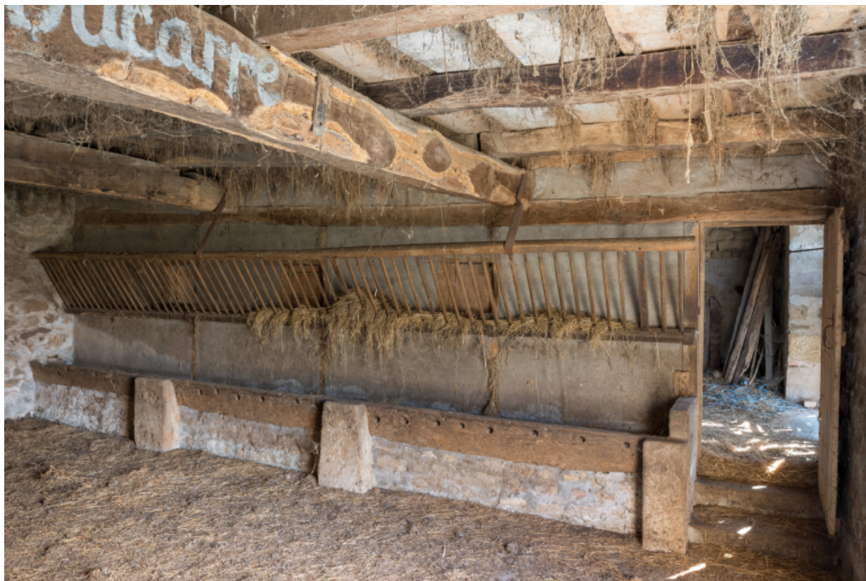
Vue de trois-quart sur l'étable à vaches et le fenil.

71, Varenne-l'Arconce, lieudit : Les Crots de Perche