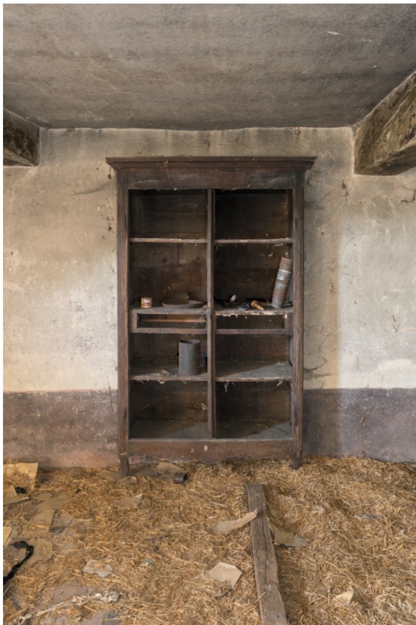
Vue de face d'un placard dans la pièce du rez-de-chaussée.

71, Varenne-l'Arconce, lieudit : Les Crots de Perche