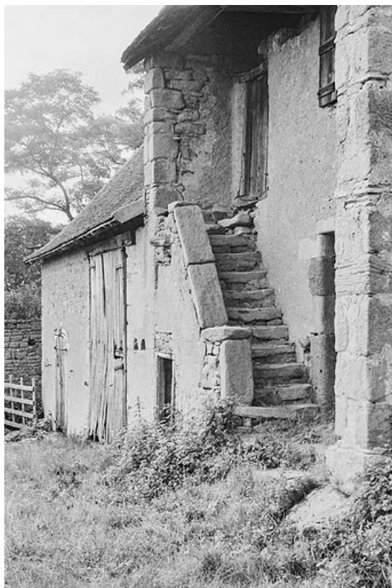
Vue de la maison et de la grange vers 1970

71, Varenne-l'Arconce, lieudit : Les Crots de Perche