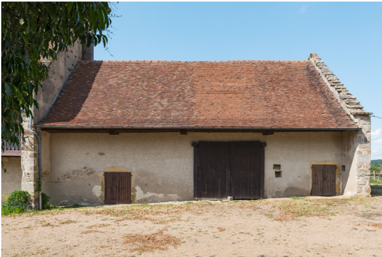
Vue de face de la façade antérieure de la partie agricole : grange et étables.

71, Amanzé, lieudit : La Grange Plassard