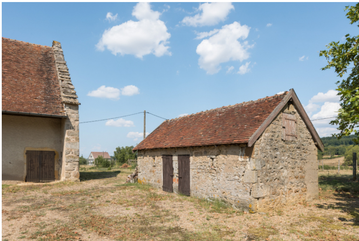
Vue de trois-quart sud-ouest de la dépendance est. (soue? poulailler?)

71, Amanzé, lieudit : La Grange Plassard