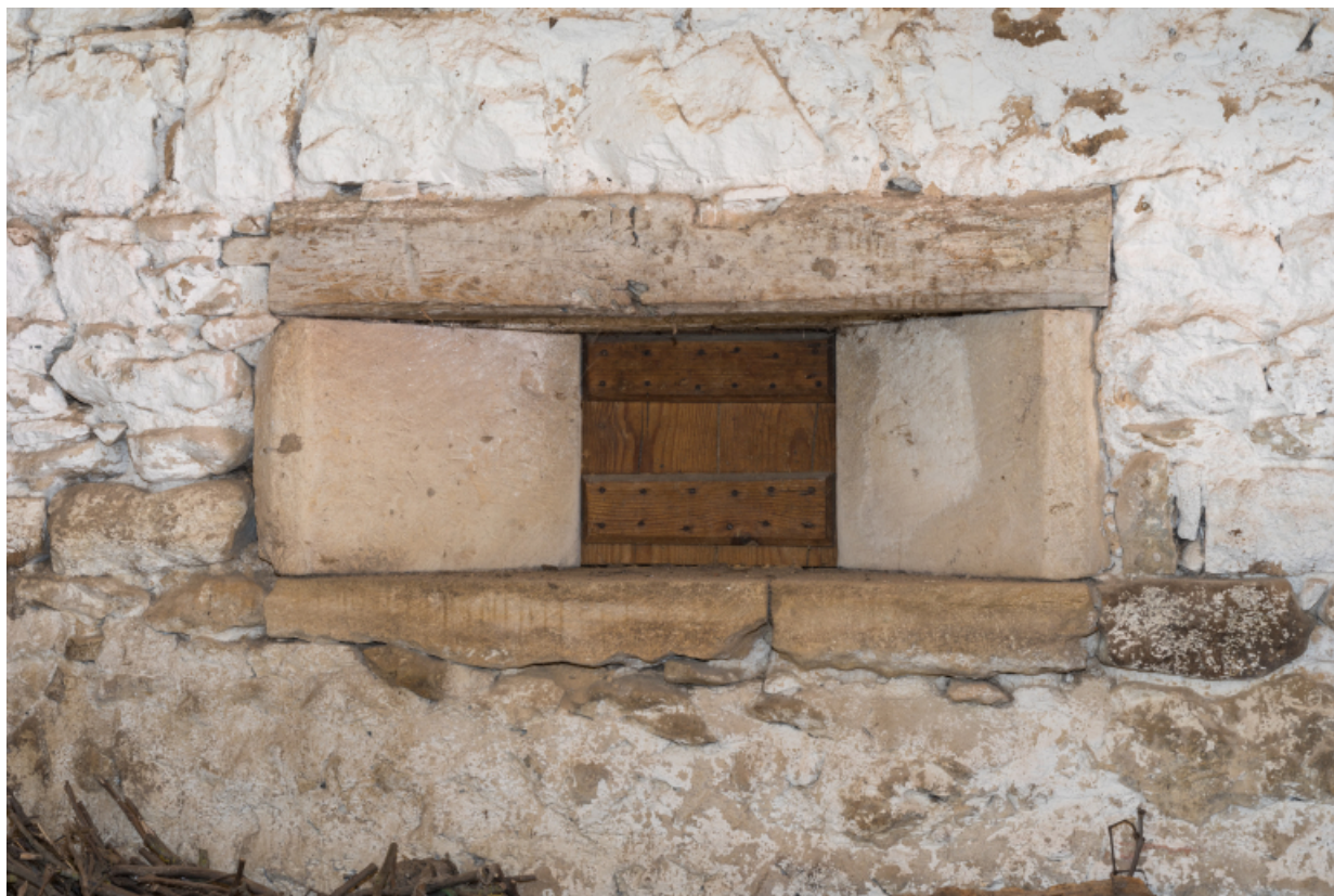
Vue rapprochée d'une baie -dite feuron- ménagée dans la cloison entre la grange et l'étable.

71, Amanzé, lieudit : La Grange Plassard