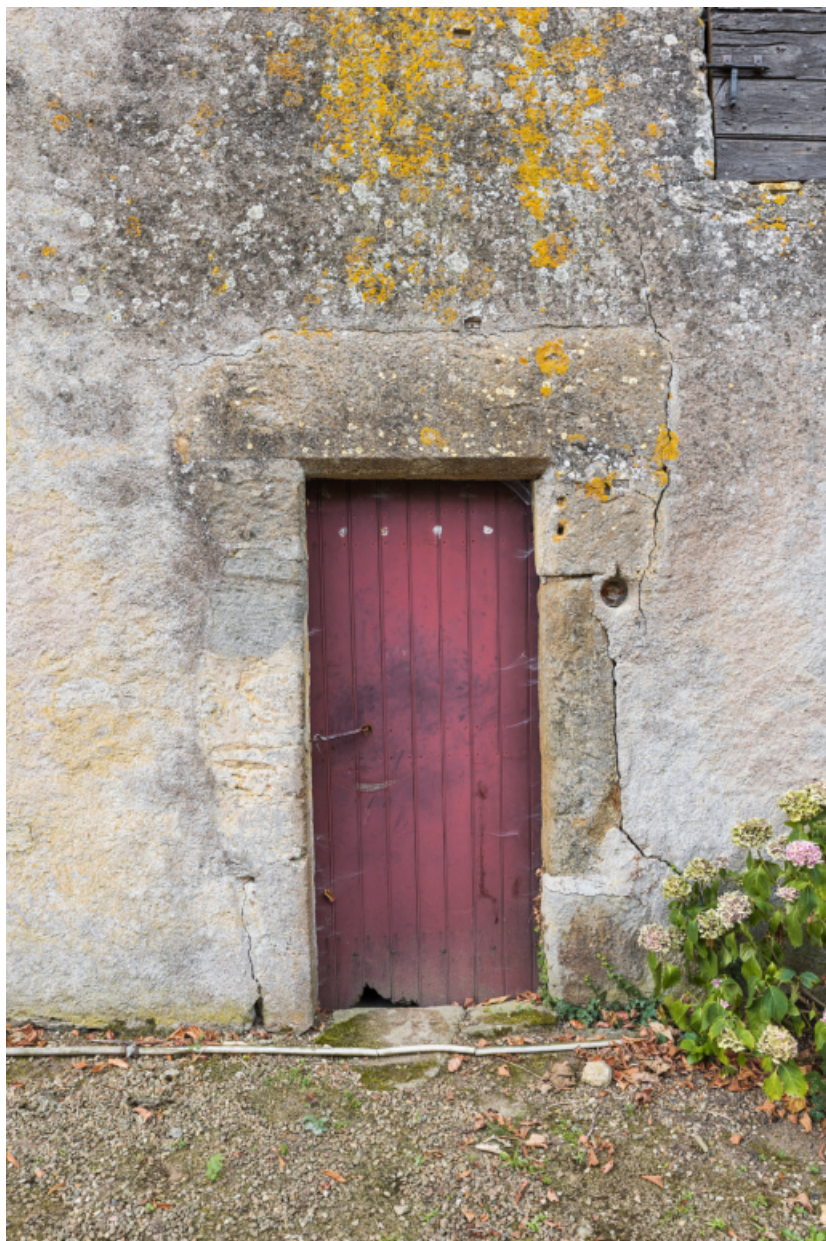
Vue rapprochée de la porte d'entrée de la dépendance dont le linteau porte la date : 1685 (?) 71, Amanzé, lieudit : La Grange Plassard