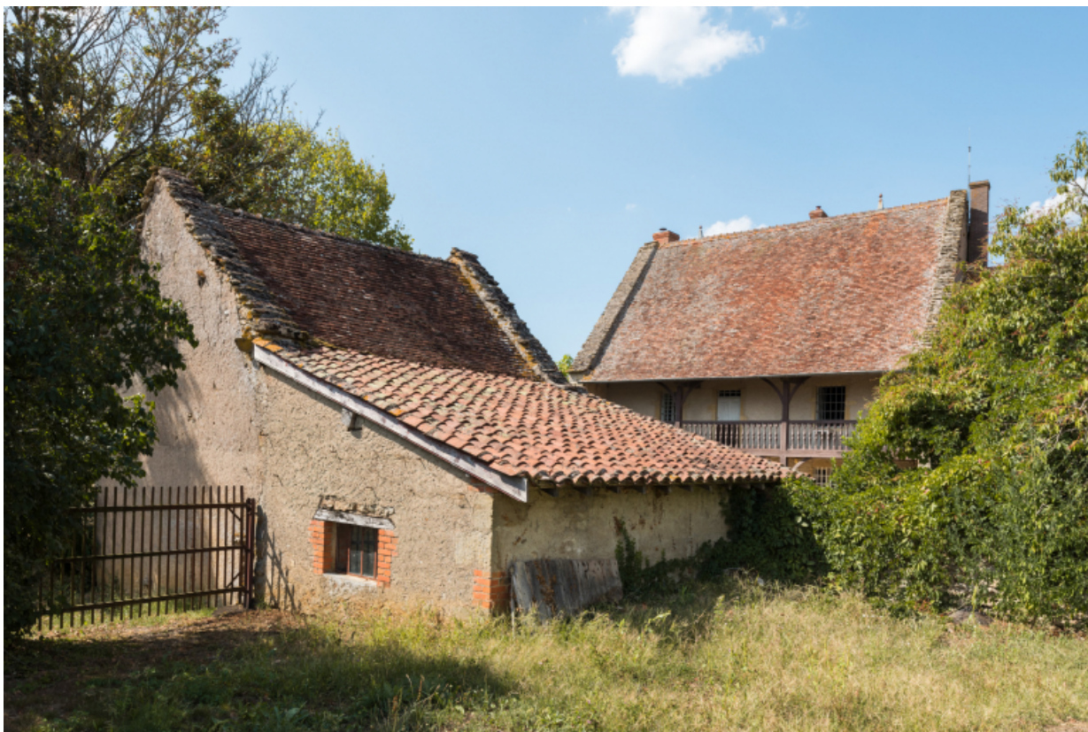
Vue de trois-quart sud-est de la dépendance agricole.

71, Amanzé, lieudit : La Grange Plassard