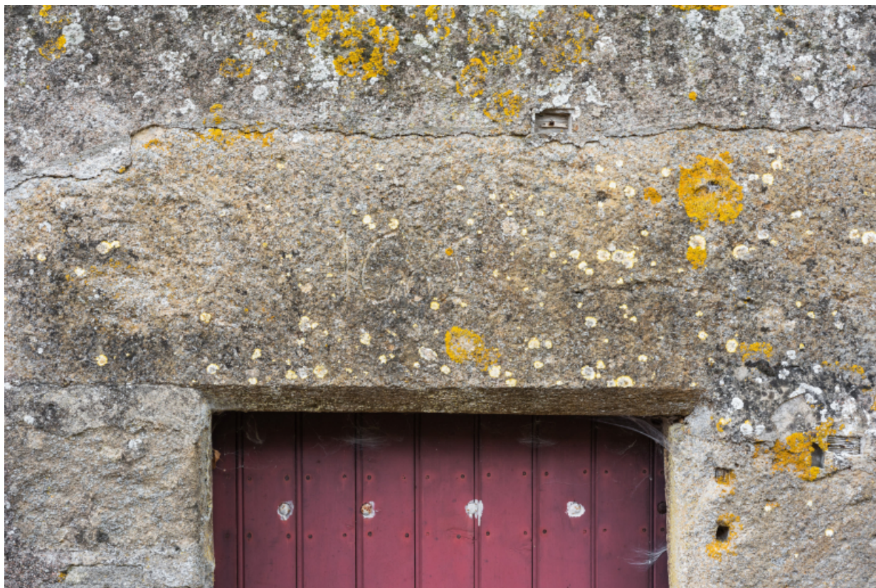
Vue rapprochée du linteau qui porte la date : 1685 (?)

71, Amanzé, lieudit : La Grange Plassard