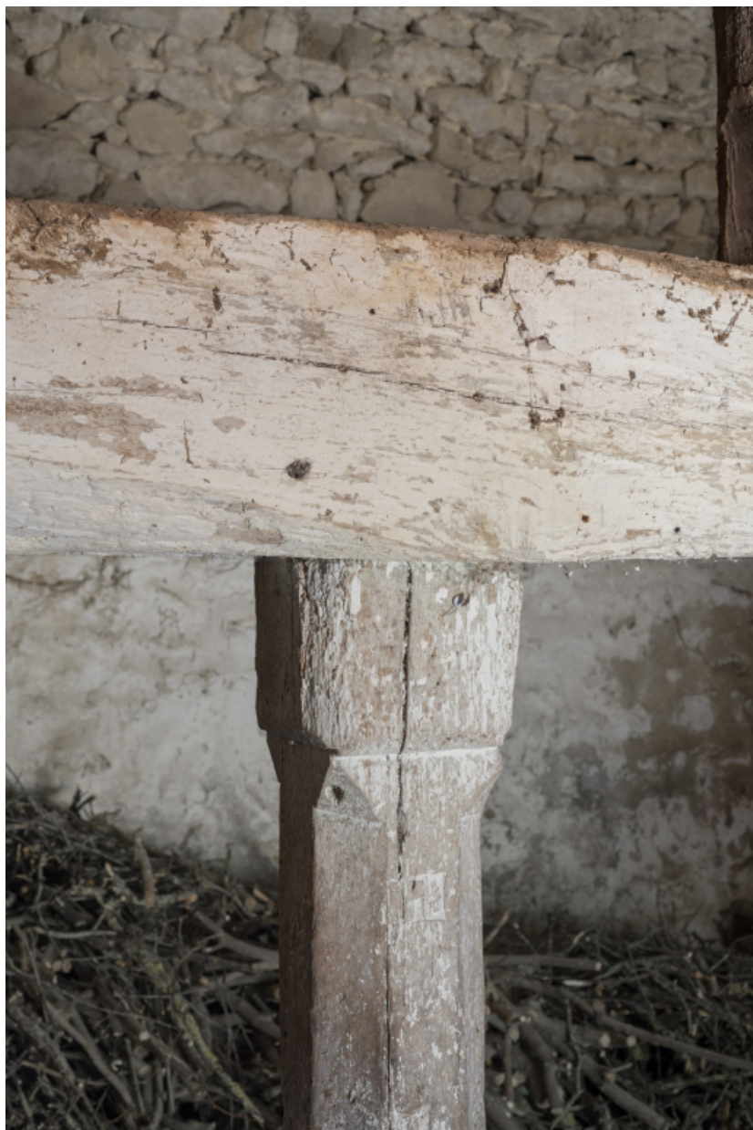
Vue rapprochée d'un assemblage poutre-poteau.

71, Amanzé, lieudit : La Grange Plassard