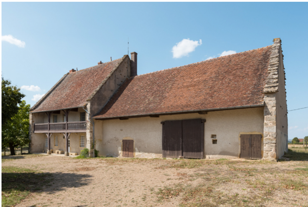
Vue des façades antérieures depuis la cour au sud-est.

71, Amanzé, lieudit : La Grange Plassard