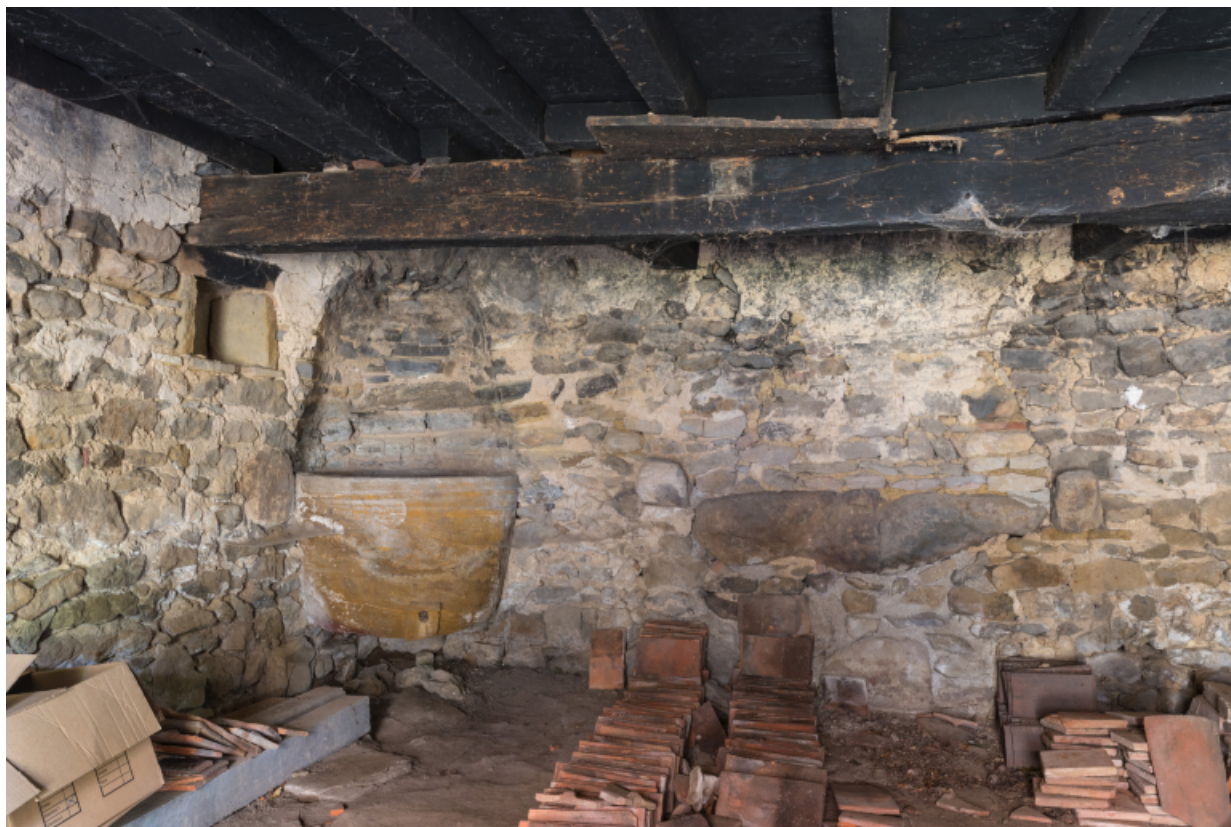
Vue intérieure de la dépendance. Face au mur postérieur sud.

71, Amanzé, lieudit : La Grange Plassard