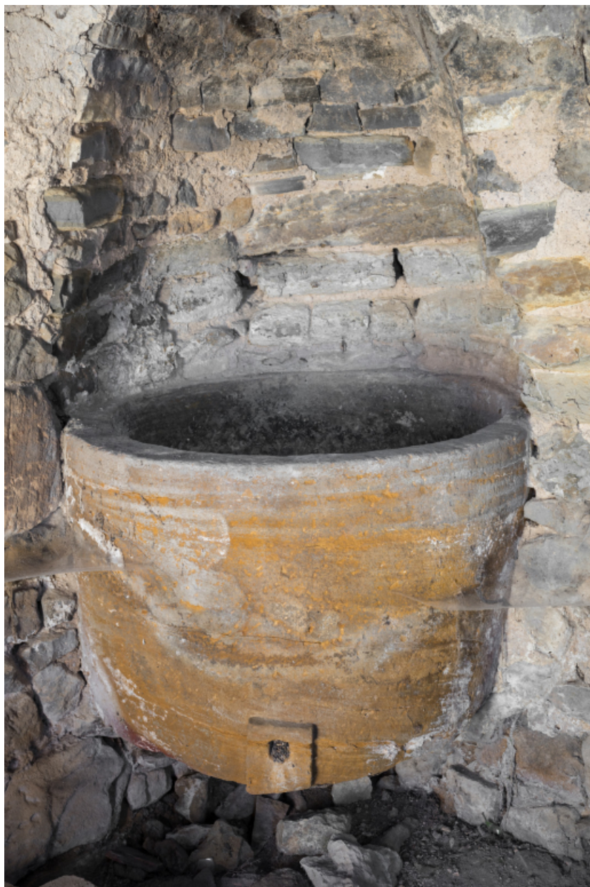
Vue rapprochée : cuve.

71, Amanzé, lieudit : La Grange Plassard