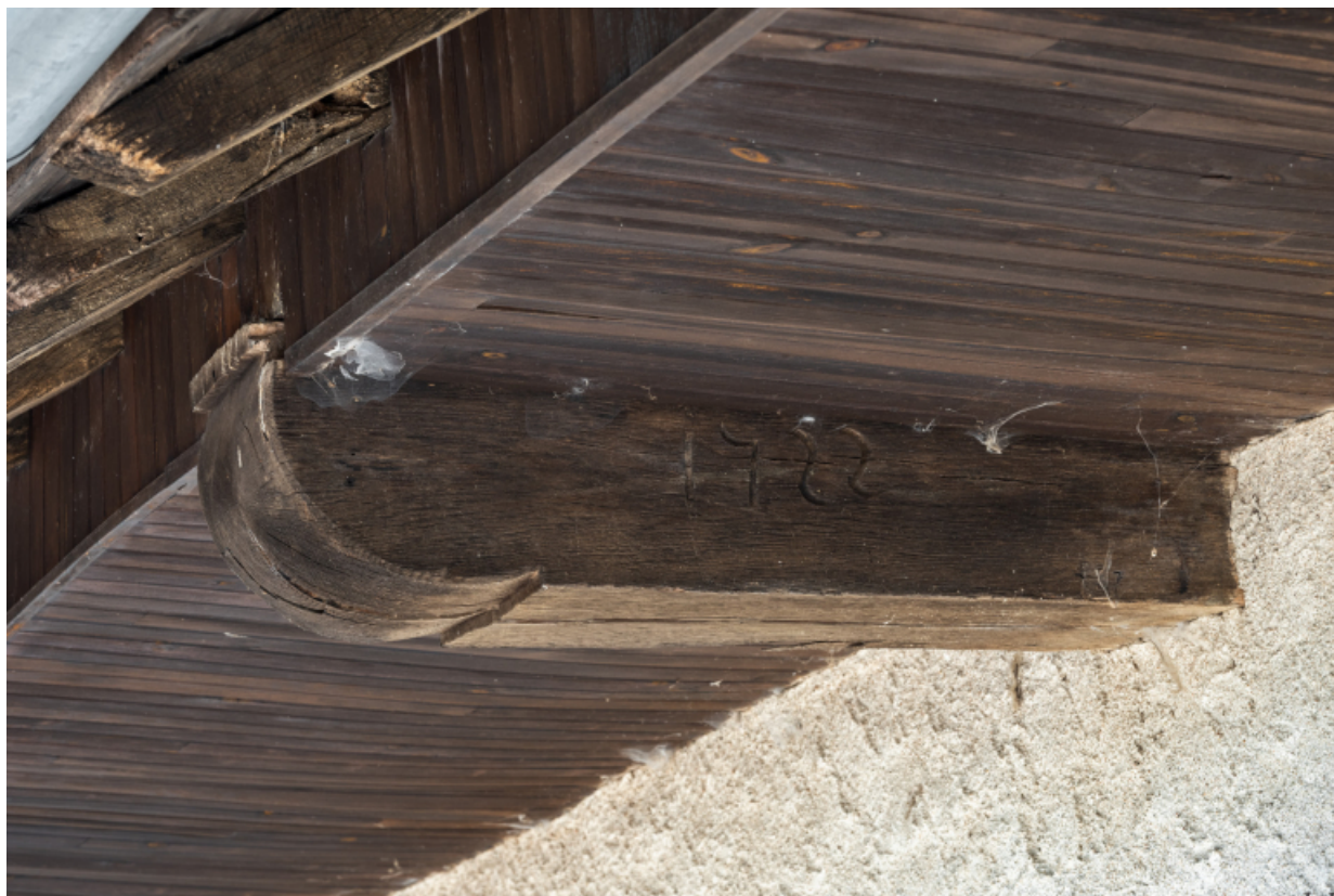
Vue de détail de la date 1722 sur un élément de charpente.

71, Amanzé, lieudit : La Grange Plassard