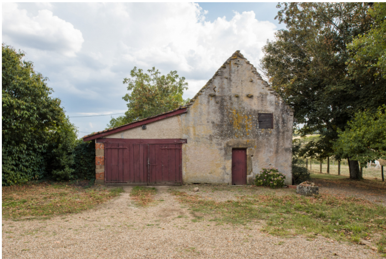
Vue de face de la façade antérieure - nord - des dépendances.

71, Amanzé, lieudit : La Grange Plassard