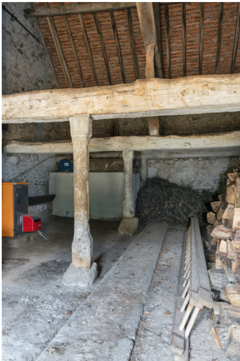
Vue intérieure de l'étable : poteaux sculptés.

71, Amanzé, lieudit : La Grange Plassard