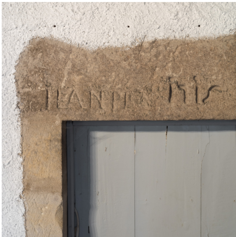
Vue rapprochée d'une inscription et d'une date portée sur un linteau.

71, Amanzé, lieudit : La Grange Plassard