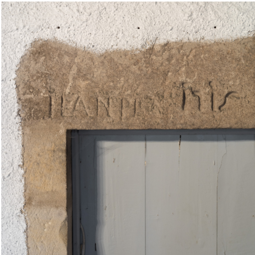
Vue rapprochée d'une inscription et d'une date portée sur un linteau.

71, Amanzé, lieudit : La Grange Plassard