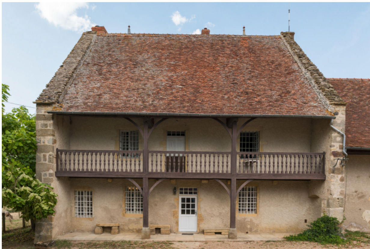
Vue de face de la maison. Façade antérieure.

71, Amanzé, lieudit : La Grange Plassard