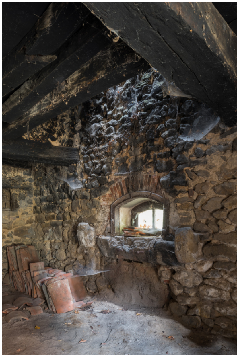
Vue intérieure du pignon ouest de la dépendance.

71, Amanzé, lieudit : La Grange Plassard