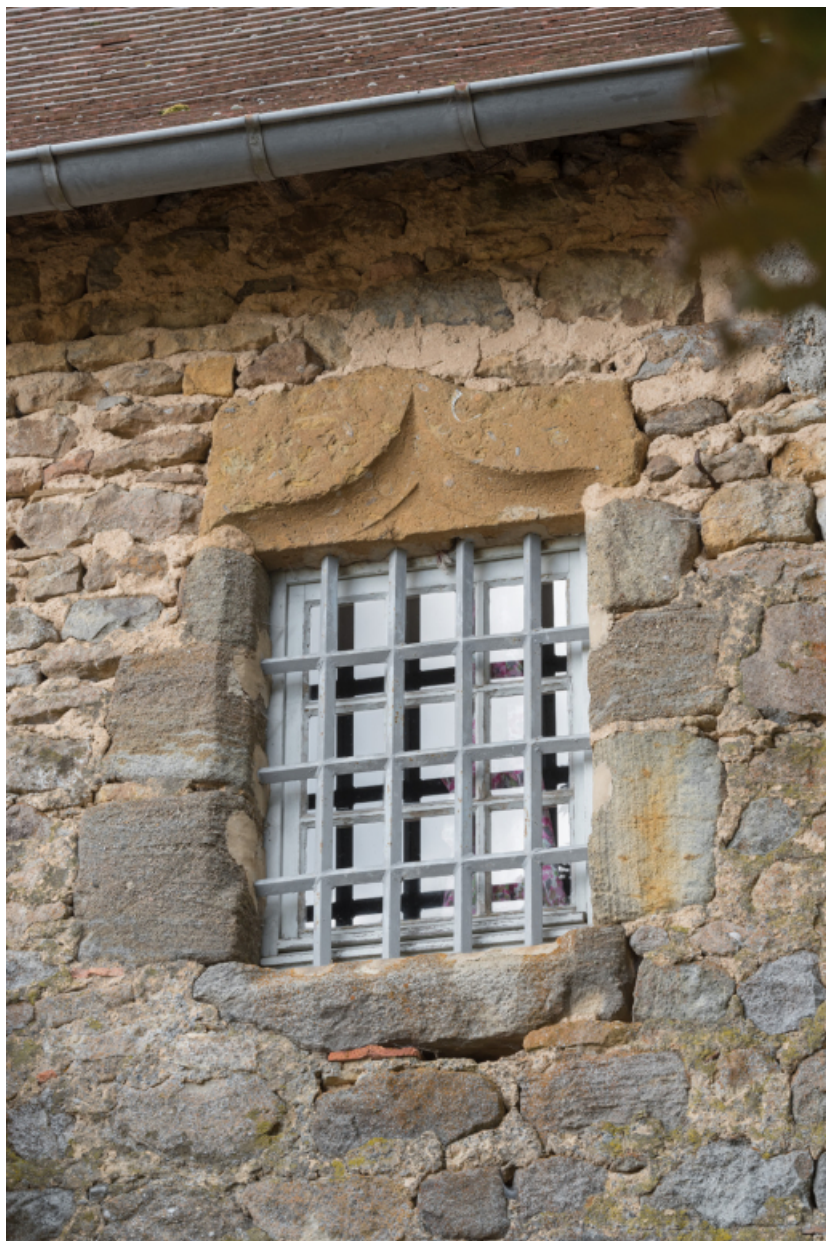
Détail de la baie ouest à l'étage de la façade postérieure.

71, Amanzé, lieudit : La Grange Plassard