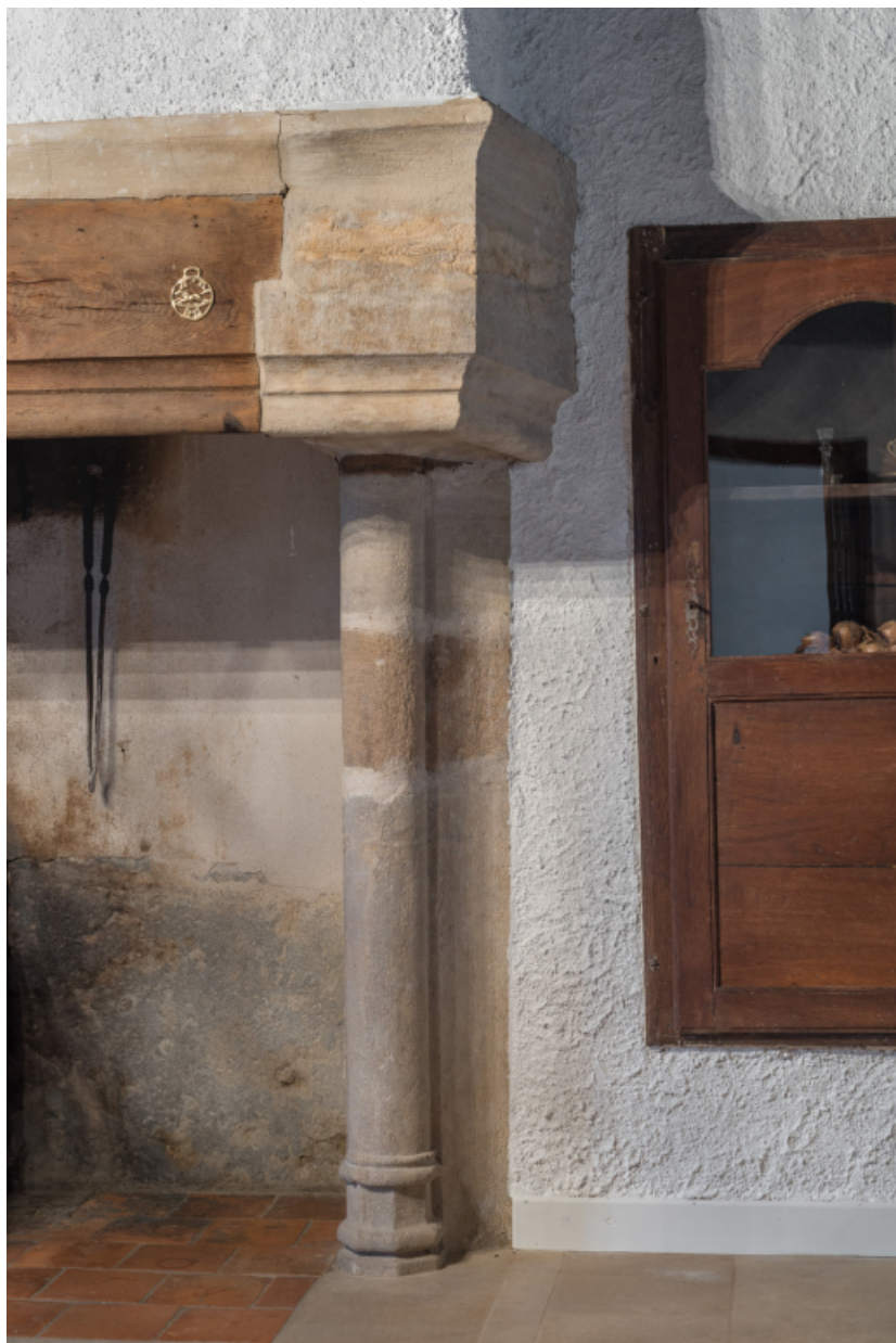
Vue rapprochée du piedroit droit de la cheminée du rez-de-chaussée.

71, Amanzé, lieudit : La Grange Plassard