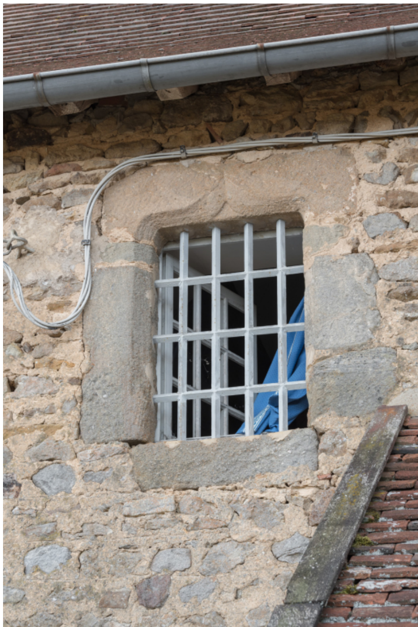
Détail de la baie est à l'étage de la façade postérieure.

71, Amanzé, lieudit : La Grange Plassard