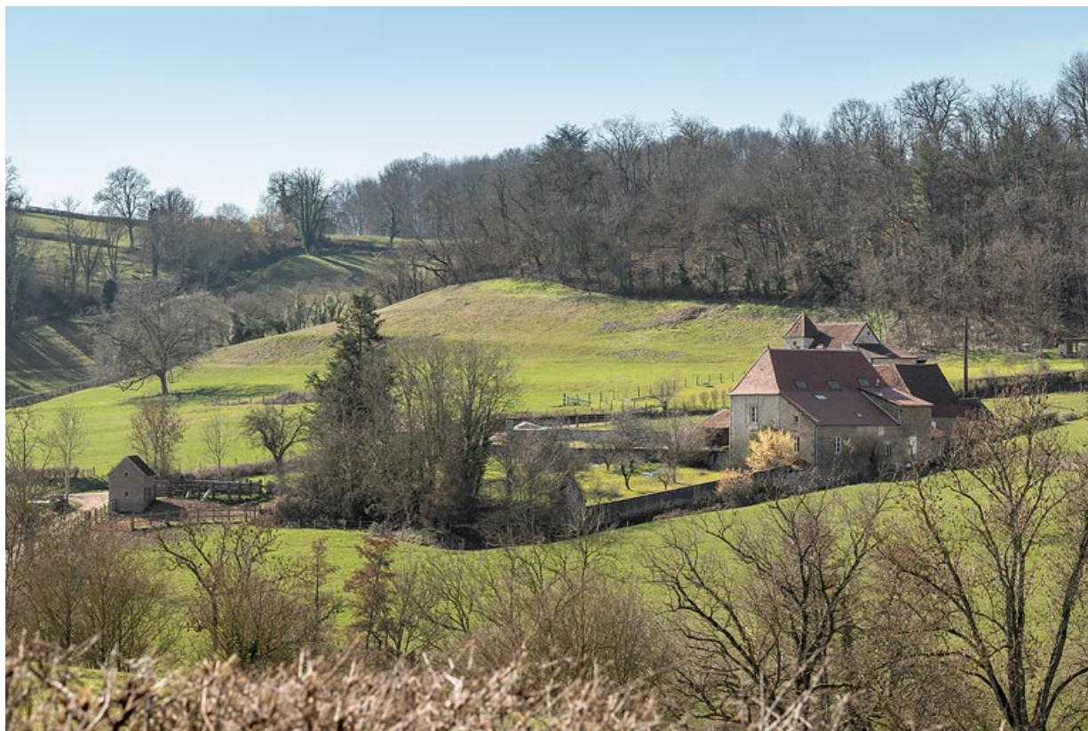
Vue de la ferme, depuis la colline de la Roue, à l'est.