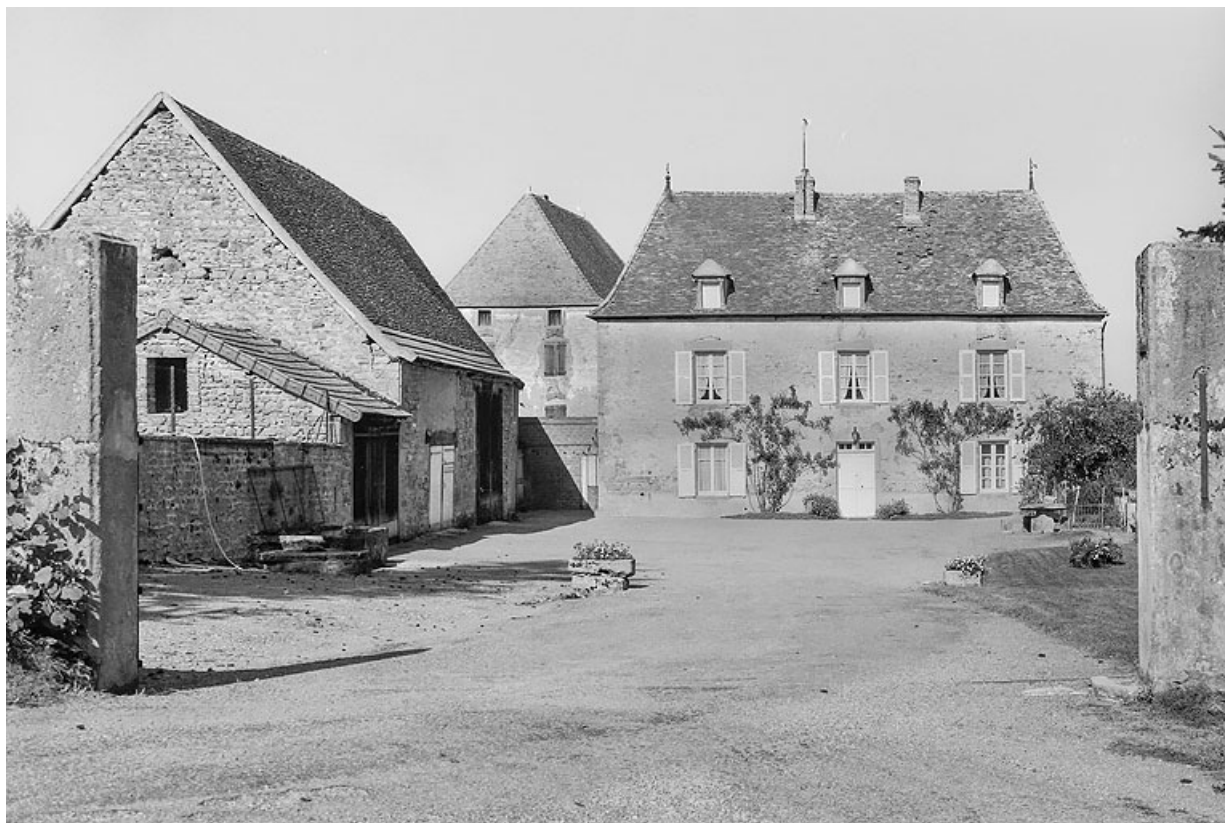
Vue de la ferme vers 1970