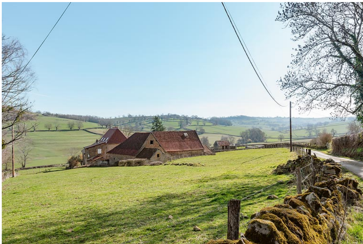
Vue de la ferme depuis la route, en venant de Chaumont. Plusieurs volumes (principalement en appentis) se développent à l'arrière des bâtiments principaux.