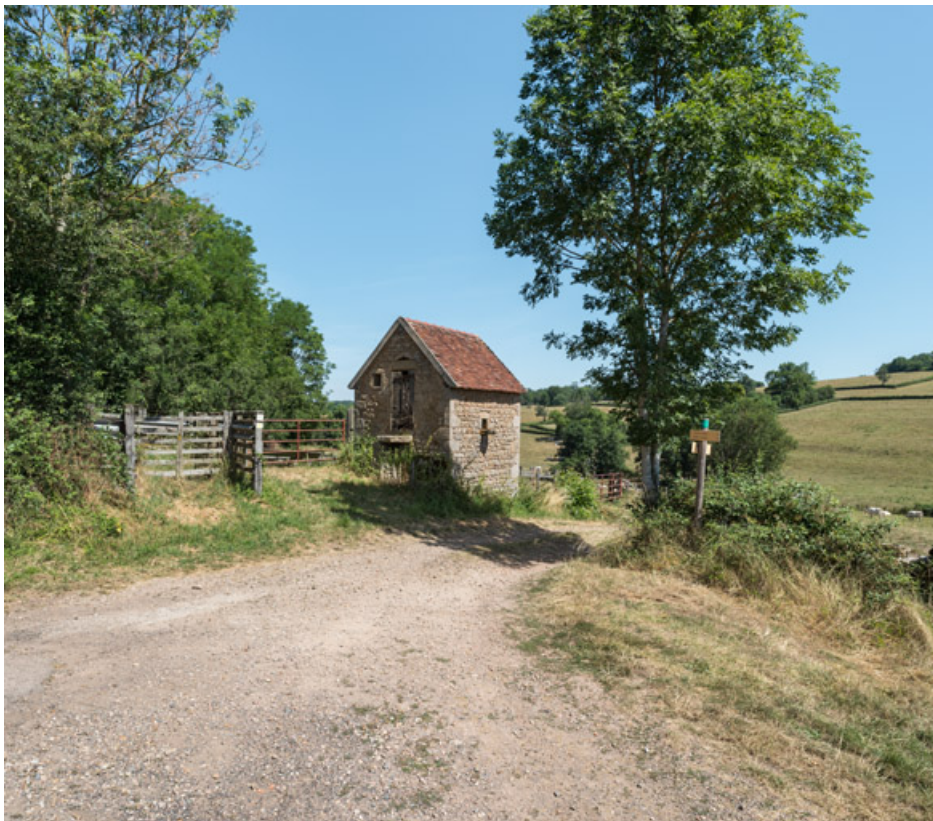
Petit bâtiment, à proximité de la ferme, qui servait peut-être d'abri aux gardes de pré 71, Oyé, lieudit : Orval

N° de l'illustration : 20197100152NUC4AQ