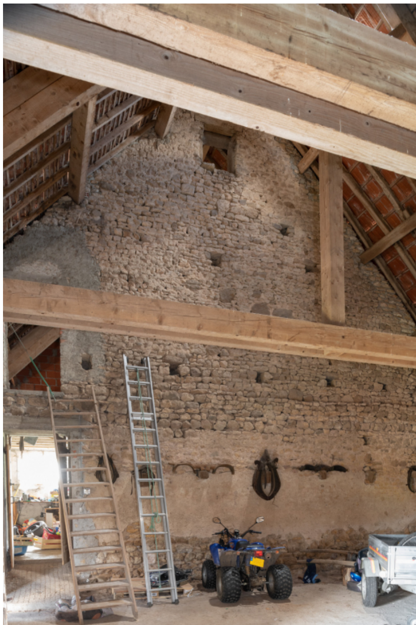
Bâtiment agricole. Mur de refend entre la remise et l'étable.