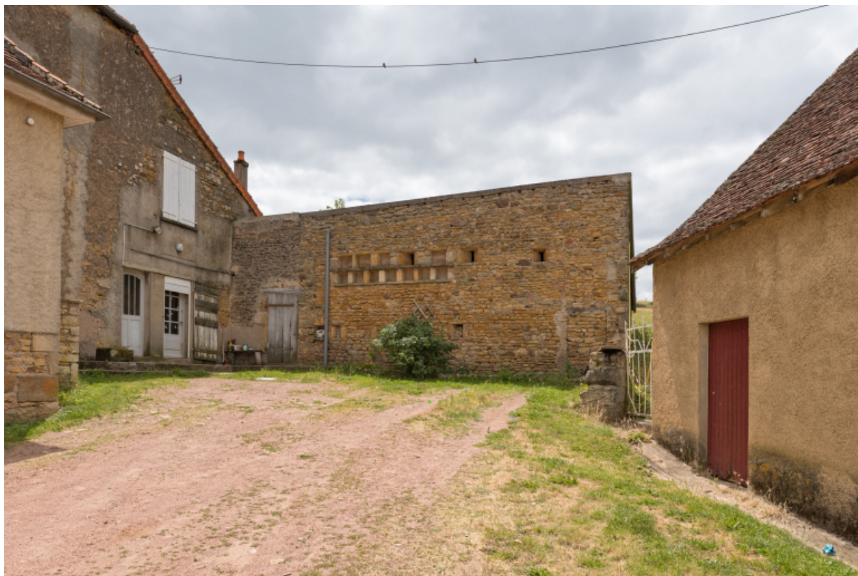
Mur d'une dépendance agricole (soue).