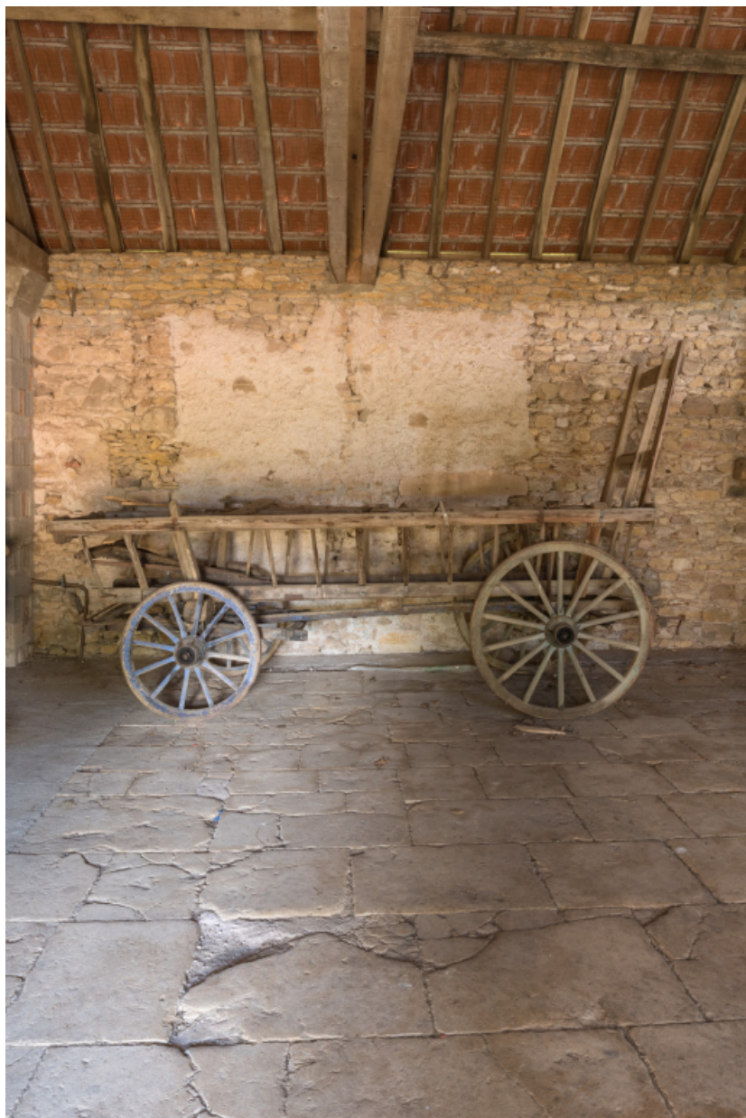
Bâtiment agricole. Char à foin.