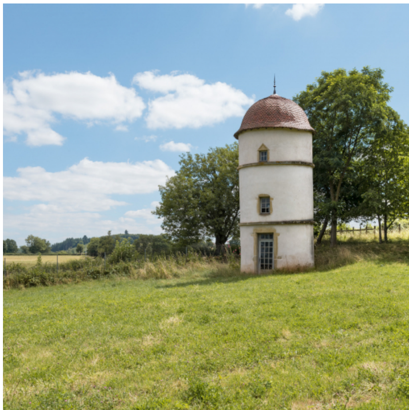
Pigeonnier. Vue rapprochée.