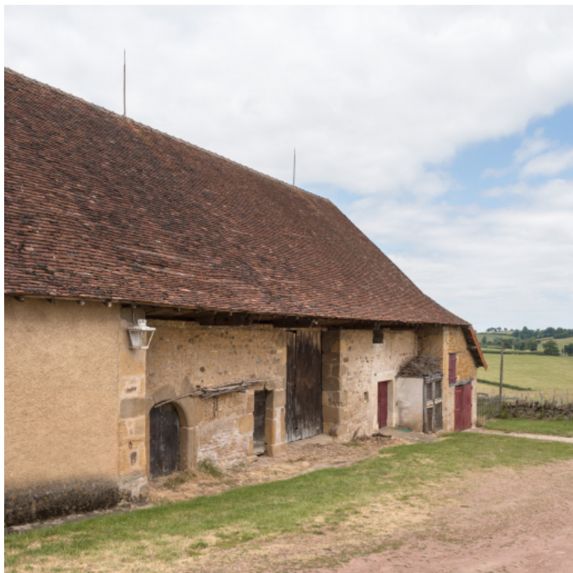
Façade antérieure du bâtiment agricole. Vue de trois quarts gauche. 71, Vareilles, lieudit : Montgiraud