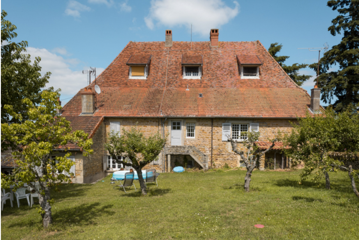
Façade postérieure du logement.