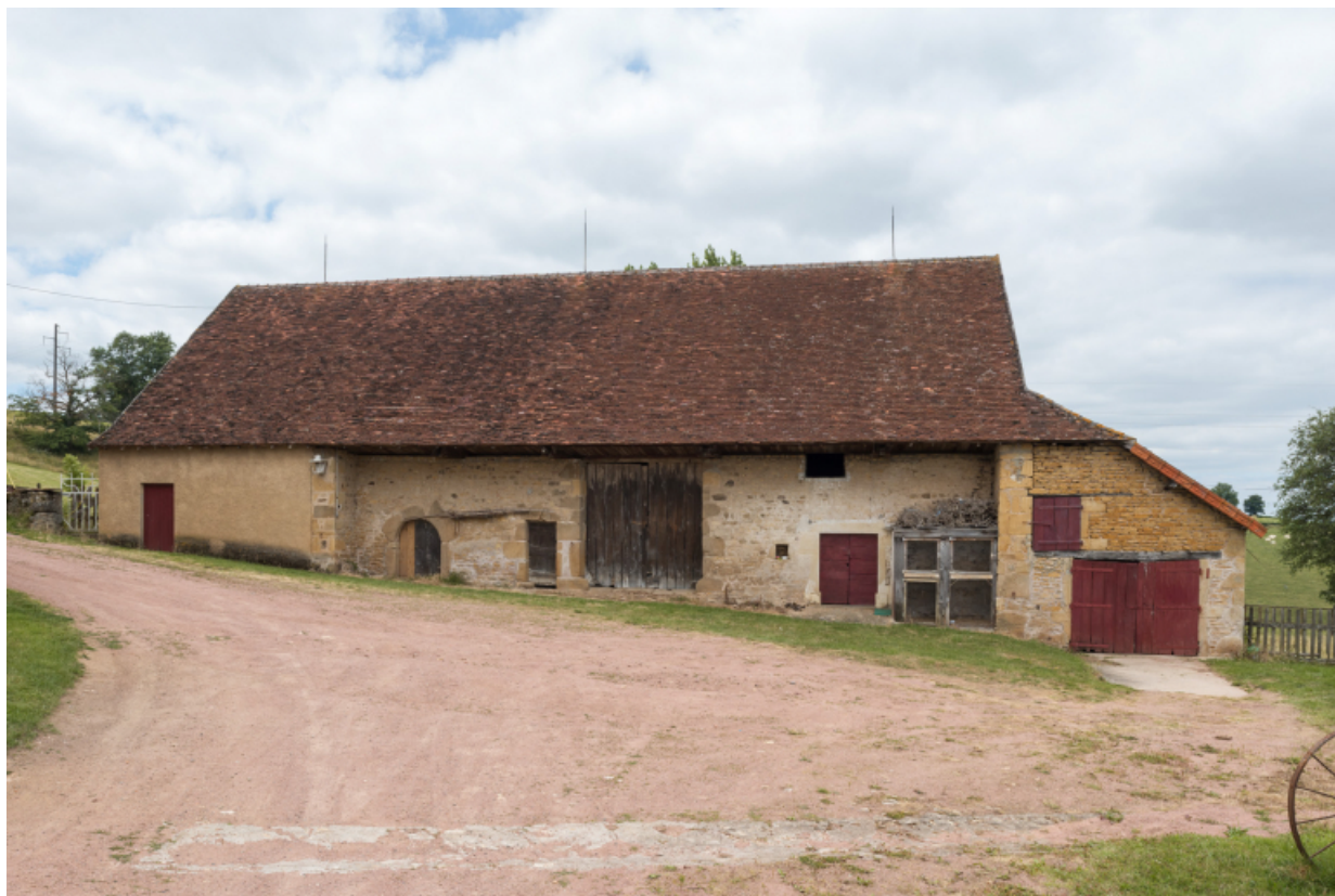
Façade antérieure du bâtiment agricole (étable, remise, fenil).