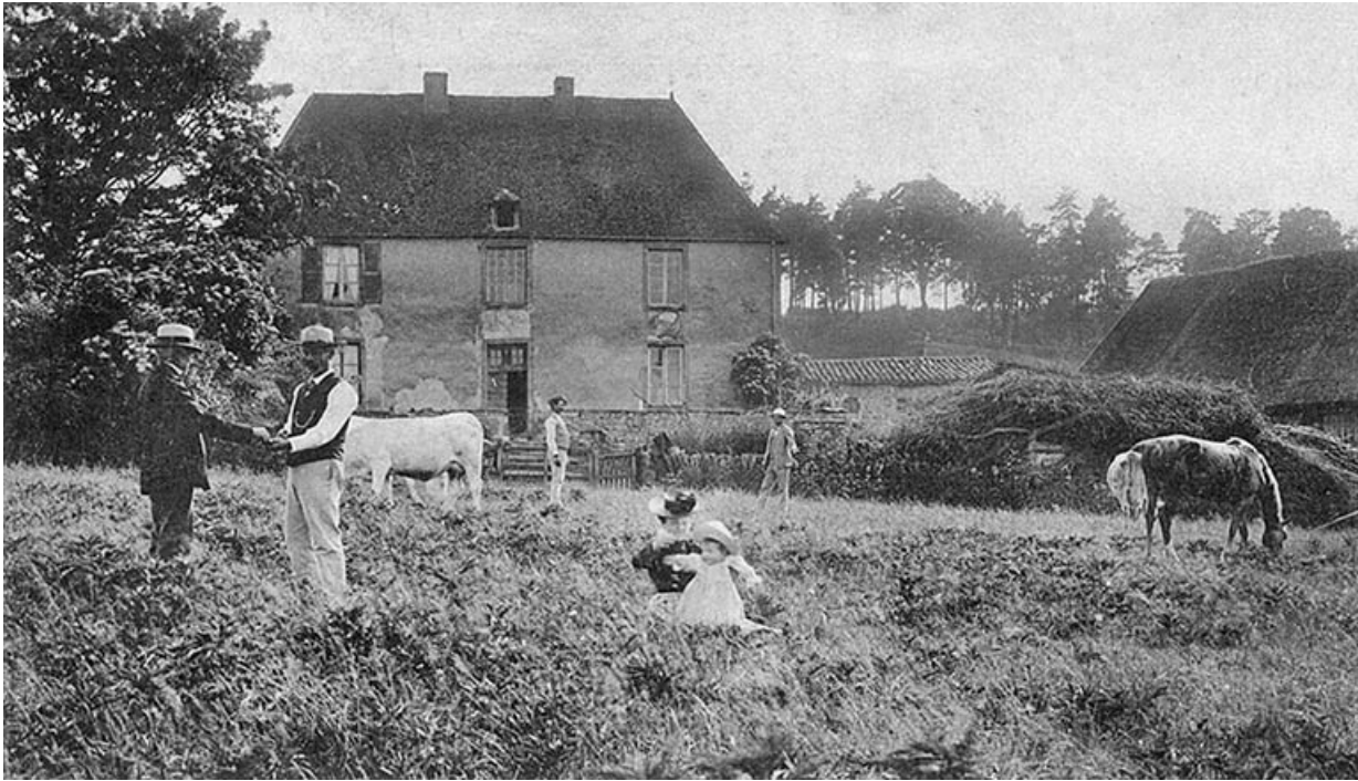
Vue de la ferme de Montgiraud au début du XXe siècle, carte postale, collection privée.