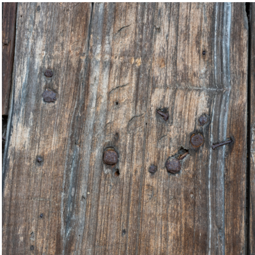
Détail du vantaill de la porte de remise.