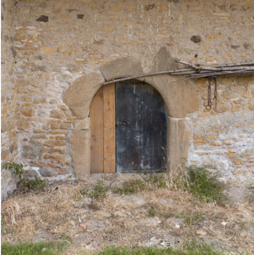
Façade antérieure du bâtiment agricole. Porte cintrée d'une étable.