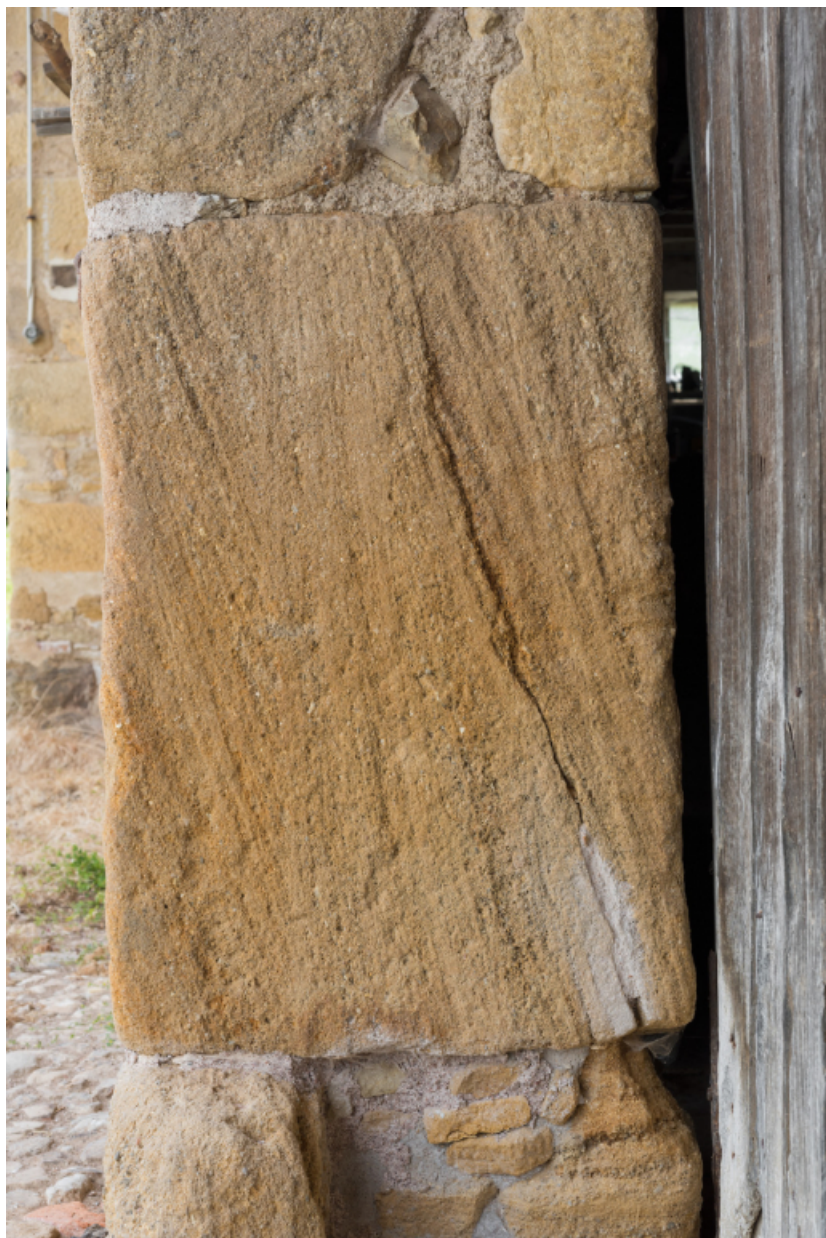
Détail du piédroit de la porte de remise.