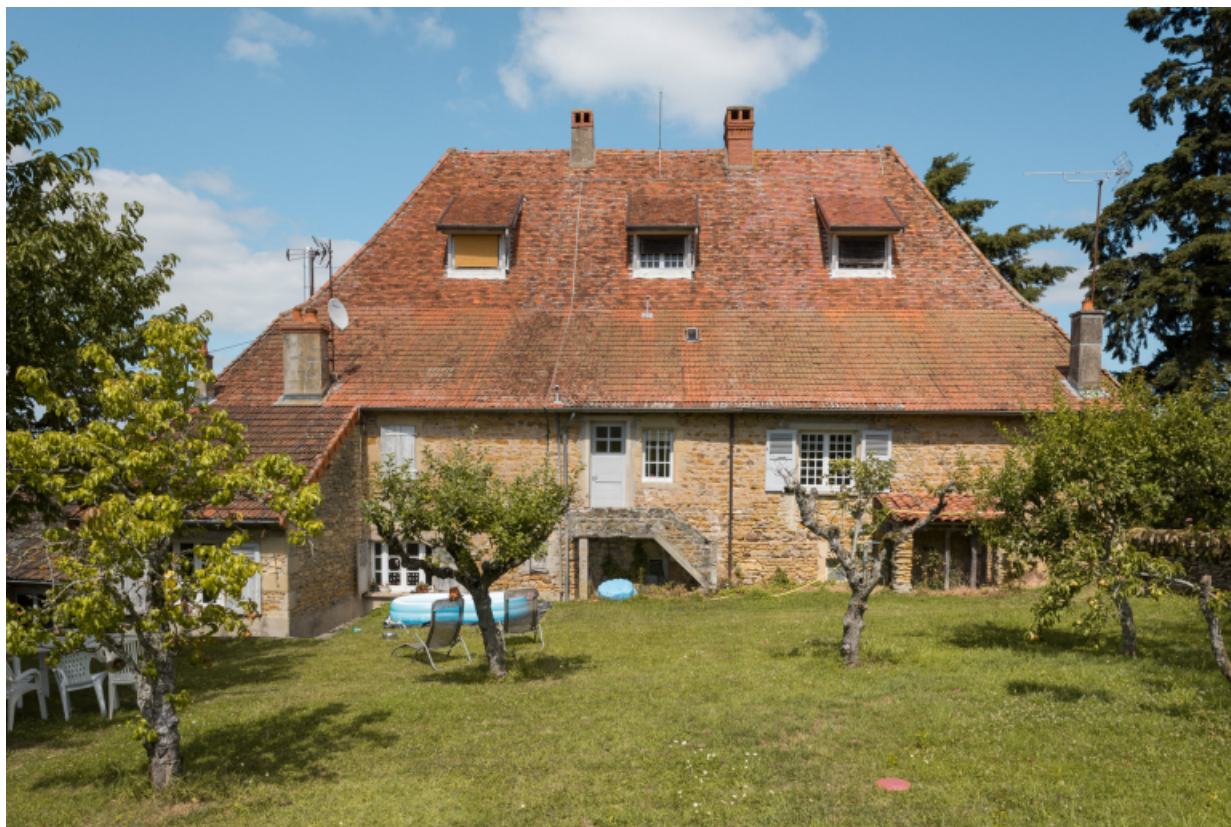
Façade postérieure du logement.