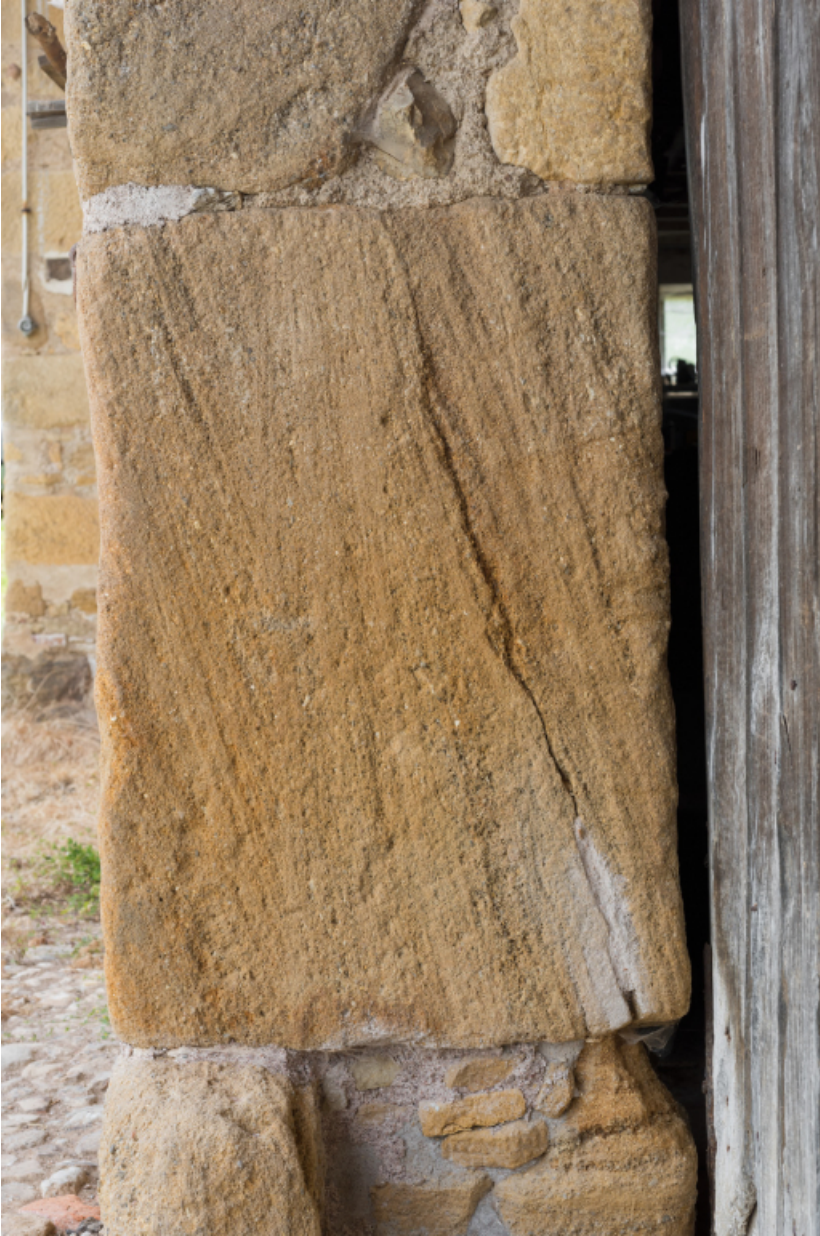
Détail du piédroit de la porte de remise.