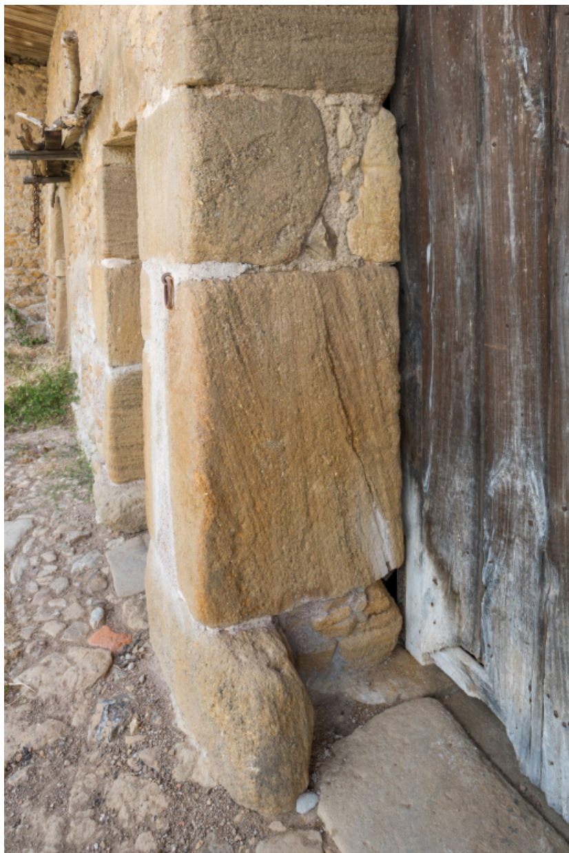
Bâtiment agricole. Piédroit de la porte de remise.