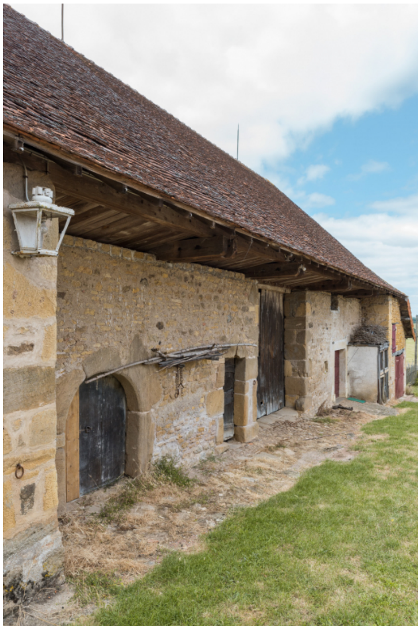
Vue de trois quarts gauche du bâtiment agricole.