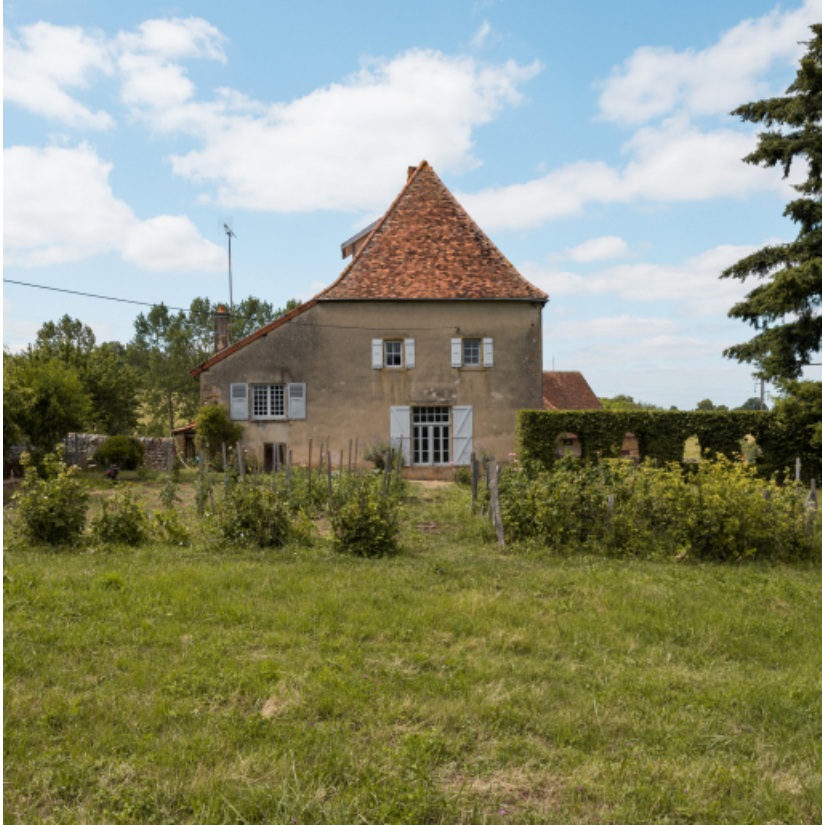
Façade sud du logement.