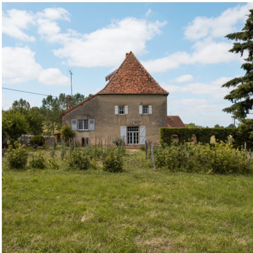
Façade sud du logement.