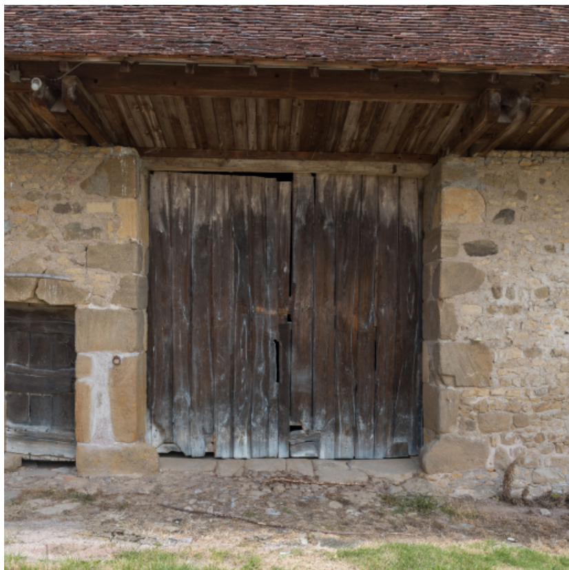
Façade antérieure du bâtiment agricole. Porte de la remise.