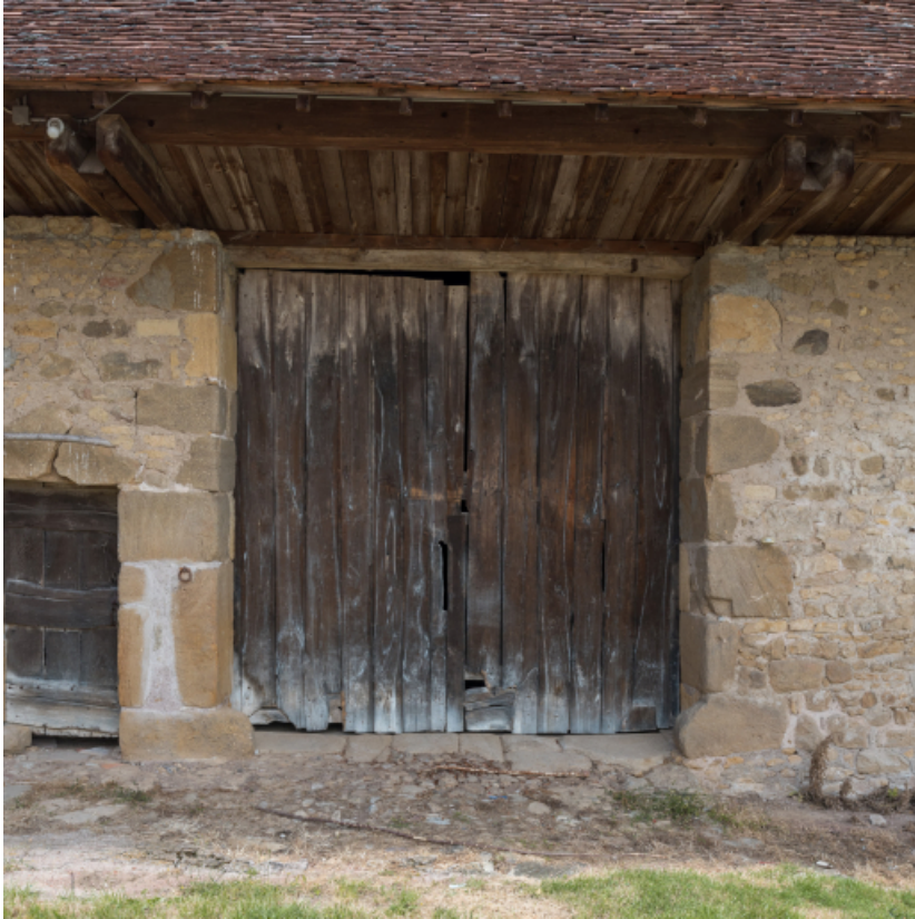
Façade antérieure du bâtiment agricole. Porte de la remise.