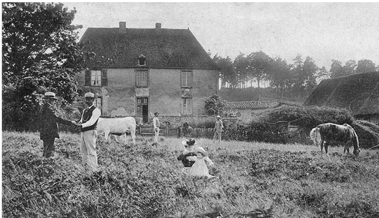
Vue de la ferme de Montgiraud au début du XXe siècle, carte postale.