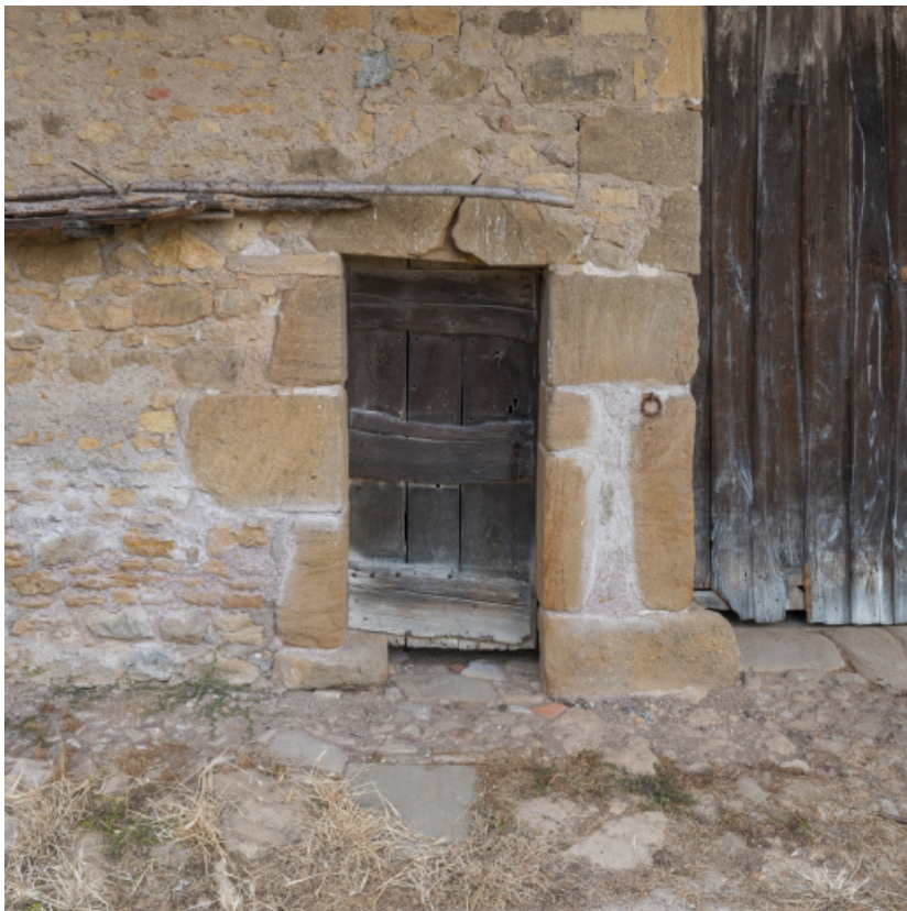
Façade antérieure du bâtiment agricole. Porte piétonne.