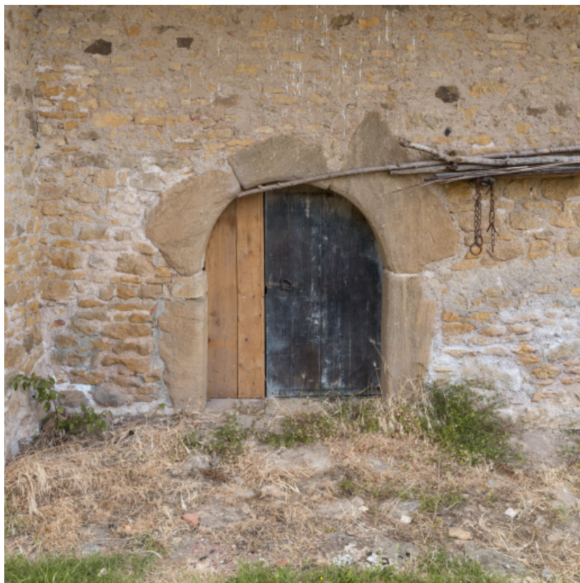
Façade antérieure du bâtiment agricole. Porte cintrée d'une étable.