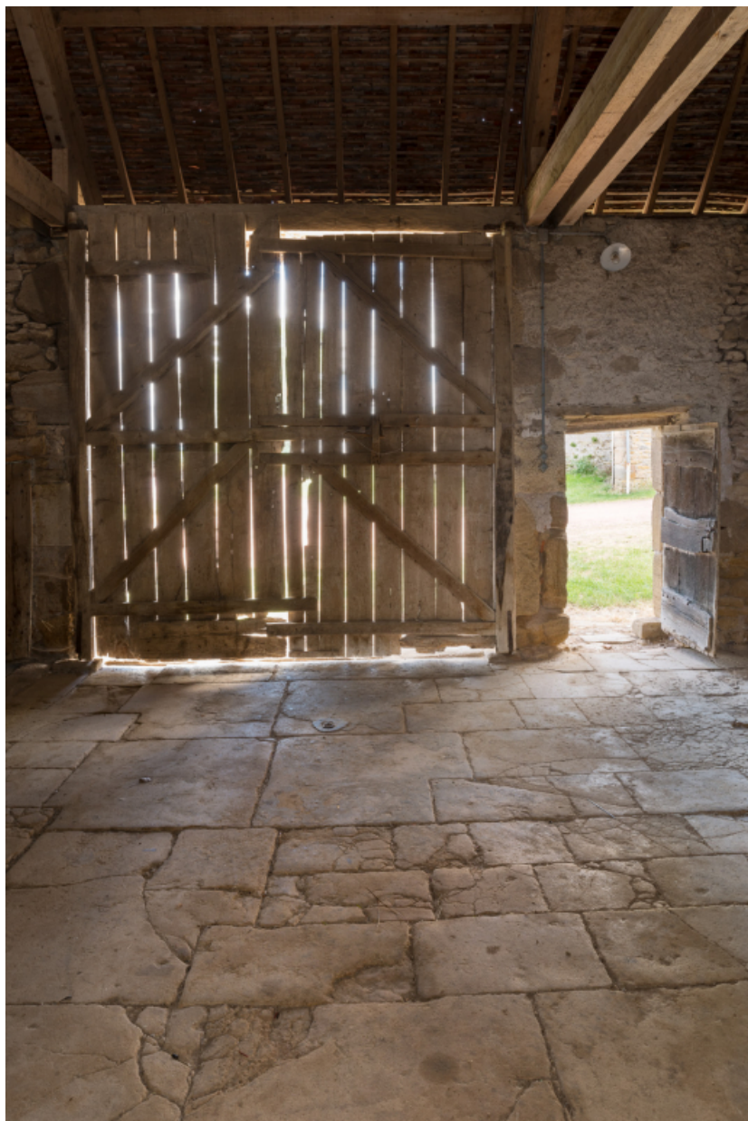
Bâtiment agricole. Vue intérieure de la remise.