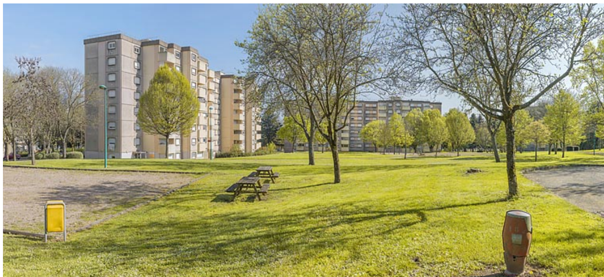
Vue générale de la Cité Harfleur en direction du sud.