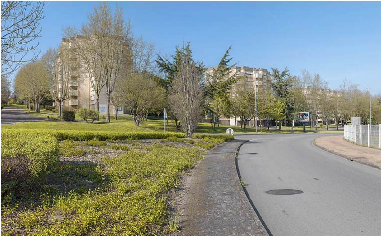
Vue générale de la cité Harfleur depuis l'avenue de Montvaltin. 71, Le Creusot avenue de Montvaltin