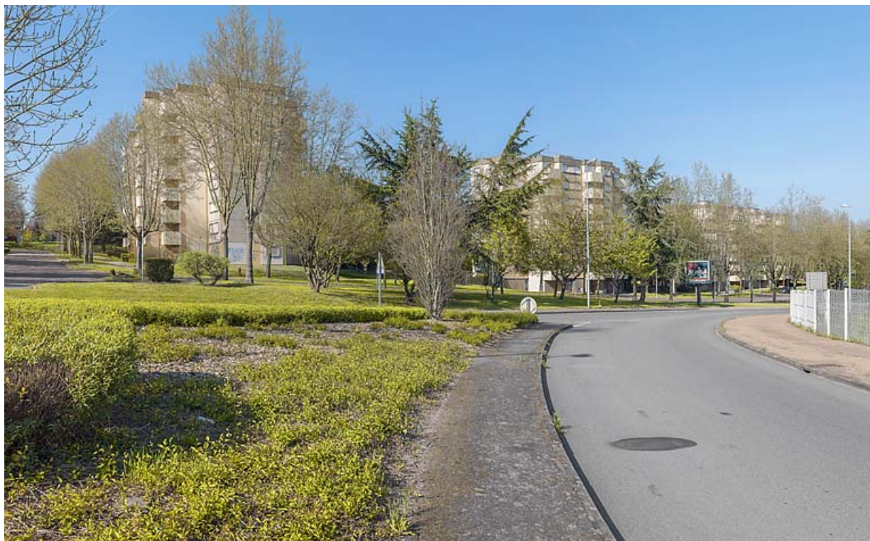
Vue générale de la cité Harfleur depuis l'avenue de Montvaltin.