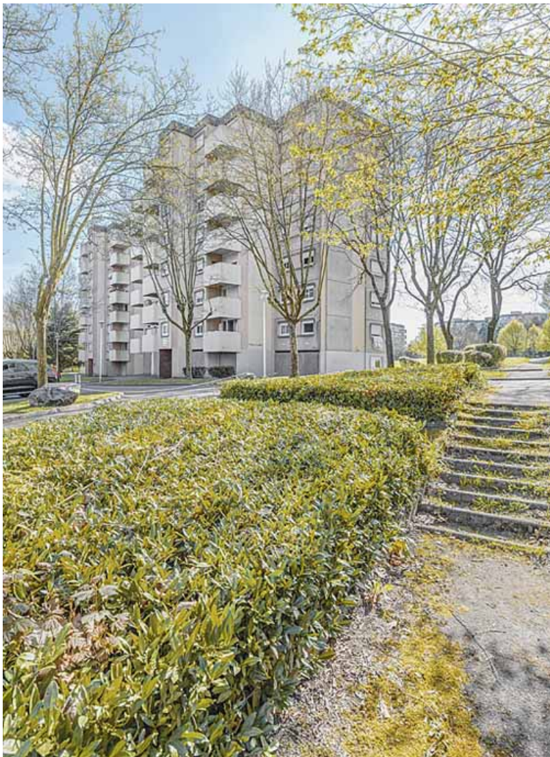
Immeuble modèle régional Redan de la cité Harfleur : façade antérieure et pignon. 71, Le Creusot avenue de Montvaltin