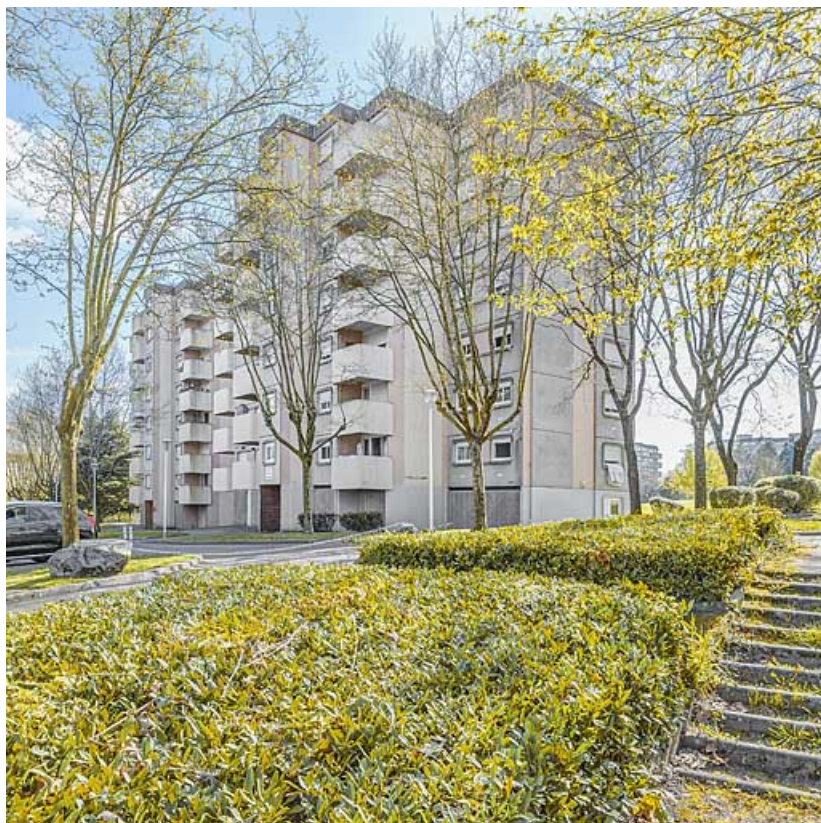
Immeuble modèle régional Redan de la cité Harfleur : façade antérieure et pignon. 71, Le Creusot avenue de Montvaltin