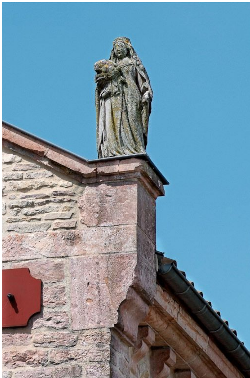
L'élévation de la façade présente une statue de Vierge à l'Enfant en amortissement à droite. 71, Brienne