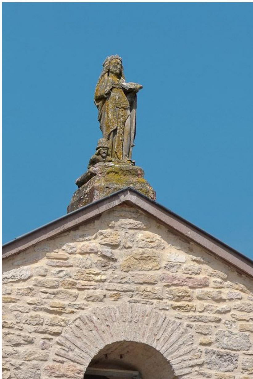
L'élévation de la façade présente une statue de sainte Catherine (?) en amortissement au centre. 71, Brienne