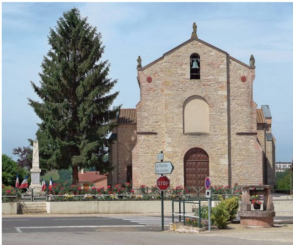
Vue d'ensemble de la façade.