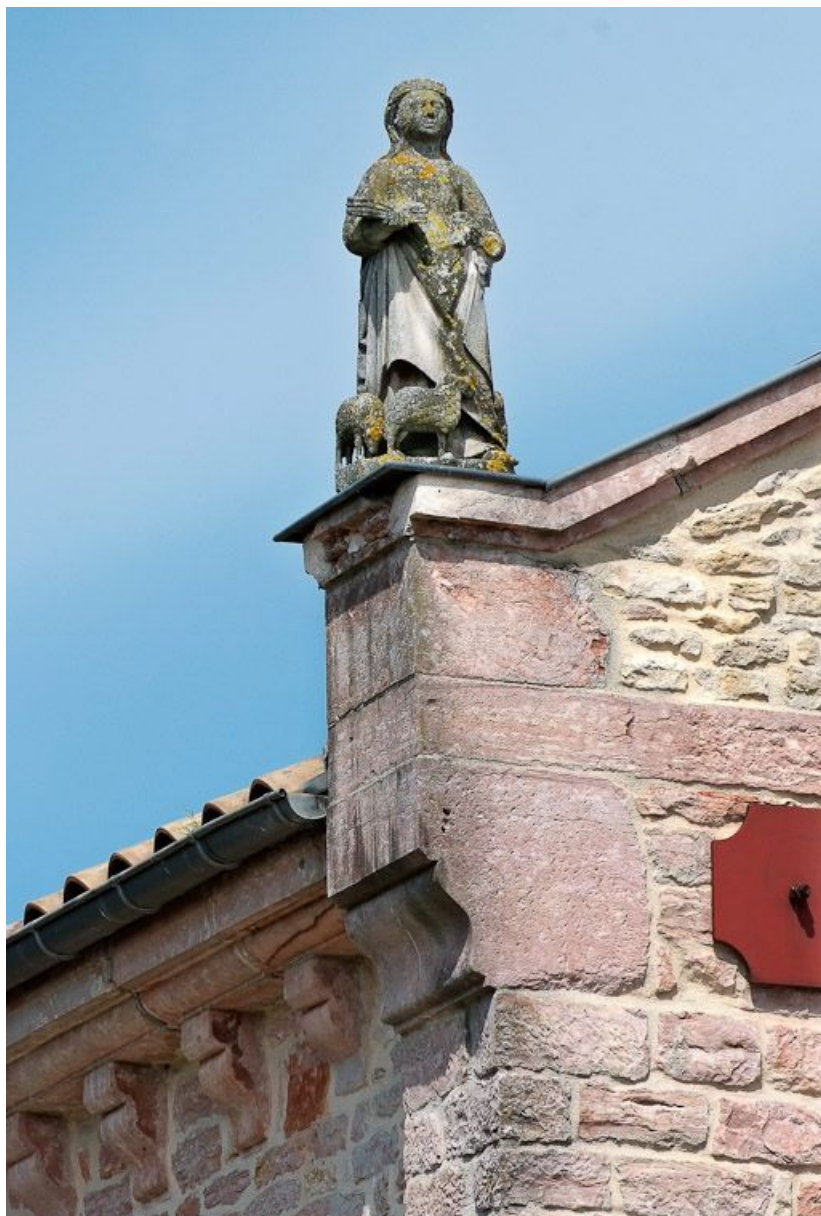
L'élévation de la façade présente une statue féminine (sainte Agnès ?) en amortissement à gauche. 71, Brienne