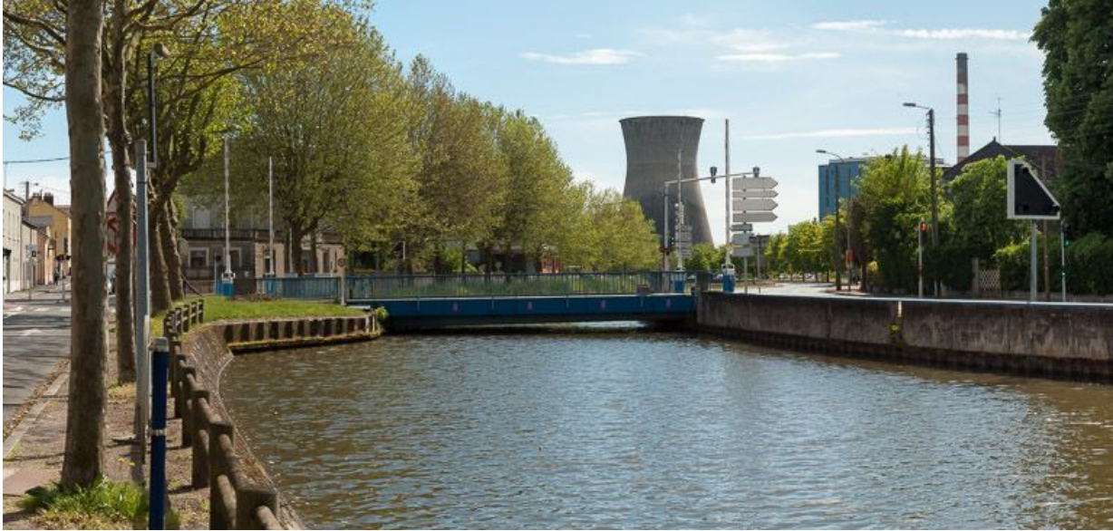
Vue d'ensemble du pont.

N° de l'illustration : 20137100429NUC2AQ