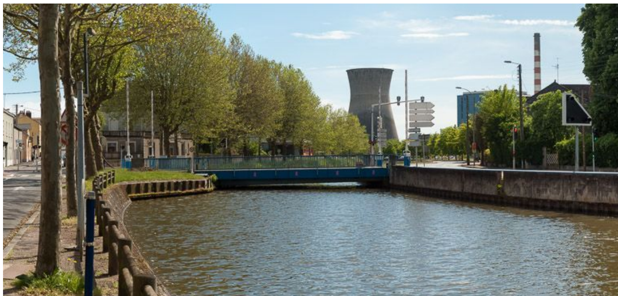
Vue d'ensemble du pont.

N° de l'illustration : 20137100429NUC2AQ