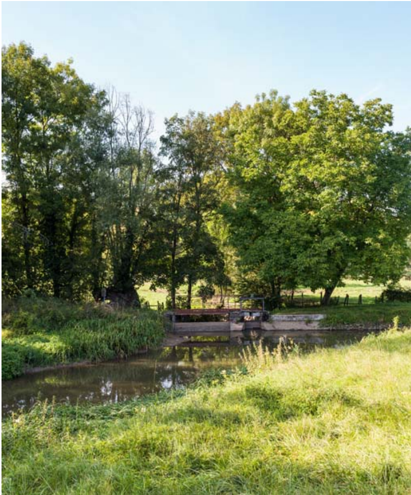
Vue du barrage sur la Dheune, rive gauche.

71, Saint-Gilles, lieudit : bief 23 du versant Saône-Méditerranée