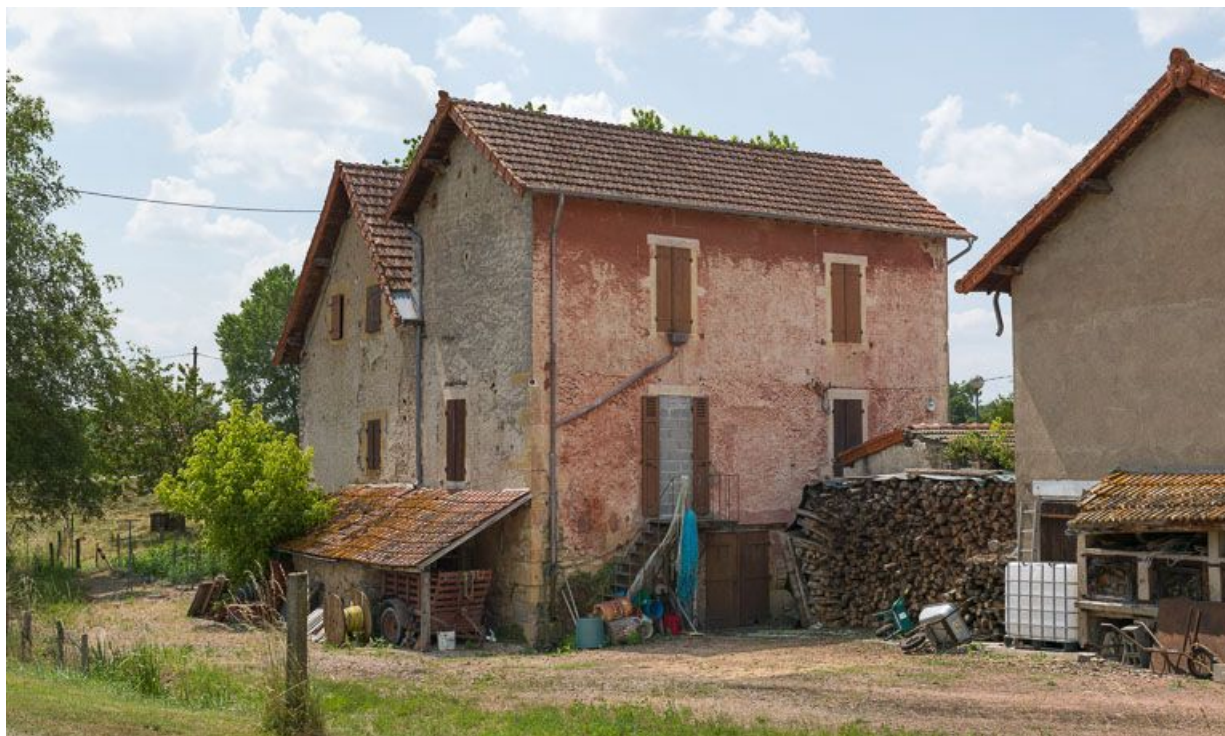
Façades postérieures de la maison éclusière et de la maison pour un garde.

71, Volesvres, lieudit : bief 21 du versant Loire-Océan