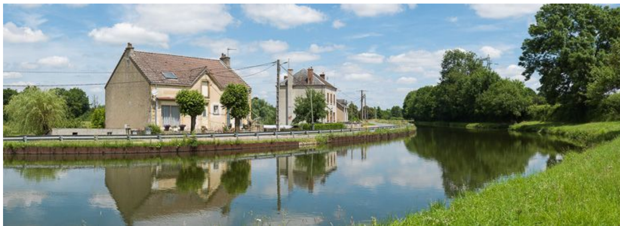
En amont du site, rive droite, vue de l'ancienne boutique double.

71, Palinges, lieudit : bief 17 du versant Loire-Océan