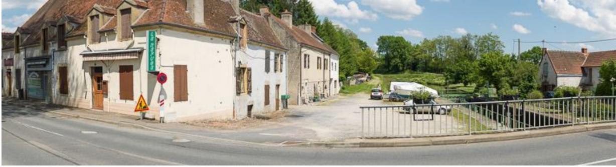
Vue depuis le pont sur   cluse. A droite, on aper  oit la maison   clusi  re.

71, G  nelard, lieudit : bief 16 du versant Loire-Oc  an