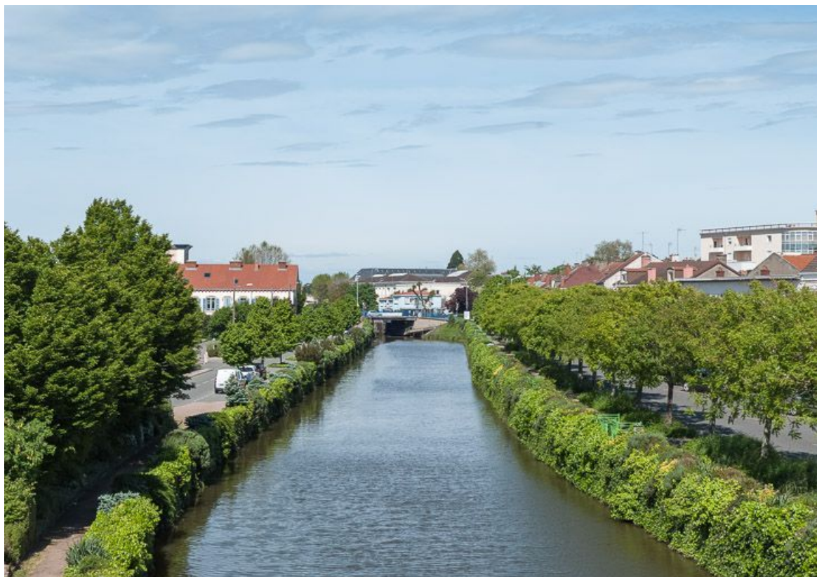
Vue générale de la ville de Montceau, on aperçoit les toits de l'hôpital.

71, Montceau-les-Mines, lieudit : bief 10 du versant Loire-Océan