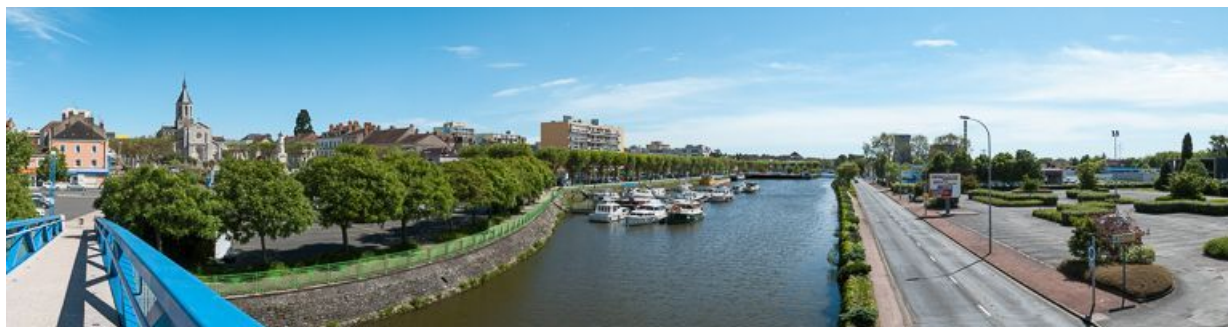
Panorama de la ville de Montceau, de gauche à droite : l'église, le pont mobile et au fond la centrale électrique de Lucy. 71, Montceau-les-Mines, lieudit : bief 10 du versant Loire-Océan

N° de l'illustration : 20137100424NUC4AQ