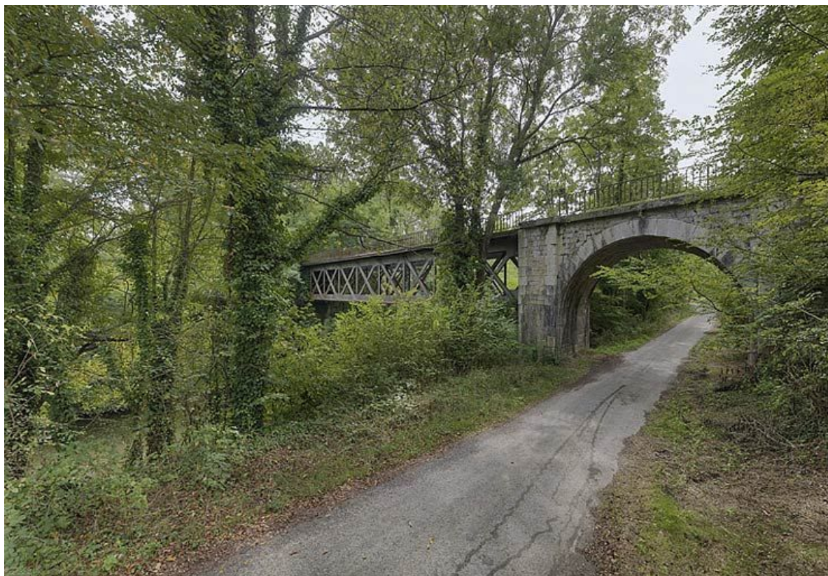
Le pont ferroviaire, avec une partie en maçonnerie enjambant le chemin de halage et une partie en métal enjambant le canal.